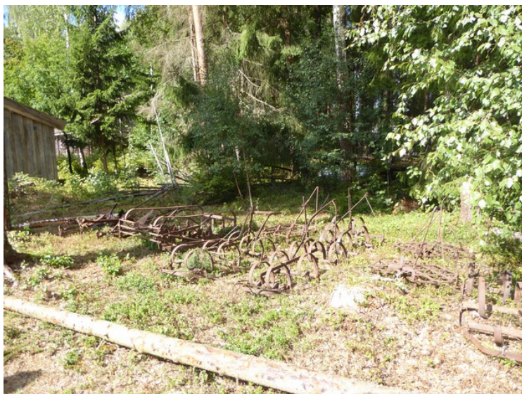
Gamle harver og ploger.