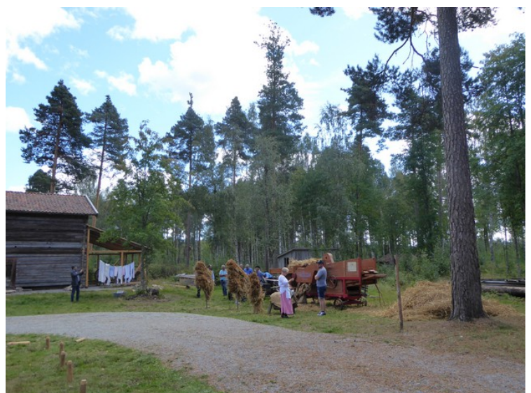
De som jobbet her hadde tidsriktige gamle drakter.