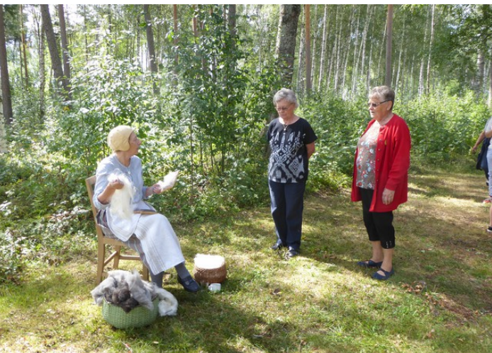
Karding av ull.