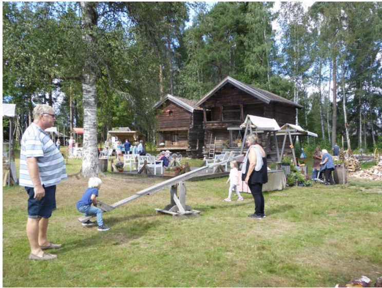
Det var lekeapparater for ungene.