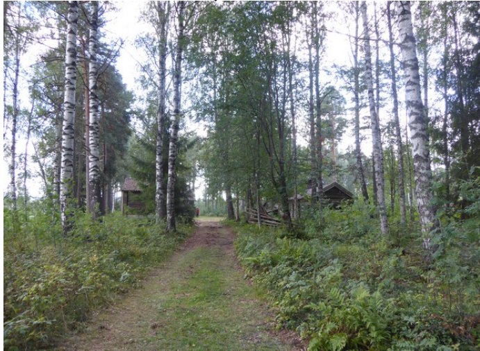
Veien bort til husmannsplassen.