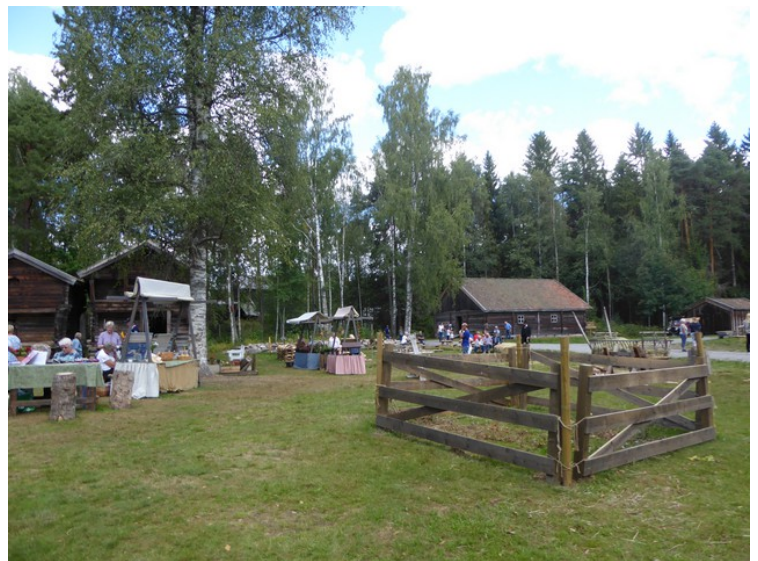
Farmen 2018 har markeds plass her. Farmen 2018 blir spilt inn på Gjedtjernet gård i Grue. Huset bak til venstre er en såkalt svalgangsbygning fra ca. 1800. Den er fredet.