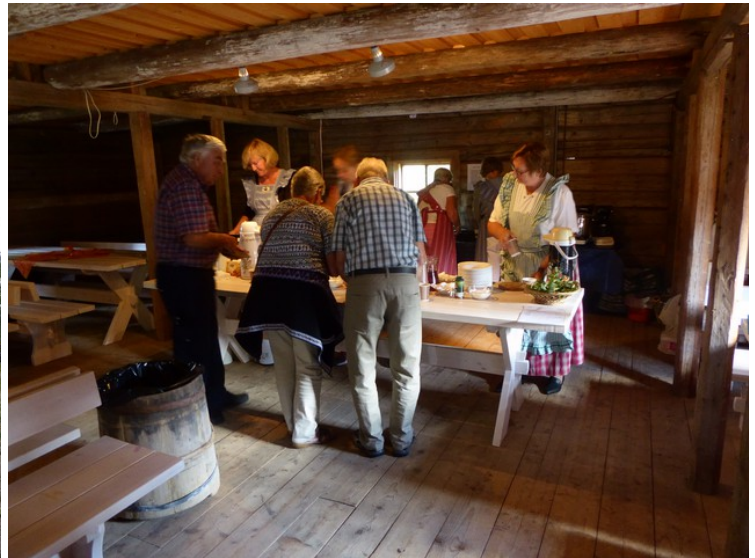
Så var det tid for kaffe og vafler.