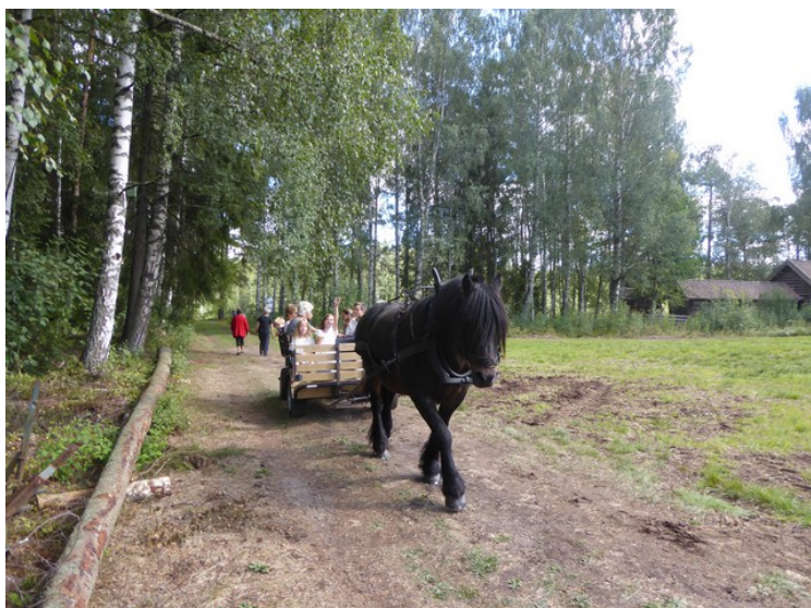
Hesten gikk hele tiden.