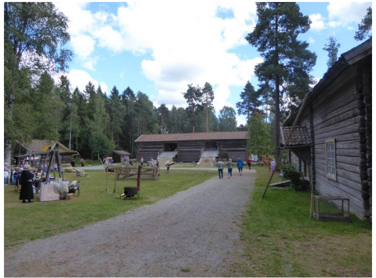
Det var mye folk inne på området.