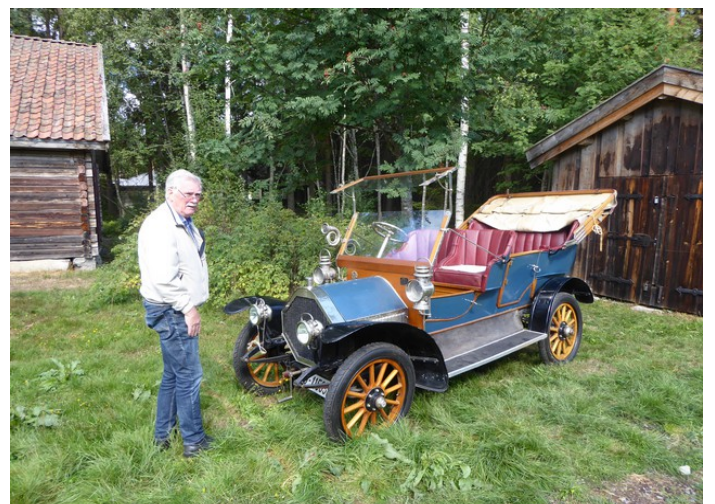
Jeg måtte ta en kikk på bilen.