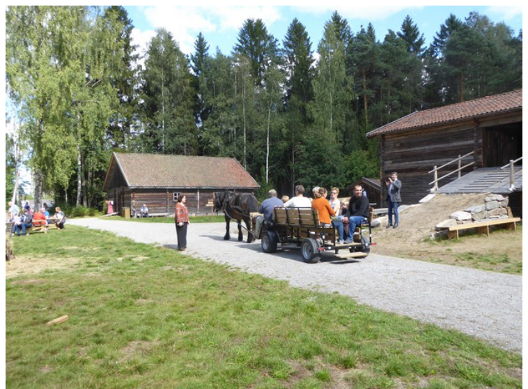
Hesten gikk hele dagen Det var et populært tiltak.