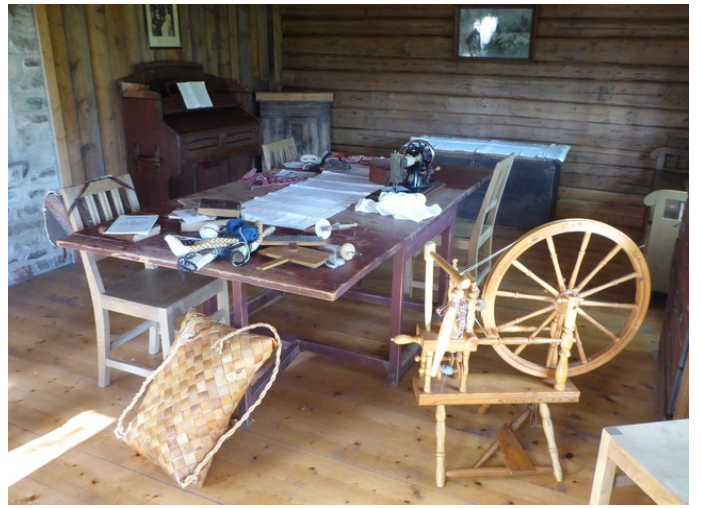
Bilder inne fra stua.