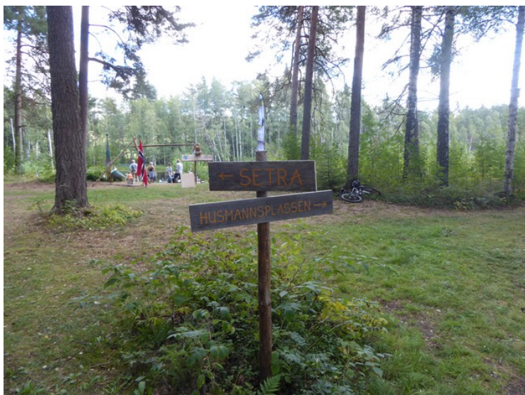
Skilt som viser til husmannsplassen og til setra.