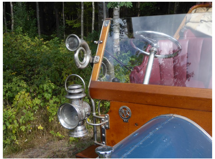
Den er fra omtrent 1910.