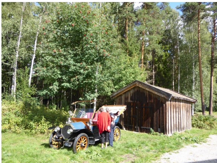
Det sto en gammel bil her.