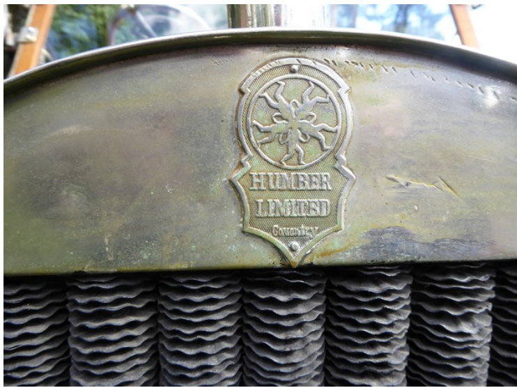
Det var en Humber.