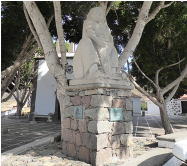
Statue utenfor kirken.