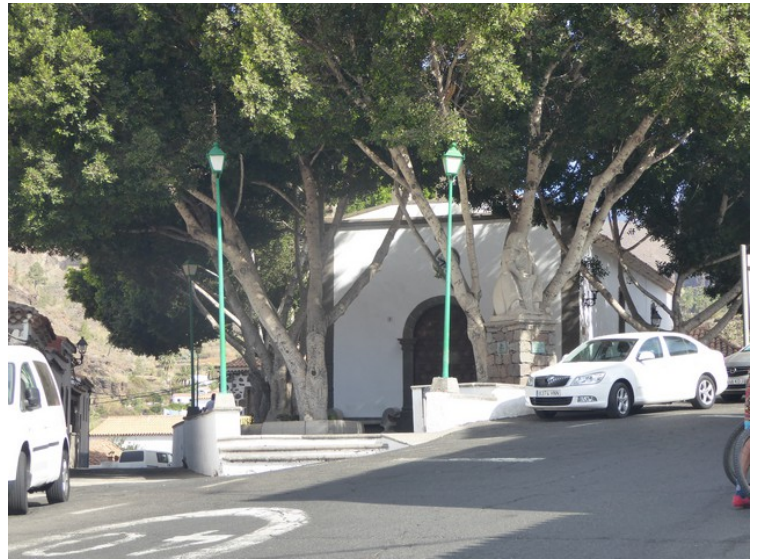
Plassen ved kirken.

Fataga ligger ca 608 meter over havet og antall innbyggere er 370. Canariposten . Det er flere butikker og restauranter her.