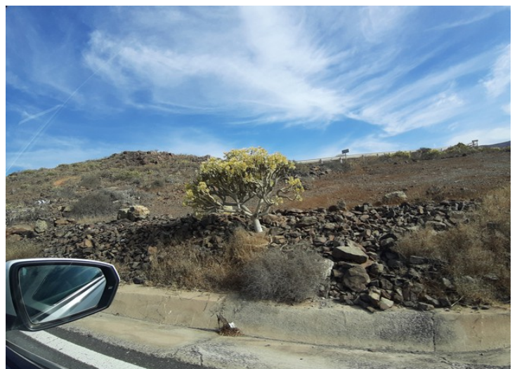
Noen bilder av naturen underveis.