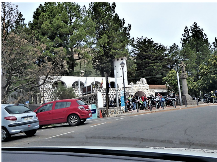
Her kommer vi til Cruz de Tejada.