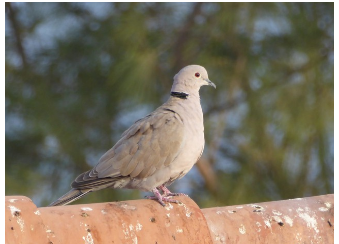
Denne dua var utenfor mange ganger hver dag. Den drakk ofte vann fra bassenget.