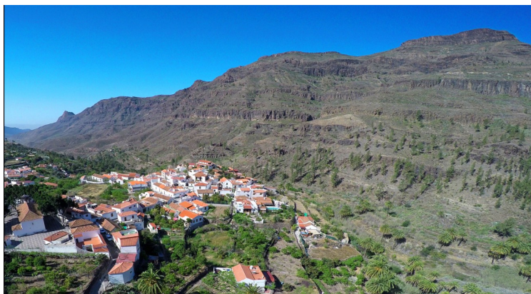
Utsikt fra veien ned mot Fataga.

Veien videre går gjennom kupert og steinete landskap. Veien er svingete og til tider smal, men med veldig bra standard ellers.