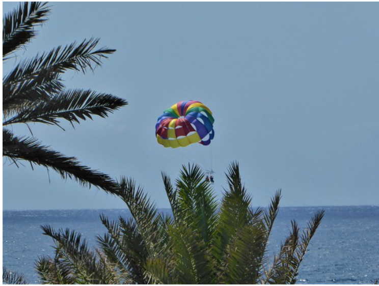
Her er de oppe.