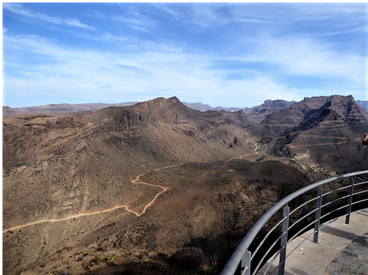
Det går en vei nede i dalen også.