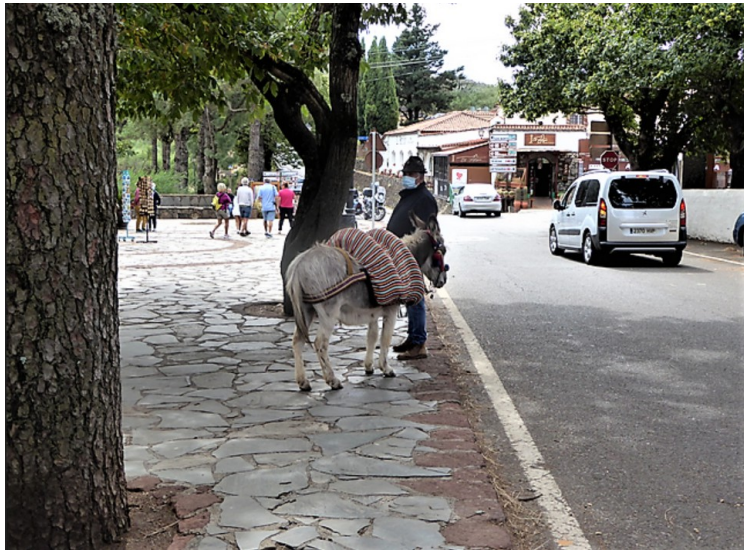
Her er det en mann som tilby unger å ri på eselet.