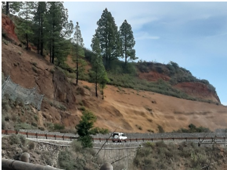
Dette er veien videre.