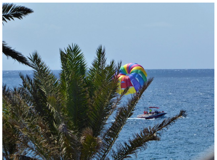
Her er noen som er i ferd med å bli dratt opp på parachuting.