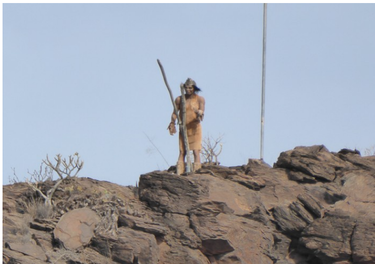
Her er den.