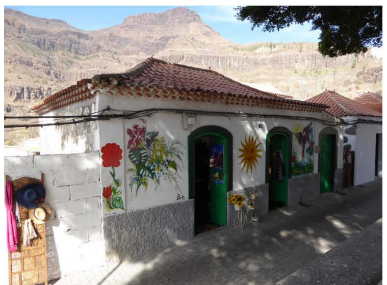
Butikk for kunsthåndverk.