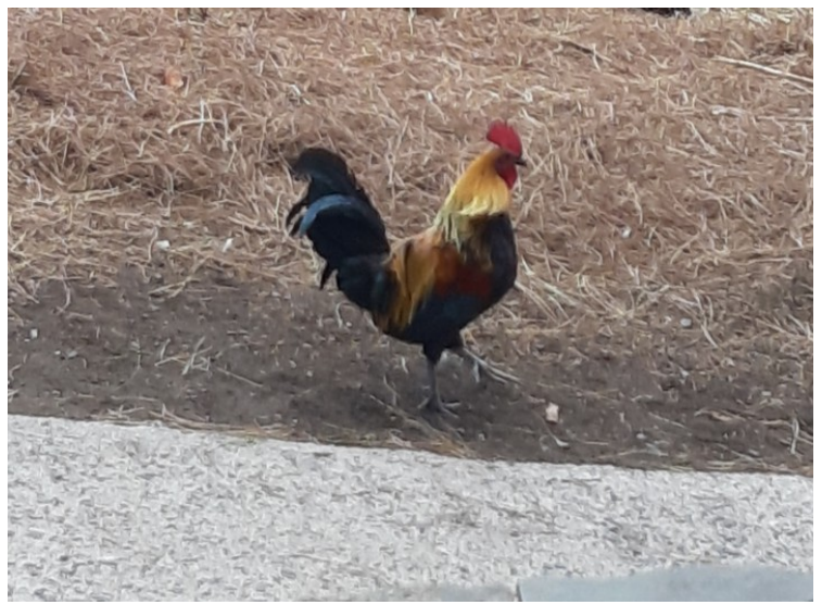
Her er hanen ute og spaserer.

Cruz de Tejada ligger i et fjellpass 1580 meter over havet. Plassen har fått navn etter en skulptur som kalles «Cristo de Piedra» (Kristus av stein).