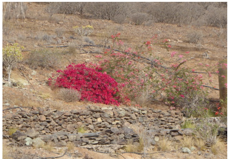
Her var også en busk med veldig røde blomster.