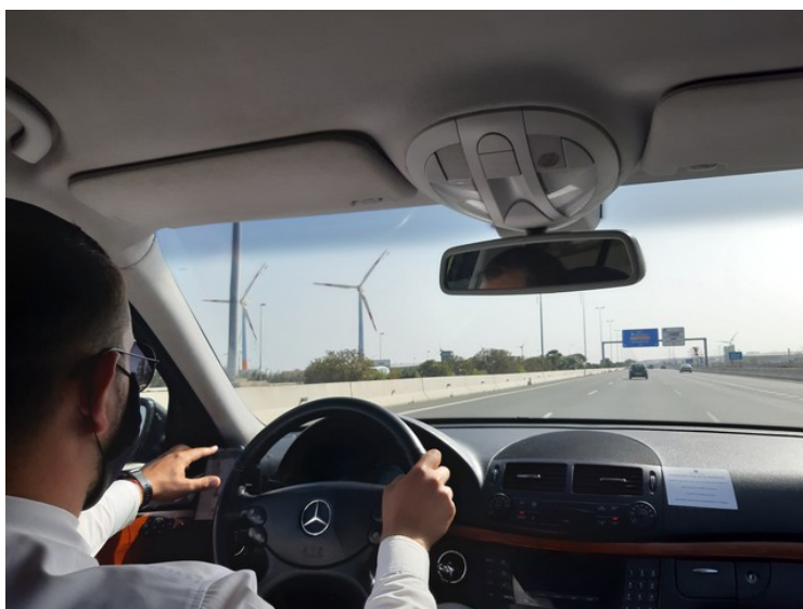
Her sitter vi i taxien fra flyplassen til hotellet.

Vi hadde bestilt taxi på nettet hos et firma som heter Suntransfers . Når vi har bestilt transfer før, så har sjåføren stått og ventet på oss i ankomsthallen med navnet vårt på en plakate eller på en tablet. Vi fant ingen, så vi måtte gå og lete.