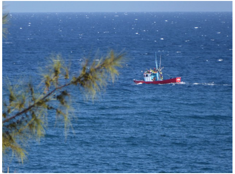
Denne fiskebåten så vi hver dag.