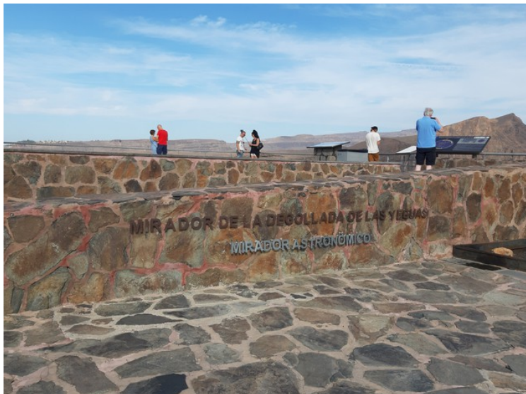
Anne Berit har fått meg med på bildet mens jeg tar bilde av plakaten.