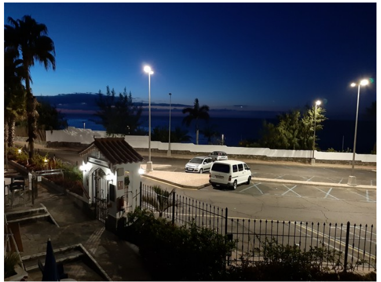
Inngangen om kvelden.