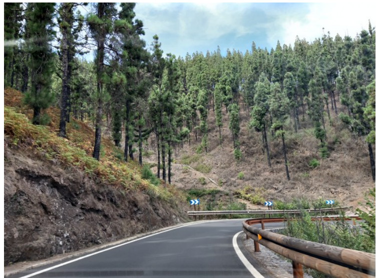
Her er vi på nordsiden av øya. Det er normalt litt mer regn her og dermed litt frodigere enn på sysiden.