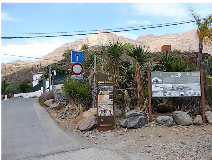
Her er vi kommet til sted som heter Arteara. Det var ikke lov å kjøre lenger enn hit.