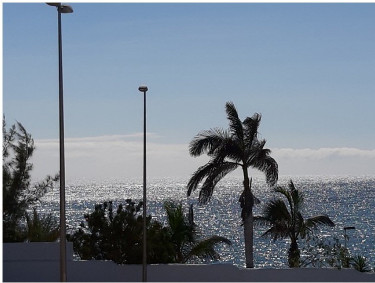
Utsikt fra terrassen utover havet.