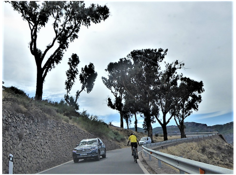
Her går veien videre.