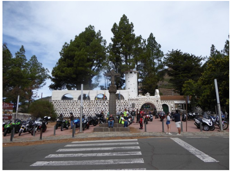
Dette er paradoren.