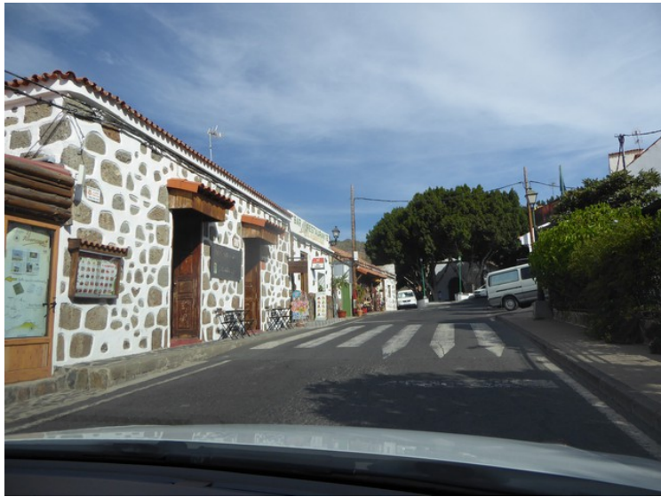
Her kommer vi til Fataga.