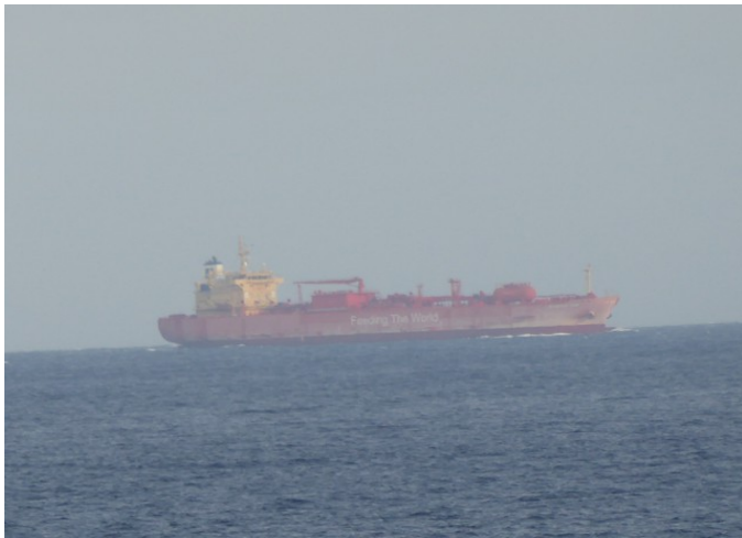
Vi så bare en stor båt mens vi var der. Den gikk langt ute på havet.