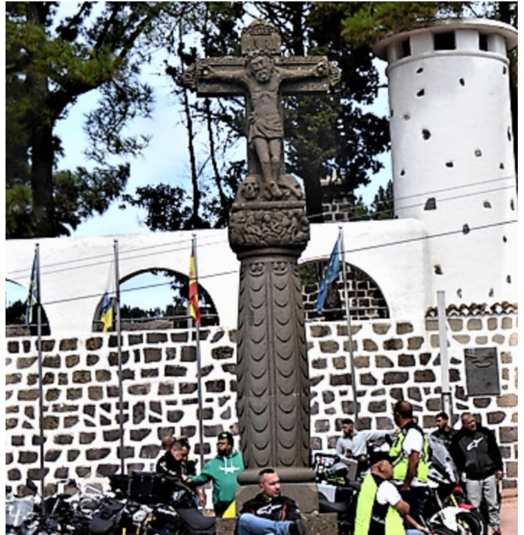
Dette er skulpturen.