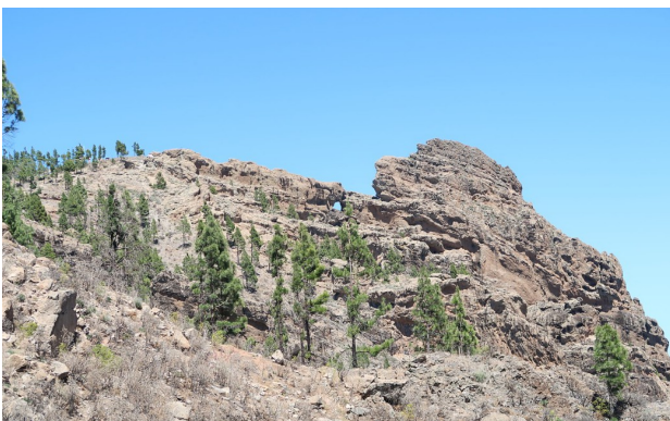
Morro de la Agujereada

Ved siden av står den mindre Roque Rana («Froskeklippen»).