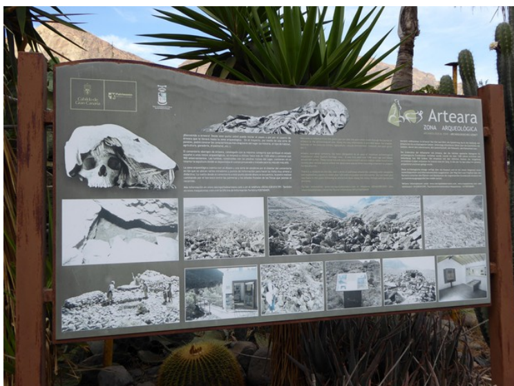
Skiltet som ønsker velkommen til Arteara og som forteller i korte trekk om Arteara.