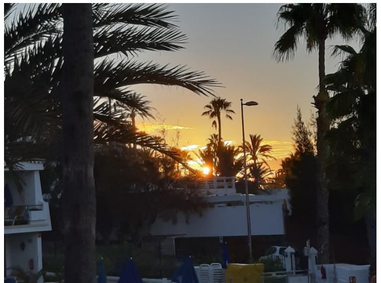
Noen kveldsbilder og morgenbilder tatt fra terrassen.