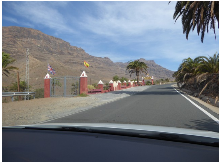
Her kjører vi videre.