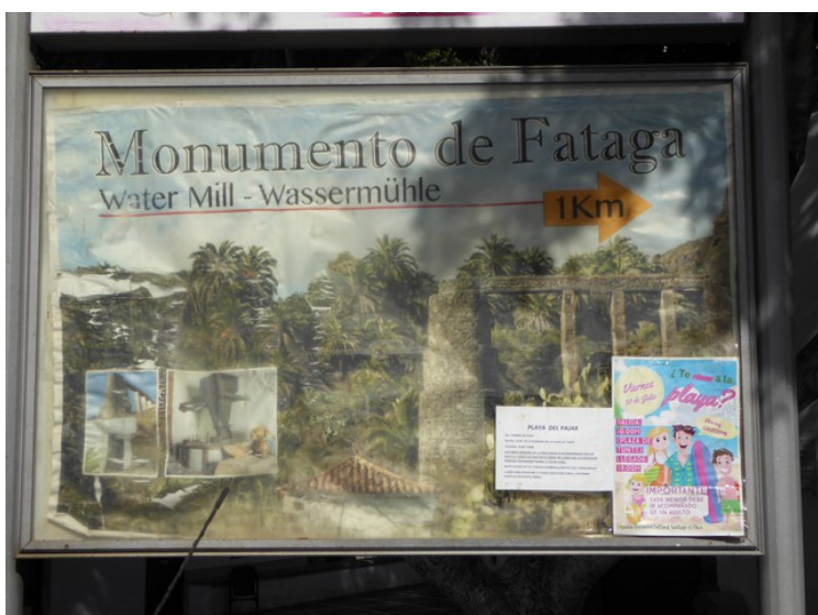
Det skal være rester av en gammel vannmølle her, men vi gikk ikke så langt. Den ligger et godt stykke lenger opp i dalen.