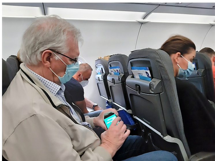
Her sitter jeg på flyet. For å få tiden til å gå legger jeg kabal på mobilen.

Vi kjørte til Gardermoen den 2. oktober og satte bilen fra oss på Dalen Parkering . Dalen Parkering har buss som kjører til og fra flyplassen. På flyplassen var det lang kø i innsjekkingen hos Apollo. Flyet gikk fra Oslo Lufthavn Gardermoen etter planen klokka 11.10. Det var SAS som var chartret av Apollo for denne turen.