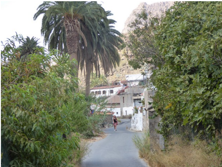
De innerste husene i Arteara.