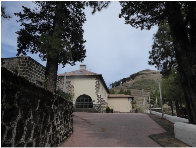
Gårdsrommet til paradoren.