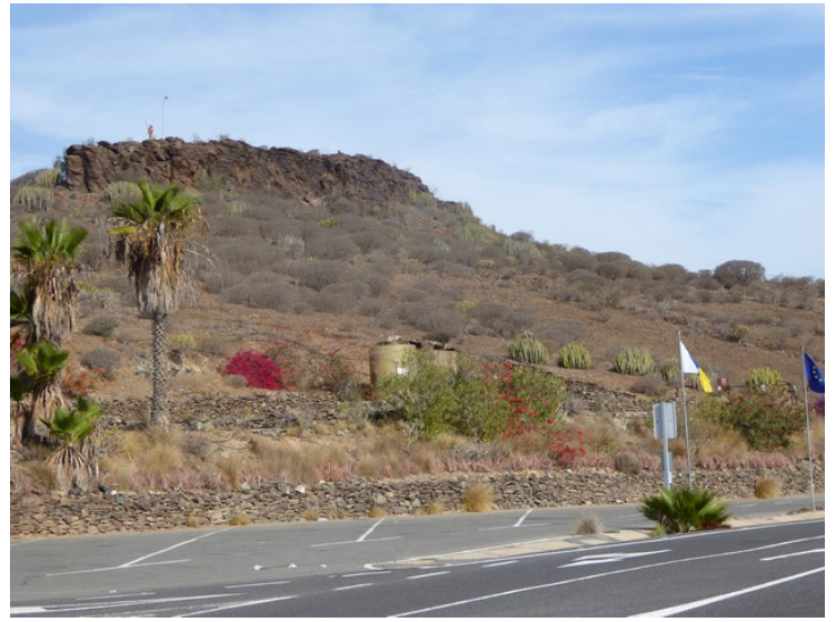
Underveis så vi denne figuren på fjelltoppen.