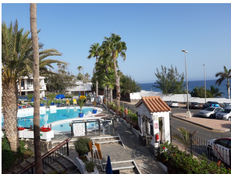
Dette bildet er tatt fra balkongen.