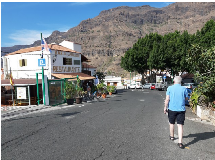
Her har vi funnet en plass å parkere og er på vei ned mot kirken.

Fataga ligger ca 608 meter over havet og antall innbyggere er 370. Canariposten . Det er flere butikker og restauranter her.