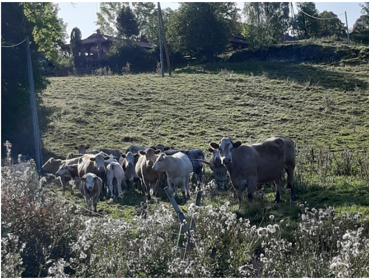
På vei opp til hovedveien kom vi forbi en annen flokk med kyr.