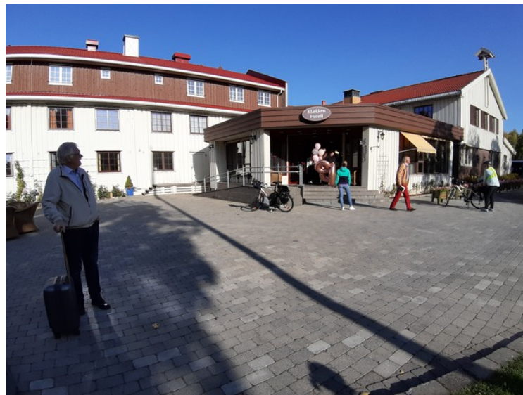
Her står jeg utenfor hotellinngangen da vi skal reise igjen.