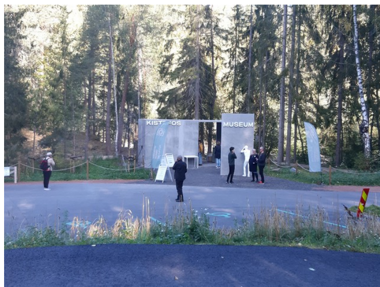
Her er inngangen til museet. Vi hadde ikke tid til å gå inn, for vi hadde avtalt et nytt besøk denne dagen.