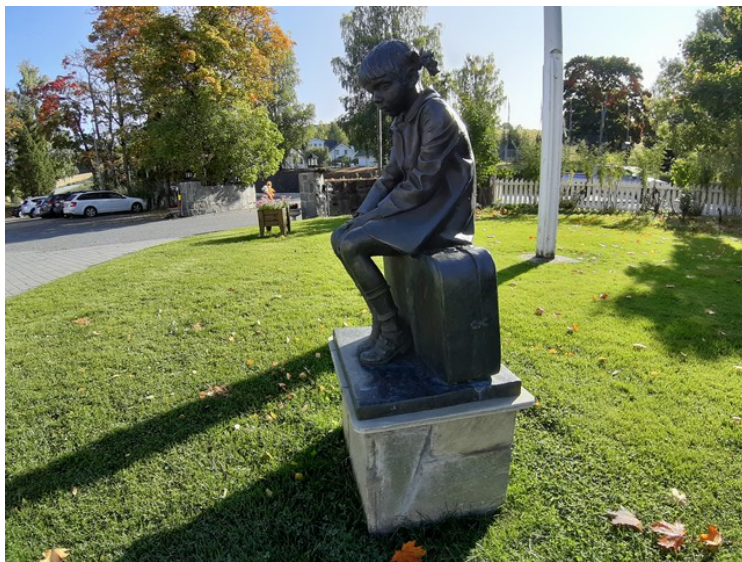
Hotellet har investert i diverse kunst både inne og ute.