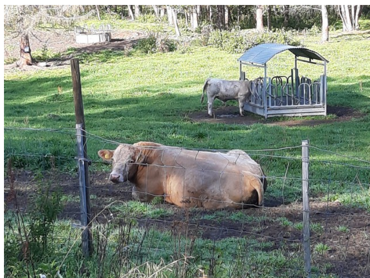
Ved parkeringsplassen til museet lå det en flokk kyr.