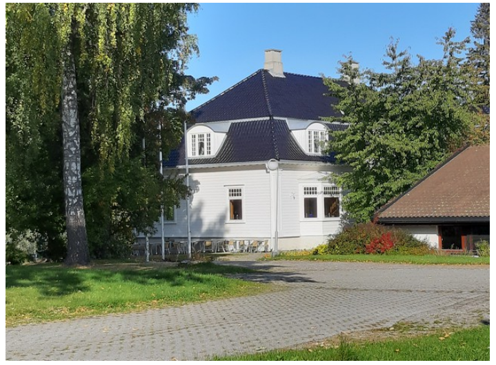
Vi kjørte også innom Torbjørnrud Hotell på Jevnaker for å se hvordan det så ut der. Det ligger idyllisk til rett ved Randsfjorden .