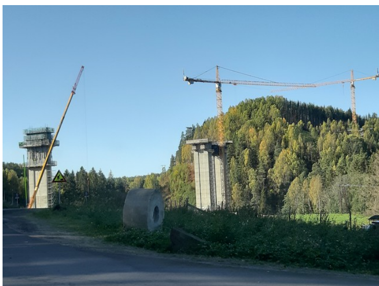
Deretter kjørte vi ned mot Kistefos Museum . Vi kjørte forbi brufundamenter for den nye E16 som skal gå fra Hønefoss til Lunner .