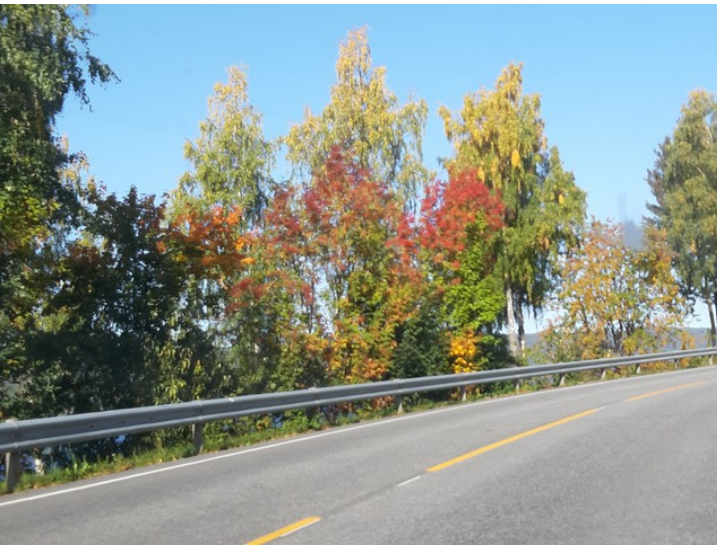
Mange trær hadde fått kraftige høstfarger.