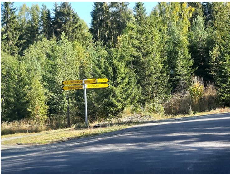
Her står det skilt til Grindvoll .