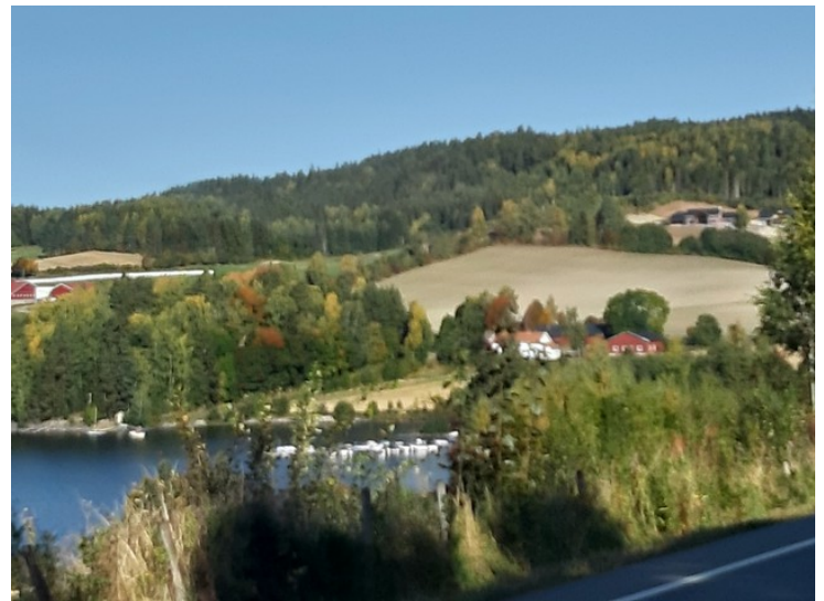
Her kommer vi til Sløvika. Stedet er mest kjent for campingplassen, Sløvika Camping .