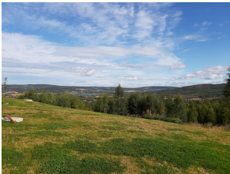
Vi tok et bilde av utsikten.