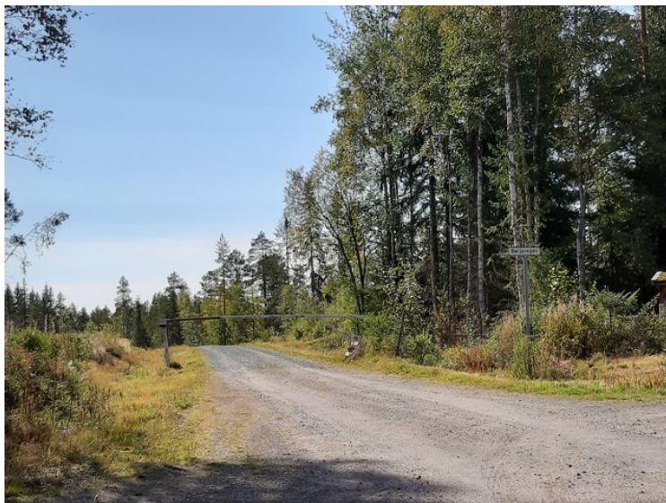
Vi kjørte oppover Heibergvegen til vi ble stoppet av denne bommen. Da er vi oppe på 350 m.o.h.