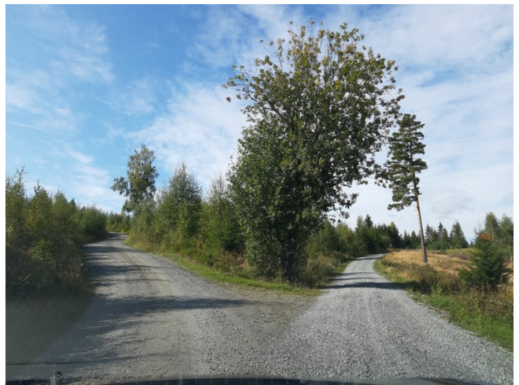
Så kjørte vi oppover Heibergvegen og Høgdavegen. Her stoppet vi.