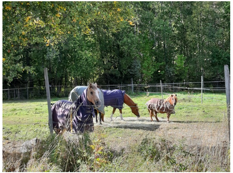
Da vi kom ned til Heibergvegen kjørte vi videre oppover. Et stykke oppover gikk det noen hester.