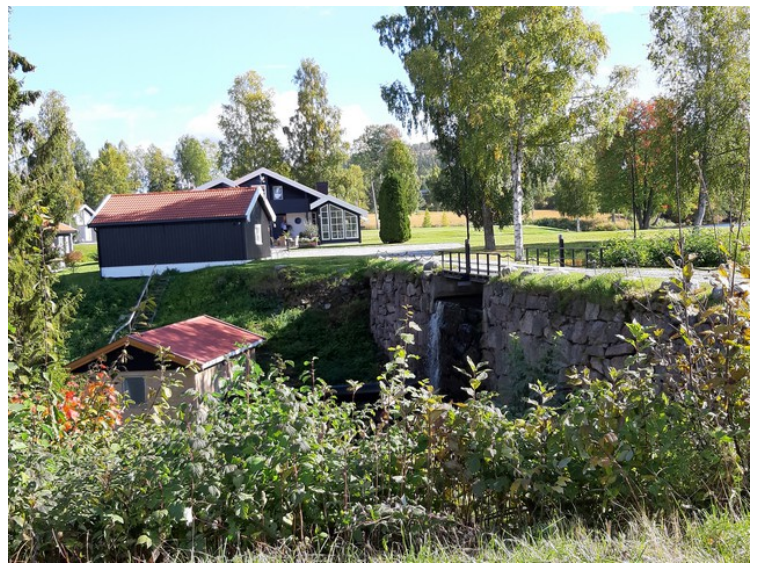
Dette er demningen.