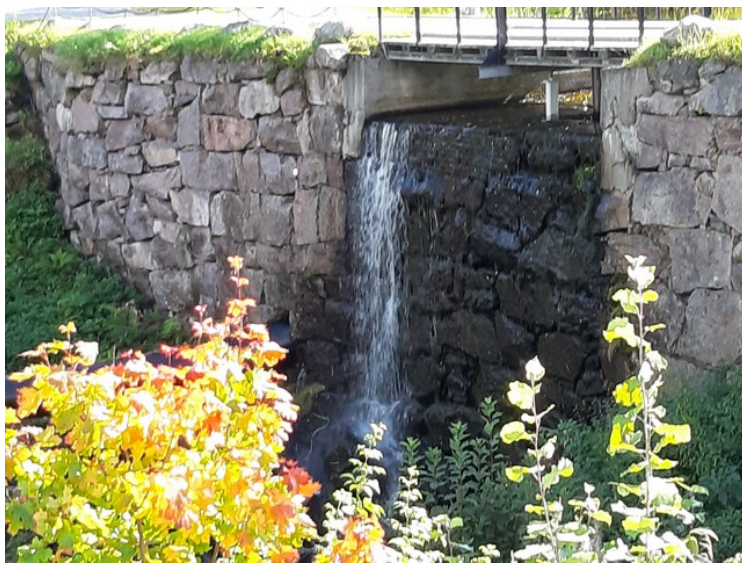
Vannføringen var ikke særlig imponerende akkurat da.