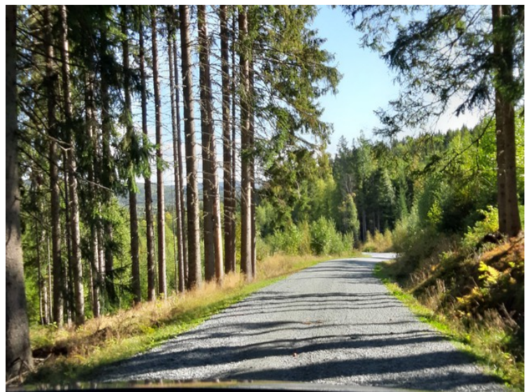
Så kjørte vi nedover igjen.