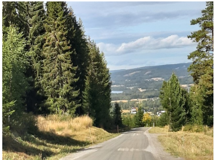
Her gikk det nedover igjen.