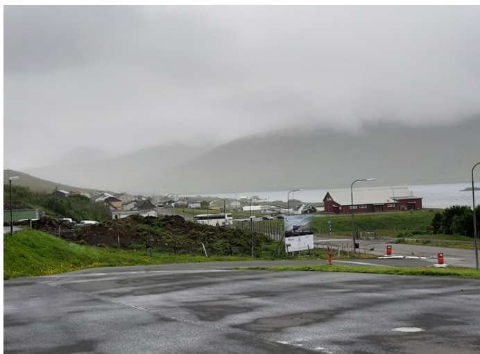
Her ser vi litt av Oyrbakki . Fra Oyrbakki må vi opp i høyden og gjennom en tunnel, Norðskálatunnilin , for å komme til østsiden av Eysturoy.