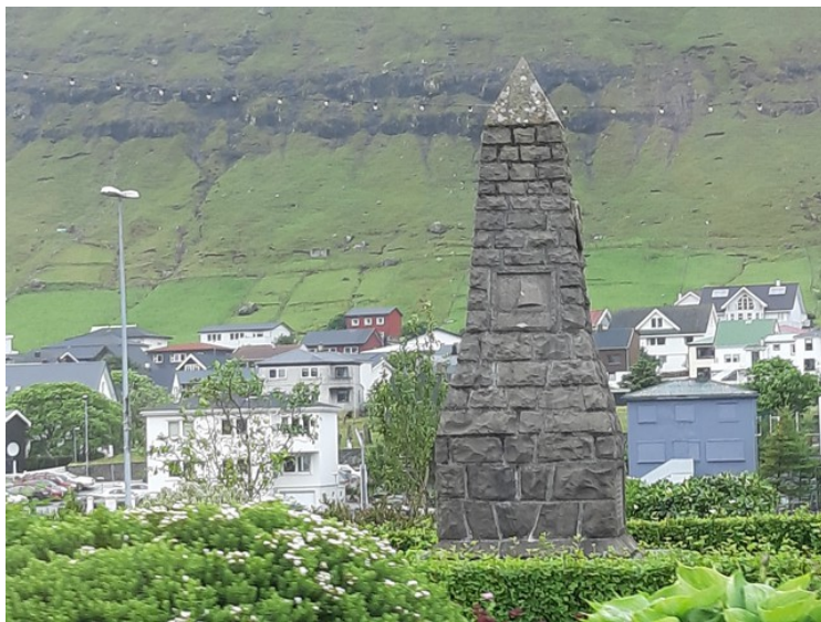
Et monument i minnelunden.

Klaksvík er den nest største byen etter Torshavn med nesten 5 000 innbyggere. Klaksvík ble Færøyenes nest største by omkring 1940. Klaksvík regnes som Færøyenes viktigste fiskerihavn og som sentrum for regionen Norðoyar . Klaksvík har historie tilbake til vikingtiden. Færøyene ble bosatt av nordmenn fra og med 800-tallet. Siden 1913 har Klaksvík vært preget av rederi- og handelsviksomheten J.F. Kjølbro.