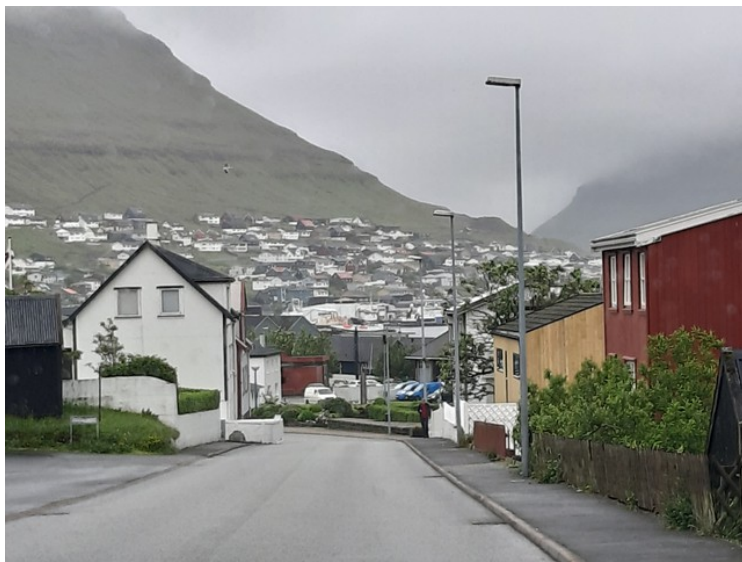
På vei inn i byen.