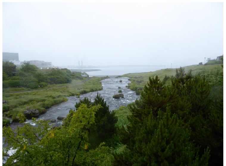
Her ser vi de hvor elva renner ut i fjorden.