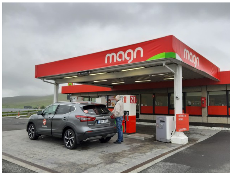
Da vi kom til Oyrbakki fylte vi bensin.

Vi kom til Færøyene den 1. juli, og da kjørte vi rundt på Vágar og vest på Streymoy . Den neste dagen kjørte vi rundt i Tórshavn og sydover på Streymoy. Den 3. juli kjørte vi nordover på Streymoy og nord på Eysturoy . Den 5. juli er vi på vei nordover igjen. Det var regn og tåke denne dagen og skyene lå lavt. Vi kjørte den gamle hovedveien, Oyggjarvegur , nordover denne dagen, men det ble litt feil for den går litt høyt og vi kom opp i tett skodde helt til vi kom ned igjen til Kollfjardhardalur innerst i Kollafjørður.