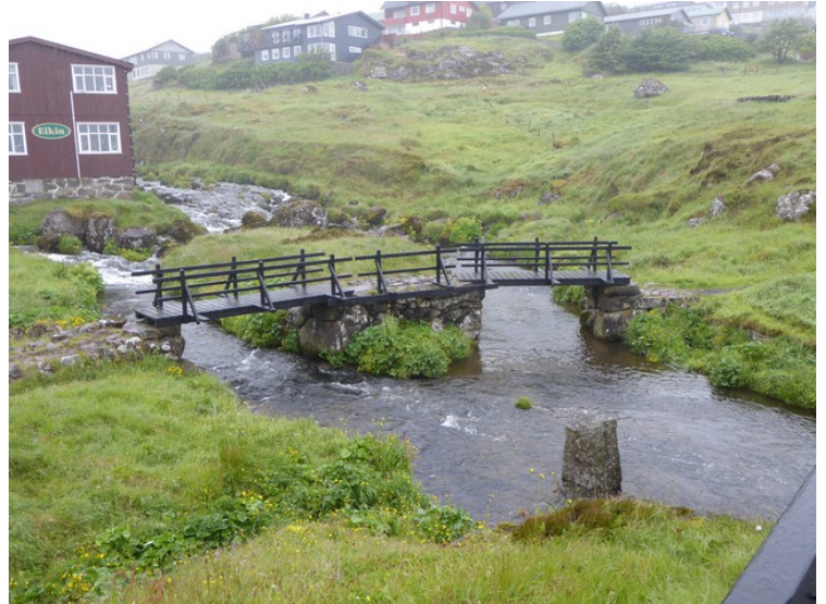
Bro over elva.