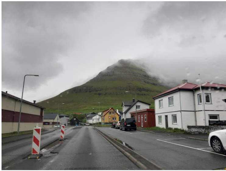
Her kjører vi gjennom Leirvík.