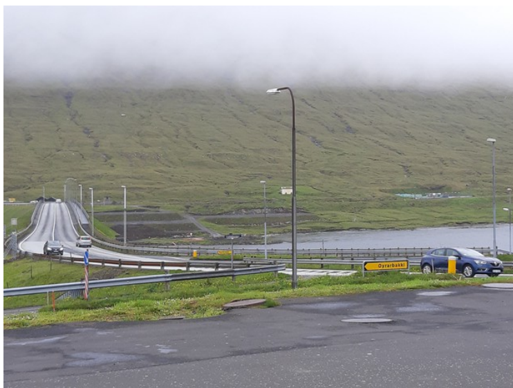
Bensinstasjonen ligger rett ved Streymínbrua som forbinder Streymoy med Eysturoy.