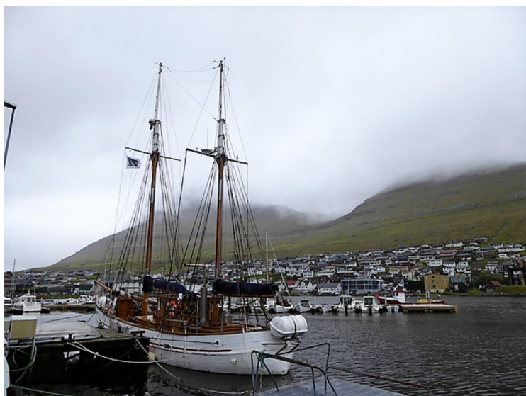
En staselig skute.