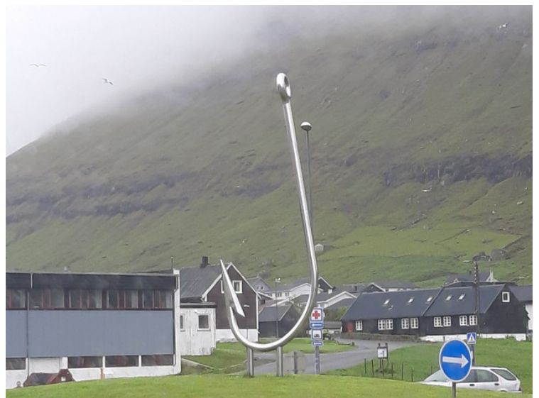
En fiskekrok er plassert rundkjøringen ved innkjørselen til Klaksvík. Den ble avduket i 2010. Det er ikke noen tvil om hva de driver med her.