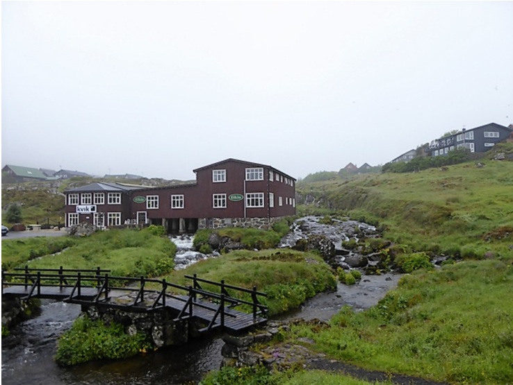
Vi kjørte tilbake i Torshavn og litt sydoover til bygda Argir . Vi stoppet ved Eikin . Det er en møbelfabrikk som ligger ved elva Sandá. De flyttet inn her i 1999.