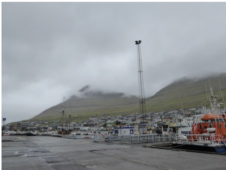
Fra havnen i Klaksvík. Utsikt sydover.

Klaksvík er den nest største byen etter Torshavn med nesten 5 000 innbyggere. Klaksvík ble Færøyenes nest største by omkring 1940. Klaksvík regnes som Færøyenes viktigste fiskerihavn og som sentrum for regionen Norðoyar . Klaksvík har historie tilbake til vikingtiden. Færøyene ble bosatt av nordmenn fra og med 800-tallet. Siden 1913 har Klaksvík vært preget av rederi- og handelsviksomheten J.F. Kjølbro.