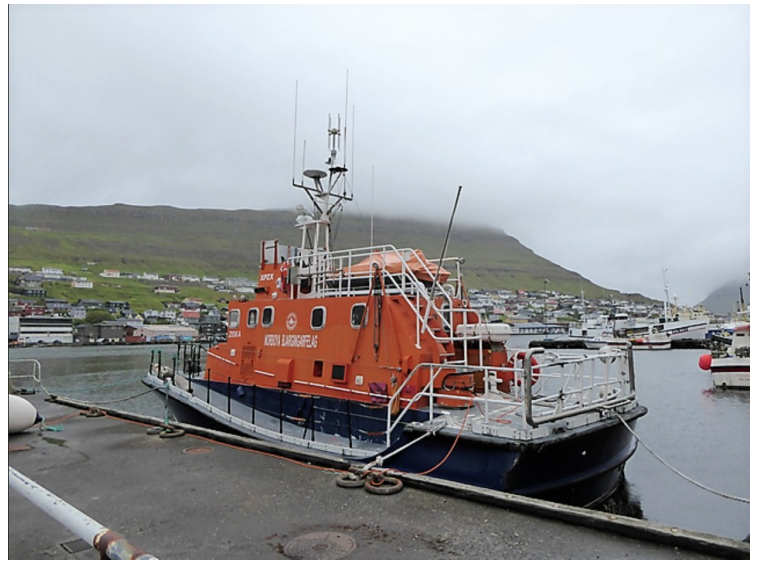
Båten til Norðoya Bjargingarfelag . Redningstejenesten.