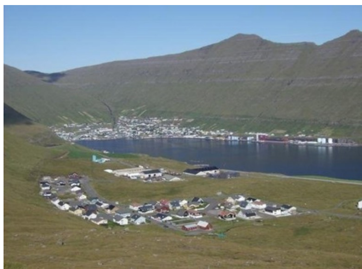
Et bilde av Kambsdalur med Fuglafjørður i bakgrunnen. Fjorden heter også Fuglafjørður .