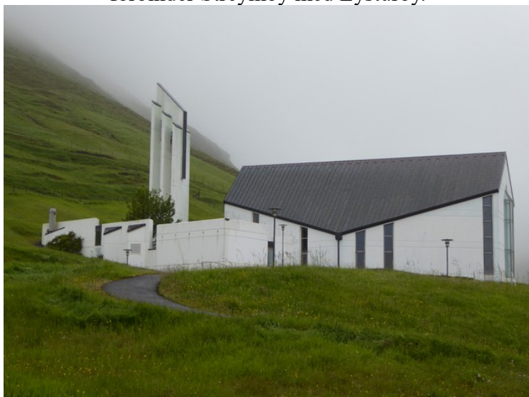
I Gøtugjógv tok vi bilde av kirken.