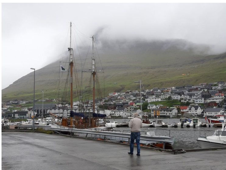
Her ser jeg en båt som jeg vil ta bilde av.