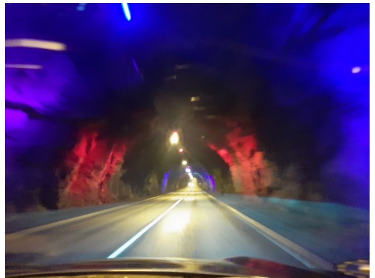
Norðoyatunnilin ble åpnet i 2006. Den forbinder Leirvík på Eysturoy med Klaksvík på Borðoy . Den er 6300 m lang. I midten av tunnelen er det såkalt lyskunst.