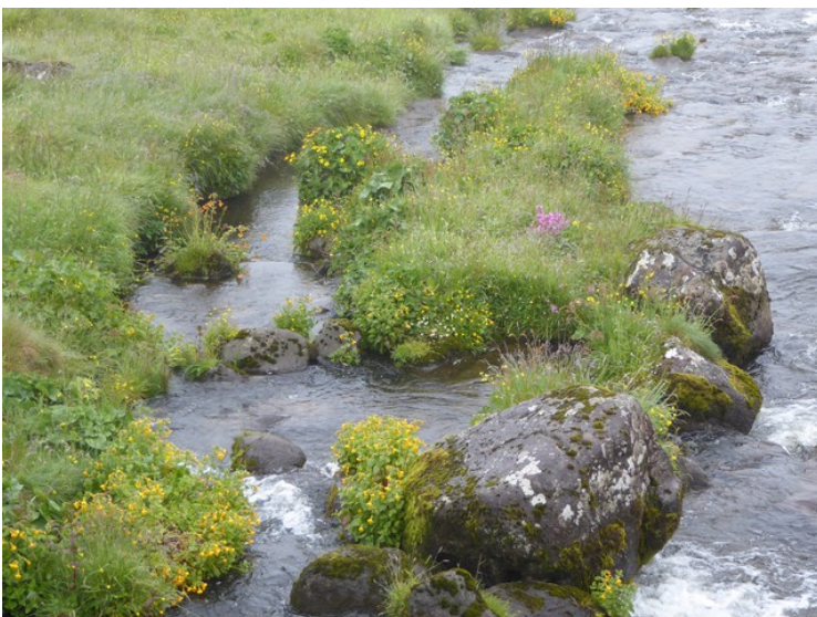
Bekkeblom vokser ved elva. Bekkeblom er Færøyenes nasjonalblomst.