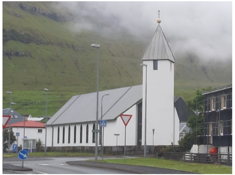
Vi tok et bilde av kirken i Leirvík også.