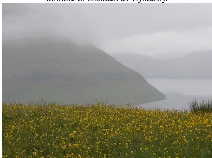
Her er vi ved Kambsdalur . Vi ser sundet mellom Eysturoy og Kalsoy .