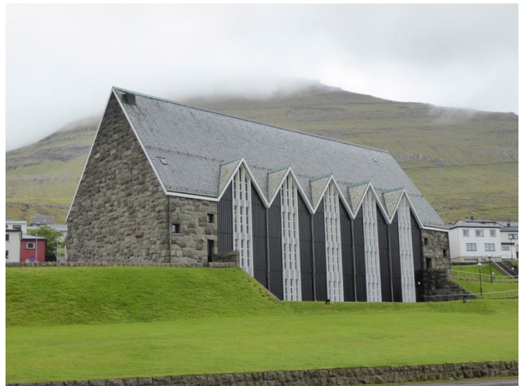
Christianskirkjan sto ferdig i 1963. Altartavlen er fra Viborg domkirke i Danmark, og ble laget av Joakim Skovgaard i 1901. Døpefonten av granitt ble funnet i en kirkeruin nord på Sjælland , og er datert til å være 4 000 år gammel hedensk offerskål. Gitt til kirken av Nasjonalmuseet i København.