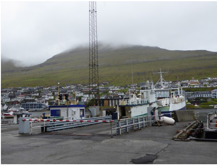
Fra havnen i Klaksvík er det fergeforbindelse til Syðradalur på Kalsoy, en overfart som tar ca. 20 min.