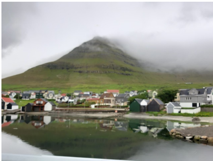
Ut av Leirvík.