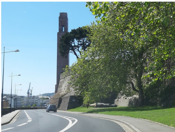
Dette er US Marine-monument i Brest.