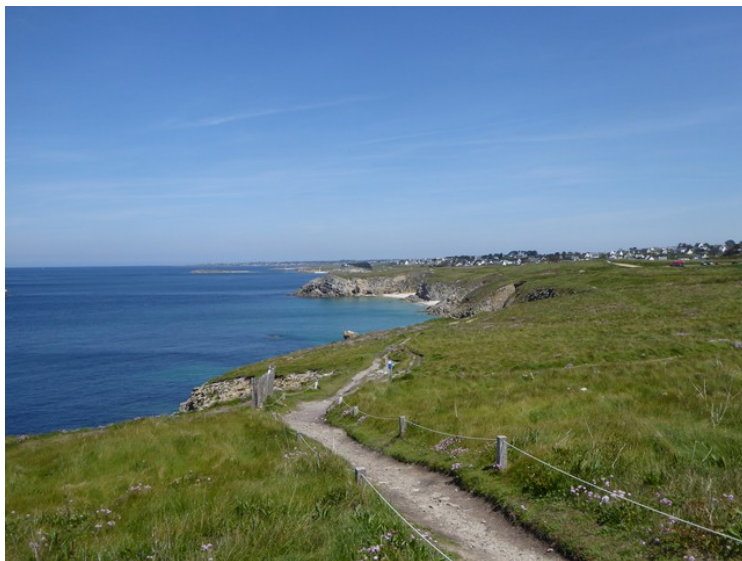
Utsikt nordover fra Corsen.