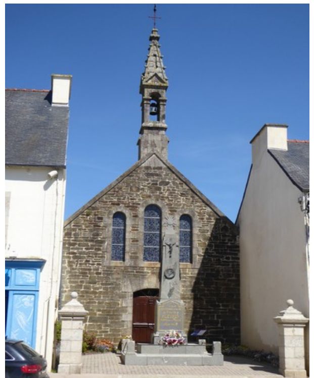
En liten kirke ligger inneklemt i husrekka.