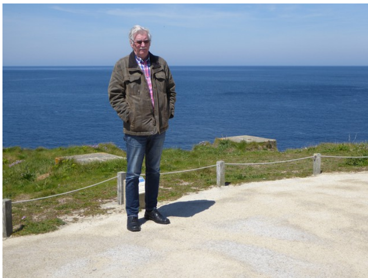
Her har jeg Atlanterhavet i bakgrunnen. Denne delen kalles Det keltiske havet .