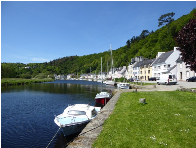
Utsikt nedover elva.

Vi hadde en kaffepause på en kafe i denne byen.