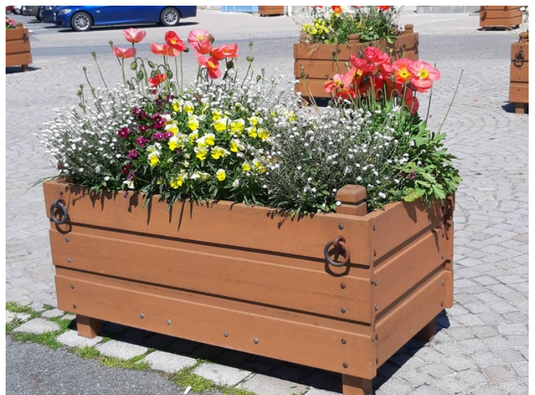
Neste stopp var i Pleyben . Fine blomsterkasser på torget.