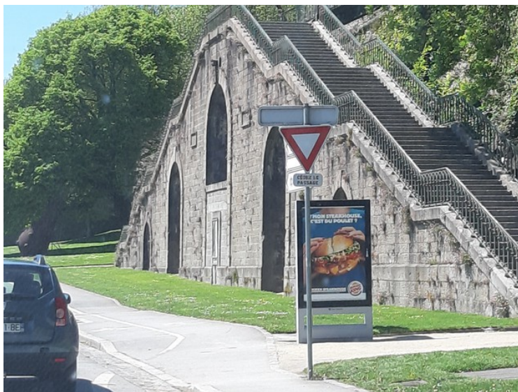
Murer og trapper.