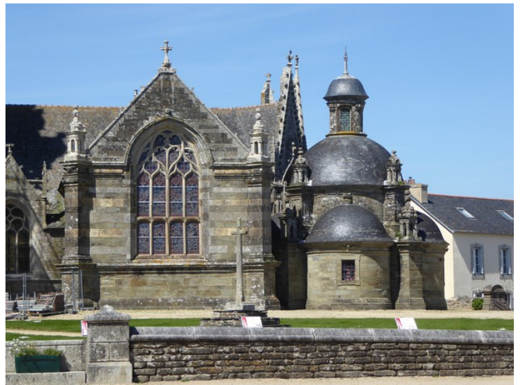
Spesiell kirke, Paroisse de Pleyben Paroisse .