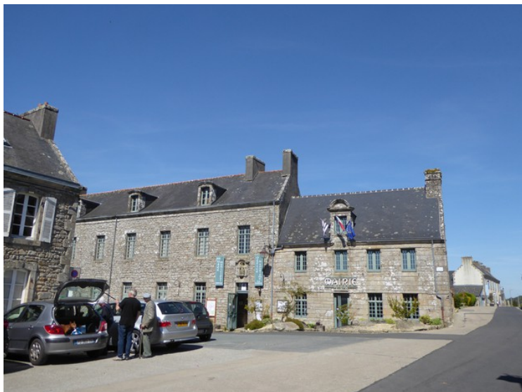
Vi stoppet utenfor rådhuset.