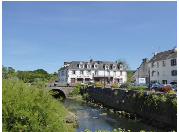
Dette er et hotell, Auberge du Camfrout