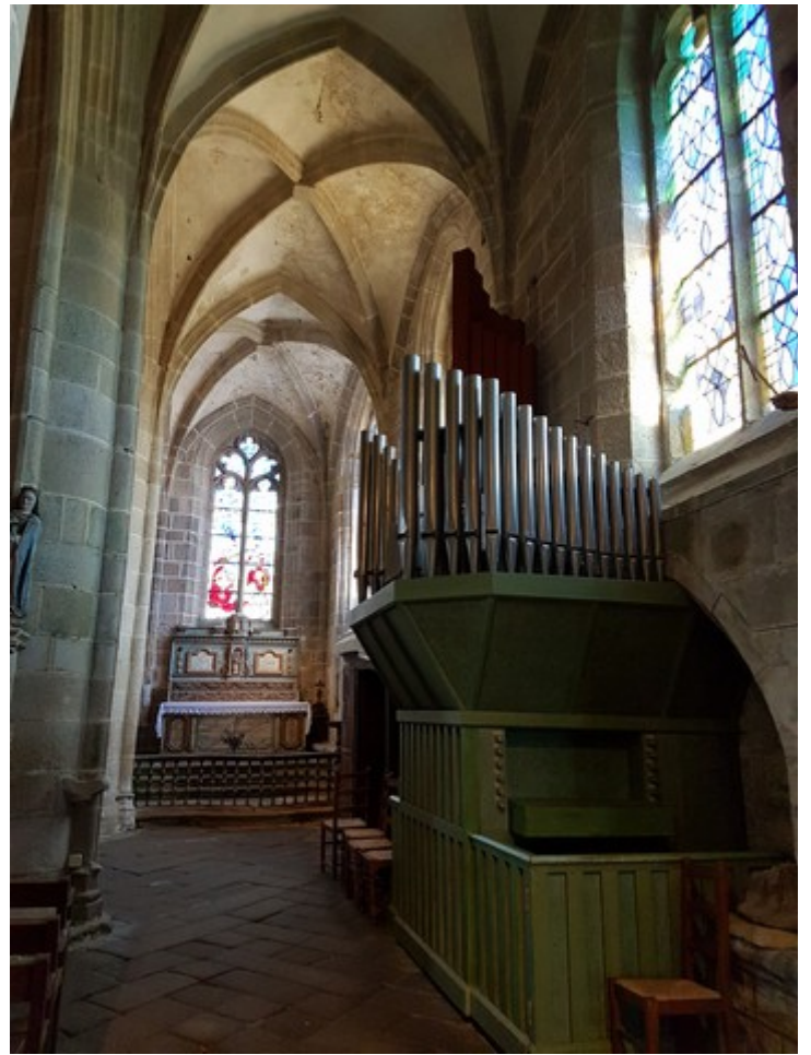
Noen bilder fra kirken.