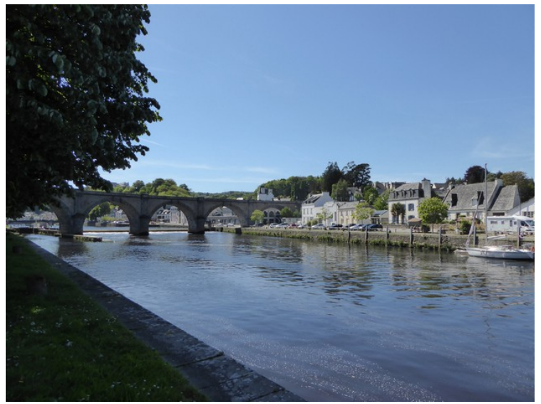
Bru over elva ved Châteaulin.