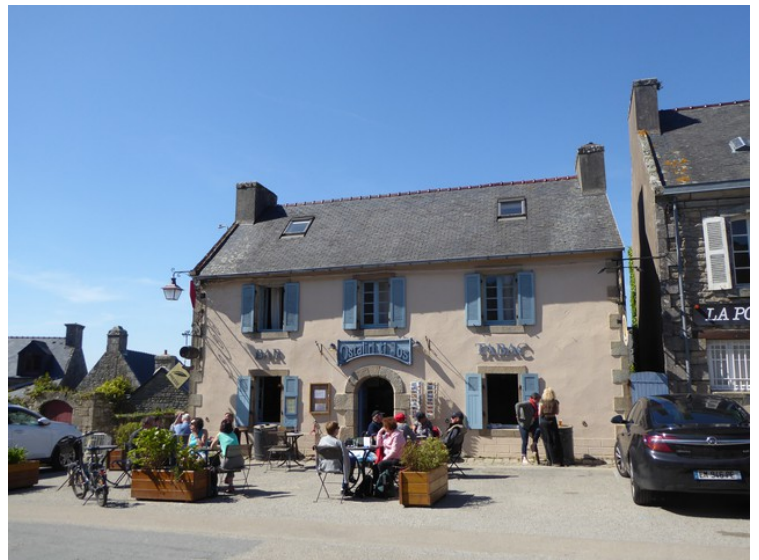
Neste stopp er i Locronan . Frenchdistrict