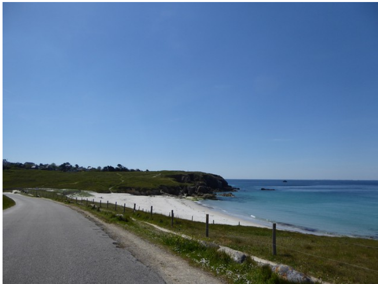
Her ser vi i retning av det vestligste punktet i Frankrike.