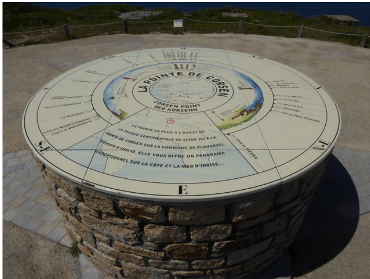
Dette er det vestligste punktet, La Pointe de Corsen .