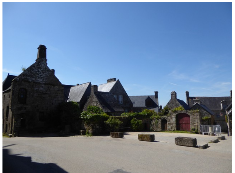
Torget nedenfor kirken.