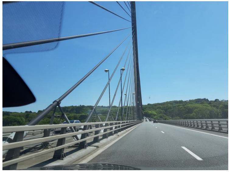
Rett etter Brest krysser vi elva Élorn