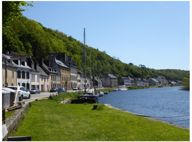
Elva Aulne renner gjennom byen. Utsikt oppover elva.