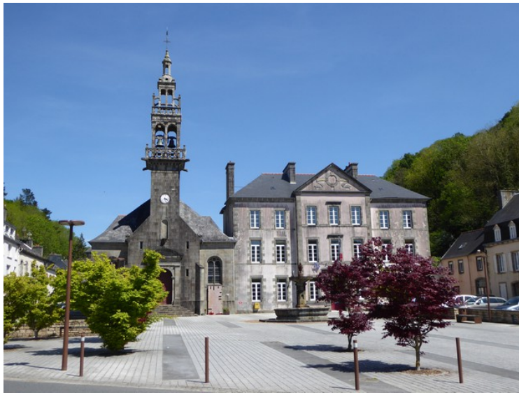
Neste stopp er i Port-Launay .