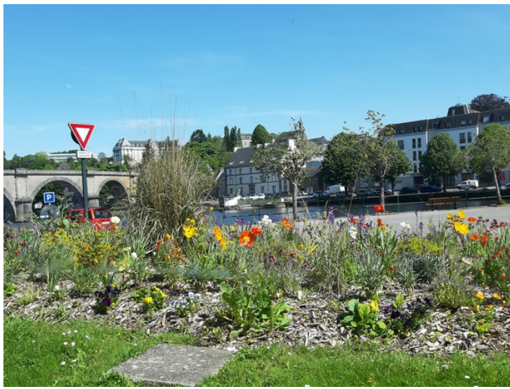
På veien videre kjørte vi tilbake til Port-Launay og videre oppover elva Aulne. Her er vi ved Châteaulin .