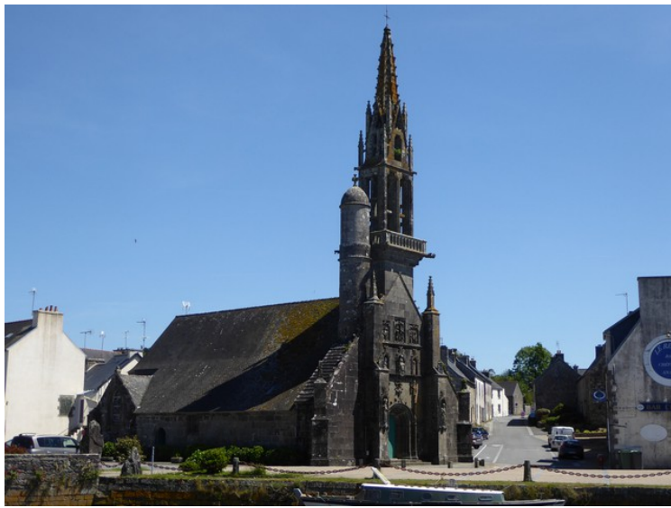
Første stopp etter Brest er i Hopital-Camfrout . Dette er kirken Église Notre-Dame-de-Bonne-Nouvelle .