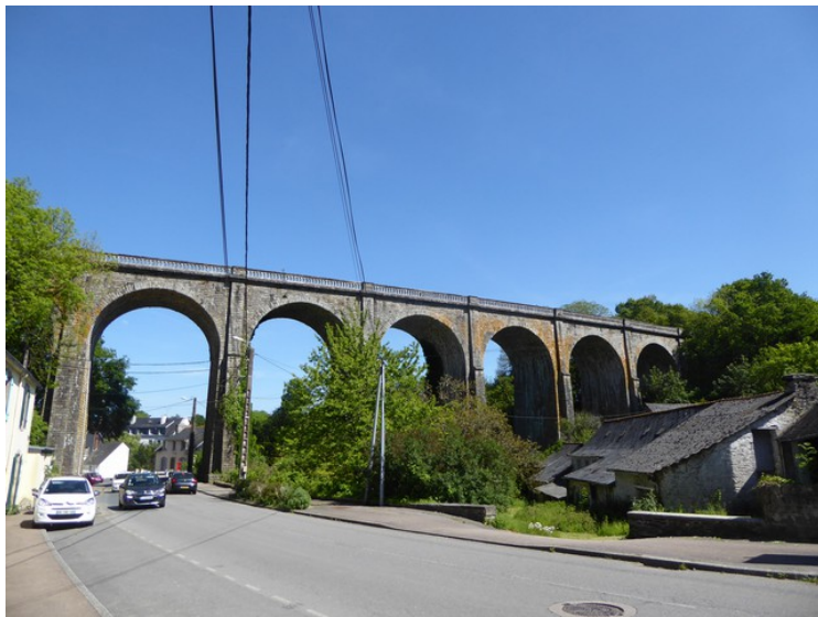
En jernbanebru ved Châteaulin.