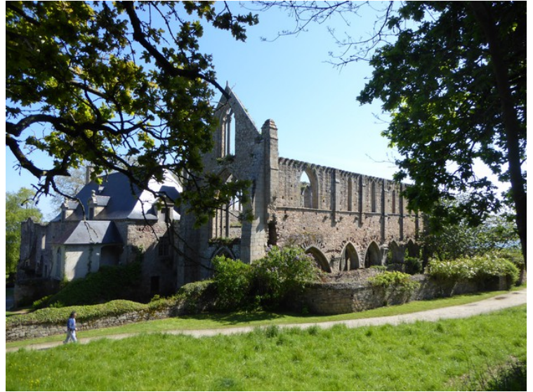
Jeg fant disse ruinene, Beauport klosterruin . Byggingen av klosteret startet i 1203. Klostervirksomheten sluttet i 1790. I dag er det et historisk monument og museum.