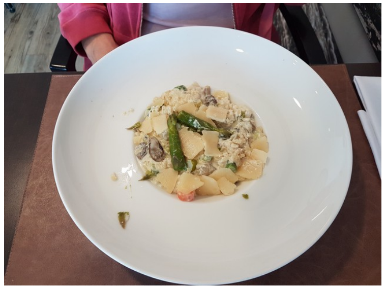
Anne Berit hadde en sopprisotto med fisk som var veldig god.