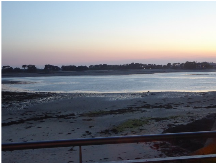
Senere på kvelden flødde sjøen litt.