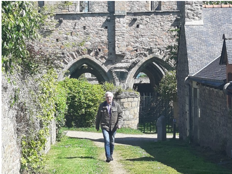
Her kommer jeg tilbake etter å ha tatt bildet.