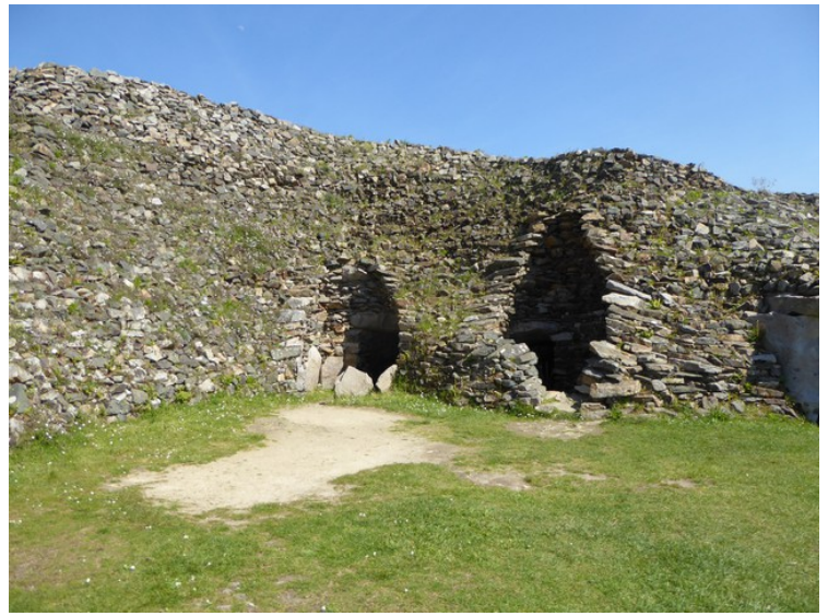
Barnenezgravdyssen er 6000 år gammel. Det er 6 gravkamre inni.