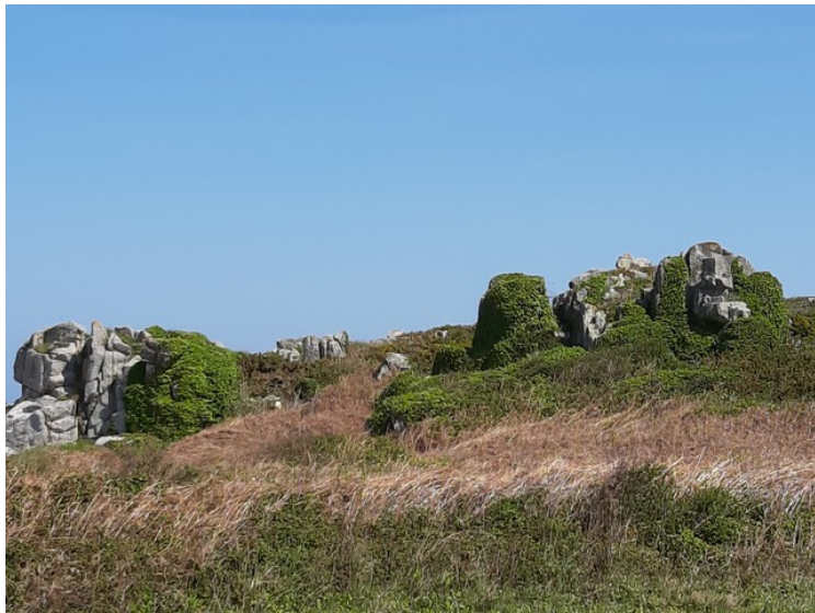
For å ta bildet, parkerte vi på en parkeringsplass og gikk et stykke for å kunne se det.