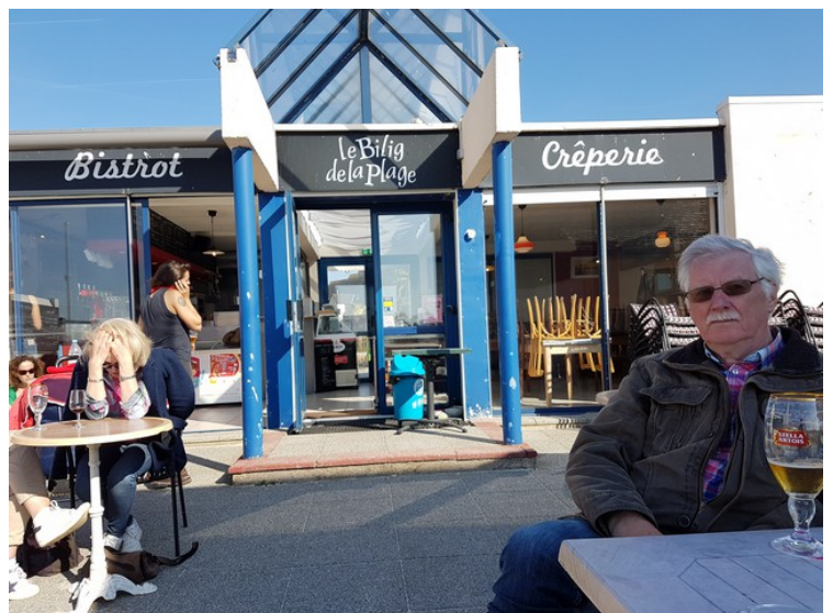
Etter at vi hadde sjekket inn på hotellet hadde vi en øl på en strandbar som ligger rett ved siden av hotellet.