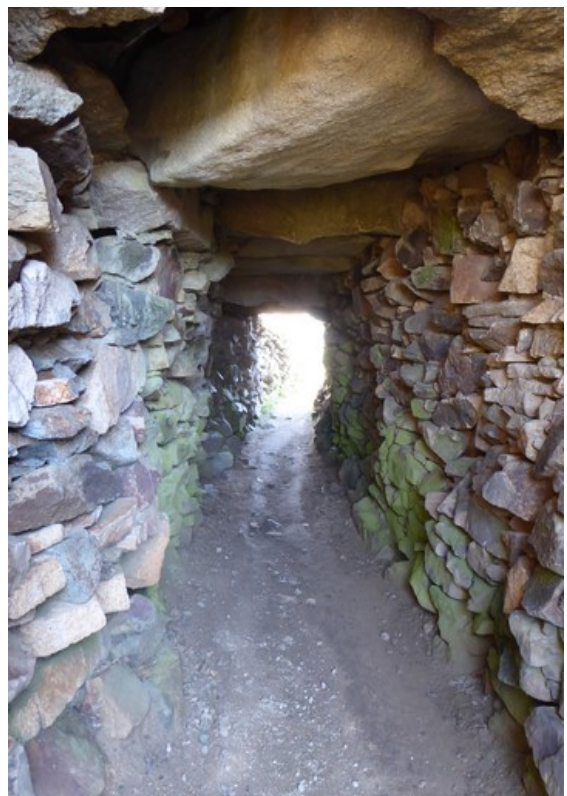
Jeg kunne se tvers igjennom.