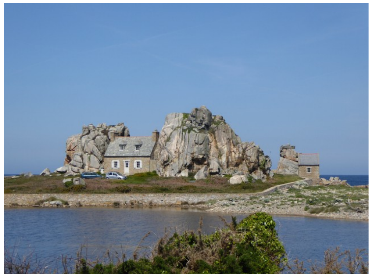
Vi kjørte et lite stykke forbi Plougrescant for å se dette huset, Castle Meur , som står mellom to steiner helt ute ved havet. Det ble bygget i 1861. Det er mange turister som kommer hit for å se det spesielle huset.