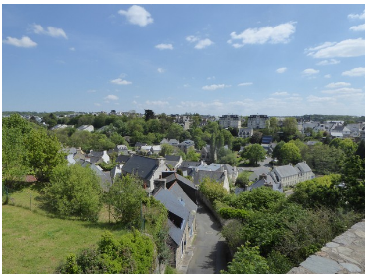
Her har vi stoppet på en høyde og har god utsikt over byen. Opp til denne høyden går det en trapp fra sentrum av Lannion. Den har 142 trappetrinn.

Neste stopp er i Lannion, som ligger ved elva Léguer, Wikipedia France-voyage