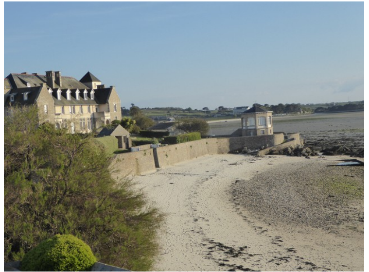
Men vi satt på balkongen. Tok vi bilder av omgivelsene.