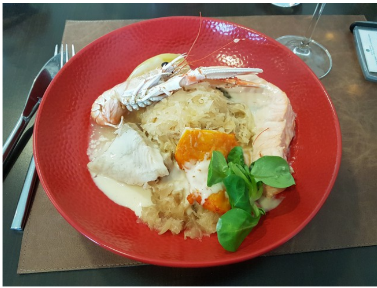
Etterpå spiste vi middag på hotellet. Jeg hadde kveite. Den var god, men jeg likte ikke så godt fermentert kål til.