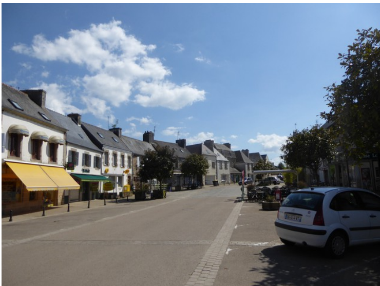
Hovedgata i Lanmeur.