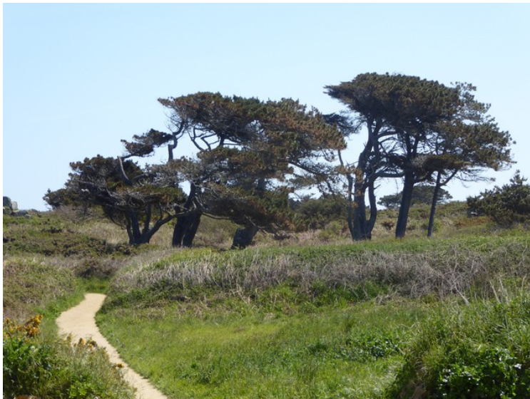
Det er spesiell natur her ute ved havet.