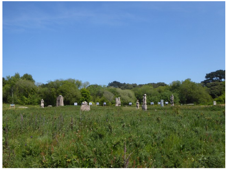
Veldig mange skulpturer.