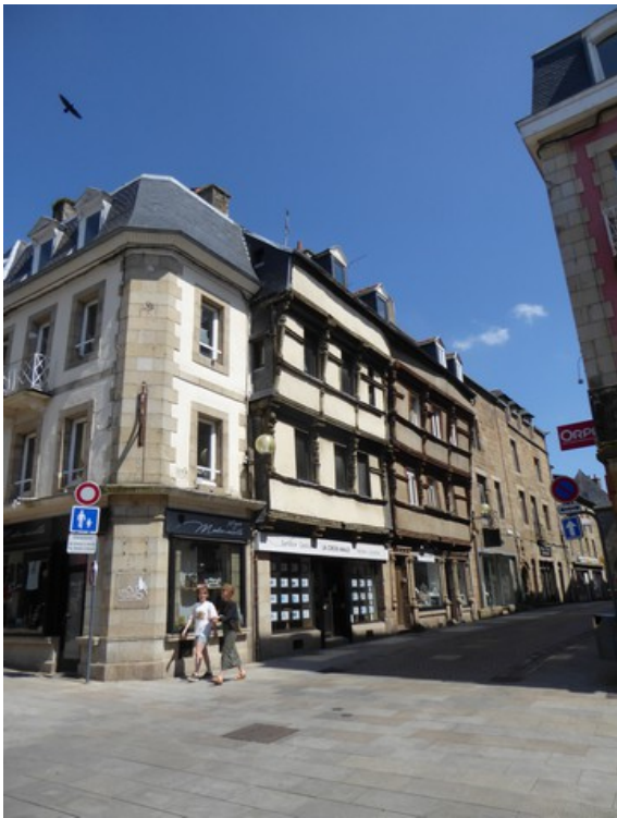
Flere hus i Lannion.