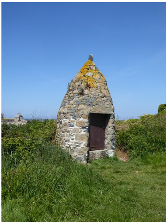
I nærheten av kafeen sto dette huset.