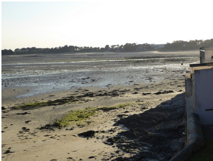
Det var lavvann, så det så ikke veldig innbydende ut.