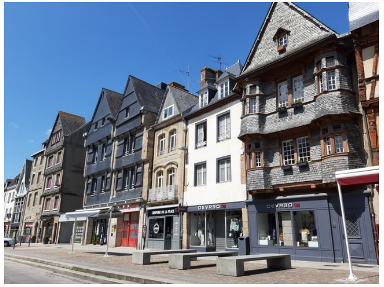
Alle disse husene ligger rundt Place du Général Leclerc.