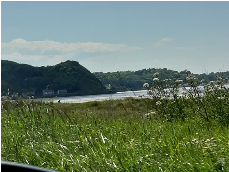
Dette er også ved Saint-Michel-en-Grève