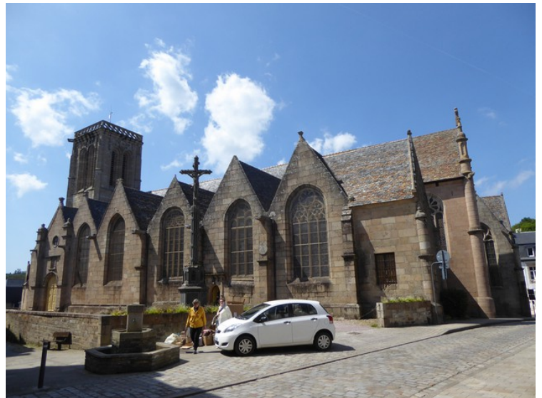
Dette er en kirke som heter Église Saint-Jean-du-Baly .