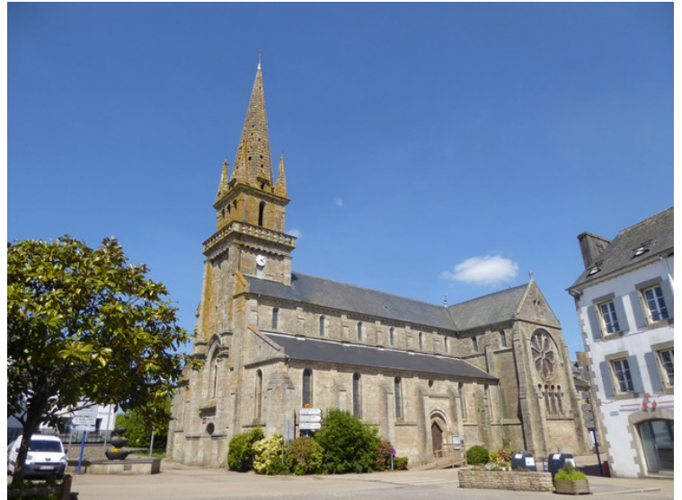
Enda en kirke, Église Saint-Mélar de Lanmeur . Denne ligger i Lanmeur .