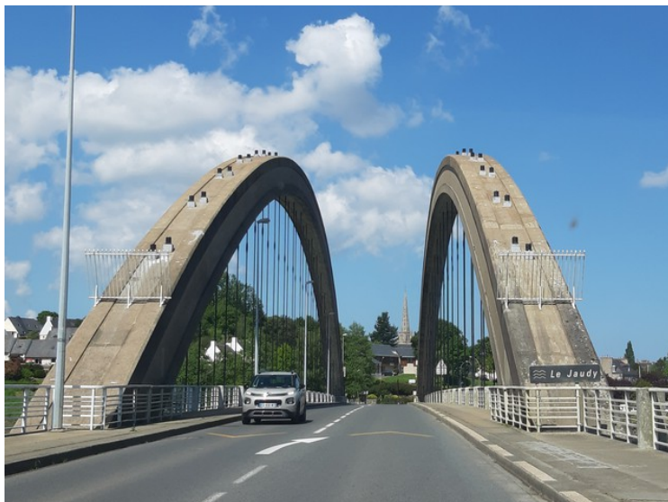
Her kommer vi til en ny bru. Denne går over elva Jaudy.