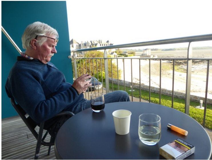
Etter middagen hadde vi en vin på balkongen.