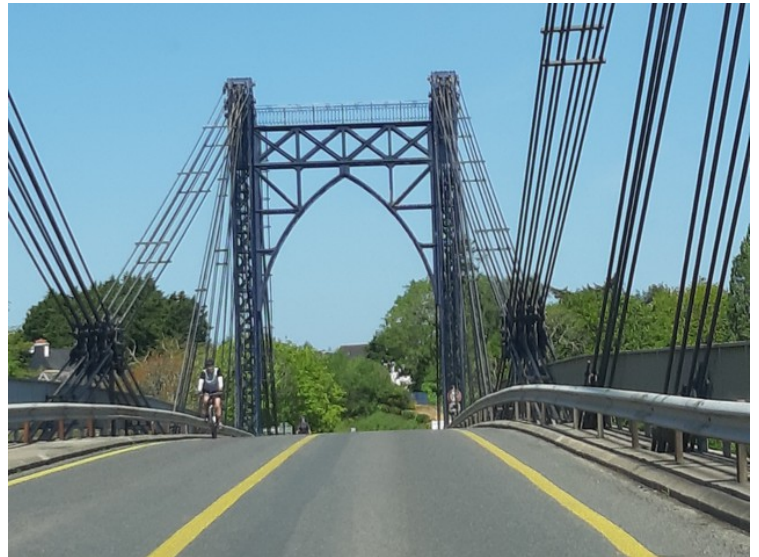
Denne brua går over elva Trieux .