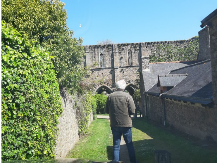
Her så jeg noen gamle murer, så da måtte jeg stoppe. Her går jeg for å ta et bilde.

Den 12. mai fortsatte vi rundturen i Frankrike.