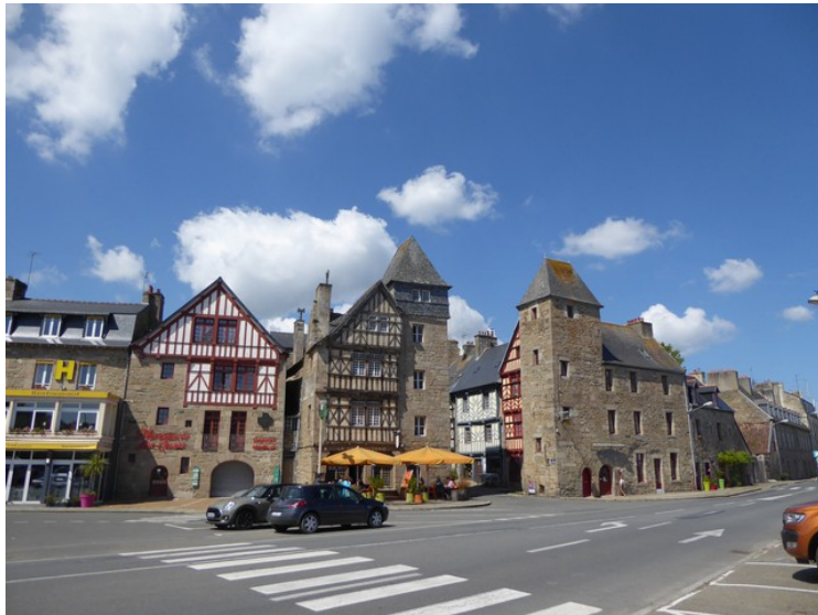
Vi stoppet i Plouguiel for å ta en kopp kaffe på denne restauranten, men det var midt i lunsjtida, så da måtte vi spise. Det ville vi ikke, så vi gikk igjen.