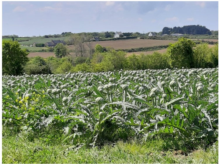
Her så vi dyrking av artisjokk for første gang.