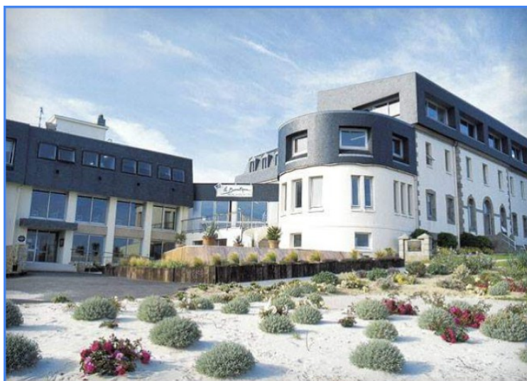
Siste stopp denne dagen var på Valdys Resort Roscoff . Hotellet ligger nesten på stranden.