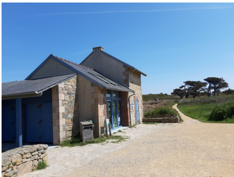
Vi gikk så langt som til denne kafeen. Den var stengt da vi var der.