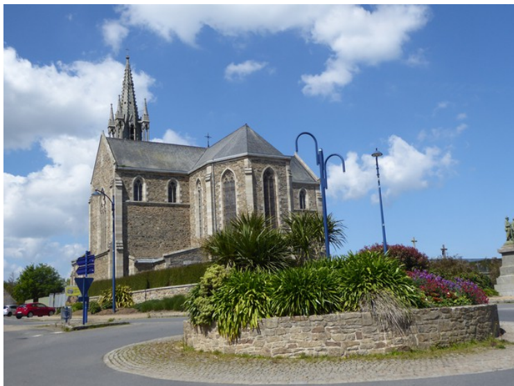
Det sto ved siden av denne kirken, Église paroissiale Notre-Dame .