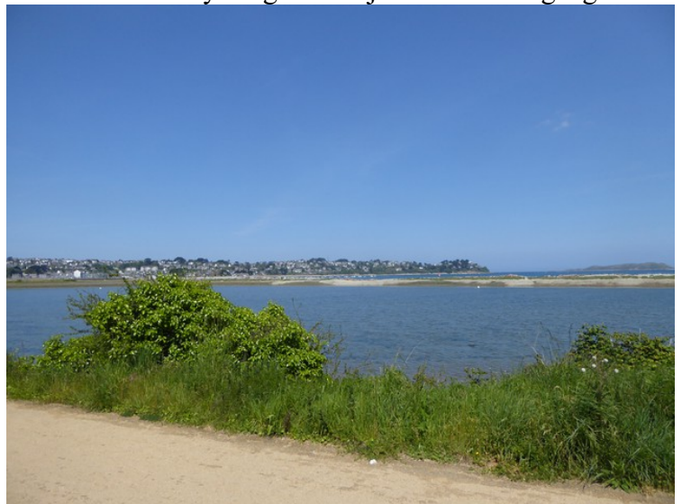
Dette er rett før vi kommer til Perros-Guirec .