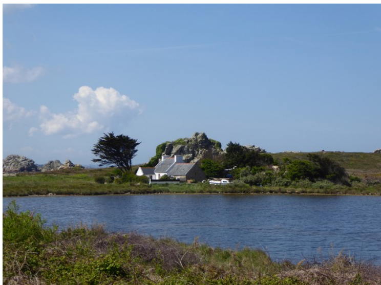
I nærheten av Castle Meur var det flere hus, men ikke så originalt plassert.