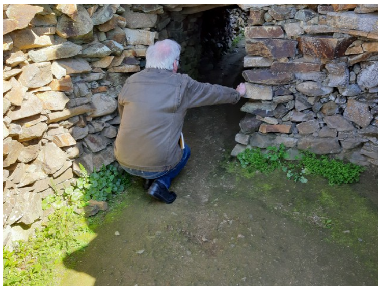
Jeg kikker inn.