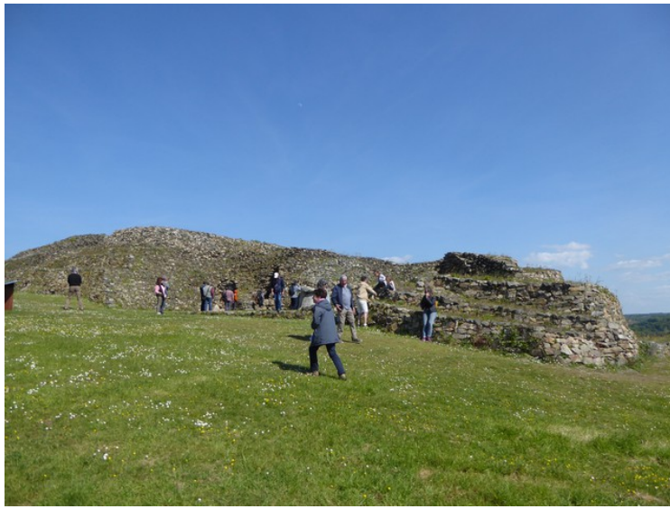
Det var flere enn oss to der.