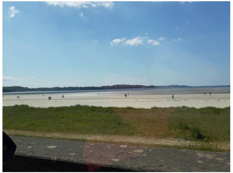
Dette er ved Saint-Michel-en-Grève.