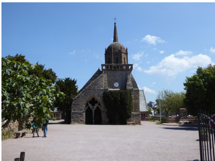
I Perros-Guirec tok vi bilde av denne spesielle kirken.