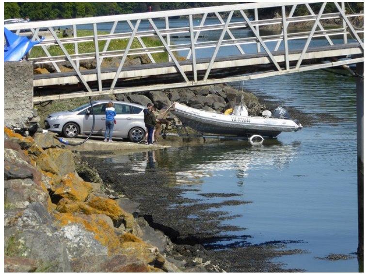
Her er det en båt som skal i vannet.