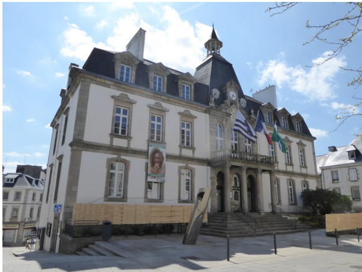
Rådhuset i Lannion.