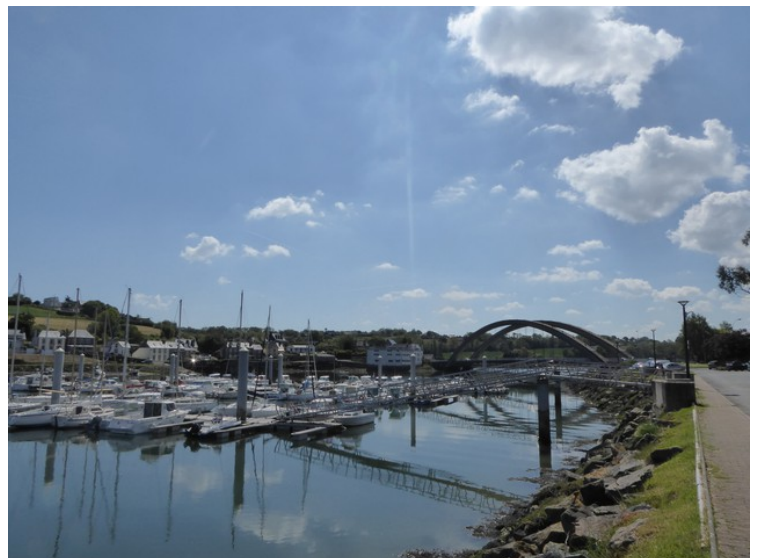
På andre siden av brua ligger Tréguier. Her er det en marina.