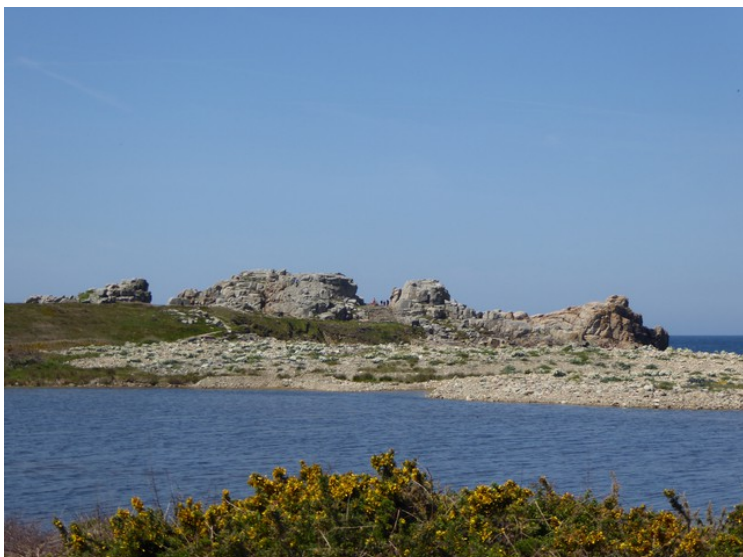
Mye stein her.