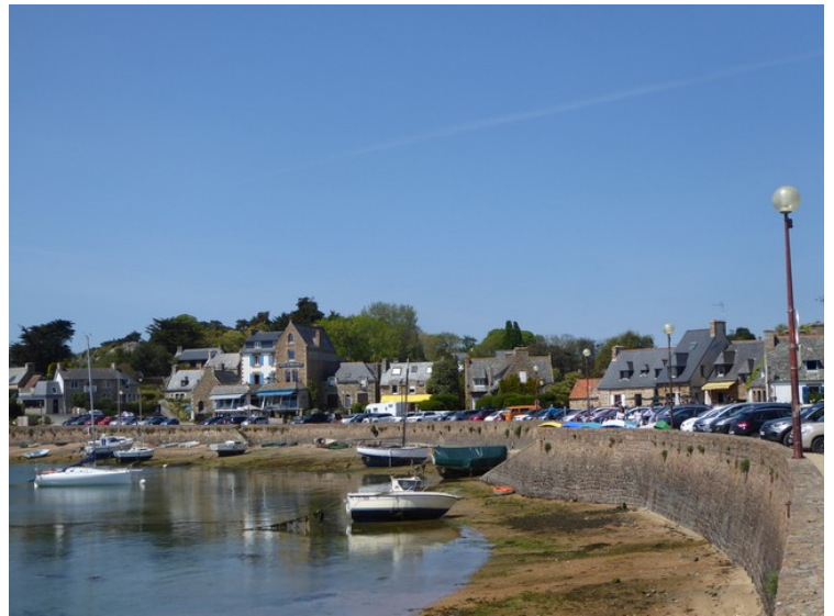
Dette er i Saint-Guirec

Neste stopp er i Lannion, som ligger ved elva Léguer, Wikipedia France-voyage