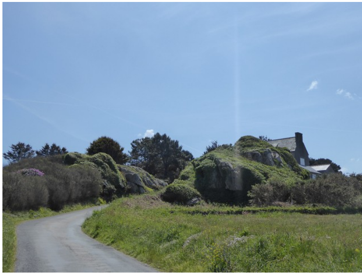
På vei tilbake mot Plougrescant.