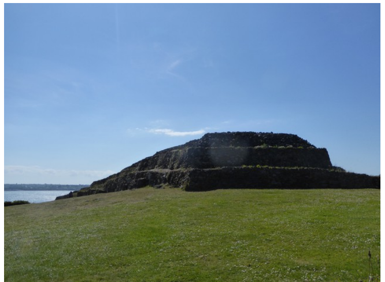
Da vi kom til Plouezoc'h , tok vi en avstikker for å se på verdens største gravrøys.