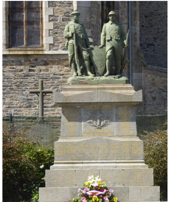
Vi tok bilde av dette krigsminnesmerket, som sto der som vi hadde parkert bilen.