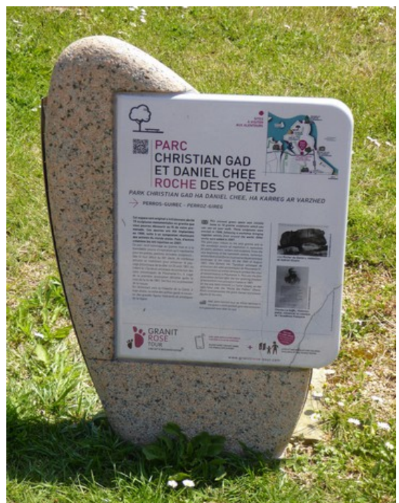
Litt senere stoppet vi for å ta et par bilder i denne skulpturparken, Parc des sculptures Christian Gad et Daniel Chéhé .