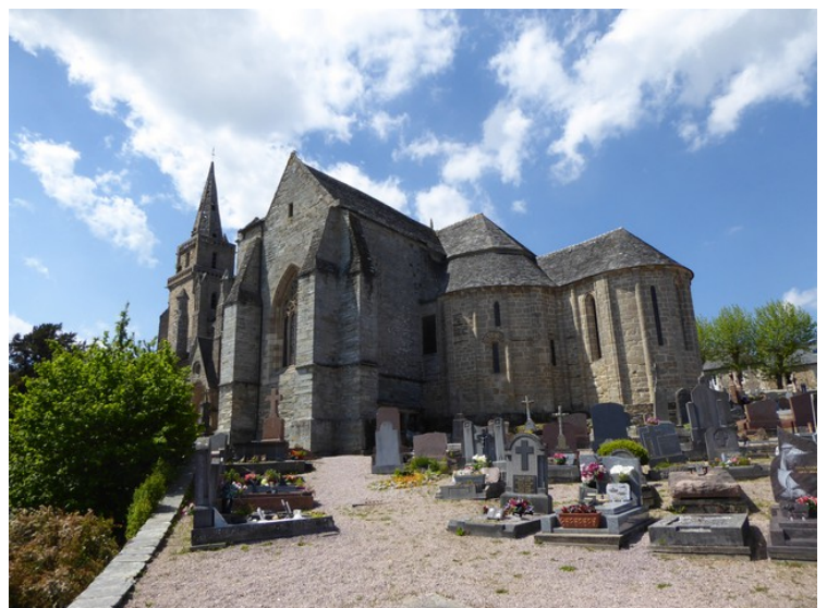
Her ligger også denne kirken, Eglise de la Trinité de Brélévenez . Brélévenez er en gammel bydel i Lannion.