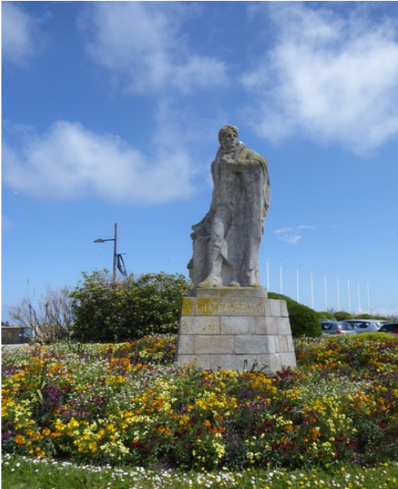
På vei tilbake til bilen gikk vi forbi en statue her av François-René de Chateaubriand .