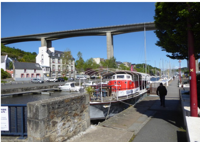
Dette er i Saint-Brieuc ved elva Gouët .