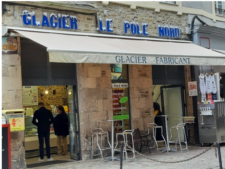
Salg av iskrem. Oppfinnsom tekst.