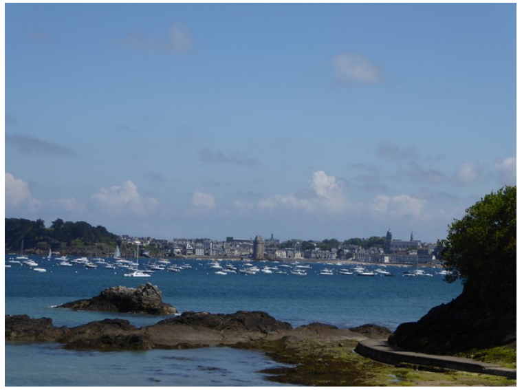
Her ser vi tvers over bukta i retning av St-Malo.