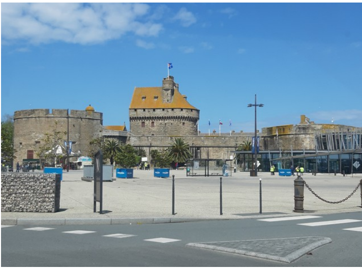
Dette er en del av bymuseet.