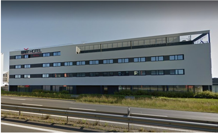
Deretter tok vi kvelden og sjekket inn på Brit Hotel Saint-Brieuc Plerin , ( Booking.com ).

Denne delen av kysten kalles Smaragdkysten . Navnet kommer fra fargen til sjøen i regionen under visse forhold. Den strekker seg fra Fréhel til Mont-Saint-Michel.