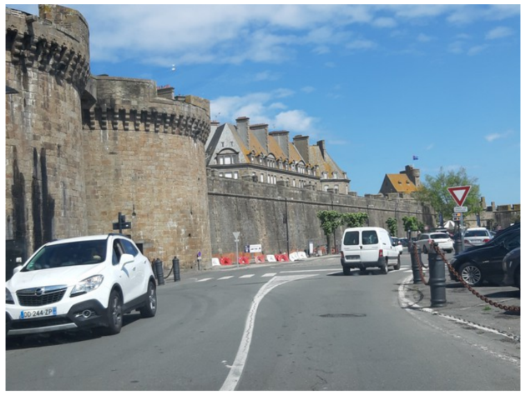
Neste stopp er i St-Malo. Her kjører vi langs bymurene.

Omkring ca. år 1000 var St-Malo en øy hvor St. Aaron og St. Brendan grunnla et kloster, hvor en av munkene senere ble til St. Malo. Derav navnet.