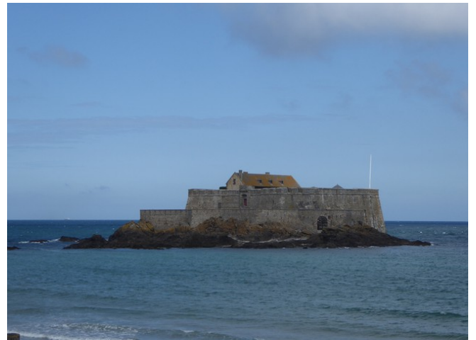
Fra kanten av muren ser vi Fort National som ligger på en liten tidevanns-øy.