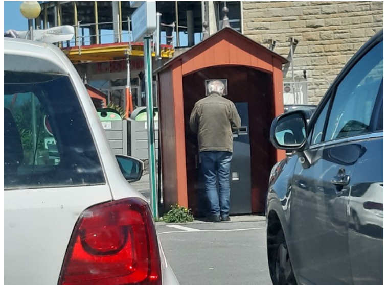
Her står jeg og skal betale for parkeringen slik at vi kan komme oss ut på veien igjen.