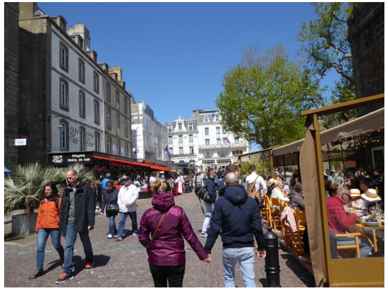
Innenfor murene er det mange restauranter.