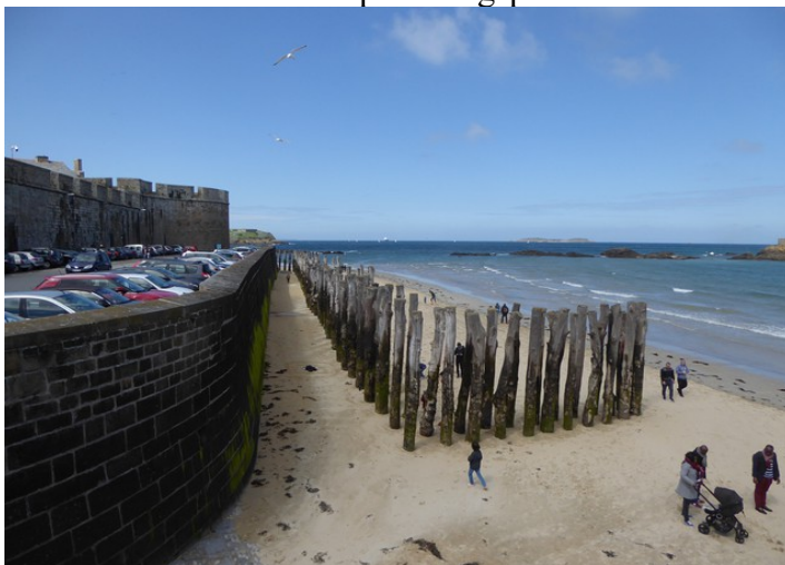
Trestokker skal skjerme murene mot bølger.