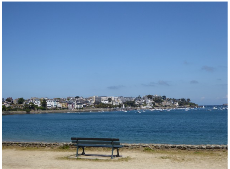
Neste stopp er i Dinard. Her er vi ved Plage du Prieuré , før vi kommer til byen. Byen er et populært feriested, spesielt for engelskmenn, og det er mange dyre hoteller her.