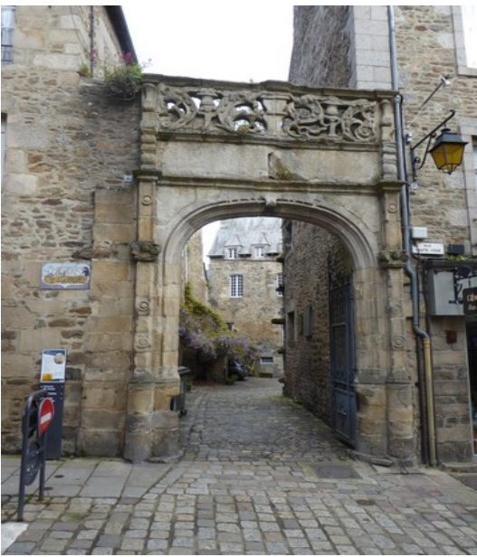
En gammel portåpning i Dinan.