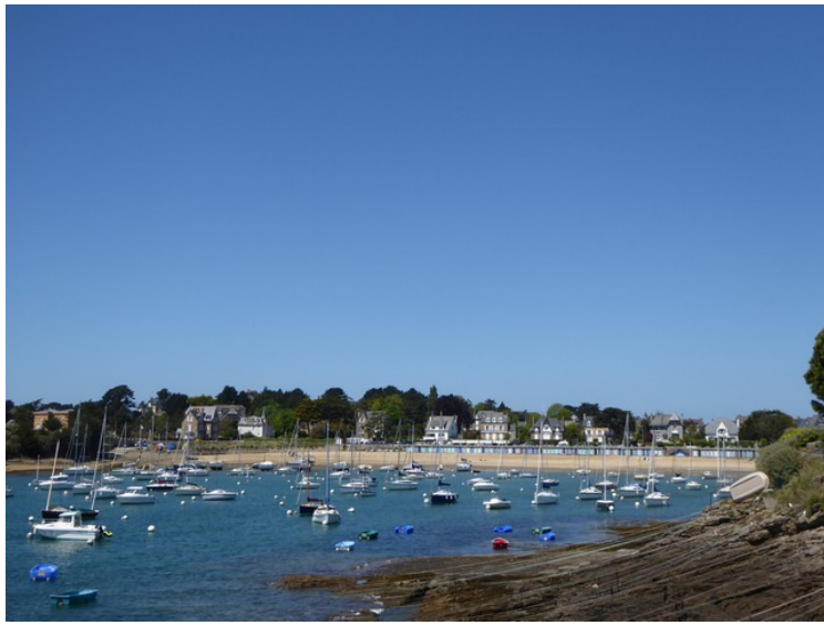
Plage Du Bechet