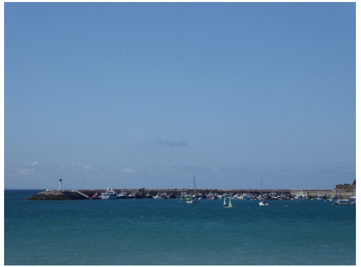
Deretter kjørte vi forbi Erquy . Tok noen bilder.