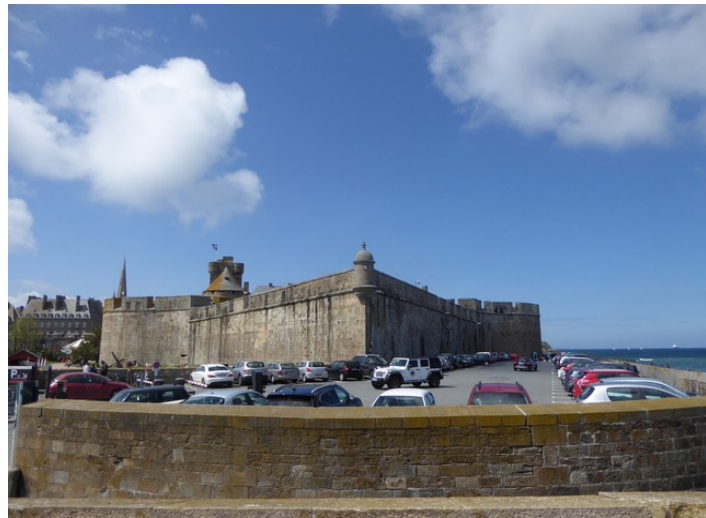
Her er det parkeringsplass.