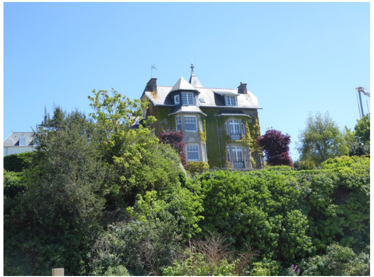
Fint hus rett ovenfor den parkeringsplassen som vi sto på.