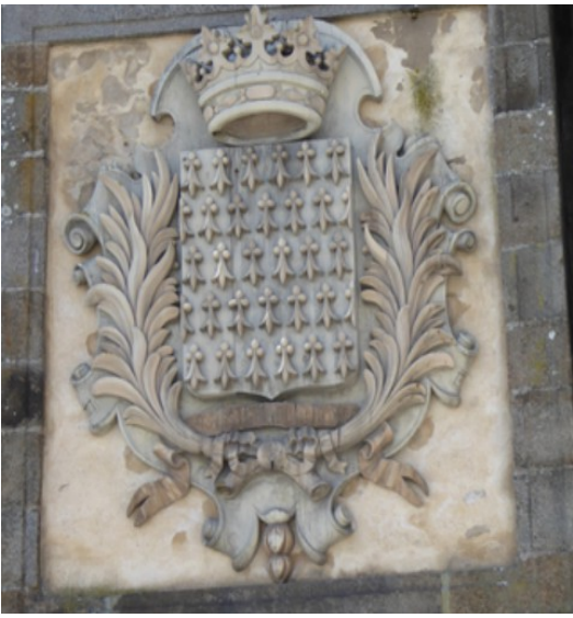
Våpenskjold over porten.