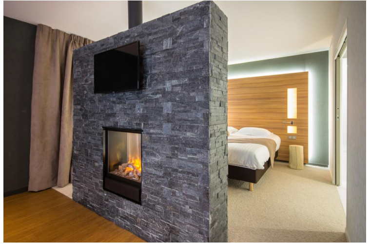
Stilig rom med peis. Peisen på vårt rom fungerte ikke, men det brydde vi oss ikke om.