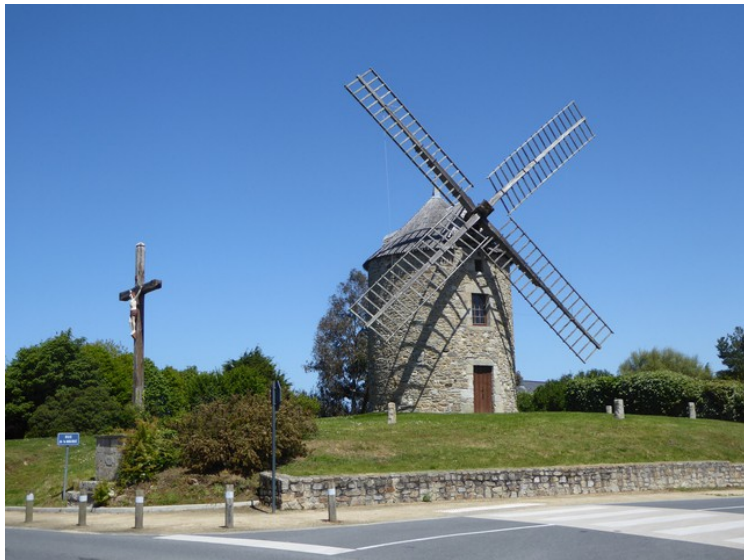
Da vi hadde kjørt rett forbi Lancieux , så vi denne fine vindmøllen.