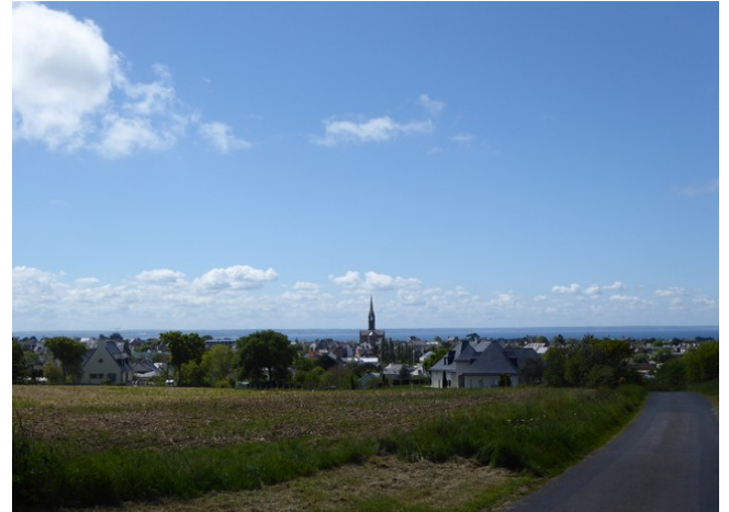
Her kjører vi forbi Pleneuf-Val-Andre . Tok et bilde fra veien.