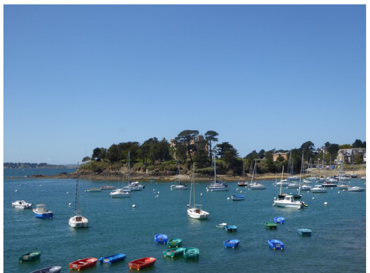
Her har vi kjørt videre og er kommet til Saint-Briac-sur Mer. Vi ser Plage Du Bechet .