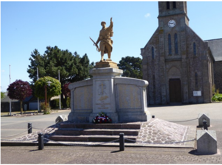
Statuen foran kirken.