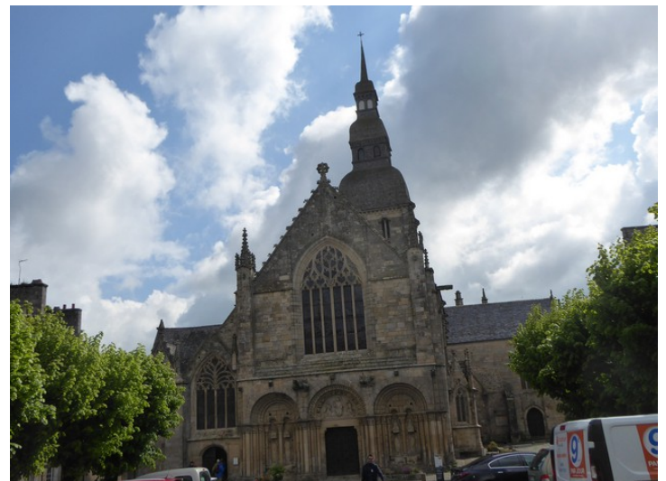
Dette er kirken eller basilikaen Basilique Saint Sauveur de Dinan (Travelguide) sett fra to forskjellige vinkler.