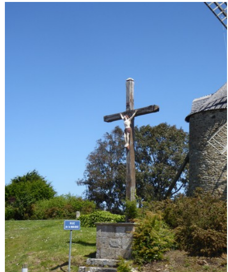
Et krusifiks utenfor møllen.