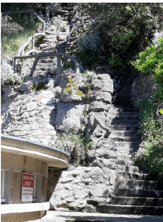
En trapp går opp fra sjøbadet.