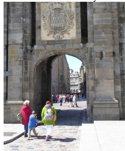
Port gjennom muren.