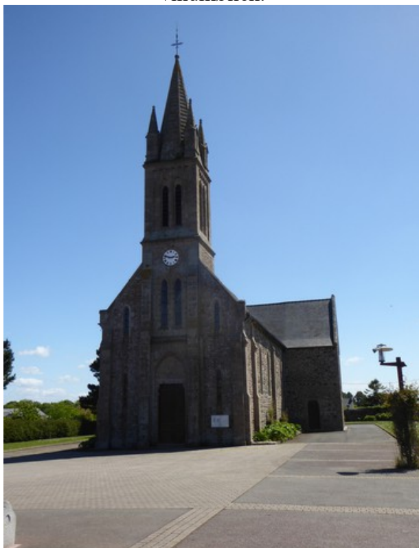
Her er vi i Frehel .