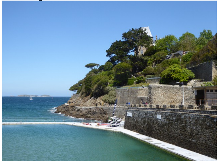
Dette er i nærheten av Pointe du Moulinet , som ligger på halvøya som vi ser til høyre. Her er et offentlig sjøbad, eller basseng, som det er vann i også når det er lavvann.