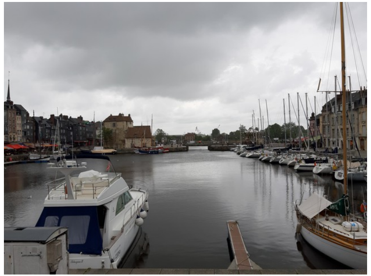
Så kommer vi til havnen.