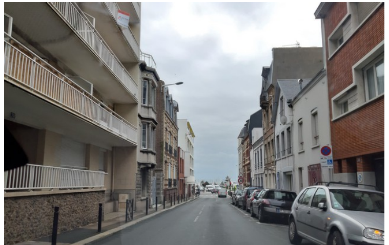
Gjennom gatene i Le Havre.