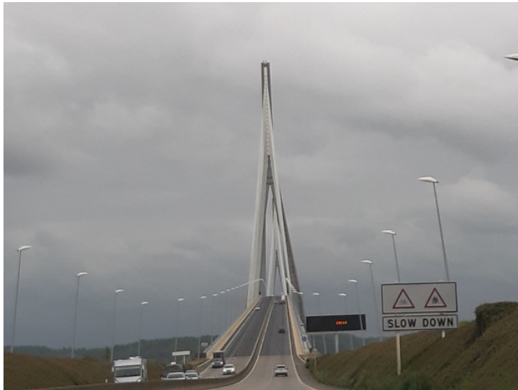
Her kommer vi til brua, Pont de Normandie .