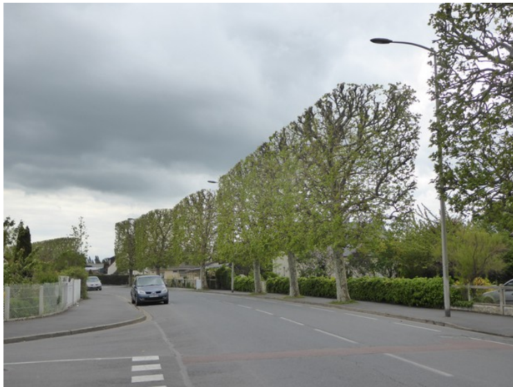
Rett før vi kjører inn i Cabourg, tok jeg dette bildet av en trekke der trekronene var klippet firkantet.