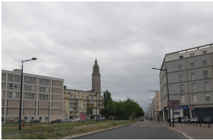
Vi ser St. Josefs kirke .