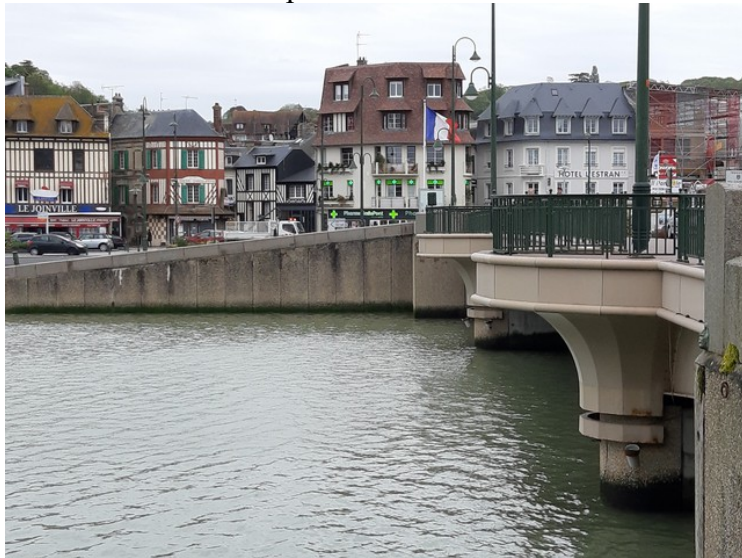
Dette er brua som går over elva mellom de to bydelene.