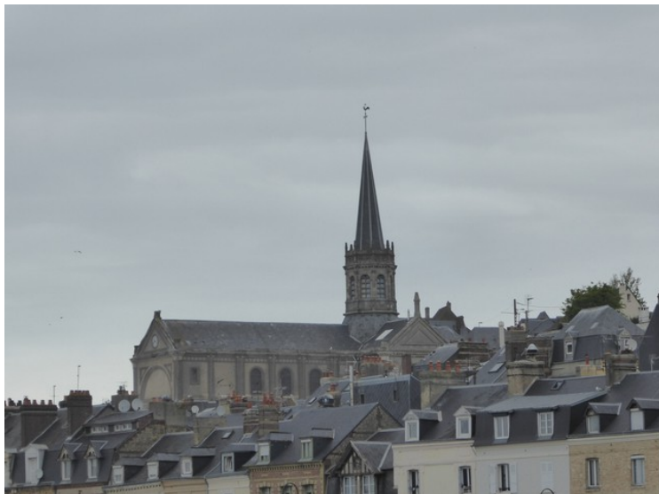
Dette er Église Notre-Dame-Des-Victoires .