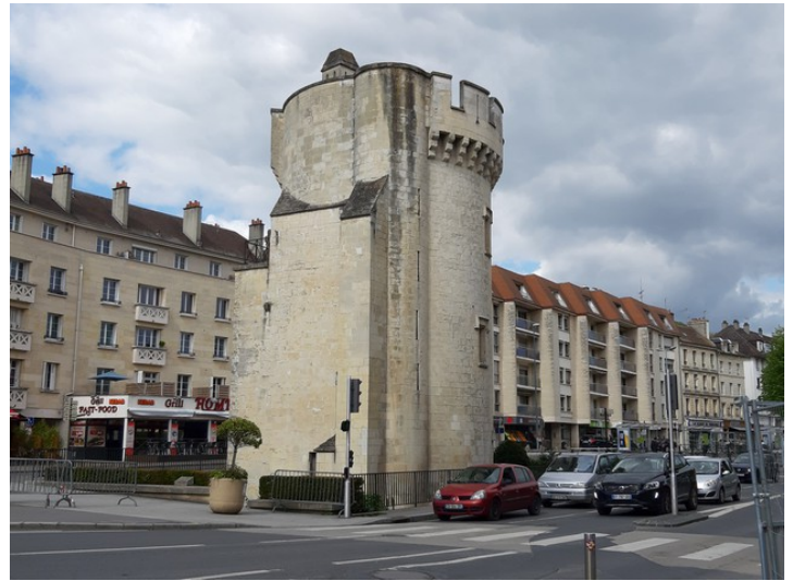
Slik ser det ut på andre siden. Det sto i forbindelse med forsvarsmurer som ikke eksisterer lenger.