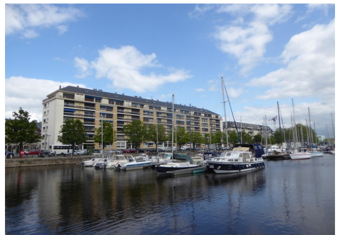
Vi kjørte videre til Caen. Dette er ved kanalen som går fra havet og inn til byen.