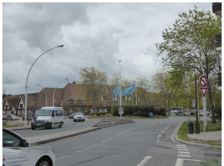
Så kom vi til Deauville.

Deauville (Normandie-tourisme) og Trouville-sur-Mer (Normandie-tourisme) er to nabobyer som ligger på hver sin side av elva La Touques. Begge er populære feriebyer.