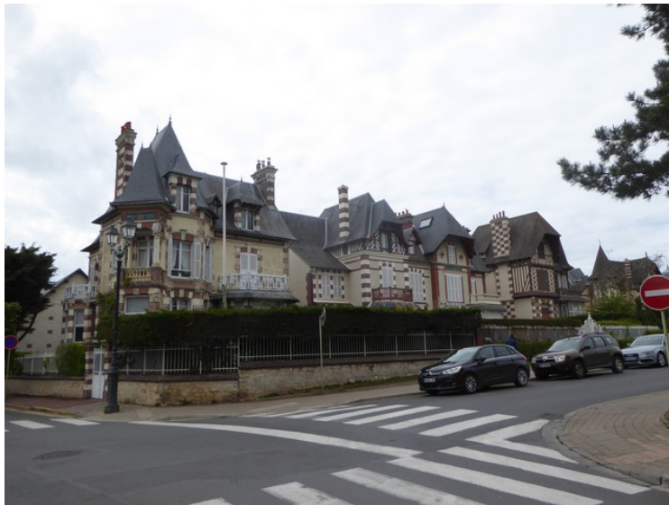
Vi kjører videre inn i Cabourg.