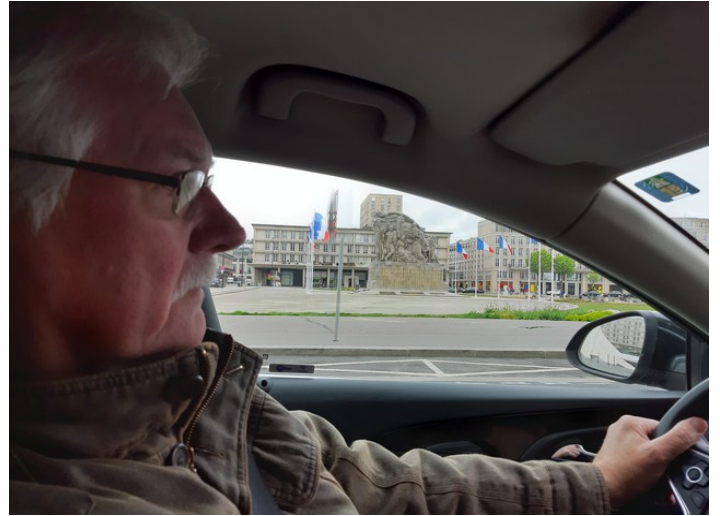
Så kjører vi videre med en alvorlig, ansvarsbevisst og dyktig sjåfør.