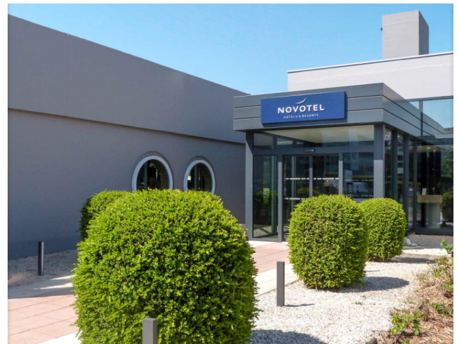
Vi bodde på Novotel Caen Côte de Nacre i utkanten av byen.