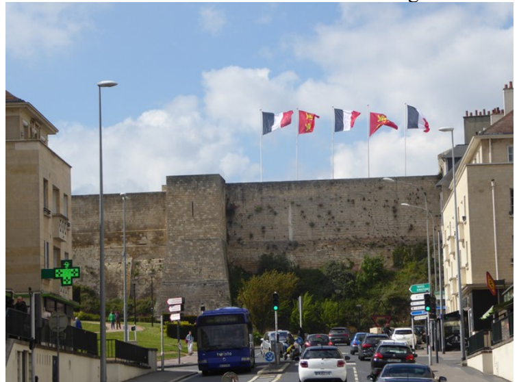
Her ser vi opp mot Caen Castle . Det ble bygget av Wilhelm Erobreren i 1060.