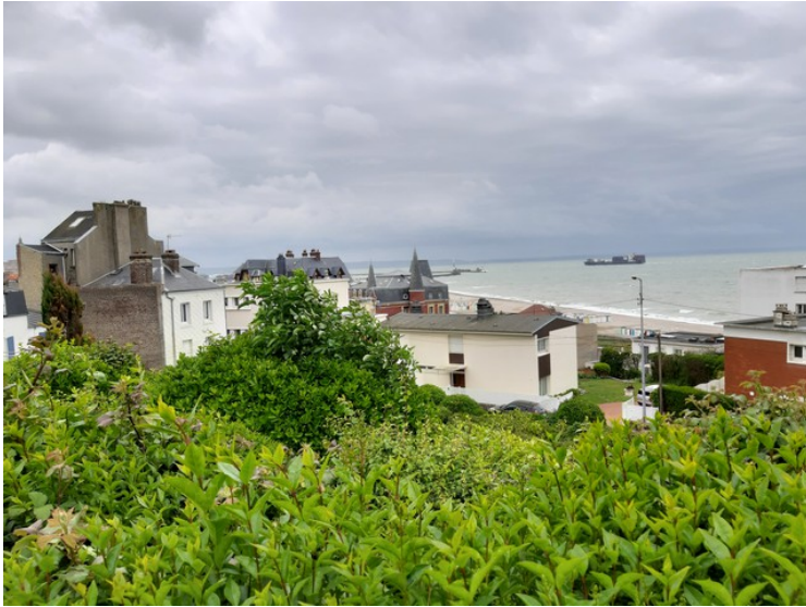
Utsikt fra statuen mot havnen.