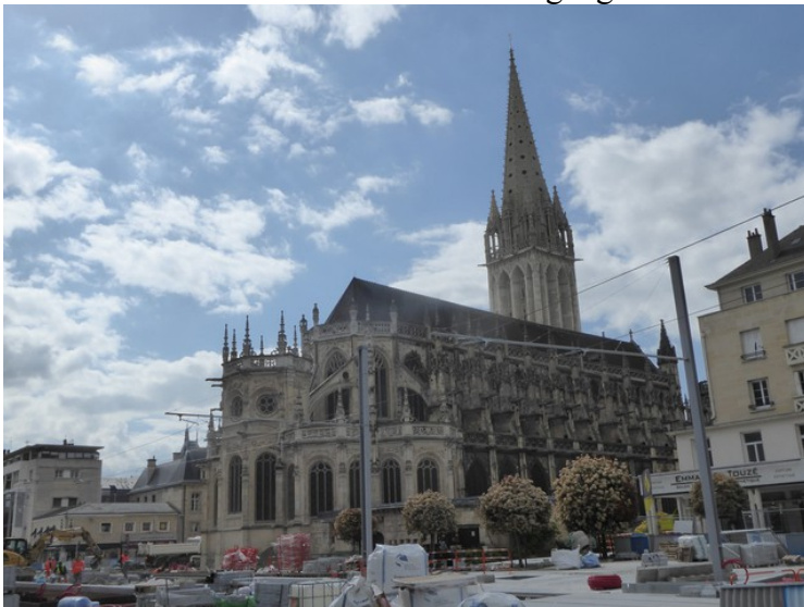
St Peter's Catholic Church