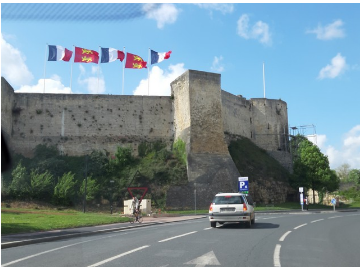
Veien videre gikk forbi borgen.