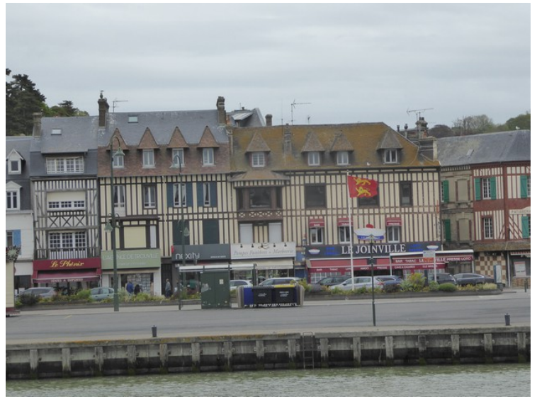
Hus i Trouville.