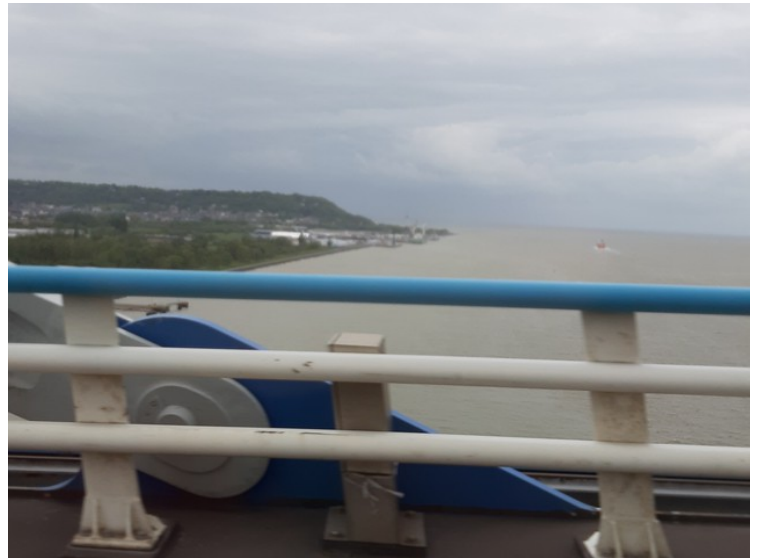
Her ser vi Seine som renner ut i Den engelske kanal.