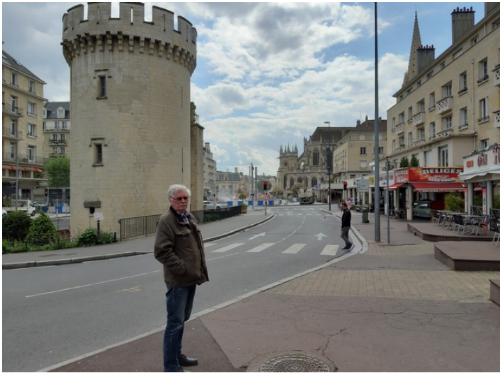
Her står jeg ved Tour Guillaume Le Roy . Det er et forsvarstårn som er nevnt første gang i 1497.