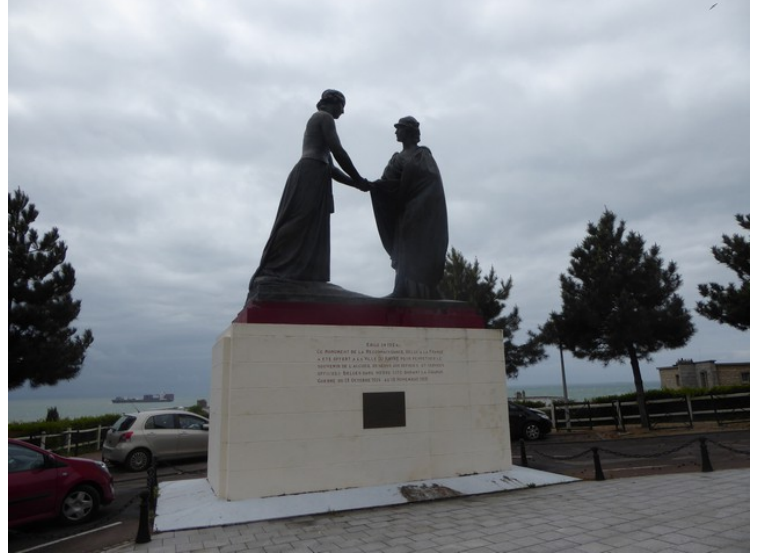
Statue gitt til Le Havre i 1924 pga. at den belgiske regjeringen fikk oppholde seg her fra 1914 til 1918.