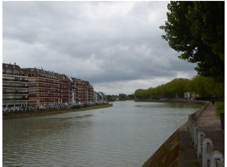
Utsikt lenger oppover elva.