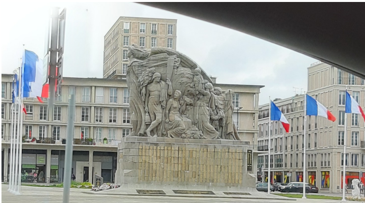
Et forstørret utsnitt fra bildet over til høyre. Dette er et krigsminnesmerke som heter «Monument aux morts». Det ble avduket i 1924.