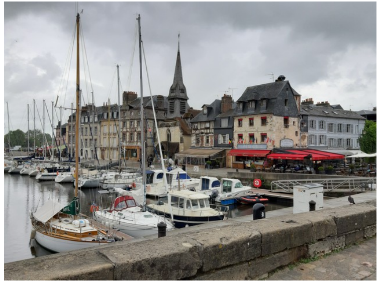
Dette er den indre havnen i Honfleur. Det begynte å regne da vi kom hit, så det fristet ikke så veldig å gjøre noe mer sightseeing.