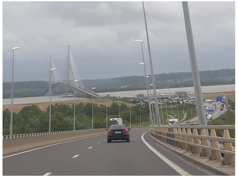
Vi skal snart kjøre over Seine .