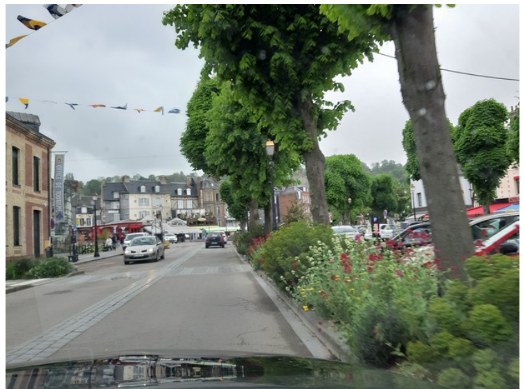
Her kommer vi til Honfleur .

Den er særlig kjent for sin gamle, vakre og maleriske havn, preget av hus med skiferdekte fasader, ofte malt av kunstnere.