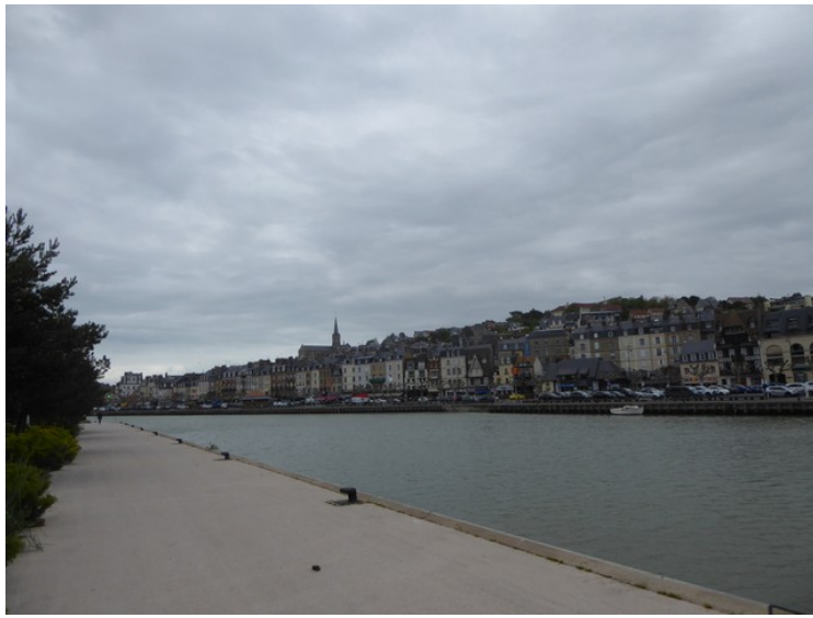
Dette er elven La Touques . Trouville-sur-Mer ligger på andre siden. Vi står på den siden som heter Deauville.