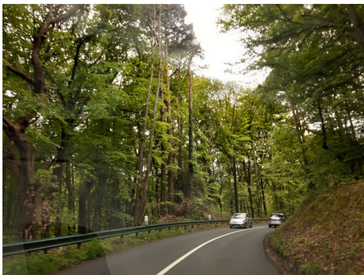
Her kjører vi videre. Det var ganske tettbevokst enkelte steder.