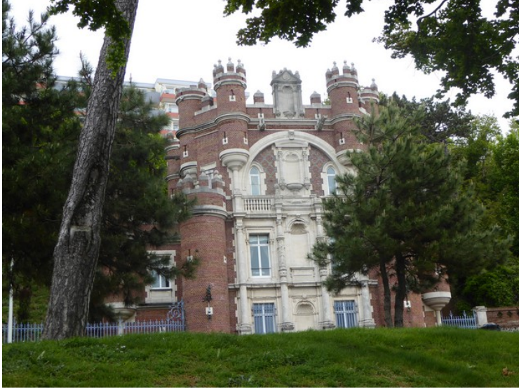
Le Château des Gadelles fra 1886, en kopi av et porthus i borgen "Arco de Santa Maria" i Burgos, Spania.

Le Havre ble grunnlagt i 1517 som Franciscopolis etter Frans I av Frankrike. Le Havre betyr havnen. Etter invasjonen av Normandie i 1944 ble byen massivt bombet. 5 000 ble drept og 12 000 hjem ble helt ødelagt. Etter krigen ble byen bygget opp på nytt. I juli 2005 ble byplanen oppført på UNESCOs Verdensarv-liste.