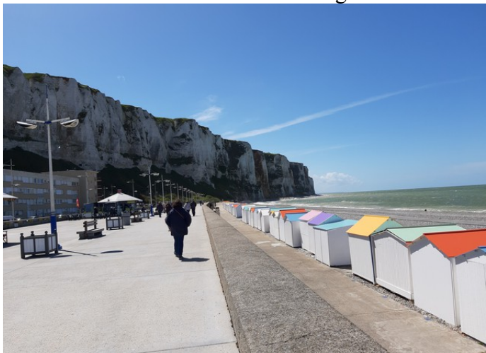
Klipper på sydsiden av byen.