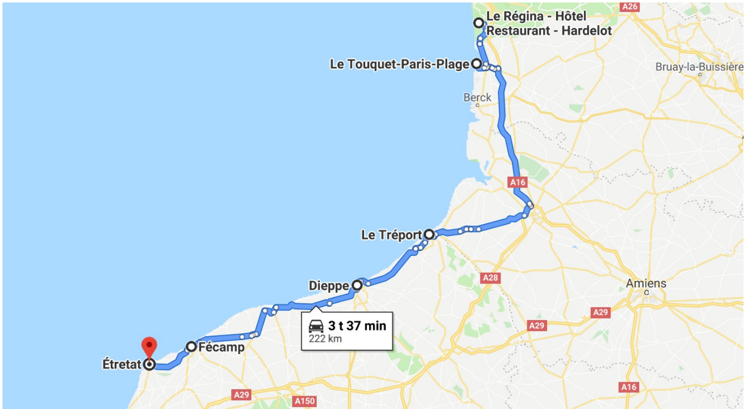
Dette var kjøreruten den 8. juni.