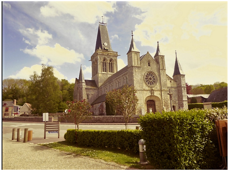
Vi stoppet og hadde en kaffe i Le Bourg-Dun . Rett ved siden av lå denne kirken,