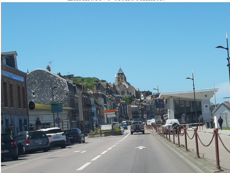
Så kom vi til Le Tréport.