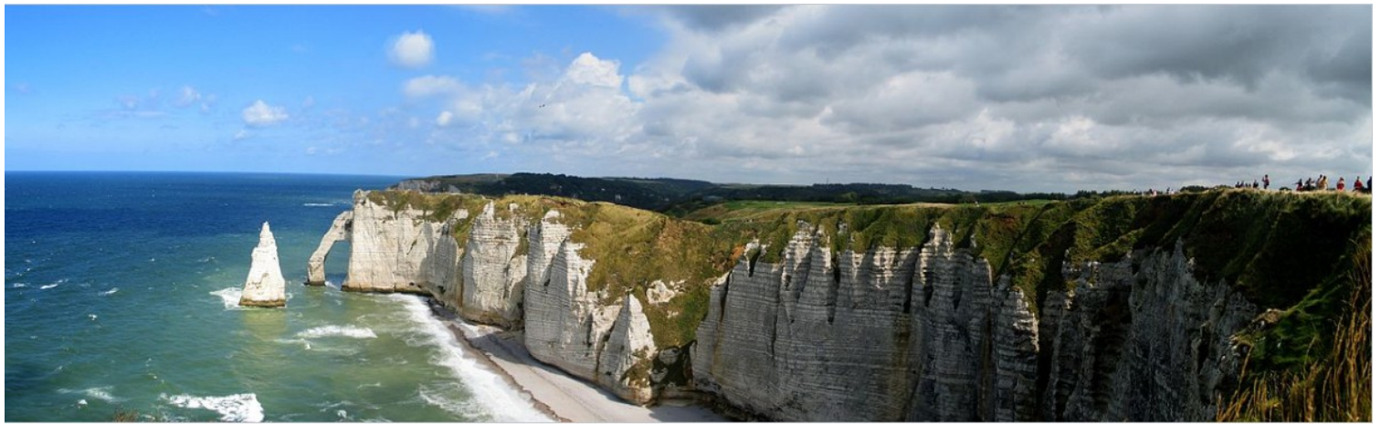
Dette er klippene på sydsiden av byen.