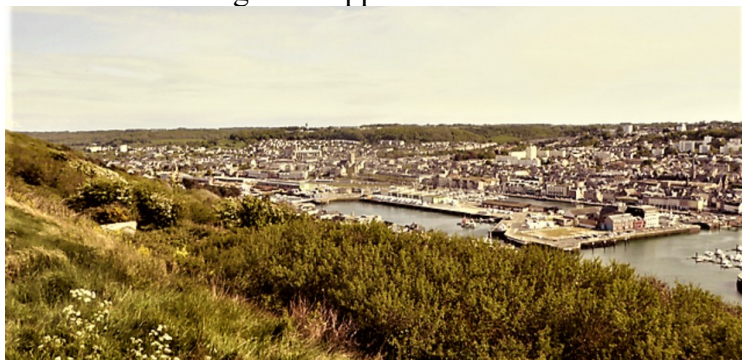
Fécamp innenfor havnen. Fécamp er mest kjent for Benediktiner-klosteret som har gitt navn til en likør. Klosteret var også sentralt med å hjelpe Wilhelm Erobreren til å ta England.