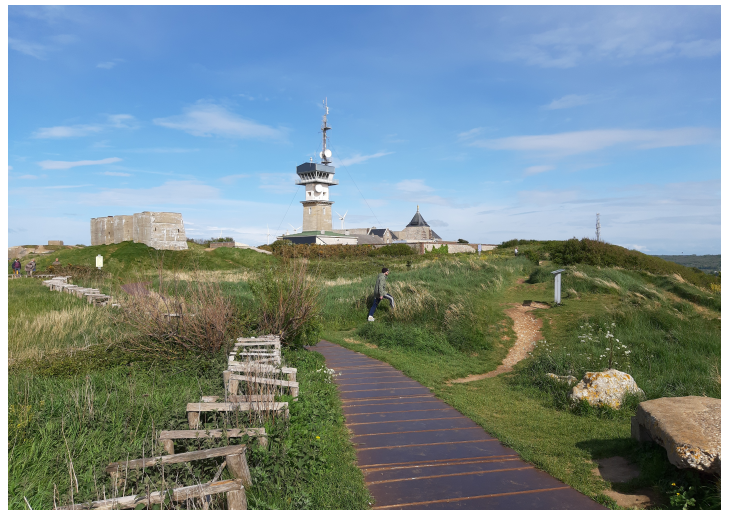
På vei tilbake til bilen.