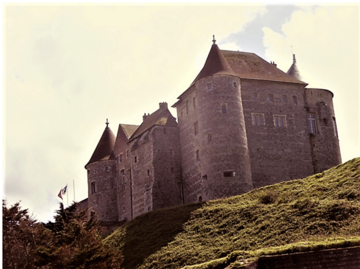
Château de Dieppe fra 1188.