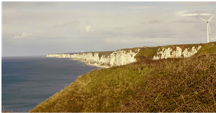
Her er vi på et utkikkspunkt nord for Fécamp, på Cap Fagnet. Klippene nordover.