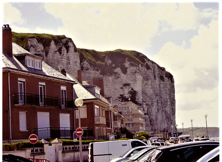
Klippene ved Dieppe.