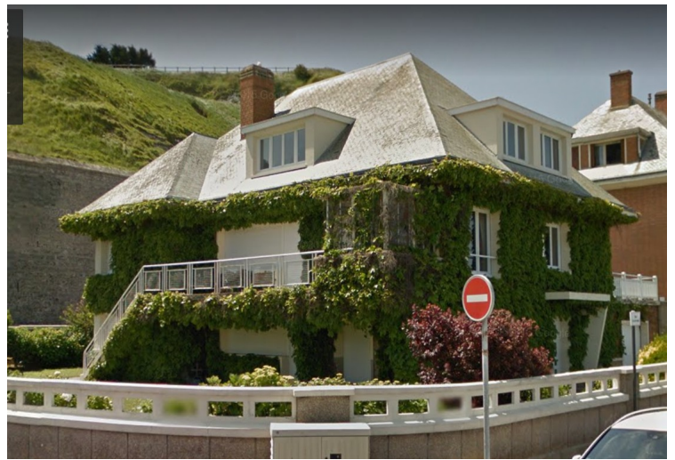
Bevokst hus i Dieppe.