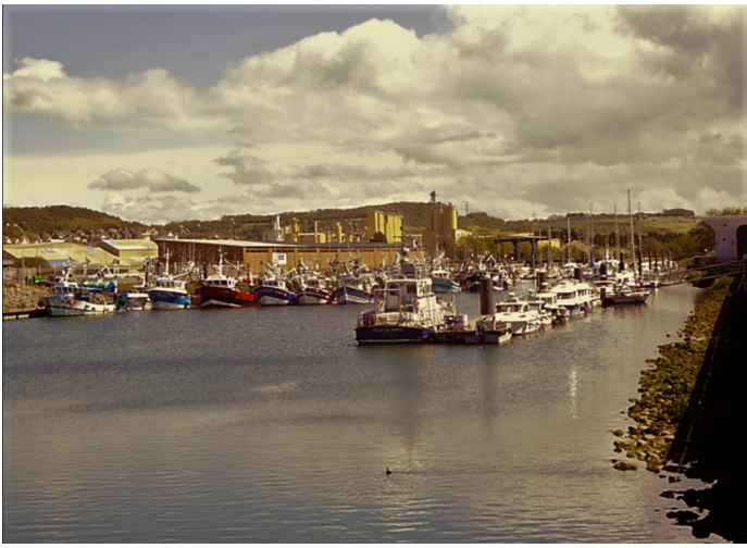
Det er mange båter i marinaen.