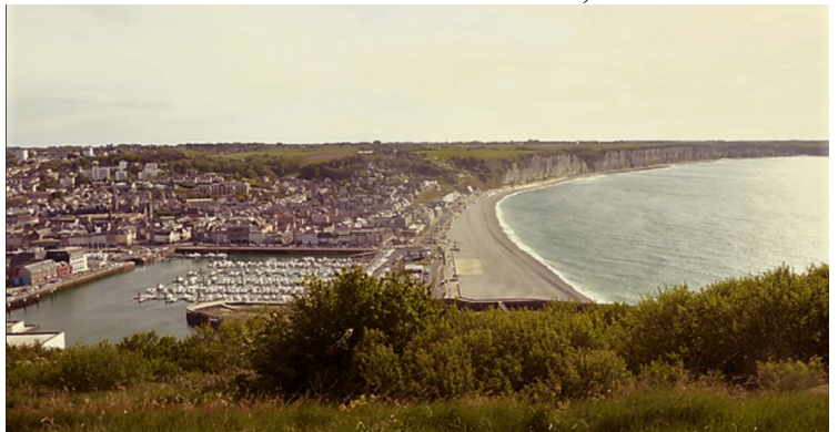
Fécamp og klippene syd for byen.