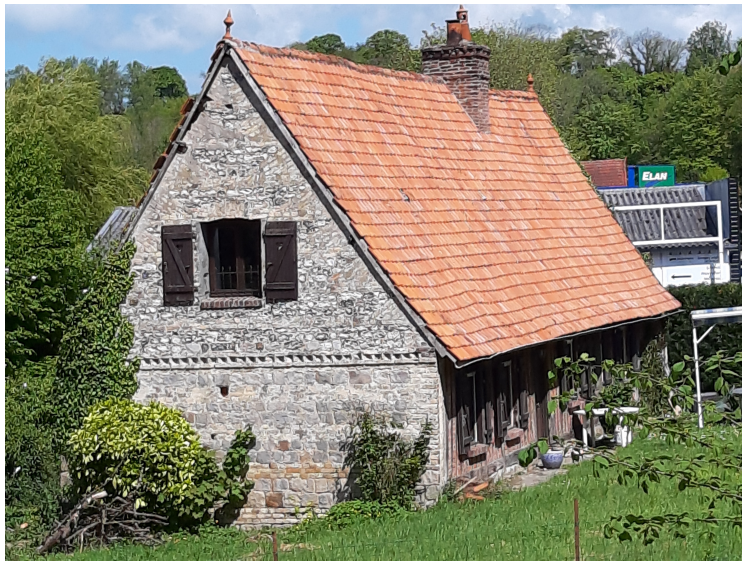
Fint hus ved veien.