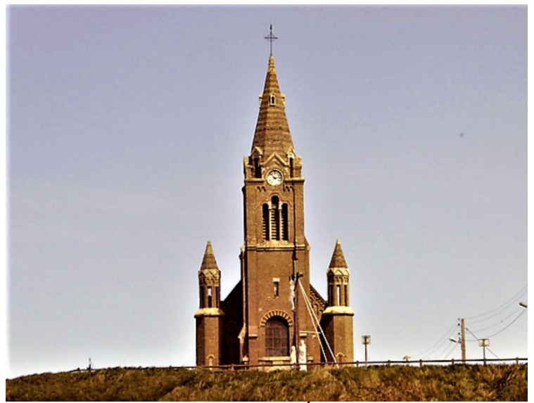
Jeg måtte ha et bilde av kirken, Église Catholique Notre Dame de Bonsecours, som ligger på en høyde

Dieppe er en havneby ved Den engelske kanal, berømt for sine kamskjell.