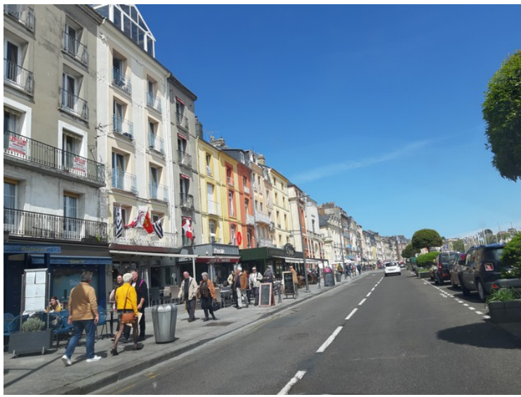
Vi kjørte også innom Dieppe.