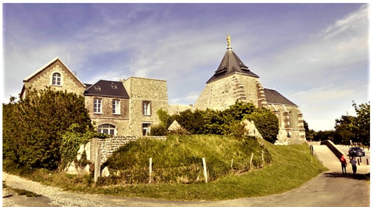
Her oppe ligger også kirken Notre-Dame-du-Salut.