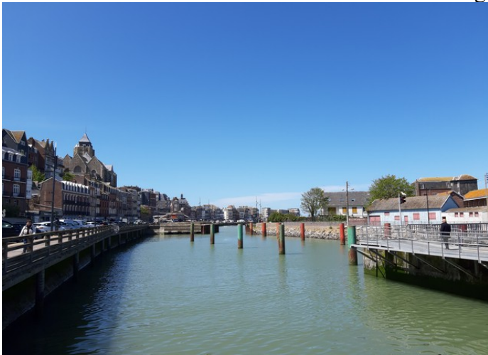
Her ser vi fra marinaen i retning av havet.