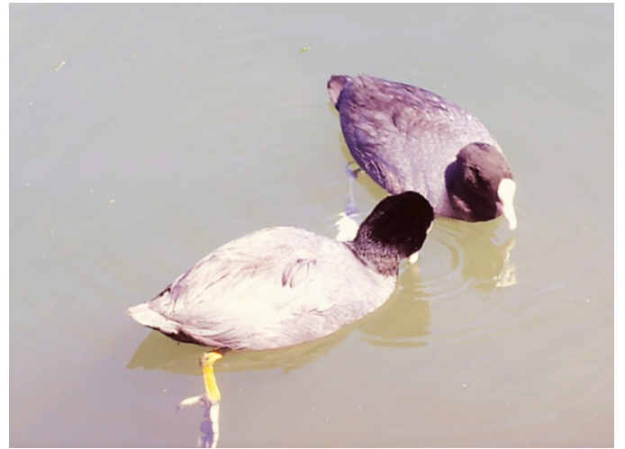
Det er ikke bare båter i marinaen.