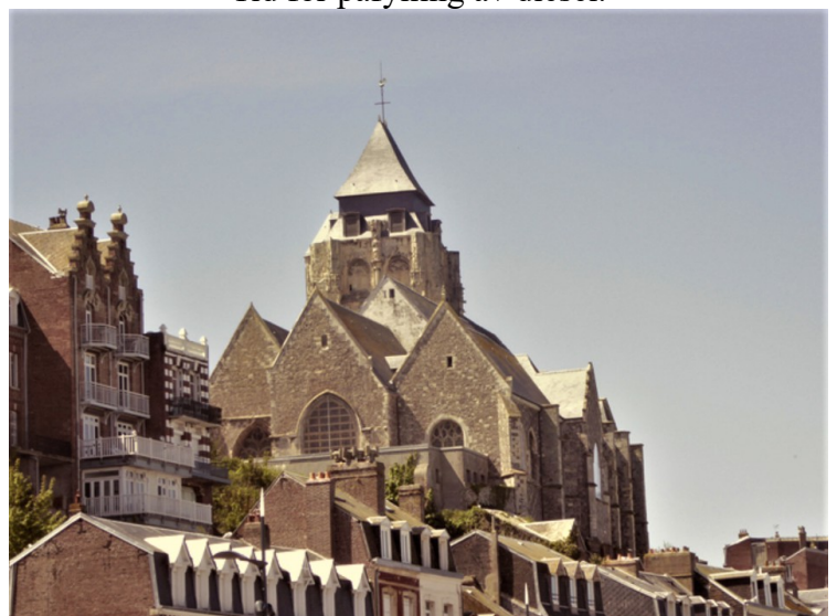
Her har jeg zoomet inn på kirken.

Le Tréport er en fiskerlandsby og en ferieby. Elven Bresle renner ut her. Det er kalkklipper på begge sider.