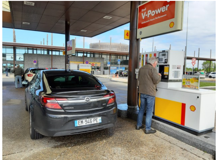
Tid for påfylling av diesel.