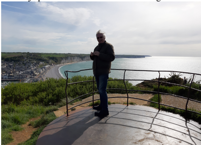
Her står jeg ytterst på utsiktspunktet.