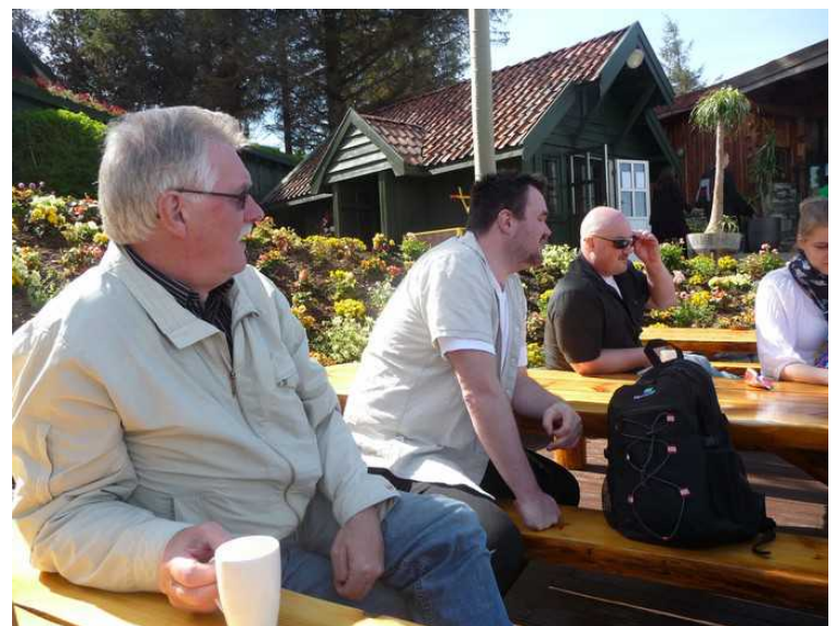
Det var fint vær denne dagen, og godt og varmt i sola. Det var mange grader varmere her enn i Stavanger.