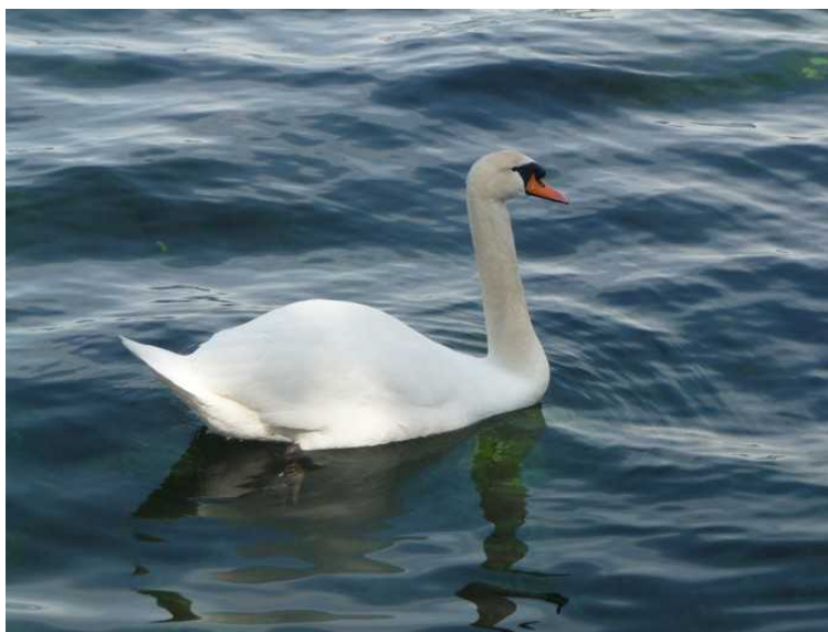
Her har vi fått besøk av en svane.