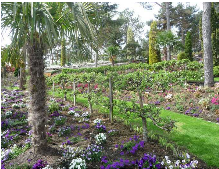
Epletrær som er formet som hekk.