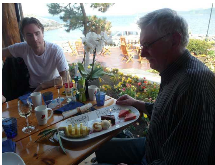
Bursdagsbarnet starter på desserten.