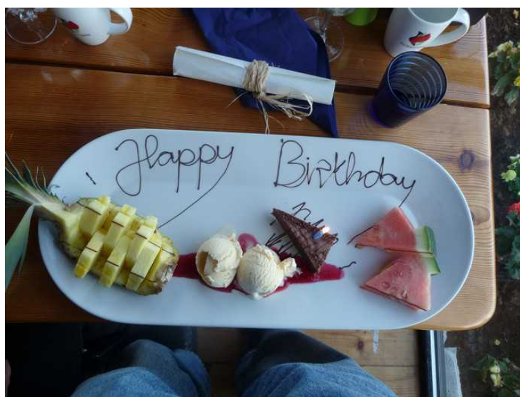
De visste at det var en bursdagsfeiring, så de hadde laget en spesialdessert.