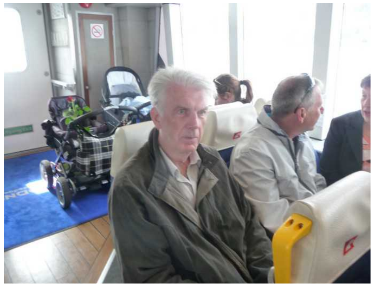
Ombord. Båten tar 97 passasjerer og den var nesten helt full.