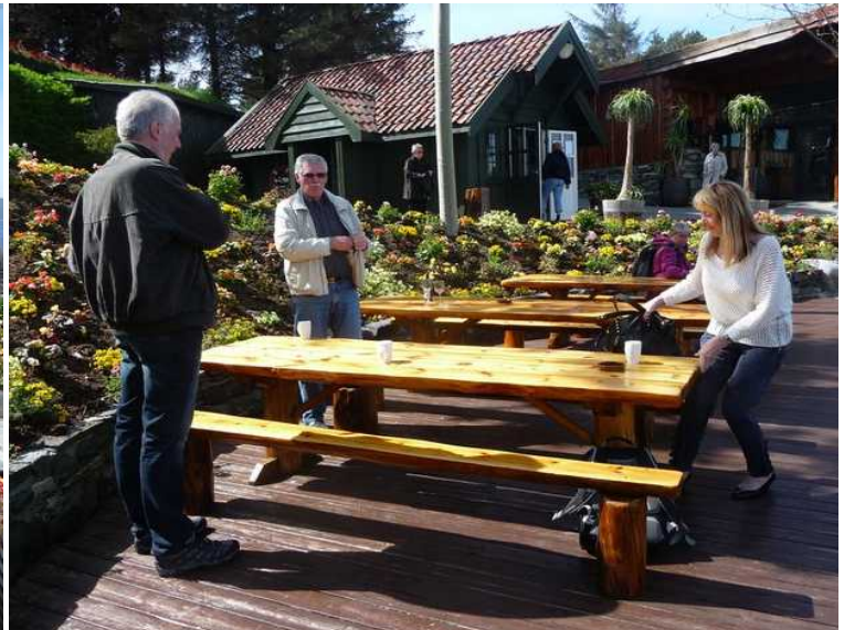
Etterpå tok vi kaffen med ut i hagen.