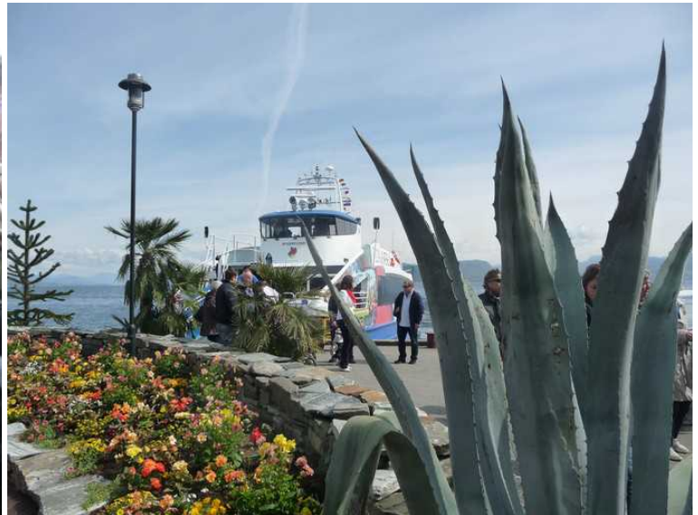
Her er vi fremme. Det var først en omvisning i litt av hagen, og her følger en serie bilder derfra.