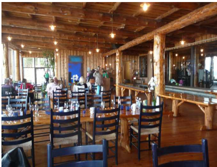
Restauranten er ganske stor, og den fyltes opp. Det var en tilsvarende restaurant i naborommet, som også var full da vi var der.