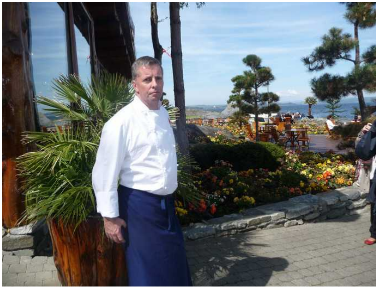
Her er kokken igjen. Han ser litt alvorlig ut, og han påsto at han aldri smilte.