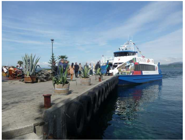
Her er båten innom med flere gjester. I fjor hadde det vært over 35 000 i sesongen mai – september.