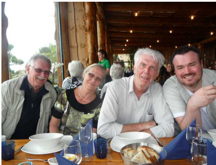
En lystig gjeng.