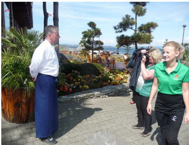
Her har vi kokken.