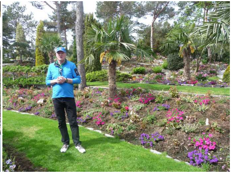
Han som driver stedet viste oss rundt.