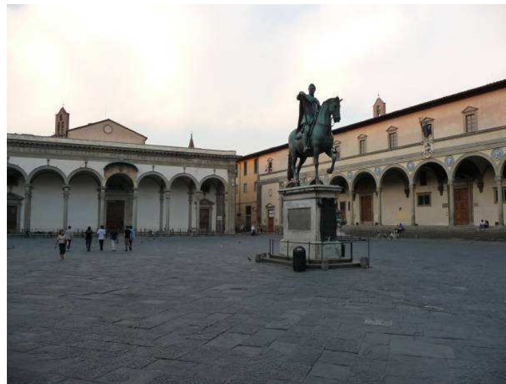
Her er vi i Spedale degli Innocenti som åpnet i 1444 som Europas første barnehjem