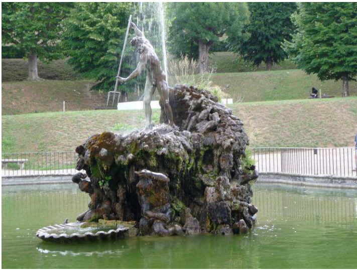
Enda lenger oppe var det en dam med fontene i