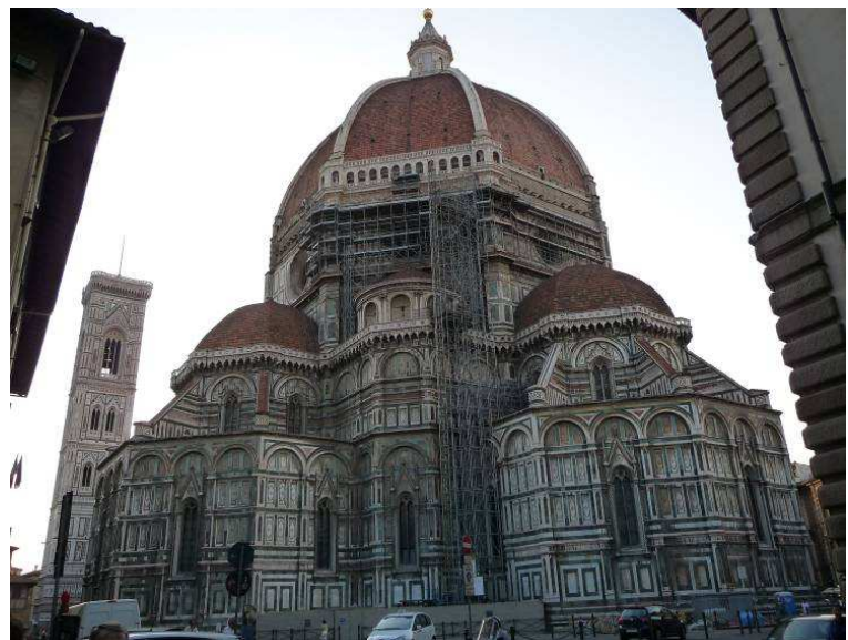
Dette er kuppelen på domkirken sett fra baksiden. Kuppelen var den største som på sin tid var laget uten stillaser.