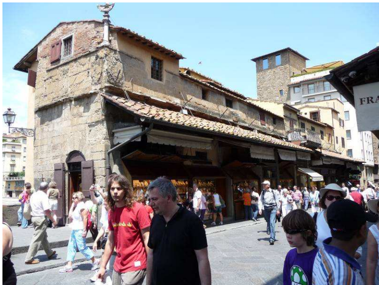
Salgsboder på broen