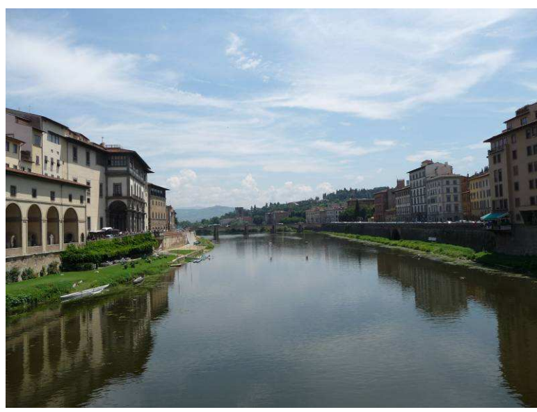
Utsikt fra broen oppover elven