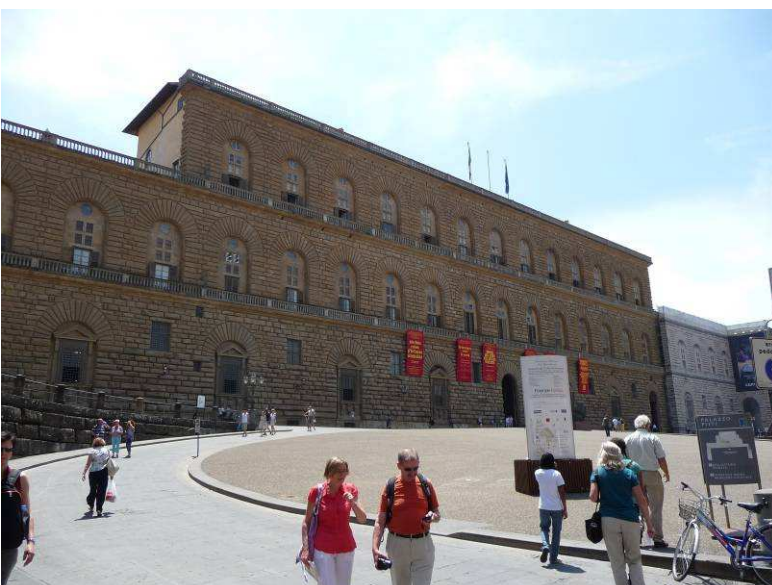
Her er vi kommet over broen og bort til Piazza de' Pitti. Bygningen er en del av Palazzo Pitti.