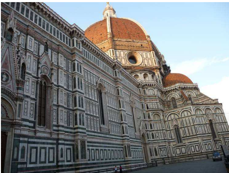
Langveggen og kuppelen (91m høy) som ble ferdig i 1463. Kirken er Europas fjerde største kirke. Den er den dag i dag Firenzes høyeste bygning