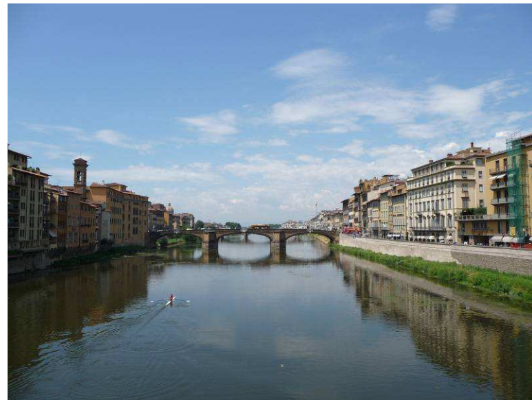
Utsikt nedover elven