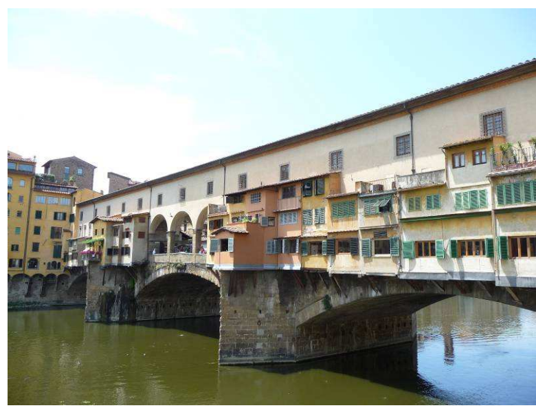
Her er vi kommet ned til broen