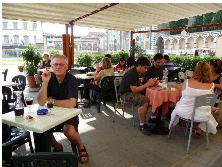
Her er vi kommet til Firenze og sitter på en kafé på Piazza Santa Maria Novella

Elven Arno renner gjennom Firenze. Som mange elver i Middelhavsområdet varierer vannføringen fra en voldsomt brusende, breddfylt smeltevannsflod på våren til en stille rislende bekk på bunnen av elveleiet om høsten. Dette har ofte ført til oversvømmelser og jordskred. I 1966 førte oversvømmelse i Arno til at dusinvis av mennesker omkom og flommen skadet utallige mesterverk innen kunst og sjeldne bøker i Firenze. Nyanlagte demninger høyere opp har gjort det mulig å utjevne vannføringen, slik at florentinerne kan leve mer trygt ved sin elv.