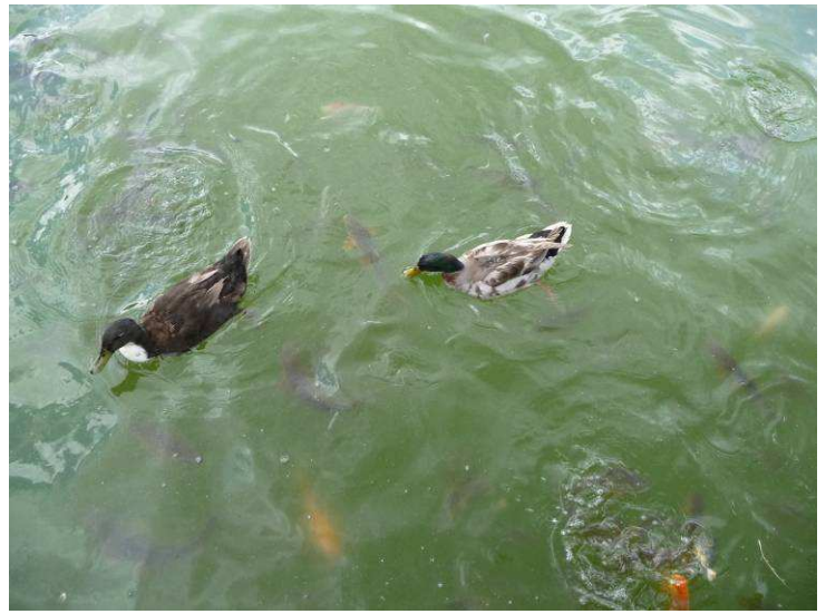
Her er ender som vi matet

Nedenfor følger diverse bilder fra parken