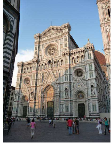
Dette er fronten på domkirken som heter Santa Maria del Fiore