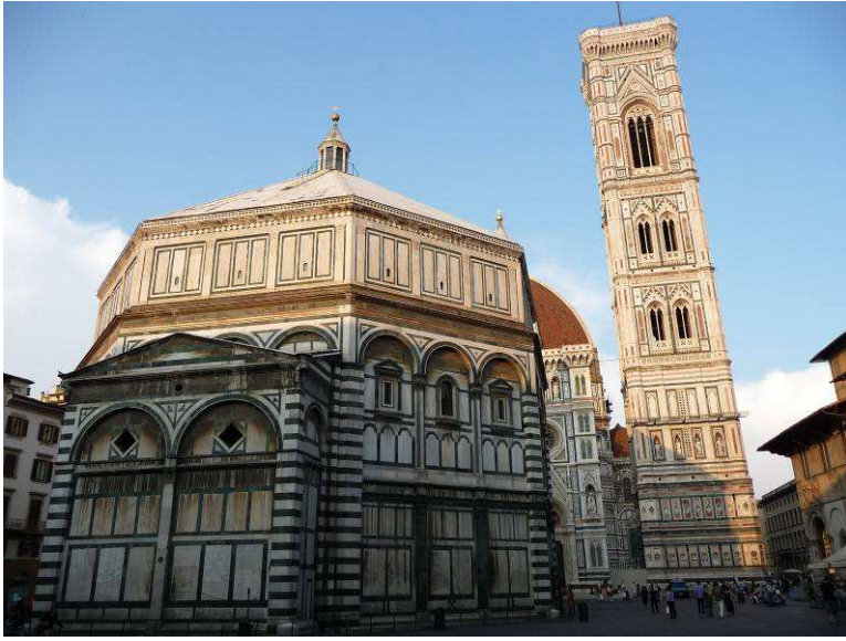
Baptisteriet, Battistero di San Giovanni, og Florentin Giotto's klokketårn (85m høyt) står foran domkirken.