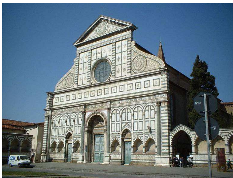
Denne kirken, Santa Maria Novella, ligger i ene enden av plassen.