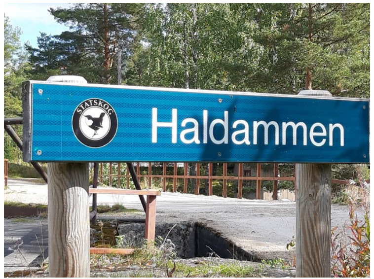
Statskog eier området her.

Haldammen er et fredet damanlegg for tømmerfløting i den sydlige enden av Halsjøen på Finnskogen i Våler kommune i Hedmark. I gammel tid spilte sjøen og anlegget en sentral rolle under tømmerfløtingen, fra det første vannhulet og kvern ble bygget på slutten av 1600-tallet og frem til fløtingen opphørte i 1981. I 1804 var den første demningen ferdig. Hvert år, i begynnelsen av juni, arrangeres Haldamsdagene. Mens disse pågår vises gamle håndverkstradisjoner, og besøkere får prøve seg. I løpet av disse dagene demonstreres også tømmerfløting, og tømmerlippet over Haldamstupet finner sted når damvannet slippes.