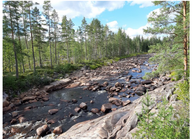
Vi har kjørt langs elva Flisa helt fra stedet Flisa. Rett før vi kommer til Halsjøen, krysser vi elva. Det er lite vann elva. Utsikt sydover.