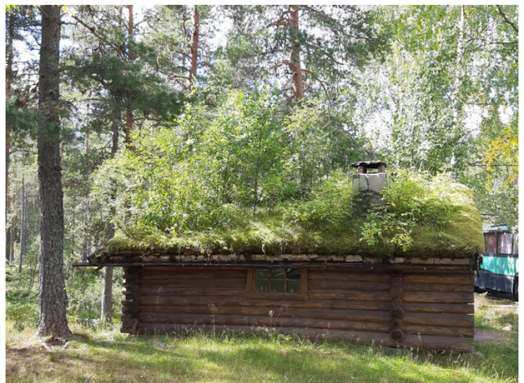
Ved dammen står det en hytte med skog på taket.