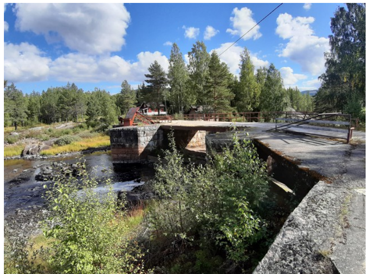
Demningen sett fra oppsiden.