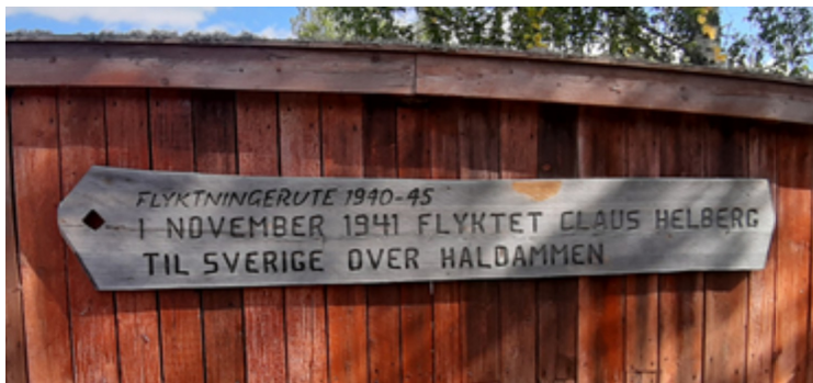
Det gikk en flykningerute til Sverige her under krigen.

Haldammen er et fredet damanlegg for tømmerfløting i den sydlige enden av Halsjøen på Finnskogen i Våler kommune i Hedmark. I gammel tid spilte sjøen og anlegget en sentral rolle under tømmerfløtingen, fra det første vannhulet og kvern ble bygget på slutten av 1600-tallet og frem til fløtingen opphørte i 1981. I 1804 var den første demningen ferdig. Hvert år, i begynnelsen av juni, arrangeres Haldamsdagene. Mens disse pågår vises gamle håndverkstradisjoner, og besøkere får prøve seg. I løpet av disse dagene demonstreres også tømmerfløting, og tømmerlippet over Haldamstupet finner sted når damvannet slippes.