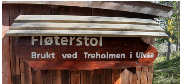
Dette er en fløterstol. Den hang på en stålkabel over Ulvåa slik at fløteren kunne komme til tømmerknuter under fløtingen. Den ble også brukt til transport over elva.