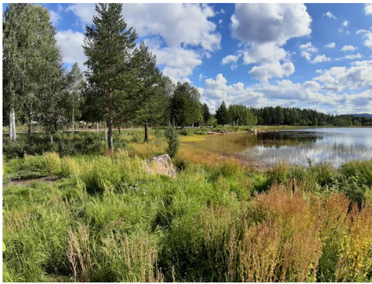
Utsikt langsetter sjøen.