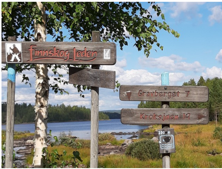
Skilt som viser til Gravberget og Kroksjøen. Finnskogleden går også her.