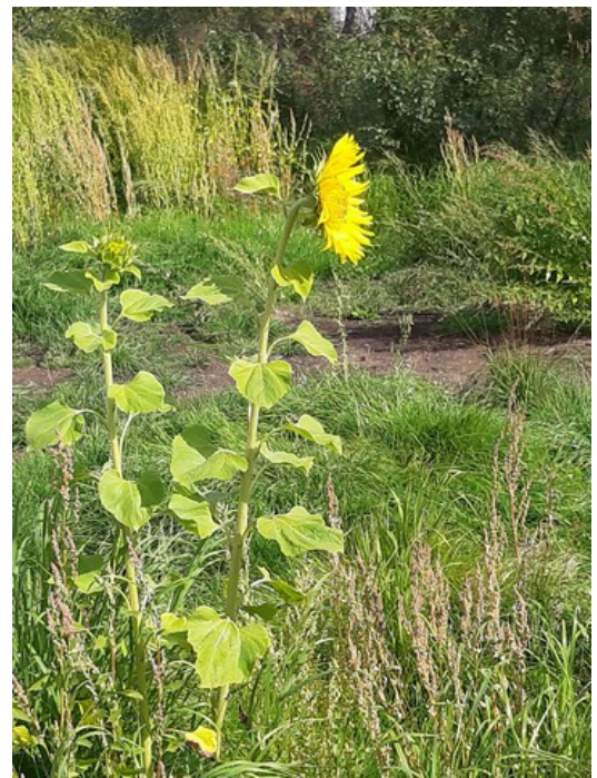
Det vokser en solsikke her.