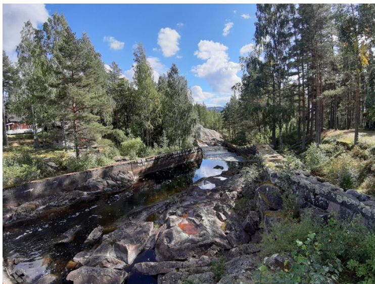
Utsikt fra demningen og nedover Halåa. Halåa og Ulvåa renner sammen litt lenger nede og danner Flisaelva.