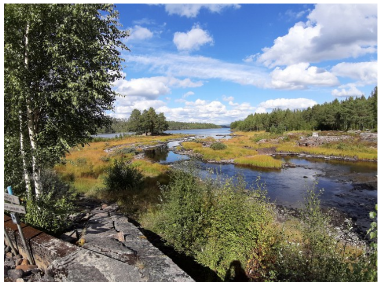
Utsikten oppover Halåa mot Halsjøen.