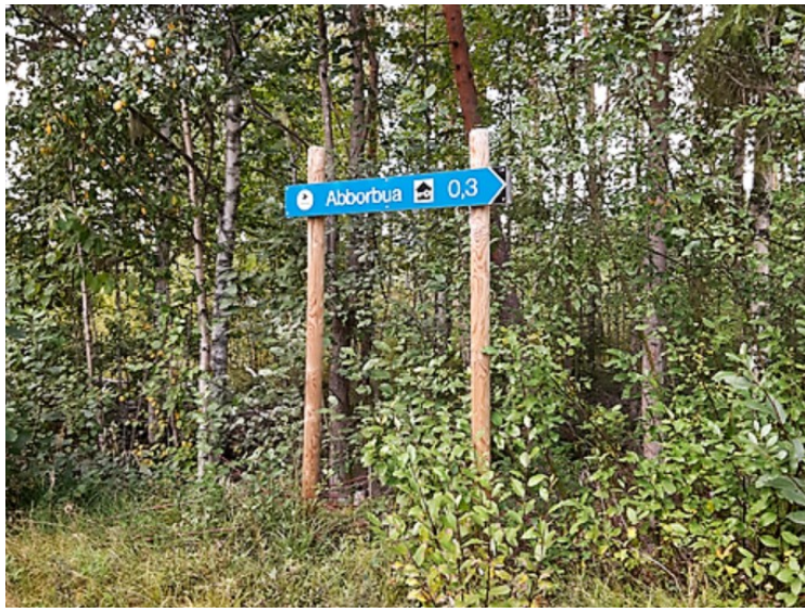
Neste stopp var ved Abborbua .