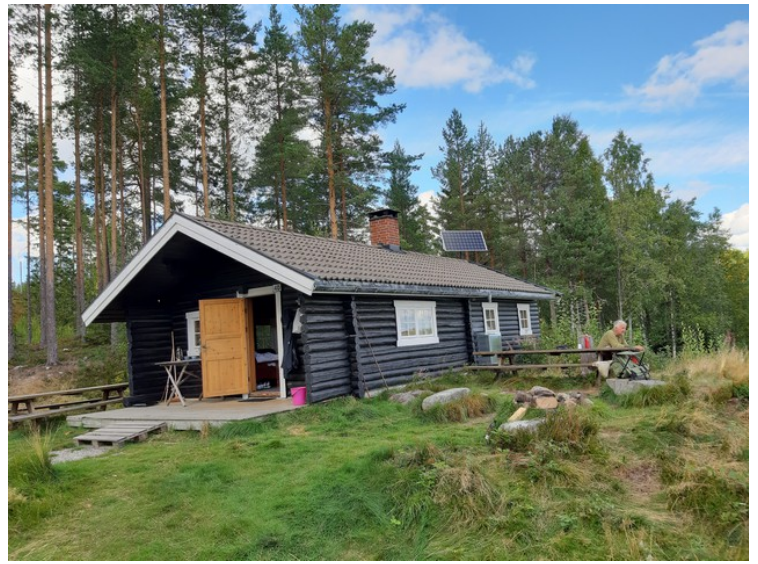
Abborbua kan leies.