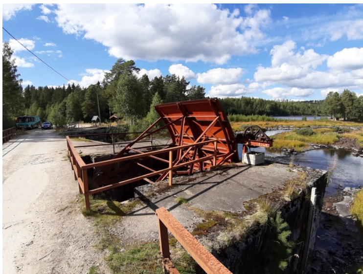
Dette er mekanismen som opererer damluka som kan stenge og åpne for vannet.