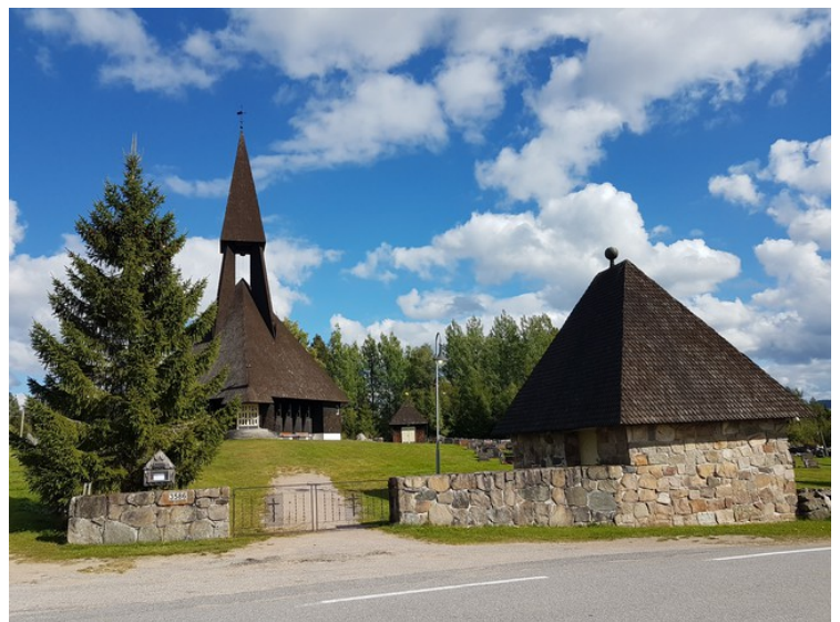
Gravberget kirke . Kirken ble gitt av Borregaard AS som gave til befolkningen i bygda. Borregaard Skoger eier omtrent alt av skog i området, og de fleste som bodde i Gravberget jobbet på tidligere for firmaet. Kirken er av Life kåret til et av de ti mest særpregede kirkebygg i verden. Kirken er formet som et grantre, og er en slags moderne stavkirke.