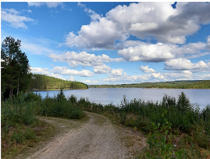
Utsikt over Halsjøen fra Abborbua.