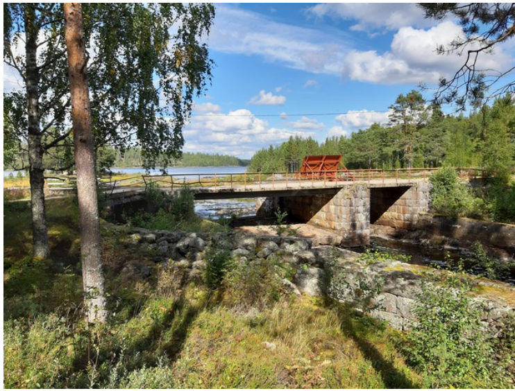
Her ser vi demningen, Haldammen.