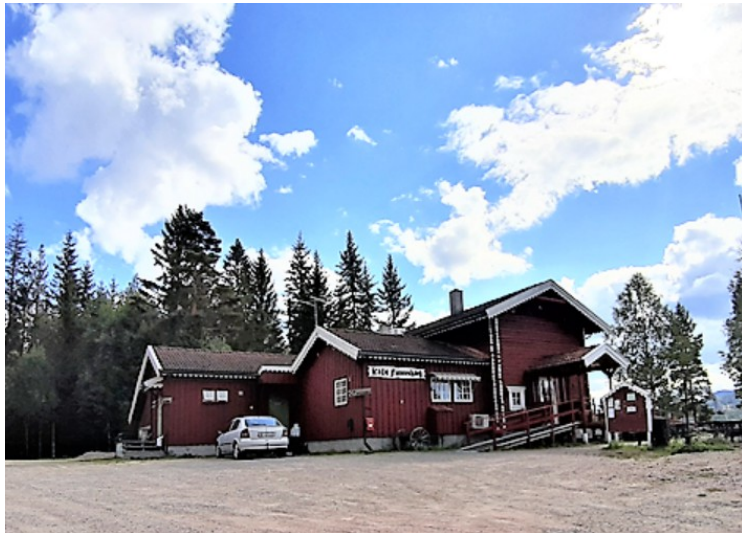
Ikke langt fra kirken ligger Cafe Finnskog .