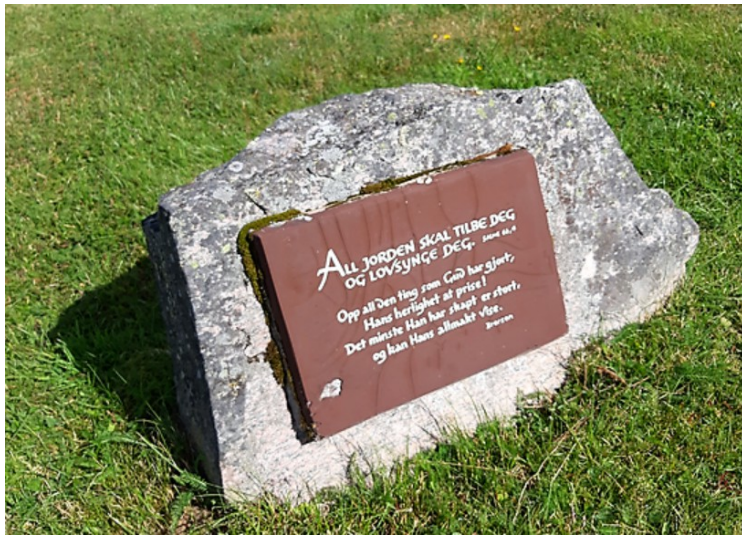
Innskrift på en stein.