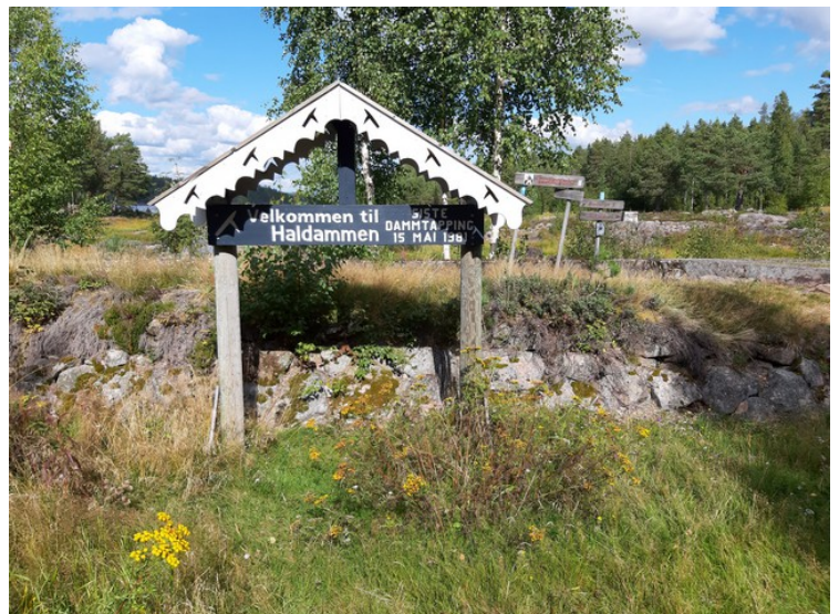
Ved Haldammen i enden av Halsjøen .