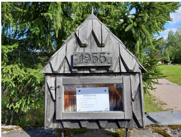
Så har vi kjørt videre til Gravberget . En plakat ved inngangen til kirkeområdet.