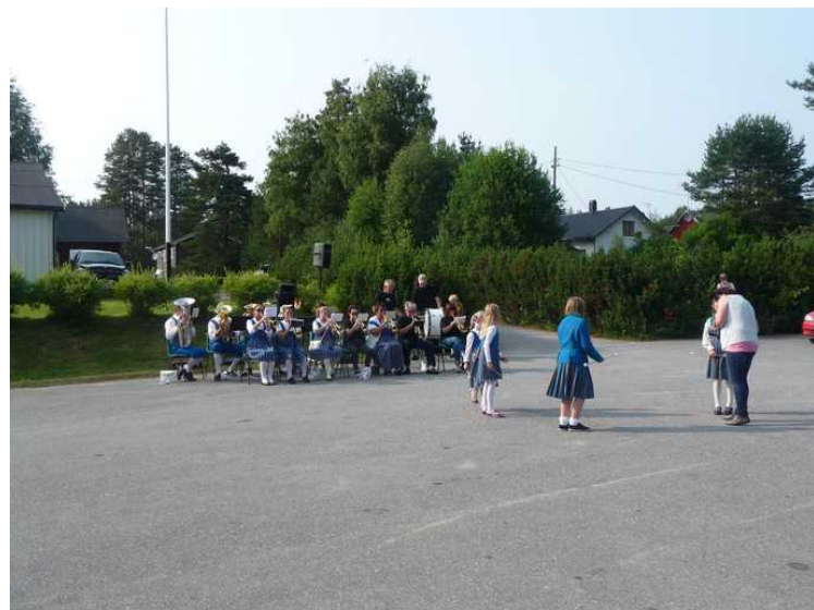
Skolekorpset spiller og drilljentene gjør seg klar.