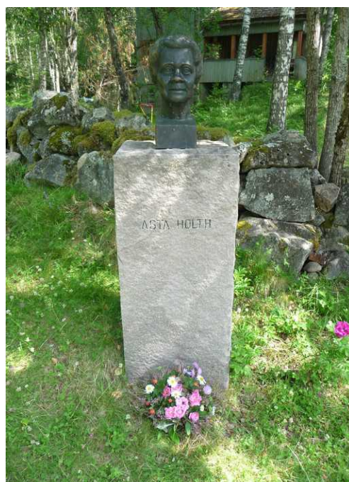
En byste som er laget av Skule Vaksvik.