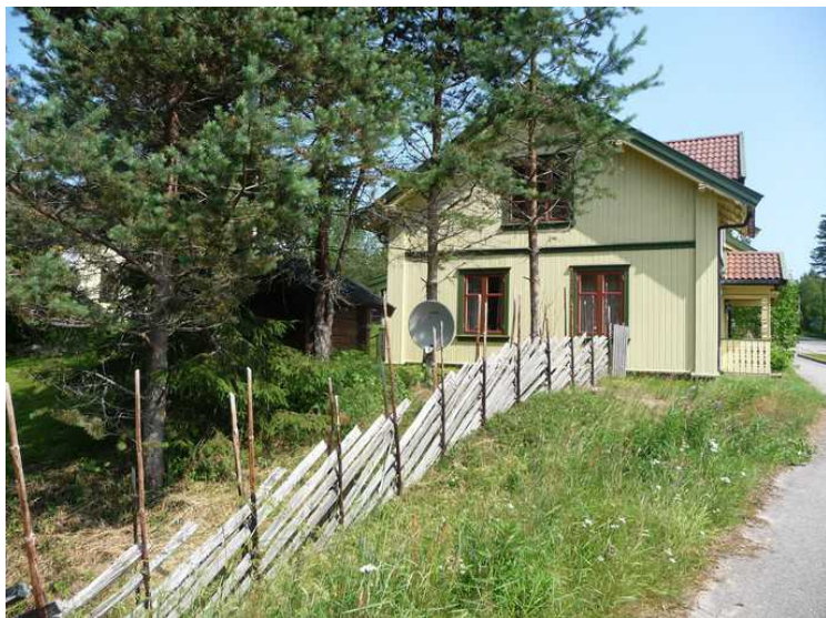
Litt senere går vi en tur bortover. Fin skigard.