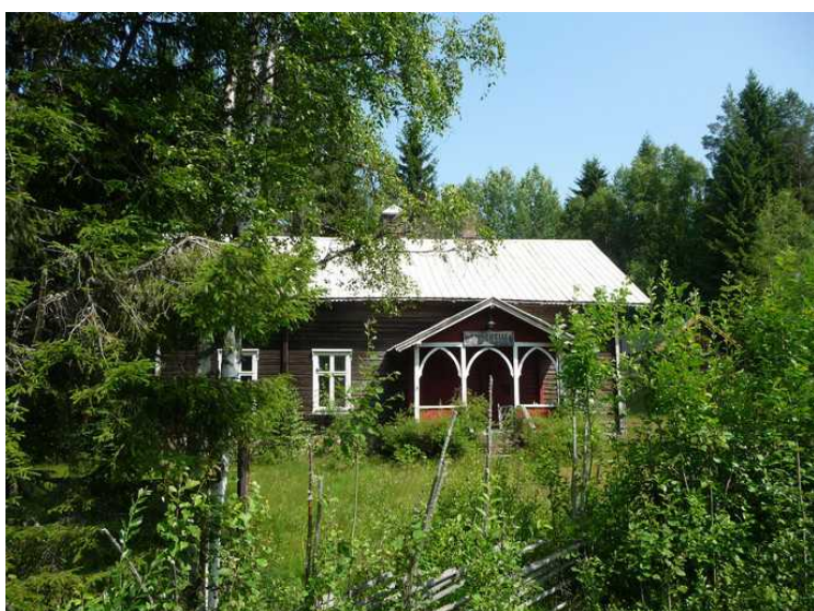
Vi er på vei østover mot Åsta Holth museet. Her gikk vi forbi et fint hus. Det heter Skogheim.