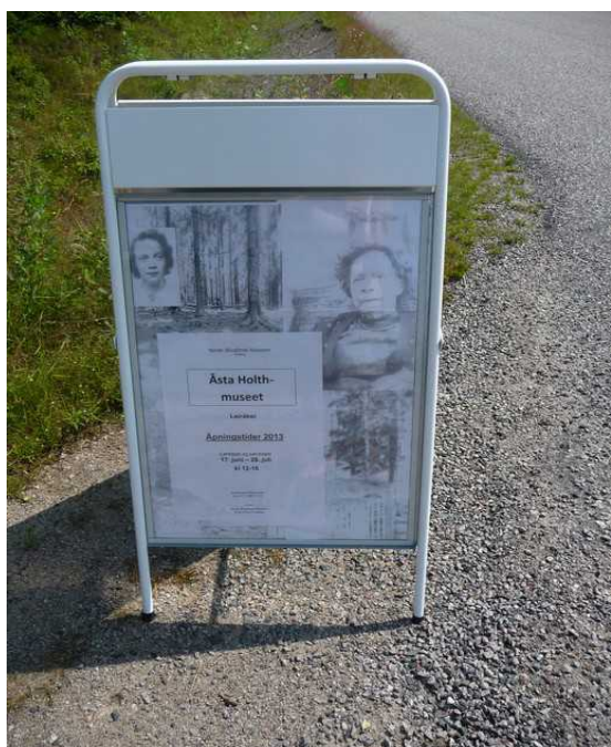
Her er vi fremme.