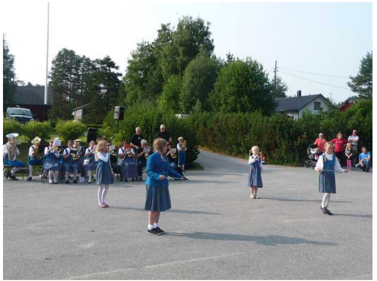
Korpset og drilljentene holder på fremdeles.