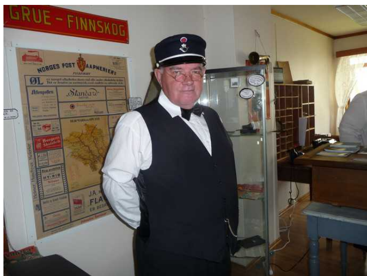
Vi tar en tur til postmuseet. Postmesteren tar imot oss.