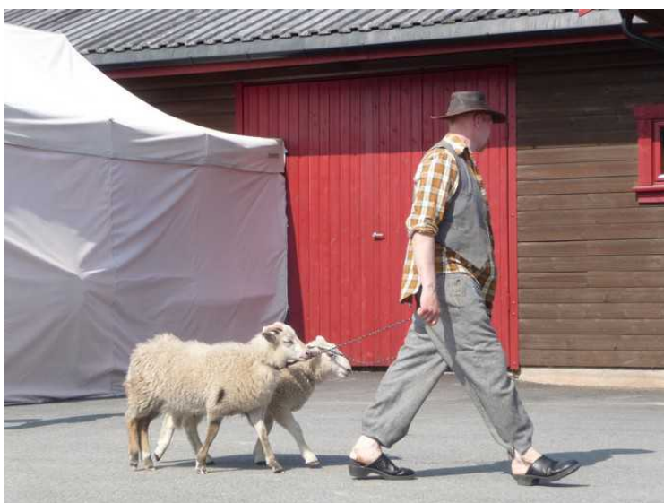
Disse sauene var like dresserte som et par hunder.