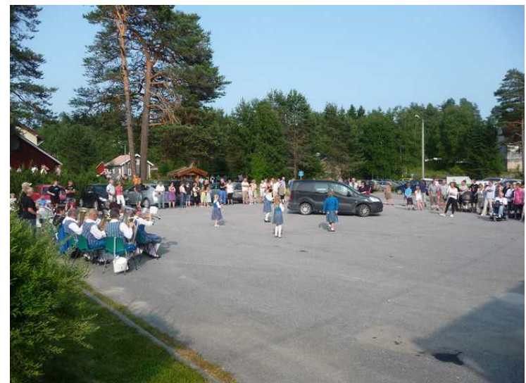
Det er mange som har møtt opp.