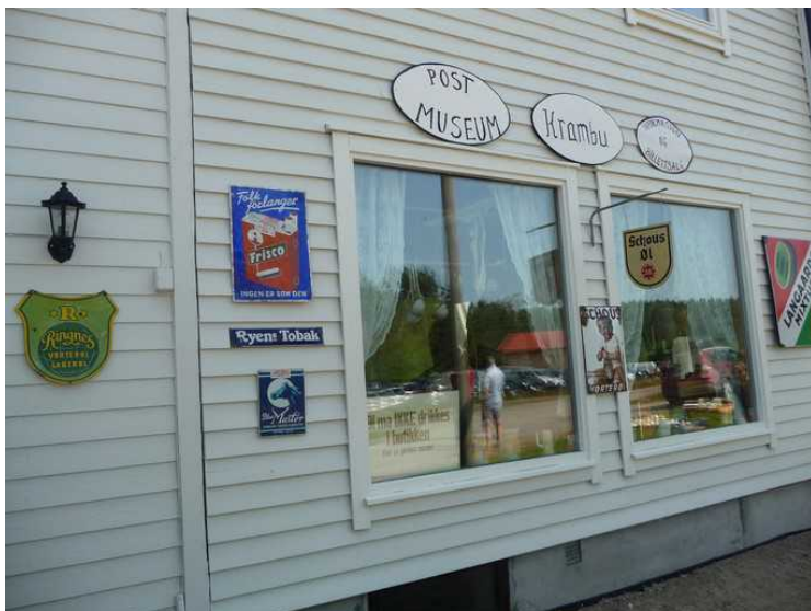
Slik ser bygget ut på utsiden med blant annet tobakksreklame som er strengt forbudt i dag.