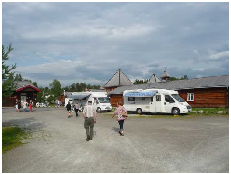
Tilbake til bobilen. Vår bil er den som står til venstre.