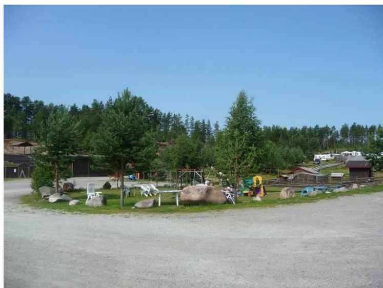
Tilbake i bobilen har vi denne utsikten.