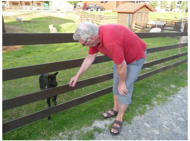
Denne geitekillingen er litt nervøs av seg.