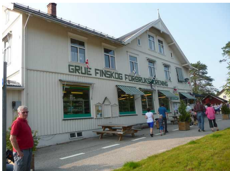
Åpningsseremonien skal være på torget utenfor Joker-butikken.