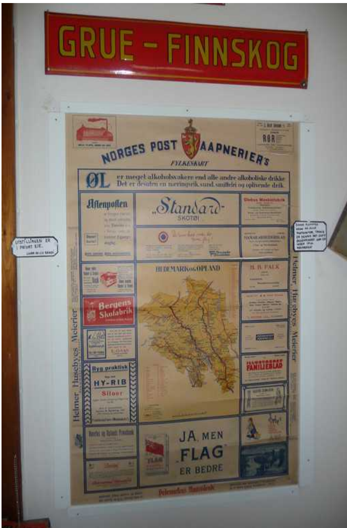
Kart over postdistriktet.