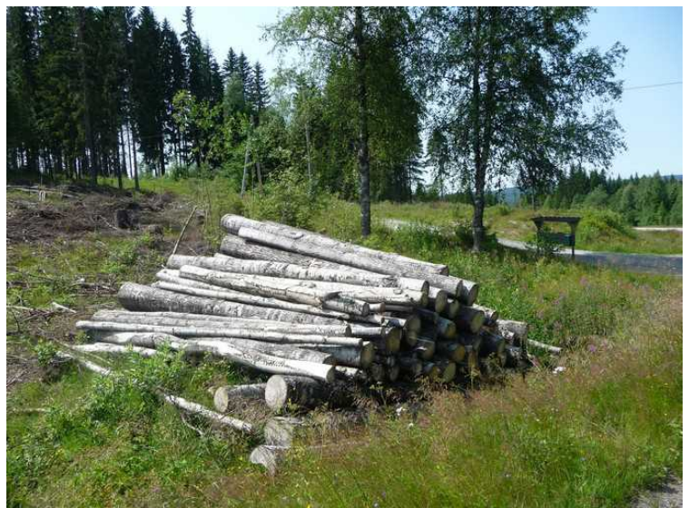
På vei tilbake til sentrum.