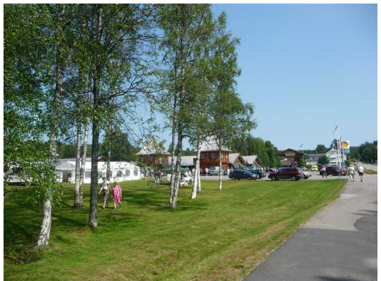
Tilbake til bobilen.