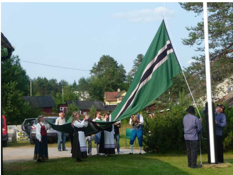
Så skal flagget heises. Det er et helt rituale. Når Republikken Finnskogen skal proklameres, må alt gjøres riktig.