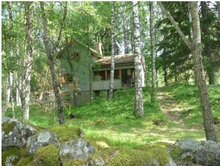
Her ser vi opp mot huset.