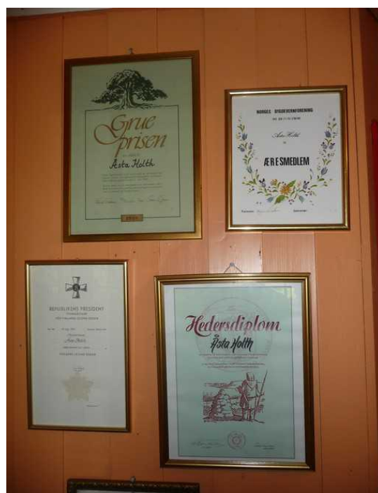
Hun fikk mange æresbevisninger.