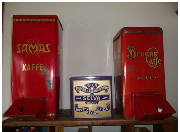
Te og kaffebokser.