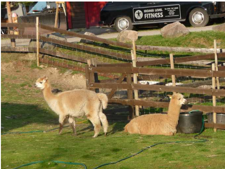
Disse alpakaene ser ut til å ha det fint i kveldssola.