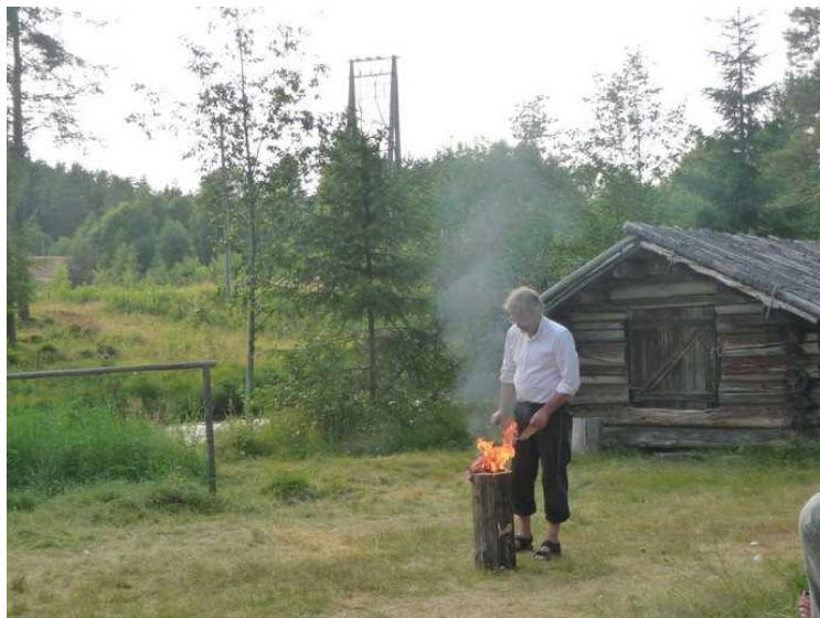
Her brenner det. Det brant nesten hele tida mens forestillingen varte.