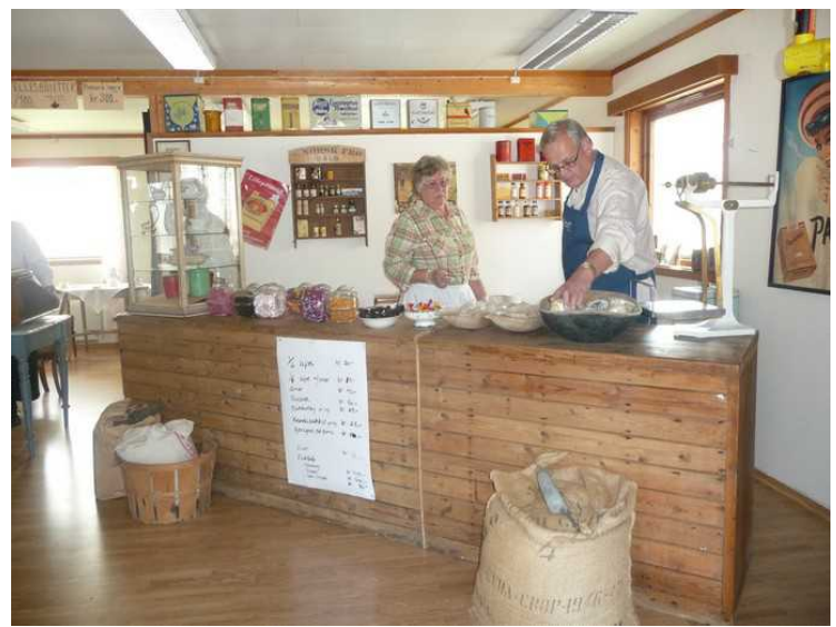
Betjeningen klargjør for mer salg.