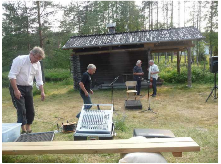
Vi var litt tidlige, så vi så på riggingen av høgtaler- utstyret.