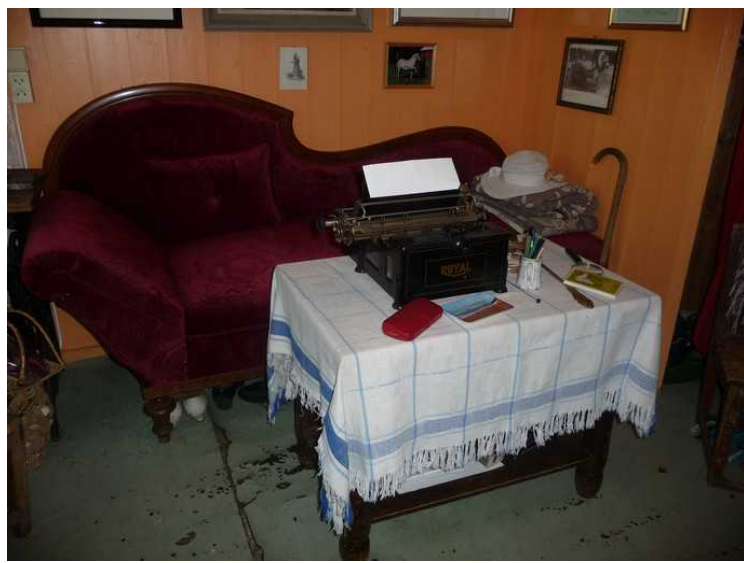
Små møbler. Hun var veldig lav av vekst, så boren, som var møbelsnekker, laget spesiallagede møbler for henne.