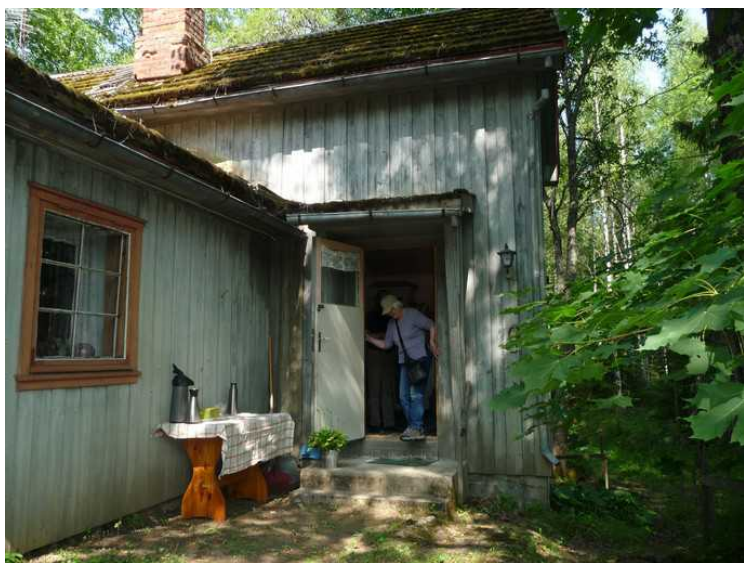
Inngang på baksiden.