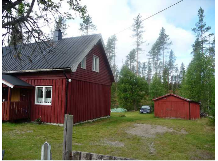
Huset er restaurert og i god stand.