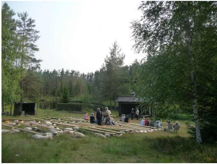
Senere på kvelden var det visesang på Finnetunet .