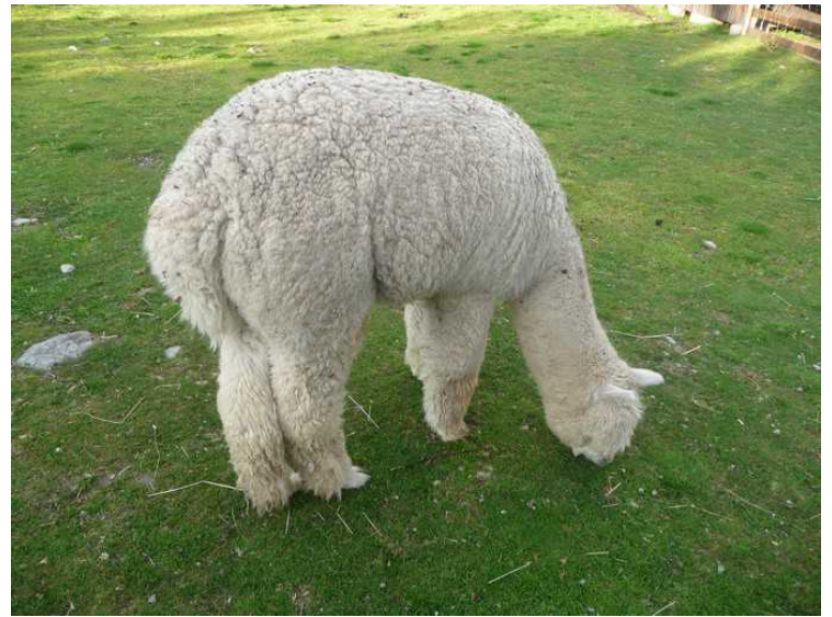
Rett bortenfor er det en del dyr i en innhegning. Her er det et par alpakaer.