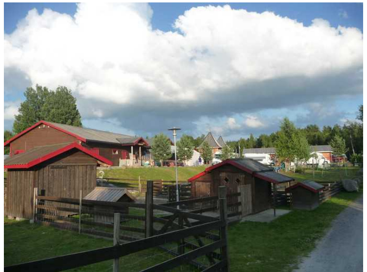
Det er flere små hus som dyrene kan gå inn i.