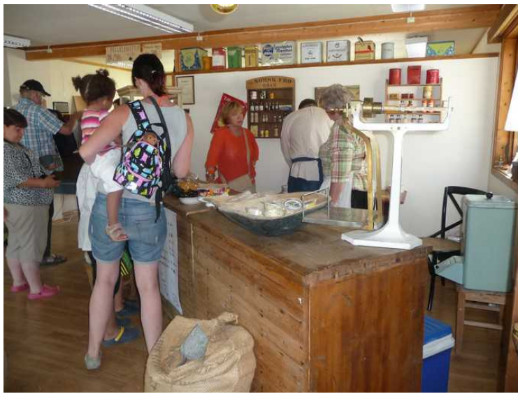
Det er mulig å kjøpe forskjellige varer. Her går det på drops.