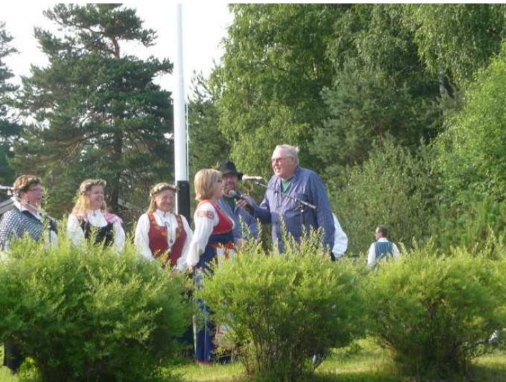
Det er også en pris til de som er nyfødt det siste året.