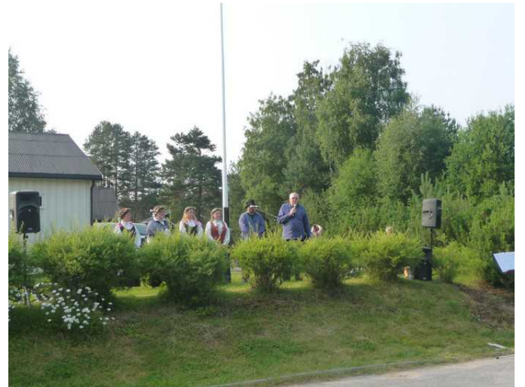
Deretter er det utdeling av Finnskogprisen .