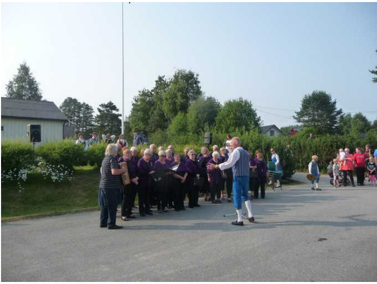
Etterpå er det sangkoret sin tur.