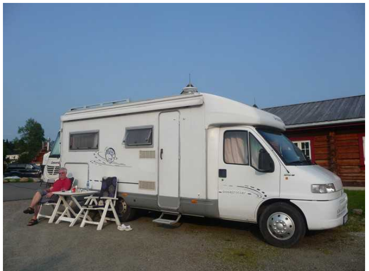
I bobilen før neste post på programmet.