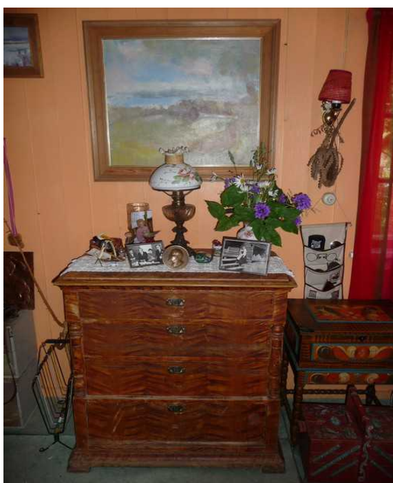
Nedenfor følger en rekke interiørbilder.