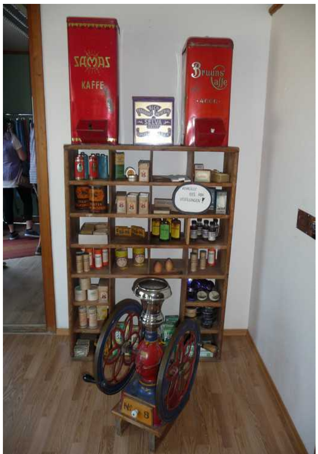
Det er krambu i samme huset, og det er stilt ut allslags forskjellige slags varer fra gammel tid.