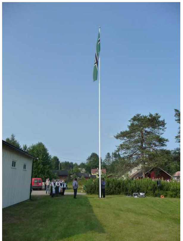
Her er flagget på plass.