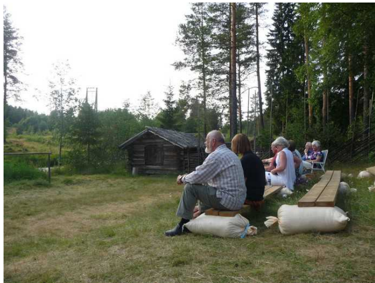
Folk begynner å komme.