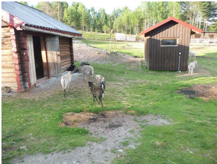
Enda flere geiter.