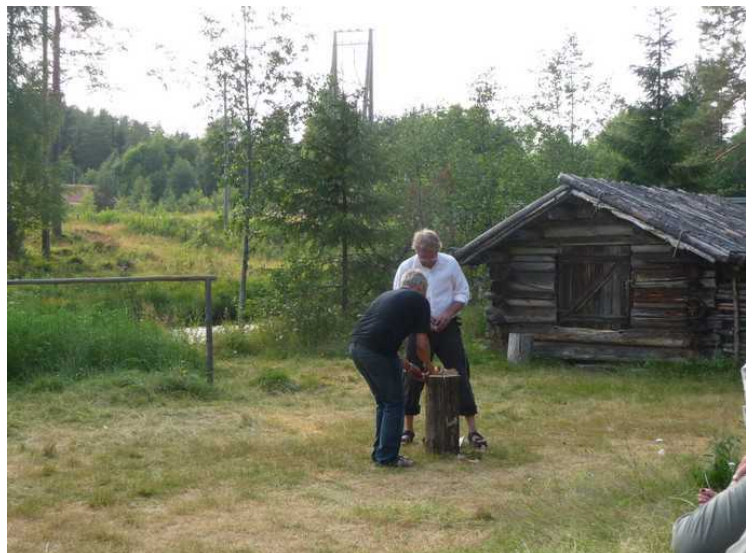
Her klargjøres et bål av en tyristubbe.