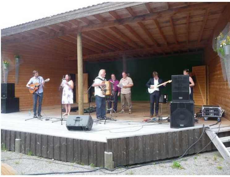
Her er alle på scenen samtidig til slutt.