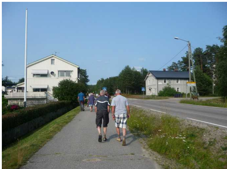
På vei mot åpningen. Det er flere som er før oss.

Den 12 juli reiste vi med bobilen bort til Svullrya for å være med på Finnskogdagene. Det var satt opp et omfattende program .