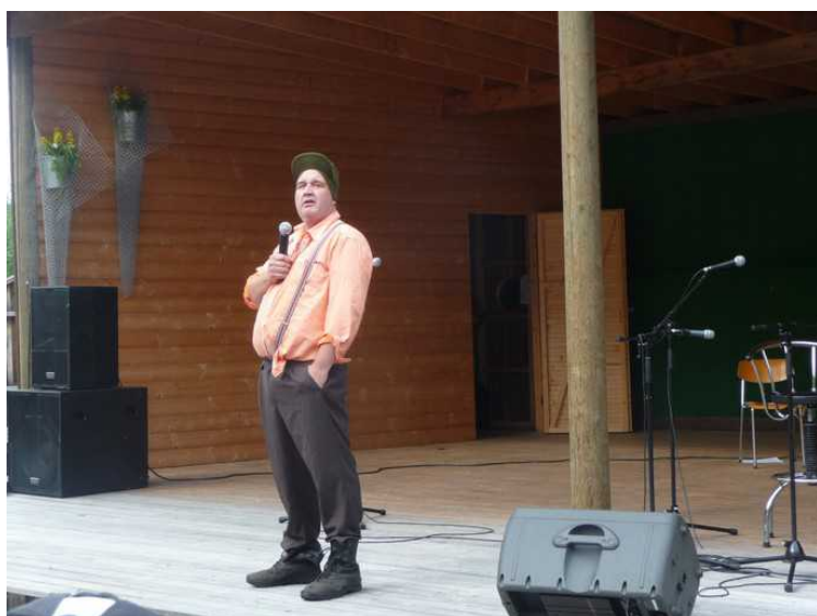
Utdrag fra revyen Finnskog og Galskap.