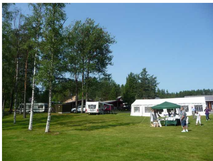
Neste dag er det like fint vær.