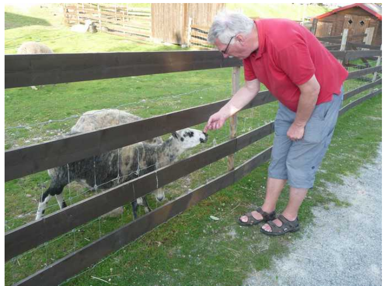
Jeg får «pratet» med et par geiter.