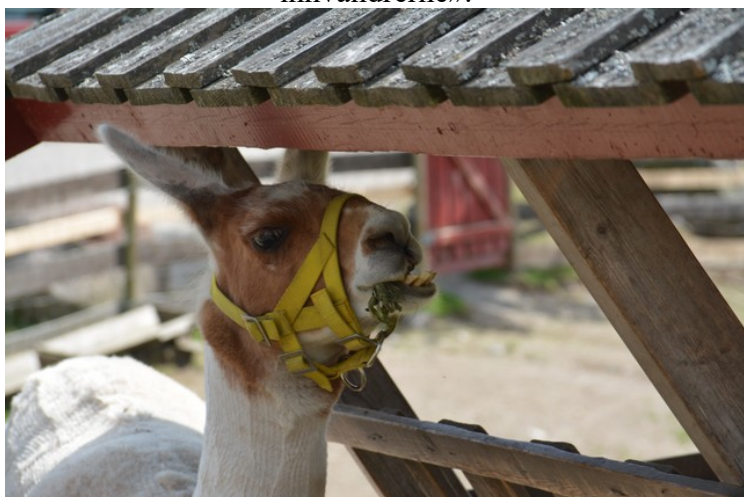
Det er flere lamaer på stedet.