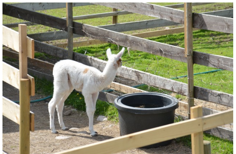
Denne ungen ble født dette året.