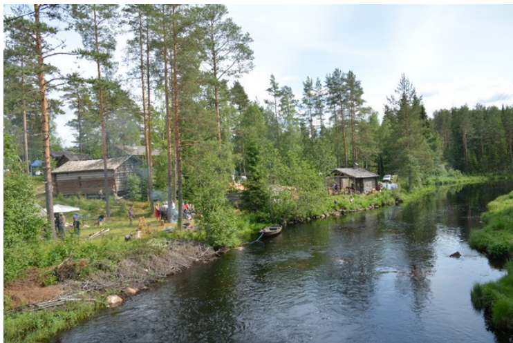
Elva Rotna renner i utkanten av Finnetunet.