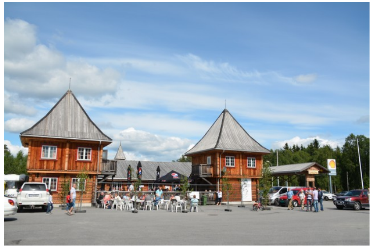
Til slutt et bilde fra tanken.