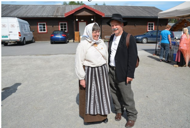
Mange hadde kledd seg i tradisjonelle klær.