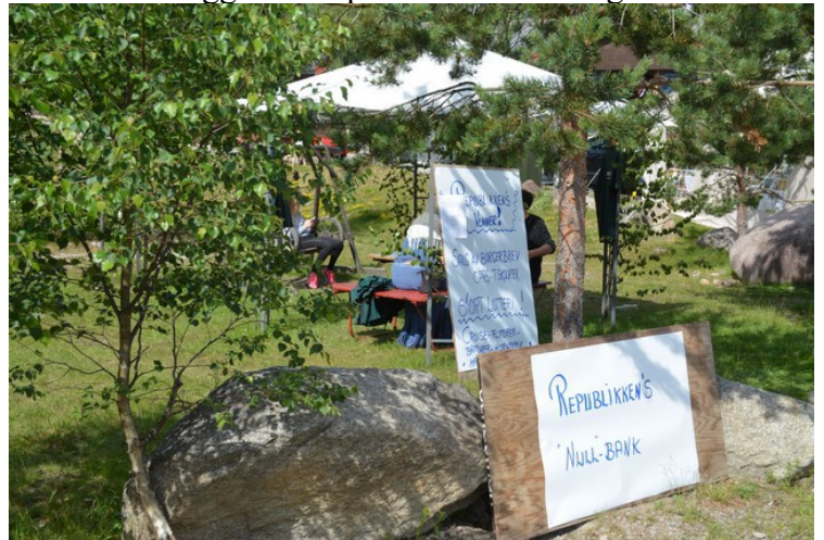
Her selges borgerbrev.