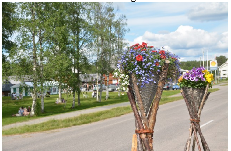
Det er pyntet med blomster langs veien.