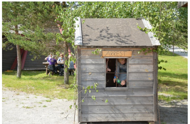
Arresten var populær.