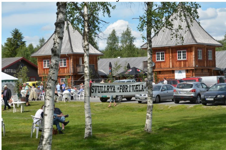
Her kommer vi til Tanken.