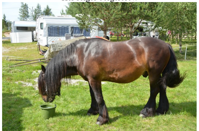
Hesten slapper av.