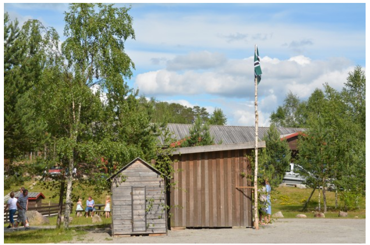
Flagget til Republikken Finnskogen.