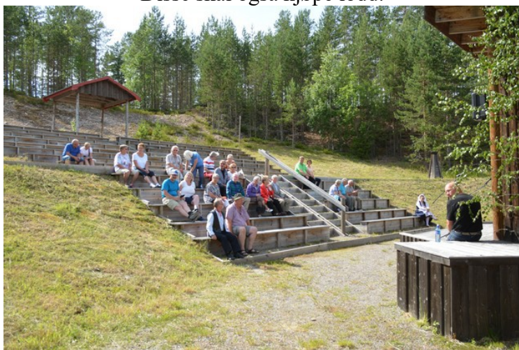
Folk har gjort seg klar til en forestilling: «Spillet om innvandrene».