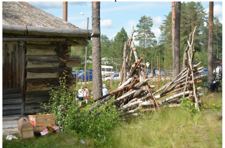
Litt av en skigard.