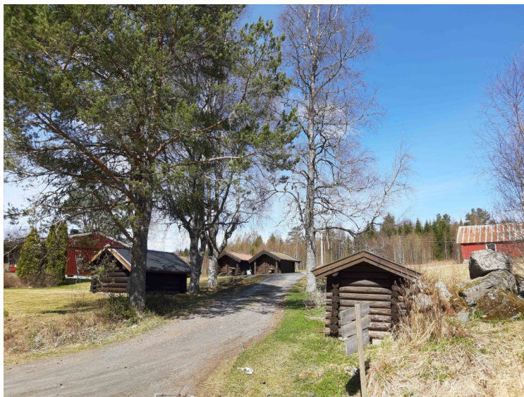
Dette er Vestgarden.