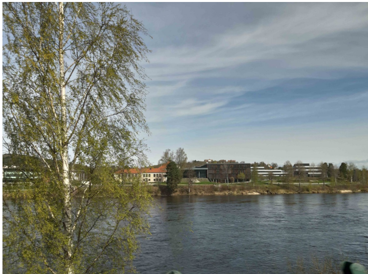
Glomma ved Kongsvinger. Vi ser Sentrum videregående skole og Høgskolesenteret til høyre i bildet.

Vi kjørte på sørsiden av Glomma bortover og på returen kjørte vi E16 på nordsiden fra Skarnes.