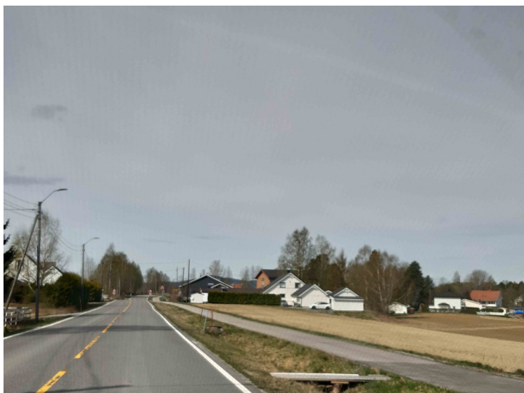
Hus i Sandar.