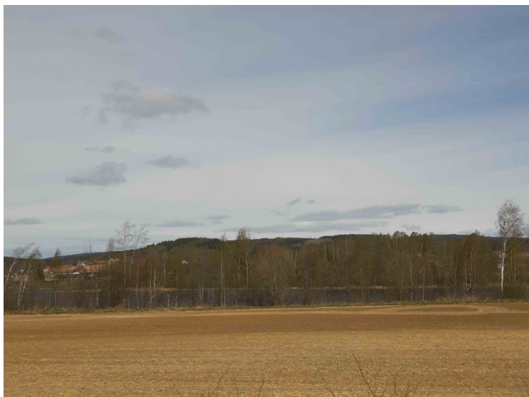
Det er tørt på de høstpløyde jordene og sanden fyker i vinden.