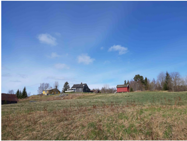
Dette er Østgarden på Finnholt.