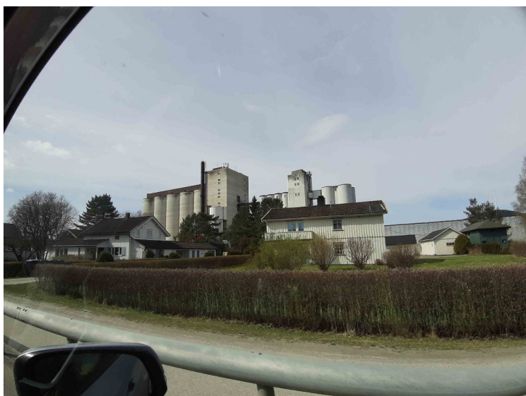
Skarnes mølle med kornsiloer.