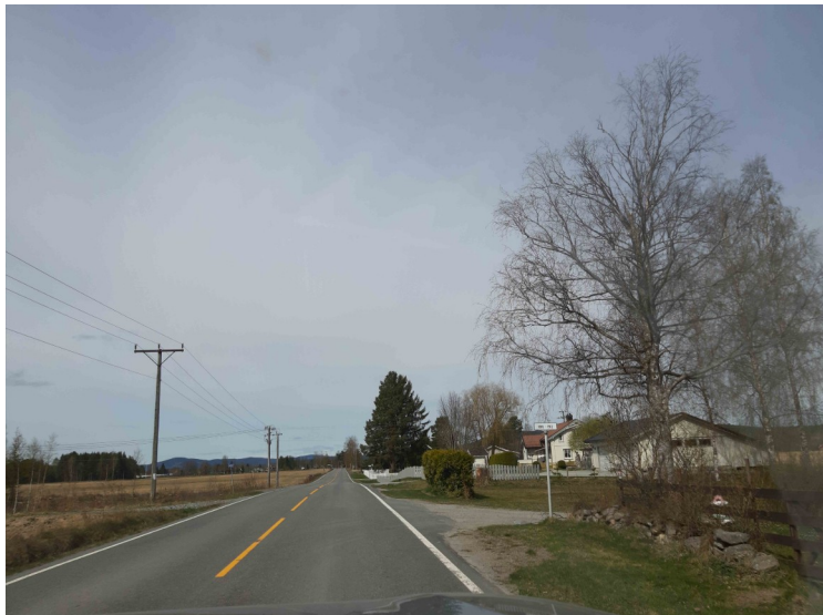
Dette er på Hærnesmoen, rett før vi kommer til Sandar.