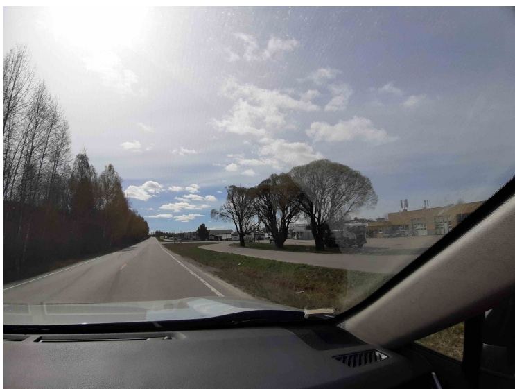
Så fulgte noen rette vegstrekninger.