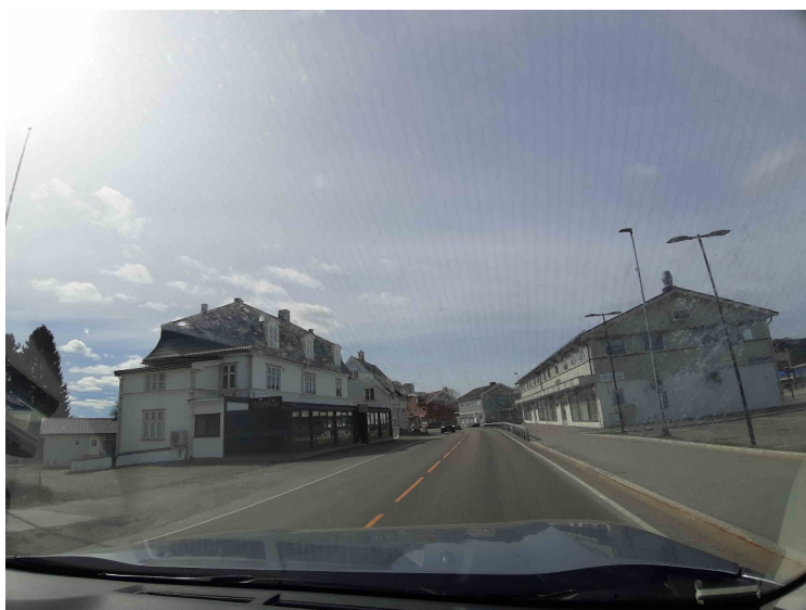
Gjennom Skarnes sentrum.