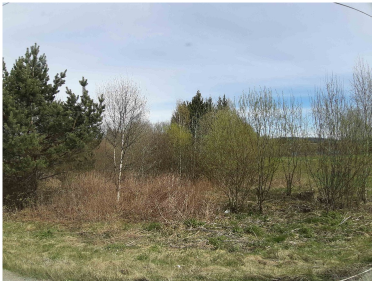
Bjørkene begynner å grønnes.