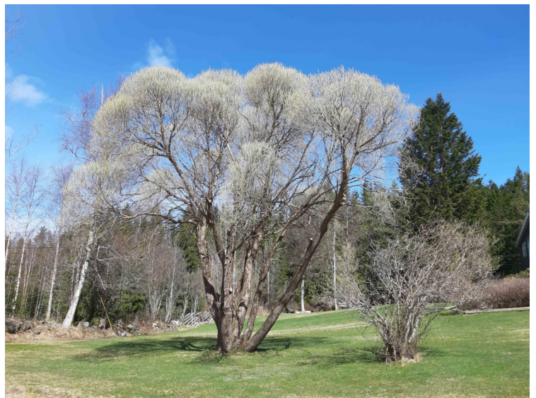
Dette treet står på Bråten.