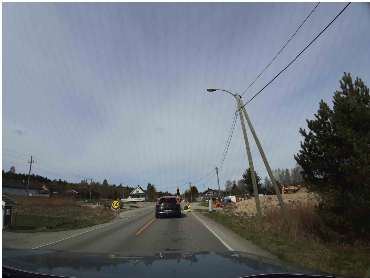
Litt etter Sander måtte vi stoppe for rødt lys på grunn av veiarbeid.