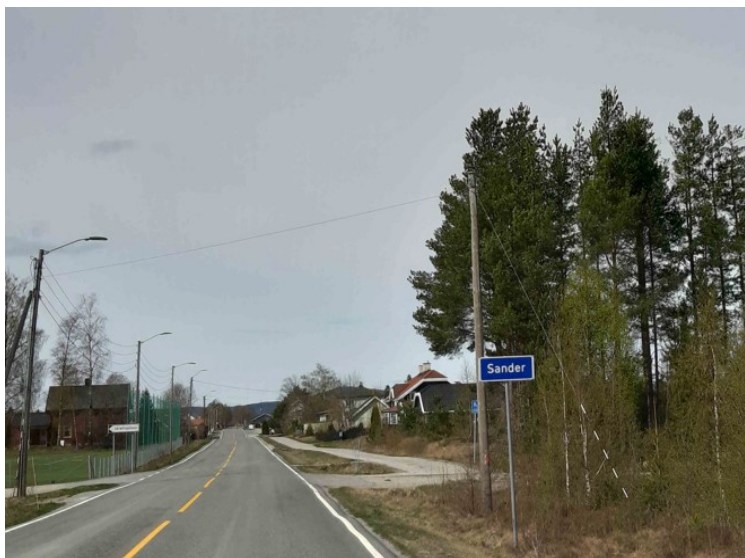
Her står det Sandar .