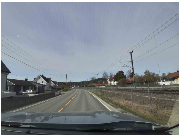
Snart på Skarnes som er administrasjonssenter i Sør-Odal kommune.