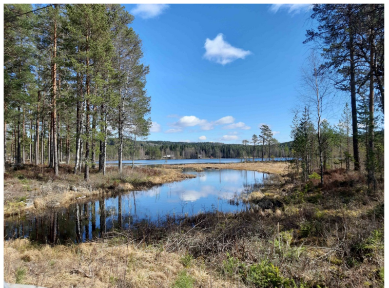
Sjøen her heter Sæterlisjøen.

Rakeie er en fredet gravplass som ble brukt i årene fra 1887 til 1927.