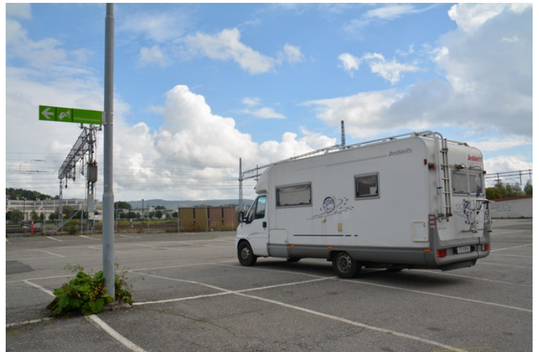
Parkeringslommene var så små at vi måtte bruke to plasser.