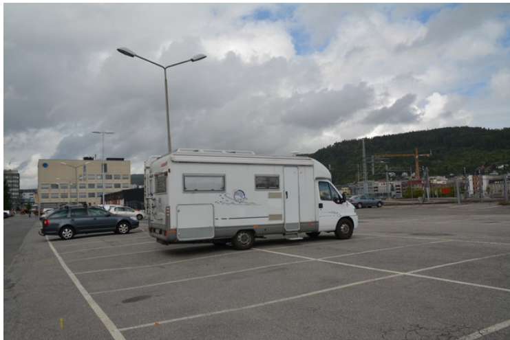
Vi parkerte ved jernbanestasjonen.