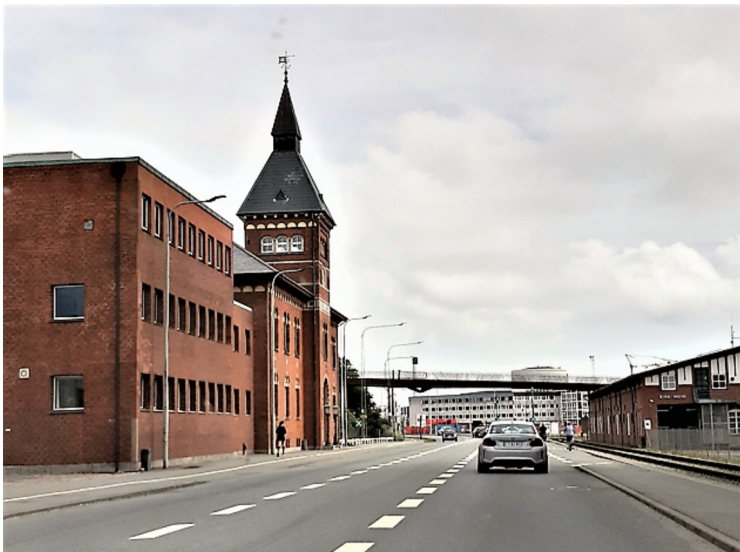
Vi kjørte videre syddover utenom sentrum. Veien går gjennom havneområdet.