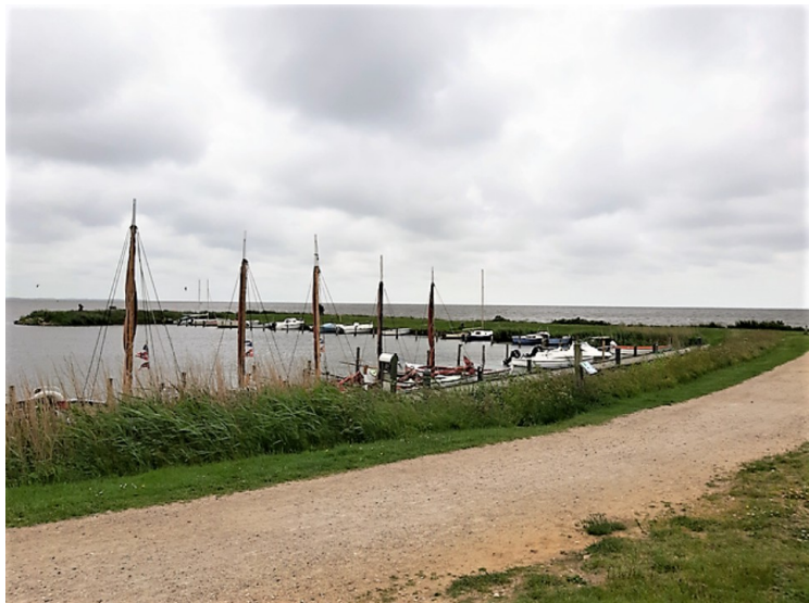
Ringkøbing ligger ved Ringkøbing fjord og har tre havneområder for småbåter. Dette er den midterste havnen.