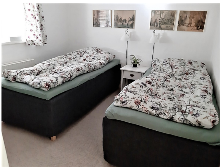
Her kunne vi ligge og sove.