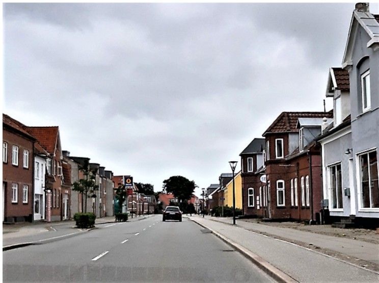
Vi kjørte først vestover til Ringkøbing . Den har 10000 innbyggere.