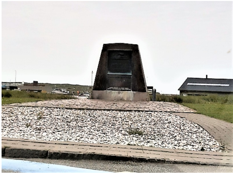
Ved en rundkjøring så vi denne minnestenen . Det var 5 menn som druknet i 1951 etter at de hadde deltatt i en redningsaksjon.