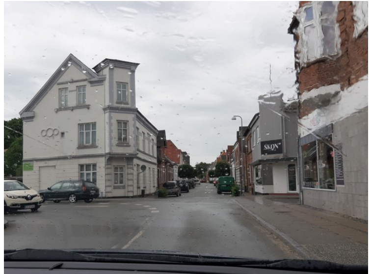
Så kom det en regnskur.