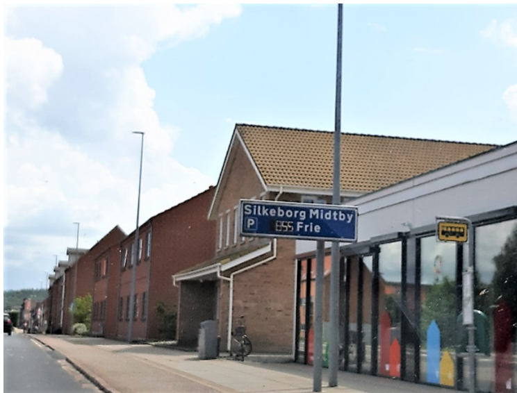
Så kommer vi til Silkeborg.