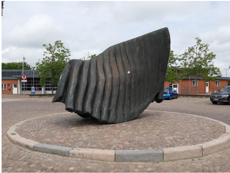
Dette er « Tidens tand », en skulptur som ble satt opp utenfor Ribes vikinger i 1938.