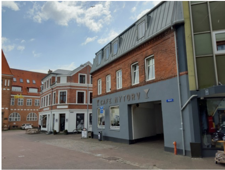
Cafe Nytorv .