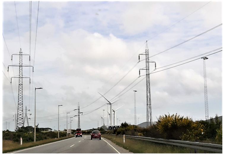
Det trengs elektrisitet.