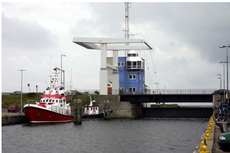
Dette er det andre sluseanlegget. Det er en kammersluse med tilhørende vippebro. Den tillater passasje mellom Nordsjøen og Ringkøbing Fjord.