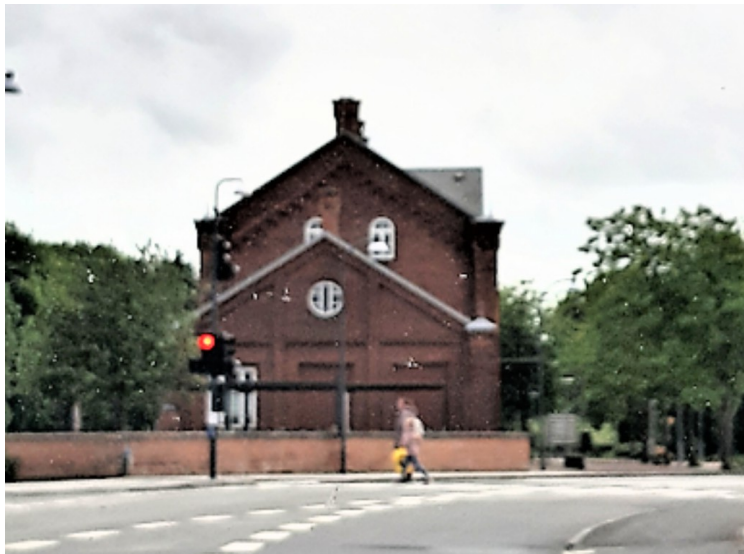
Så kommer vi til Ribe. Dette er Ribe jernbanestasjon.