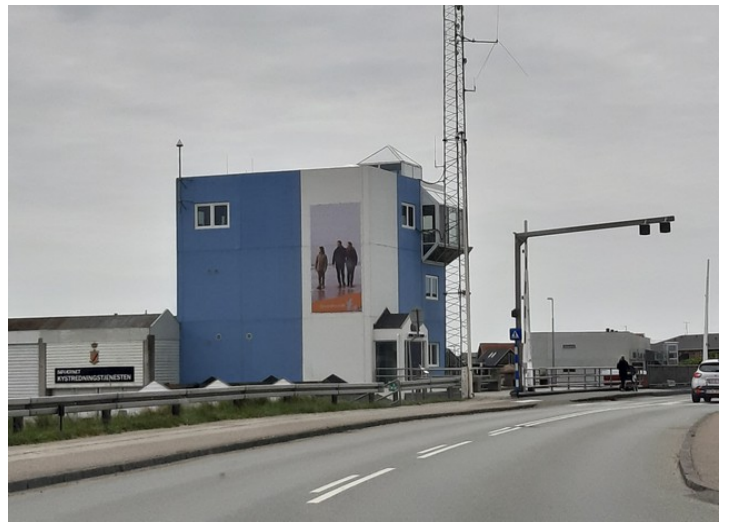
Dette kalles Blåtårn og det er der havnevakten holder til. Det er her operasjonen av kammerslusen og vippebroen foregår.