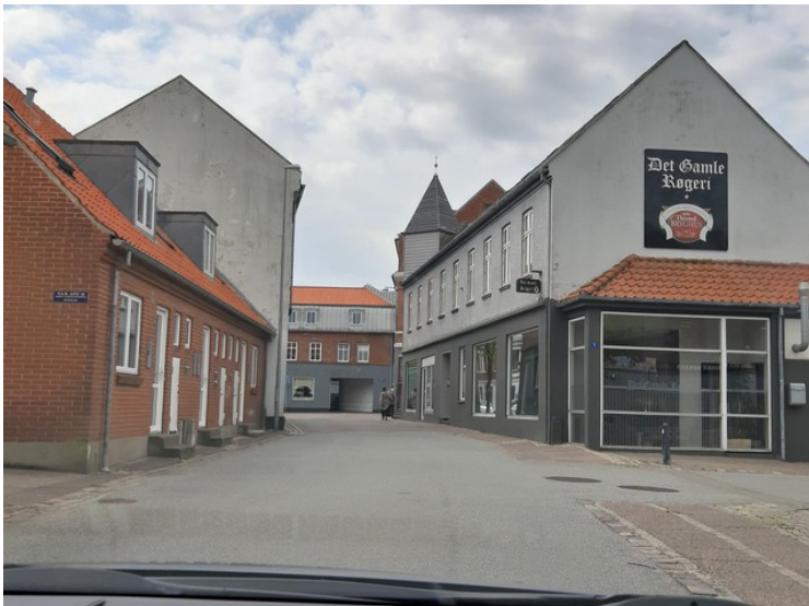
Det Gamle Røgeri er fiskebutikk og fiskerestaurant.