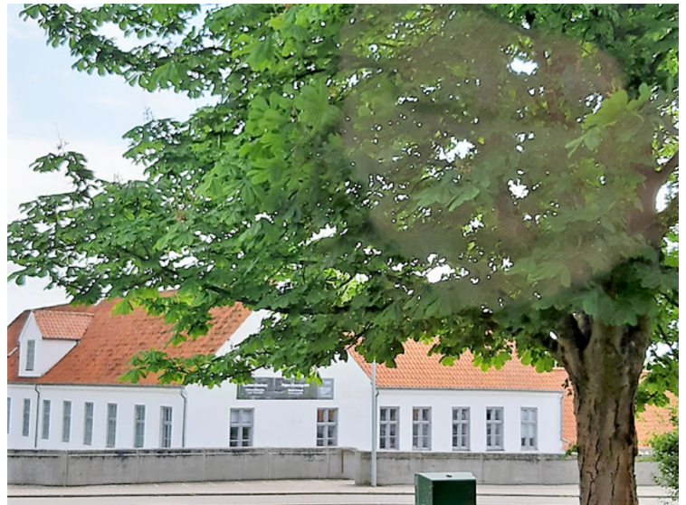
Viborg kunsthall holder til i en bygning fra 1734.