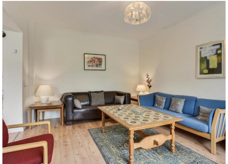
Dette var den største leiligheten vi hadde på denne turen, nesten for stor.