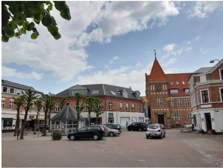
Her er vi ved Nytorvet i Thisted.