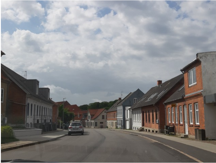
Utkanten av Thisted.

Etter å ha kjørt til Göteborg for å ta ferga over til Frederikshavn og kjørt en dag helt nord på Jylland, så er vi klar for å kjøre videre fredag den 11. juni.