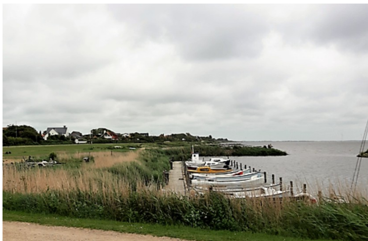
Dette er den østre havnen.