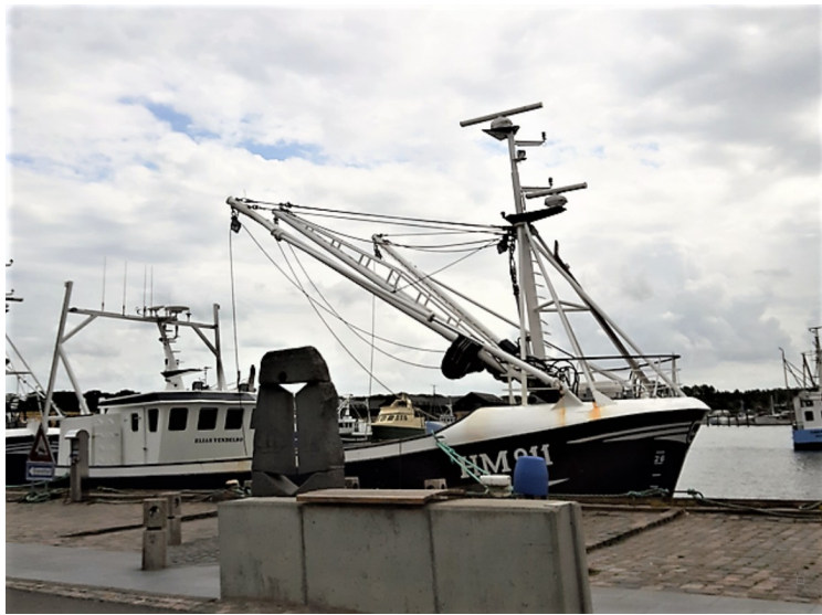
Vi kjørte først en tur ned i havnen. Vi fikk tilfeldigvis en havneskulptur med på bildet.