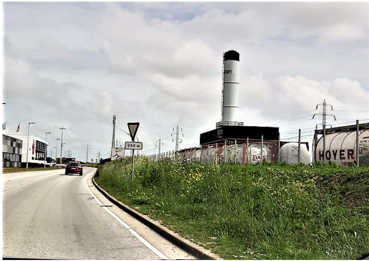
Ett bilde fra utsiden.