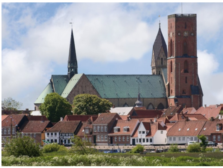
Ribe domkirke er Danmarks eldste domkirke fra 1100-tallet.

Ribe regnes som Nordens eldste by. Den har en historie helt tilbake til 700-tallet og den var den ledende byen i Jylland i vikingtiden og tidlig middelalder, og byen fungerte som Danmarks hovedstad i tidlig vikingtid. I dag har den 8000 innbyggere.