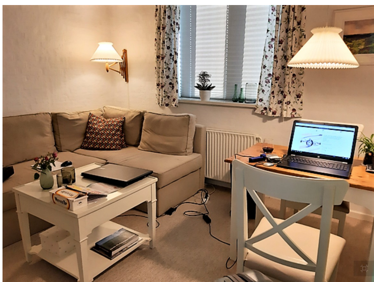
Her kunne vi sitte.