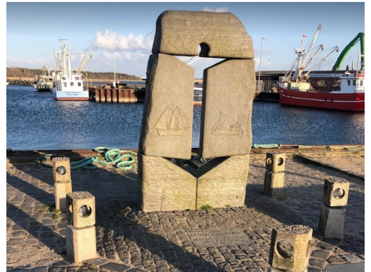
Havneskulpturen ble reist ved havnens 150-års jubileum i 1993.