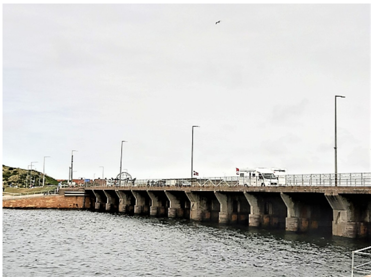
Dette er det ene sluseanlegget . Det har 14 kamre og brukes til å regulere vannstanden i Ringkøbing Fjord.