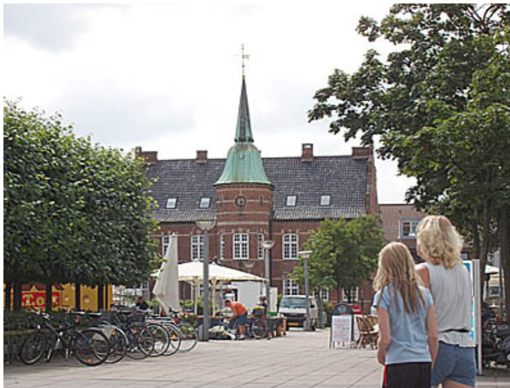
Torget i Silkeborg med det gamle rådhuset.