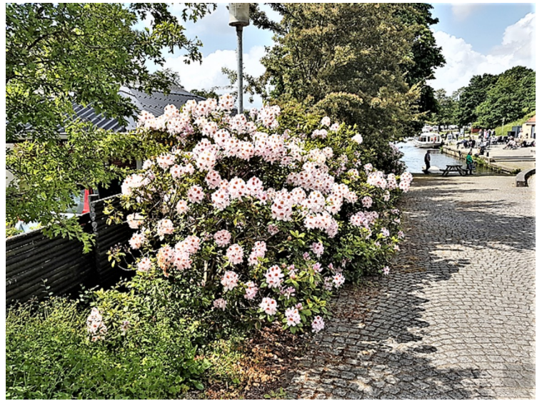
Det var mange Rhododendron -busker som blomstret.