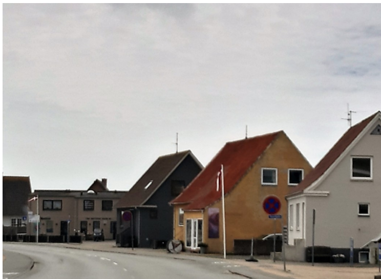
Så kjørte vi videre sydover.