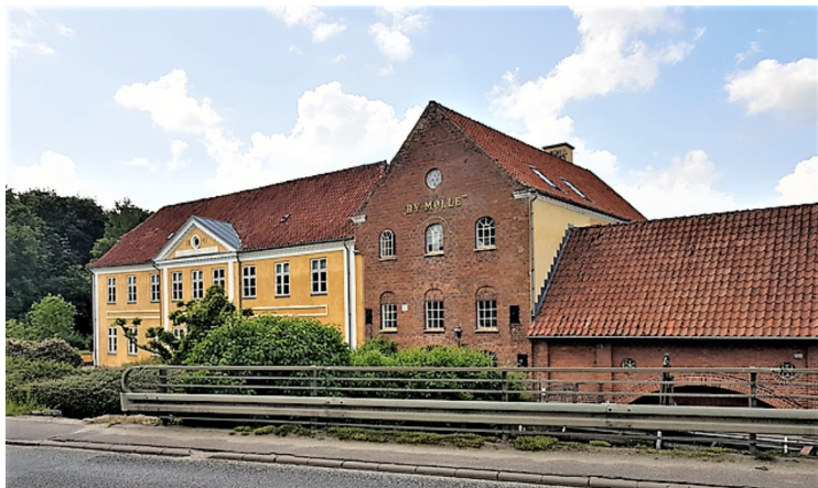
Dette er Rye Mølle . Den ble bygget på 1500-tallet. Det har vært kornmølle og senere tresliperi og sist konfeksjonsfabrikk. Fra 1971 har møllen vært brukt til el-produksjon. Denne foregår fremdeles.