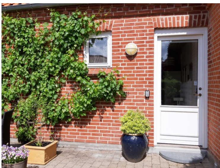
Inn her skulle vi overnatte denne dagen, Birkevej 9 i Ry.