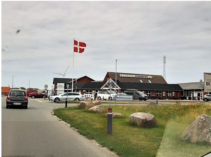
Vi kjørte i retning av vindturbinene.