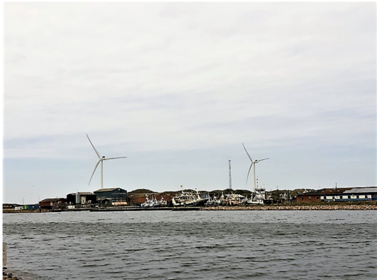
Her ser vi bort til to store vindturbiner.