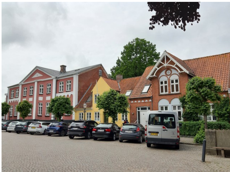
Bebyggelsen ved kirken.