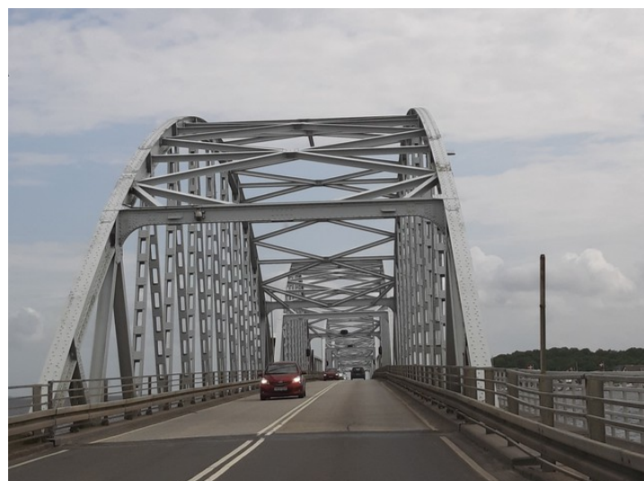
Dette er Vilsundbroen som går over Limfjorden til Mors. Det er en klappbro som ble åpnet i 1939.

Vi har til nå kjørt på nordsiden av Limfjorden på ei øy som heter Nørrejyske Ø , som er den nest største øya i Danmark og er den delen av Jylland som ligger nord for Limfjorden.