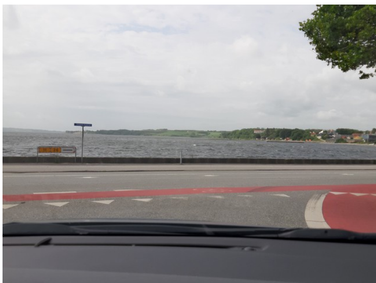
Her kommer vi ned til Limfjorden.