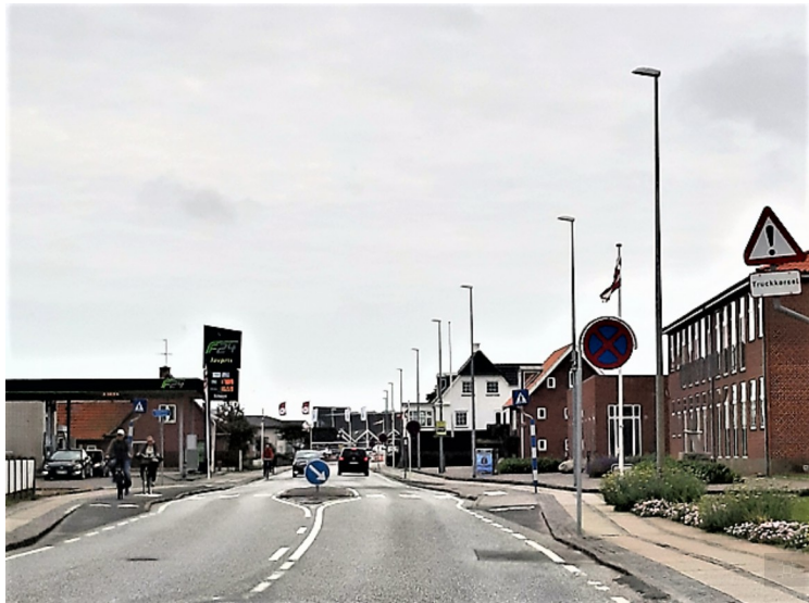
Her kommer vi til Hvide Sande.