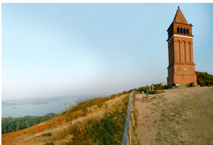
Dette 25m høye tårnet står på toppen. Tårnet er reist til minne om kong Frederik VII , og som en takk fra det danske folk for grunnloven i 1849. Det ble innviet i 1875.

Vi lærte på skolen at Himmelbjerget var Danmarks høyeste punkt, men med mer nøyaktige målinger er Himmelbjerget bare nr 11 med 147.3m. Møllehøy er høyest med 170.86m.