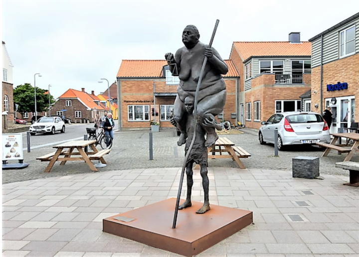
Survival of the fattest.