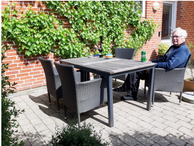
Tid for en pils etter kjøreturen.