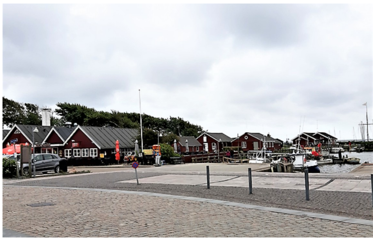
Her kjører vi på gata som heter «Ved Fjorden».

Ringkøbing fjord er bare 2-5m dyp. Den var opprinnelig en havbukt, men det har blåst sand både nord og syd for fjorden, slik at det ble bare en smal renne ut mot Nordsjøen. Denne har flyttet seg både nordover og sydoover. I dag er det tilgang til Nordsjøen ved Hvide Sande.