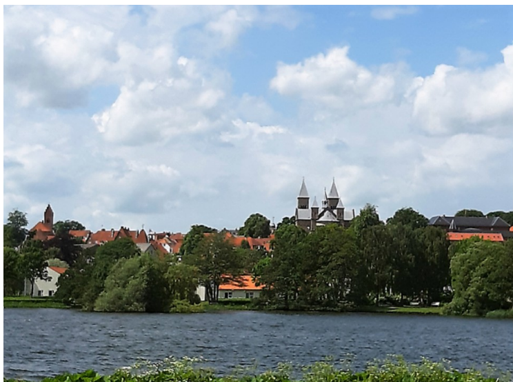
Viborg ligger ved to sjøer. Dette er ved Søndesø. Vi ser tvers over sjøen mot domkirken.