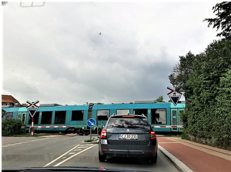
Søndag den 12. juni kjørte vi videre. Her har vi nettopp startet. Vi måtte stoppe for toget i Ry. Ry har jernbaneforbindelse vestover til Silkeborg og østover til Skanderborg.