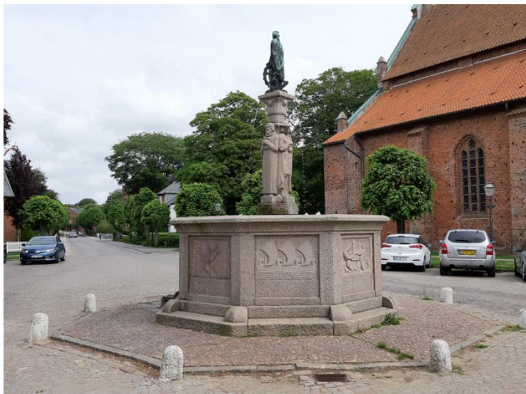
St. Katarina-fontenen .