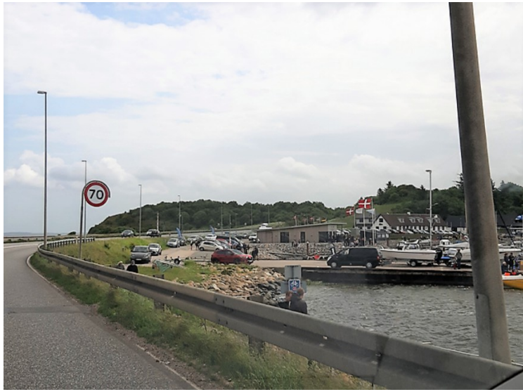
Her kommer vi på land i Mors.