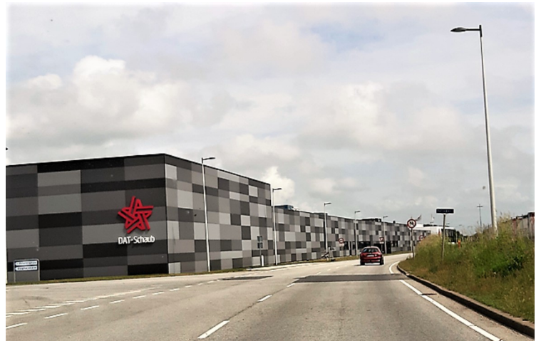
På innsiden av veien lå kontorbygninger. På utsiden var det kraner og tanker osv. Som ikke var noe særlig å ta bilder av.

Esbjerg ble anlagt som statlig havn i 1868 til erstatning for Altona som ble tysk etter den andre Slesvigske krig . Det fantes da bare 30 innbyggere der. I dag bor det over 70000 der. Den er i dag Danmarks 5. største by. Det er havnen som er drivkraften i byen. Tidligere var det fisket som var viktigst, men nå er det offshore-virksomheten.