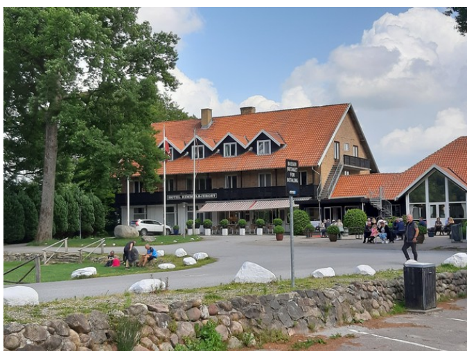
Neste stopp var på Himmelbjerget . Dette er Hotel Himmelbjerget .

Silkeborg fikk ikke status som handelsplass før i 1846. Byen har i dag ca 44000 innbyggere. Den ligger ved Silkeborg Langsø og Gudenå .