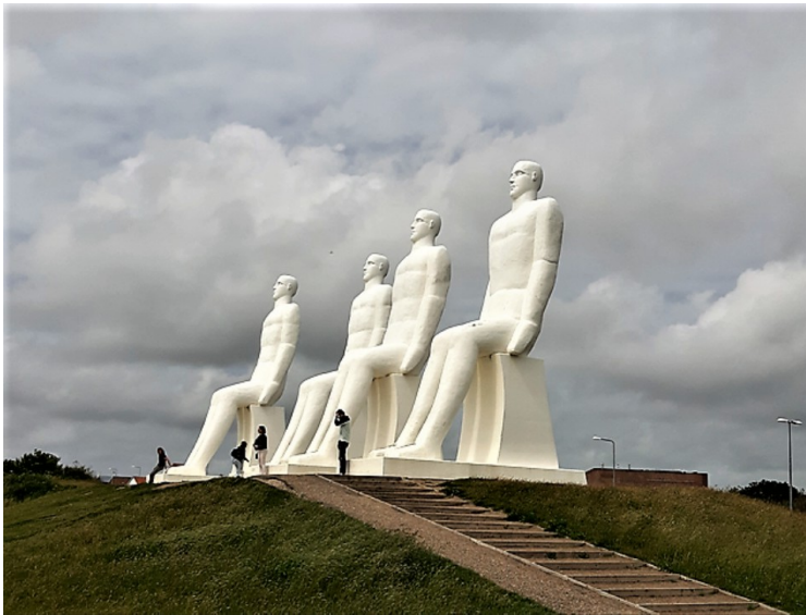
Rett nord for Esbjerg sentrum ser vi « Mennesket ved havet ». Det er en 9 meter høy skulptur av hvit betong som ble satt opp i 1995.