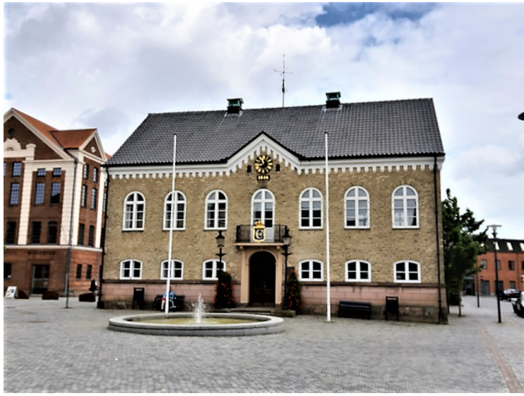
Dette er det gamle rådhuset.