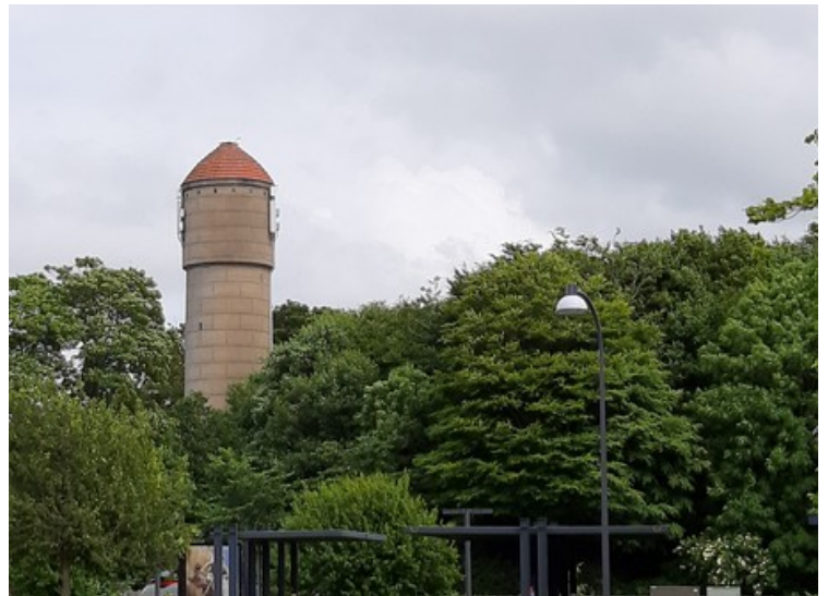
Et tårn bak stasjonen.