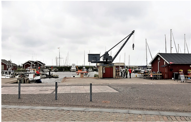
Huset til høyre er en fiskebutikk.