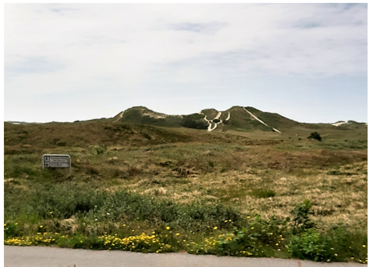
Noen bilder av klittene.