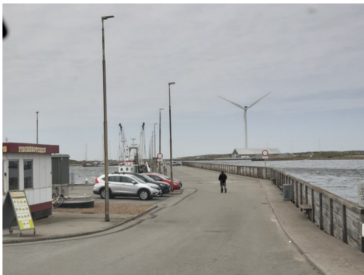
Vi stoppet her og så på slusene.

Hvide Sande vokste opp rundt slusene mellom fjorden og havet som ble bygget i 1931. Det bor litt over 3000 innbyggere her. Hvide Sande er etter hvert blitt en av Danmarks største fiskerihavner.