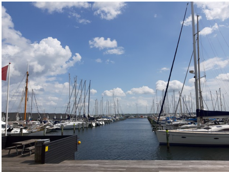
Lystbåthavnen i Skive.

Neste by er Skive . Den oppsto som handelssted ved Karup å. Den fikk kjøpstadsrettigheter i 1326. Innbyggertallet er litt over 20000.