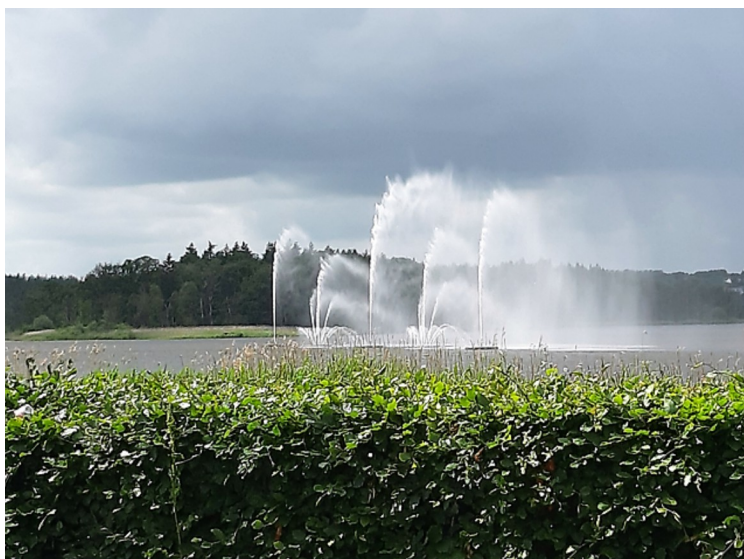
Dette er springvannet i Silkeborg Langsø. Det er et av nord-Euopas største.