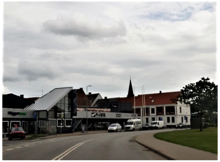
Så kommer vi til Nykøbing Mors.