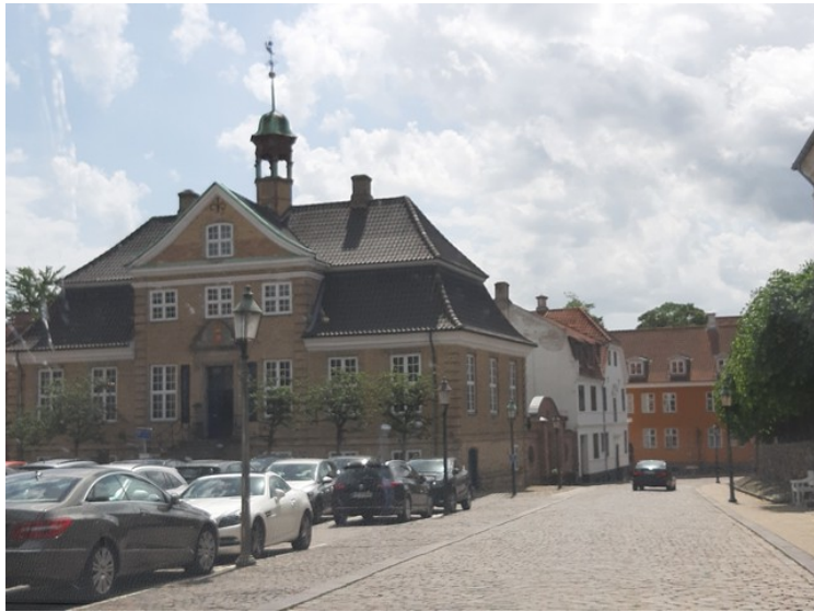
Skovgaard Museet som ligger i Viborgs gamle rådhus.

Viborg domkirke er sannsynligvis bygget på et sted der det sto en hedensk helligdom, en vi, som Viborg har fått navn etter.