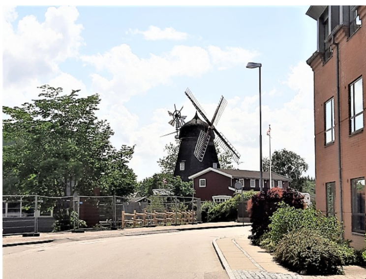
Dette er Ry Nymølle .

Den ble bygget i 1881 som kornmølle da vannmøllen nede ved Gudenå sluttet å male korn. Mølleproduksjonen fortsatte til 1977. Da ble møllen overtatt av et arkitektfirma.