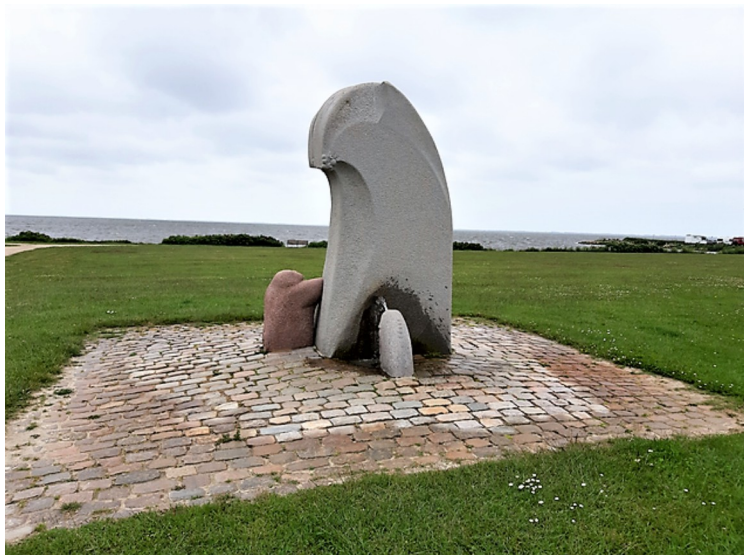
Denne skulpturen heter «Bølgen». Den står utenfor Rådhuset i Ringkøbing og ble avduket i 1993.