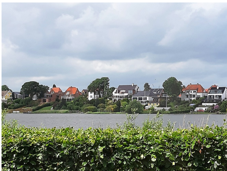
Silkeborg Langsø er en grunn sjø på maks 4.2 meter.

Silkeborg fikk ikke status som handelsplass før i 1846. Byen har i dag ca 44000 innbyggere. Den ligger ved Silkeborg Langsø og Gudenå .