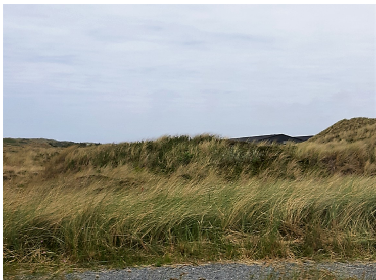
Her var det mye marehalm.