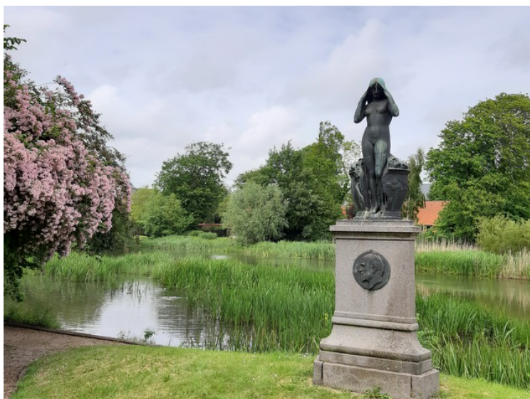
Dette er « Gjær-jenta » som står ved Ribe å.