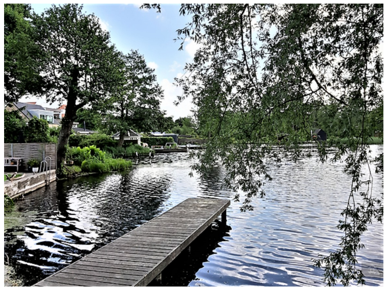
Syd for Birksø ligger Rye Mølle Sø. Den er oppdemmet for å gi kraft til Rye Mølle. Her er det en fallhøyde på 1.5 meter.

Disse sjøene er en del av Gudenå -vassdraget. Gudenåa er den lengste elva i Danmark med lengde 176 km. Helt tilbake fra forhistorisk tid har Gudenåa vært en av Jyllands hovedveier. De mange boplassene langs vassdraget vitner om dette