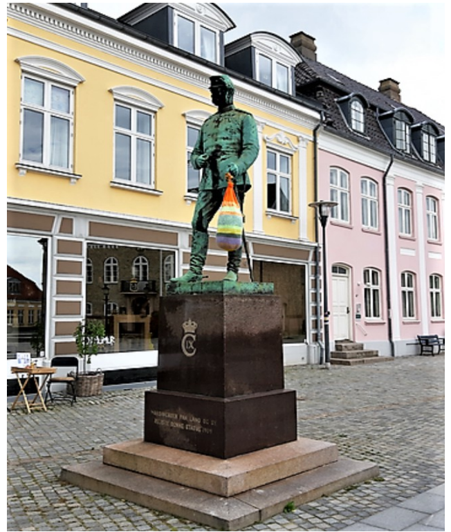
En statue av kong Christian IX står rett ved rådhuset. Noen har hengt en pose i hånda hans.