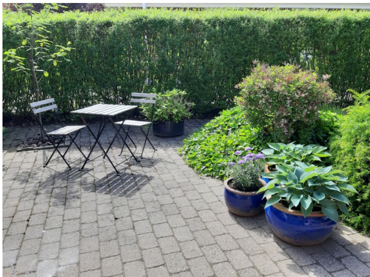
Vi hadde egen hage utenfor inngangen.