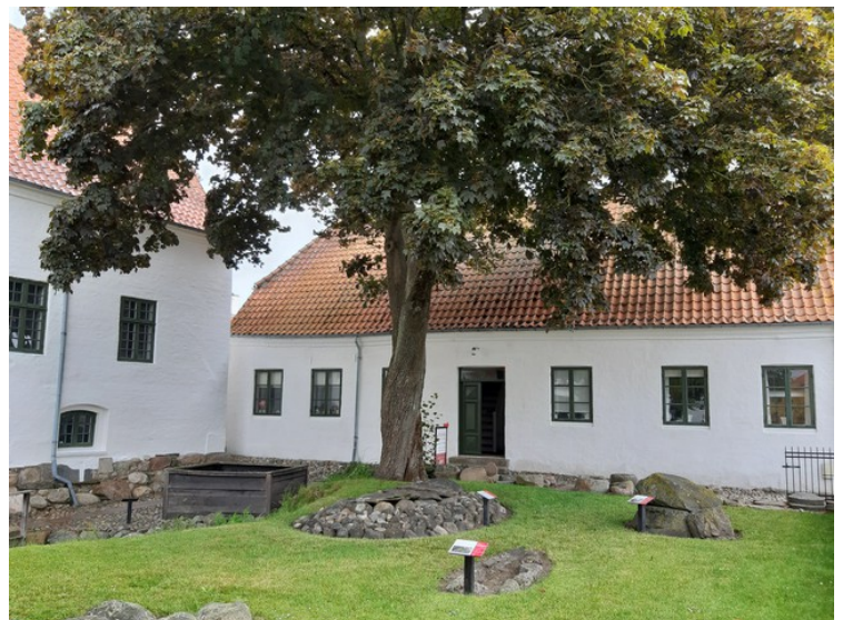
Dette er Dueholm kloster . Det ble opprettet i 1371. I dag holder Morsland historiske museum til her. Museet ble grunnlagt i 1901.