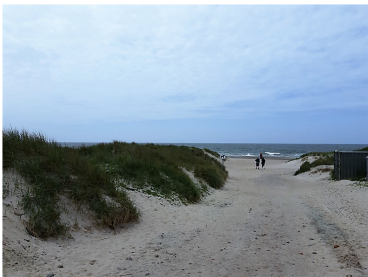
Veien ned til stranden.