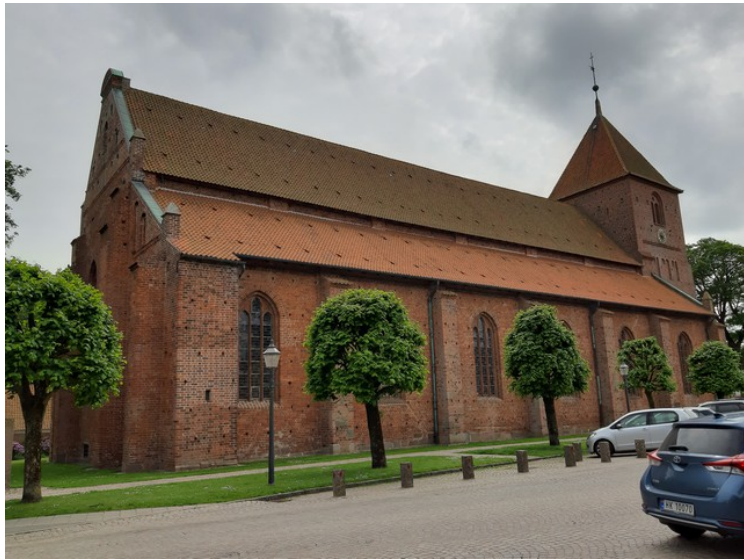
Dette er St. Katarina kirke . Denne kirken er fra 1495.