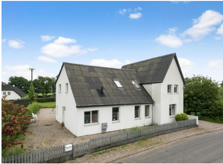
Siste stopp denne dagen var i Bjerndrup Leilighet .