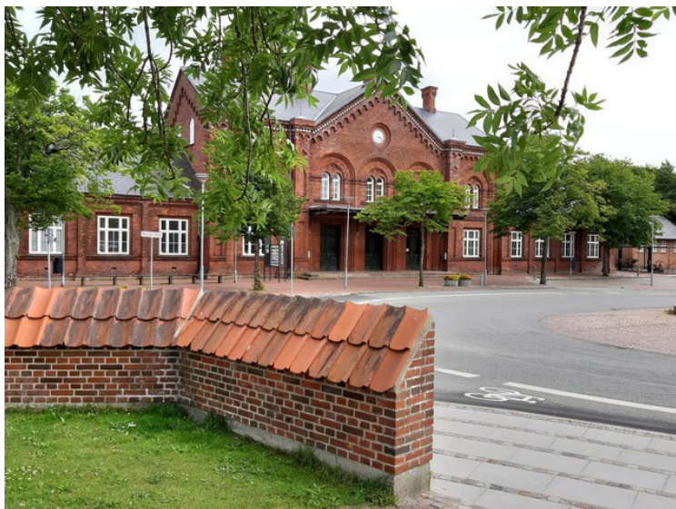
Ribe jernbanestasjon sett fra en annen vinkel.