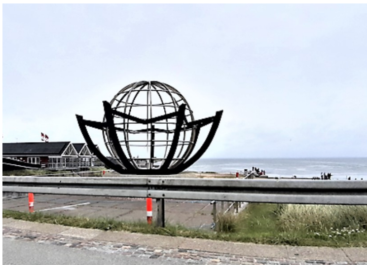
Her står også dette monumentet. Det heter « Cyklus » og er en folkegave i anledning av Hvide Sandes 75-års jubileum.