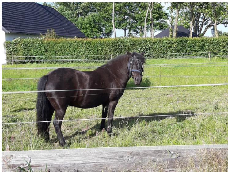
Utenfor leiligheten var det noen hester som lurte på hva vi gjorde der.