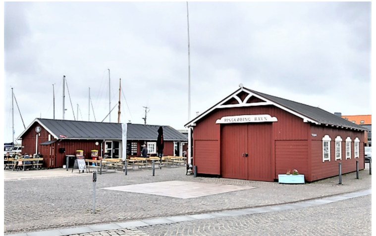
Dette er ved hovedhavnen.