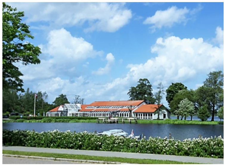
Restaurant Saloonen ved Nordersø.