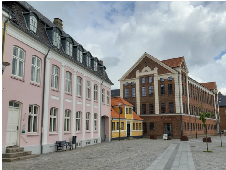
Flere bygninger her.