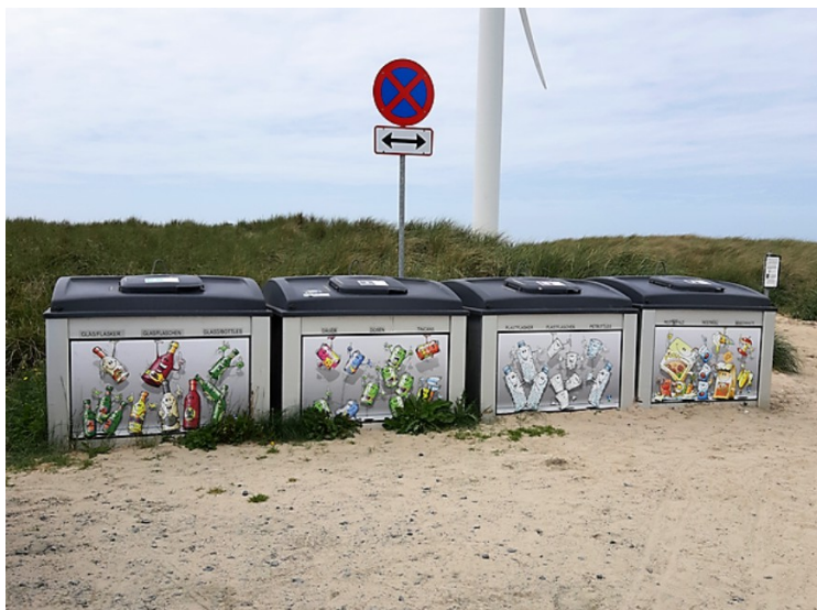
Her er det slutt på veien og det er laget en stor parkeringsplass. Dekorasjoner på søppelkassene.