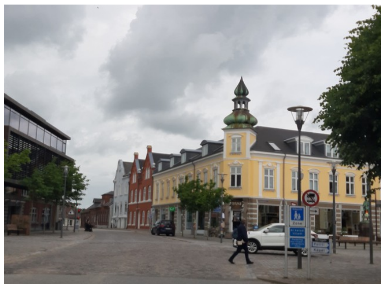
Her kommer vi til torget.

Nykøbing Mors er den største byen på Mors med rundt 9000 innbyggere. Den har vært kjøpstad siden 1299.