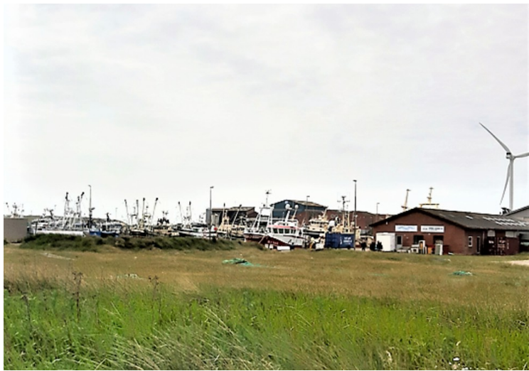
Her ser vi bort mot nordhavna.