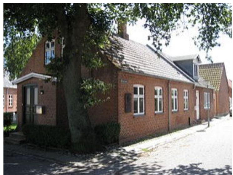
Her bodde den norsk-danske Aksel Sandemose . Han skrev janteloven .