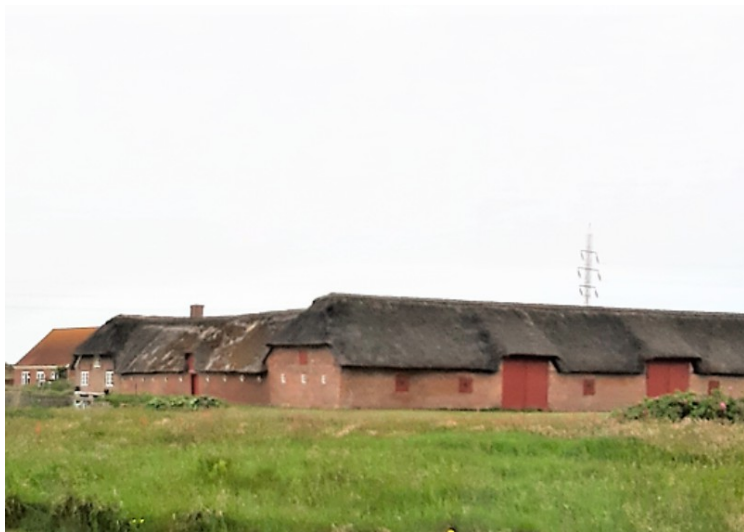
Så kjørte vi videre vestover. Her er noen hus med stråtak .