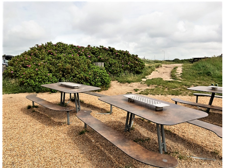
Her var det bord og benker.