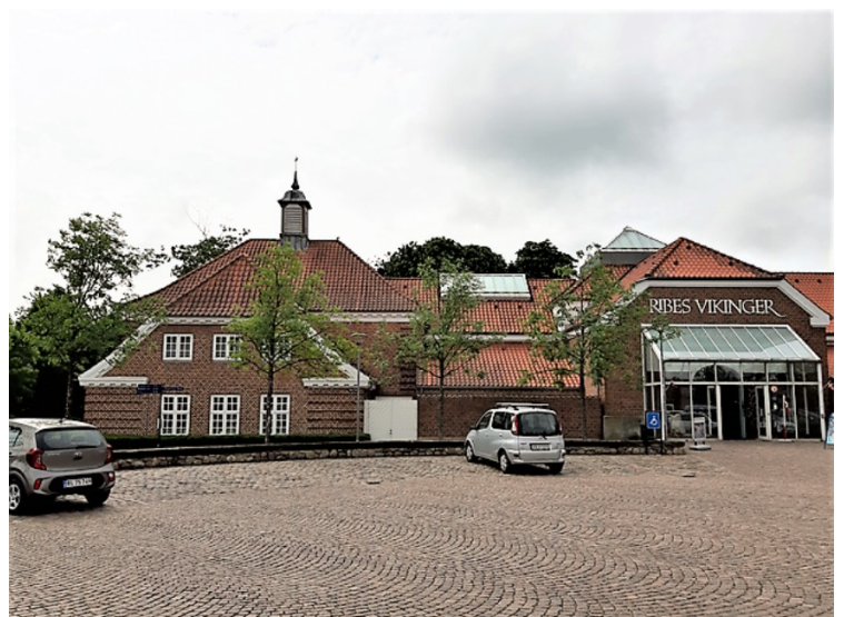
Ribes vikinger er et museum om vikingene.