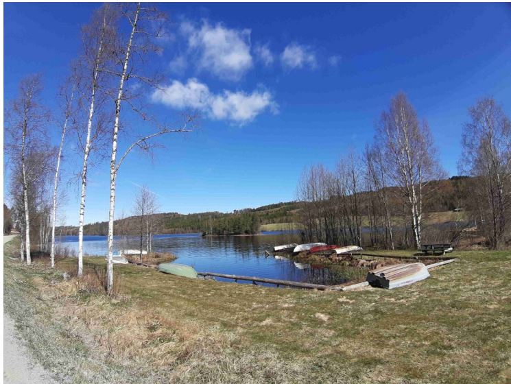
Det lå en del joller på land.