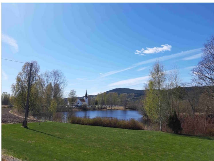
Vi kjørte en liten runde vestover og kjører her nedover langs Oppstadåa- Vi ser Oppstad kirke.