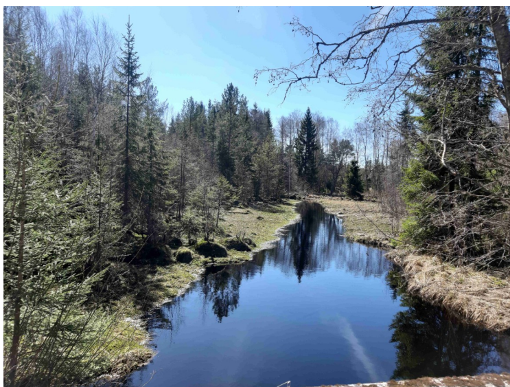
Her er vi nord for sjøen. Dette er Trondsåa som kommer fra nord og renner ut i sjøen litt lenger nede.