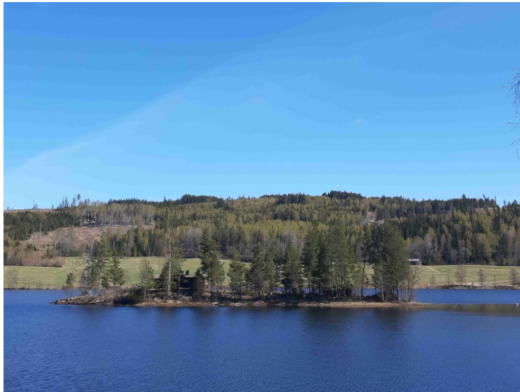
Her var det en liten øy med en hytte på.