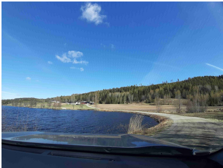
Her snudde vi. Vi ser Døli lenger borte.