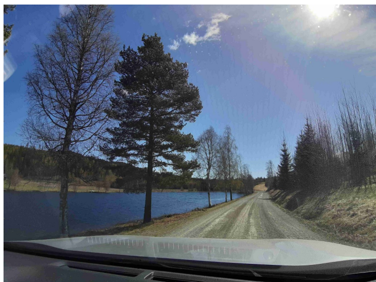
Vi kjørte et stykke på en vei som gikk langs sørsiden av sjøen.