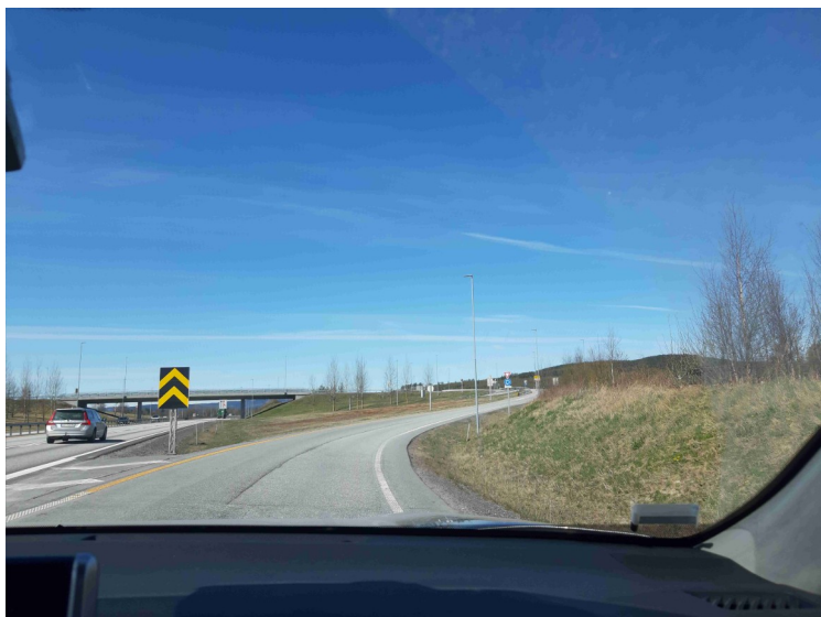
Vi kjørte deretter et stykke på E16. Her svinger vi av motorveien mot Slåstad.