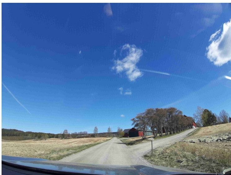
Her er vi kommet til Storsjøveien og skal ta av på veien til høyre, Tronsbuvegen, som går til nordsiden av Dølisjøen.