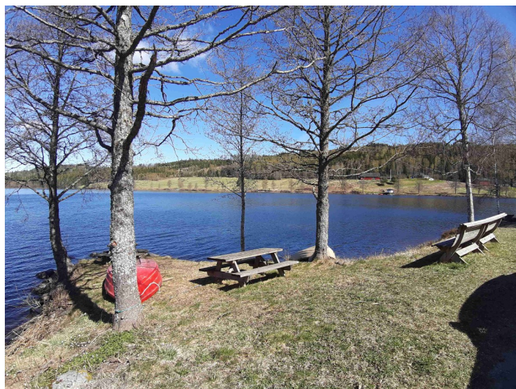
Her var det satt ut benker.