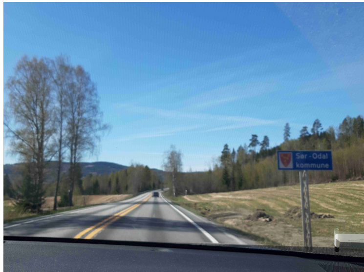
Her krysser vi grensen til Sør-Odal.