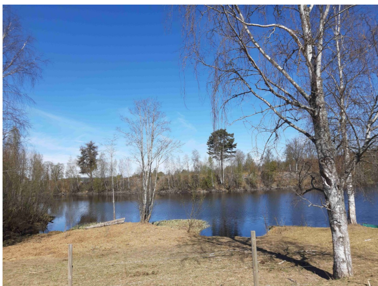
Her er vi kommet forbi Skarnes og ser ned mot Glomma.