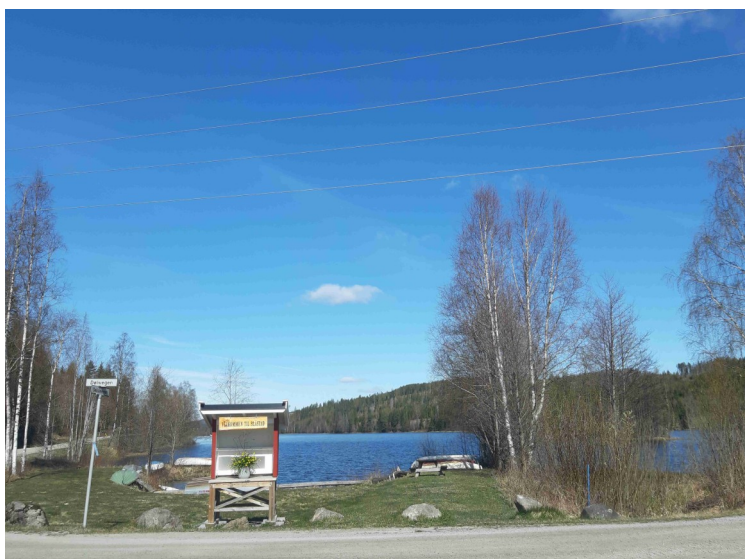
Her er vi kommet til Dølisjøen . På skiltet står det «VELKOMMEN TIL SLÅSTAD»