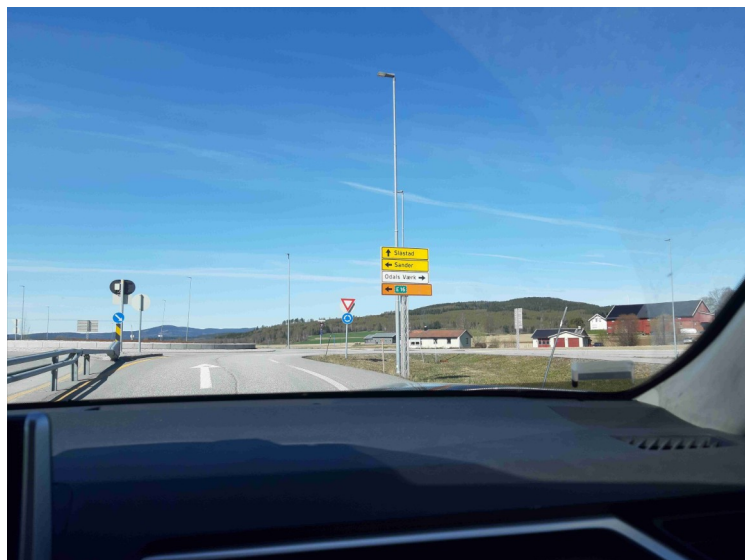
Skiltet viser mot Slåstad .