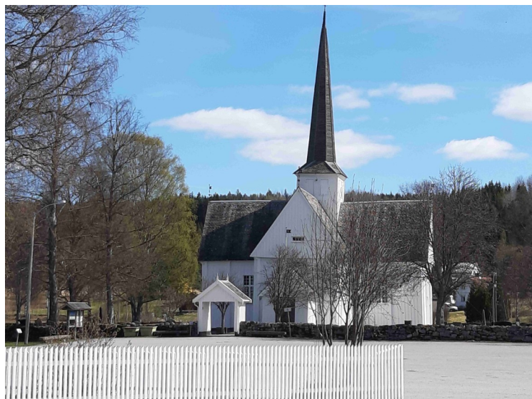
Eidskog kirke i Matrand . Kirken ble bygget i 1665, men det har vært kirker her siden 1000tallet.