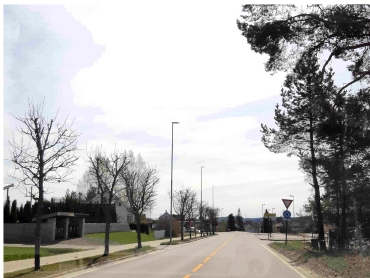
Så kommer vi til Skotterud .