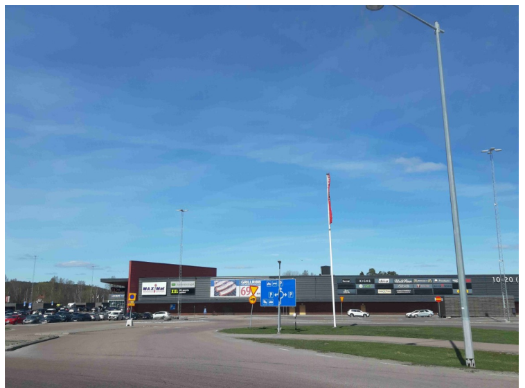
Vi skal til Charlottenbergs Shoppingcenter . Det ble bygget av Olav Thon i 2005-2006. Senteret har over 50 butikker og restauranter.