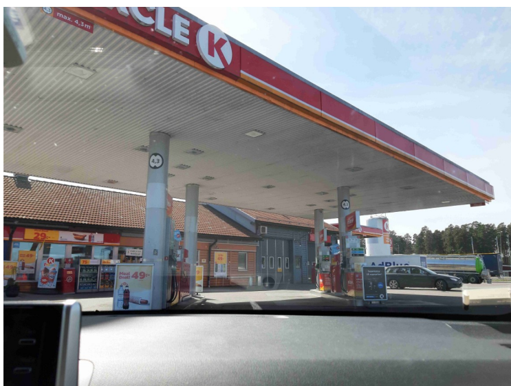
Vi fylte bensin før vi kjørte tilbake. Bensinen her kostet bar 16.44 SEK mot over 19 NOK i Norge. Valutaen er nesten lik for tiden.