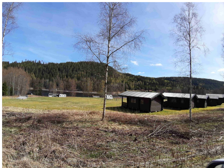
Her kommer vi til Sjøstrand Camping ved Børslungvegen i sørenden av Sigernessjøen.