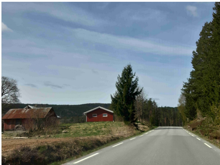
Her er vi ved Bergersrud.