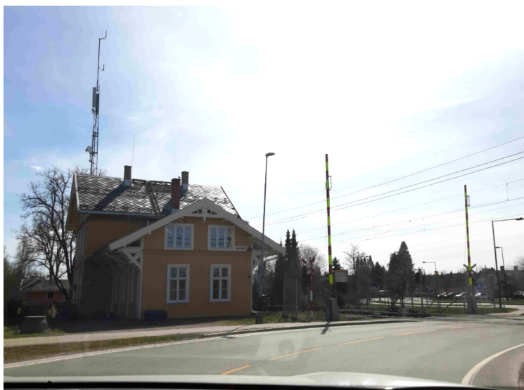
Et fint gammelt hus tvers over veien fra Magnor Glassverk.