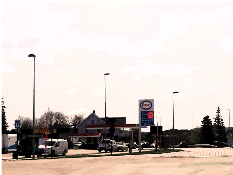
Bensinstasjon i Skotterud. Skotterud er administrasjonssenteret i Eidskog kommune.