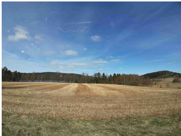
Det står igjen halmstubber fra i fjor.