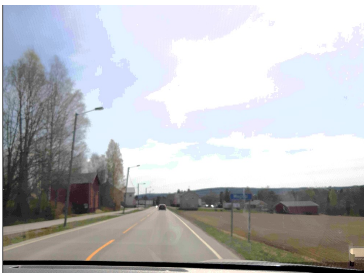
Så er vi på Grensevegen mot Magnor . Beine veien.