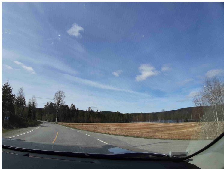
Vi kjørte et lite stykke på hovedveien til vi kom til Rauhallavegen.

Mellom Kongsvinger og grensen heter veien Arkovegen. Den fikk det navnet i 1971 fordi den går mellom Ar vika og Kong svinger.