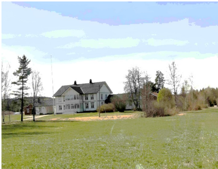
Retten syd for sentrum på Magnor ser vi Maridal Gård. Maridal Søm holder til der. De er spesialister på alt som har med bunadproduksjon å gjøre.