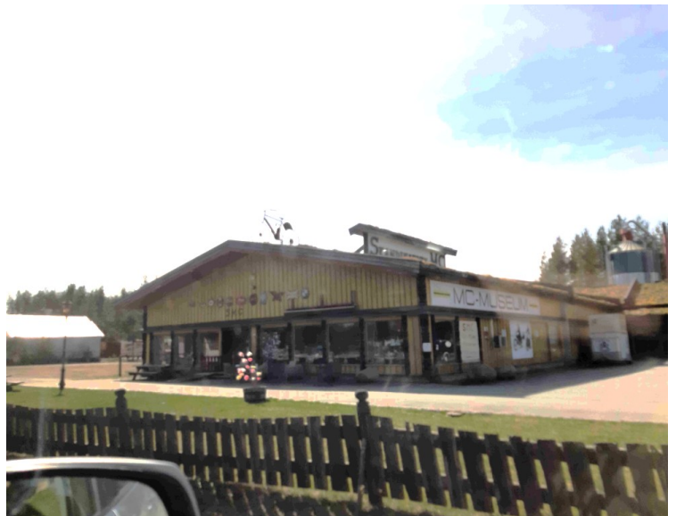
Dette er Skandinavisk Motorsykel Center . Her er det museum med veteransykler, verksted, butikk, cafe, etc.