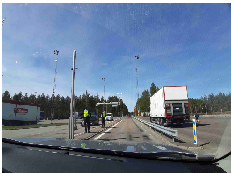
Så var det tilbake gjennom tollstasjonen i Eda.