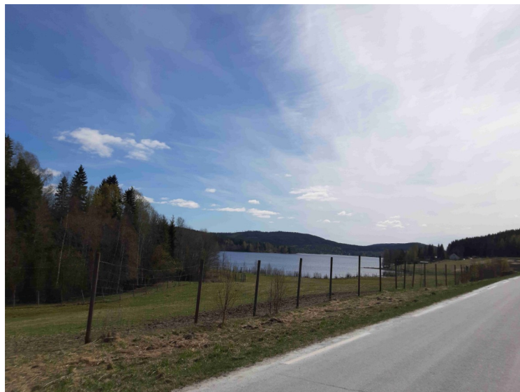
Her kommer vi på vestsida av Sigernessjøen.