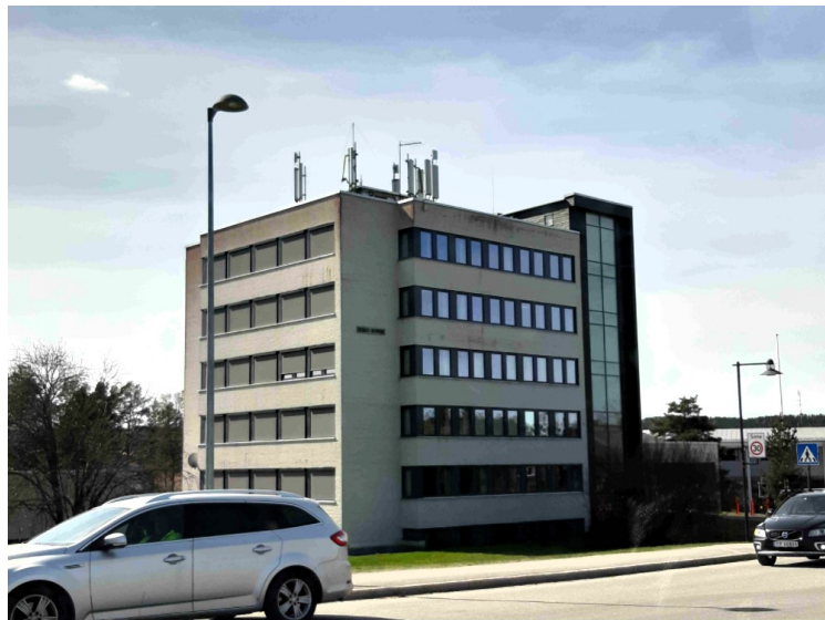
. Rådhuset i Eidskog . Det ligger i Skotterud.