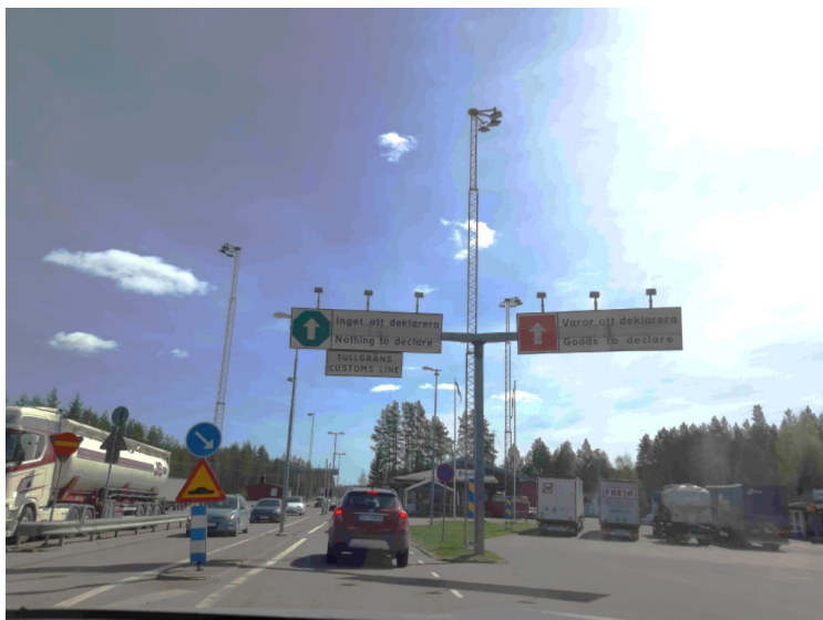
Så har vi passert grensen og kjører gjennom tollstasjonen i Eda.