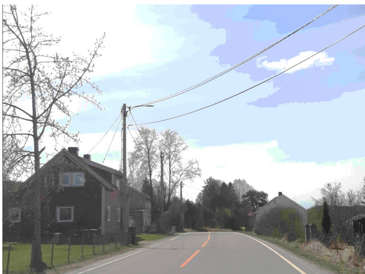
Mellom Matrand og Hesbøl.