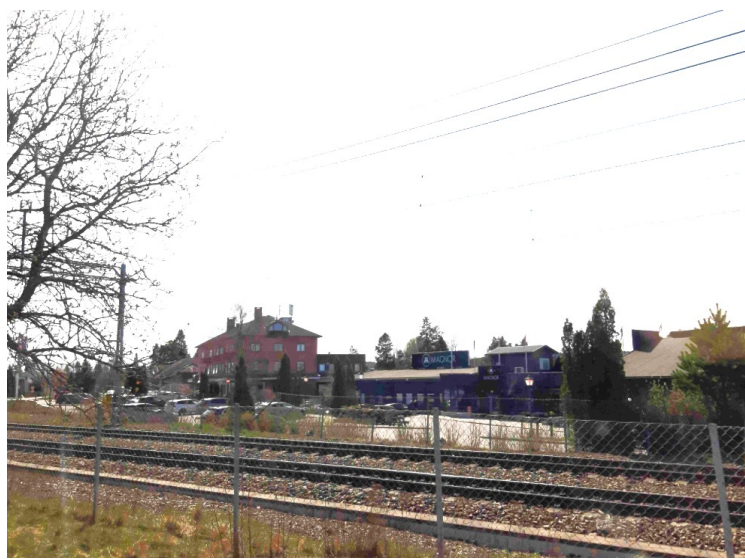
Magnor og Magnor Glassverk . Selskapets nettside . Glassverket ble etablert i 1896. I starten ble det produsert mest bruksglass, men etterhvert har en rekke designere bidratt med produktutvalget.