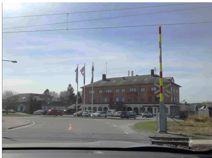
Hovedbygningen på Magnor Glassverk.