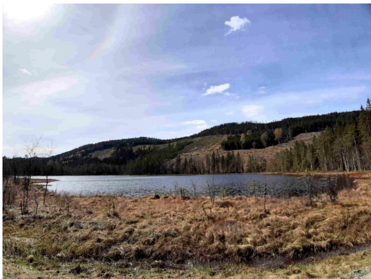
Motjennet ved Matrandvegen.