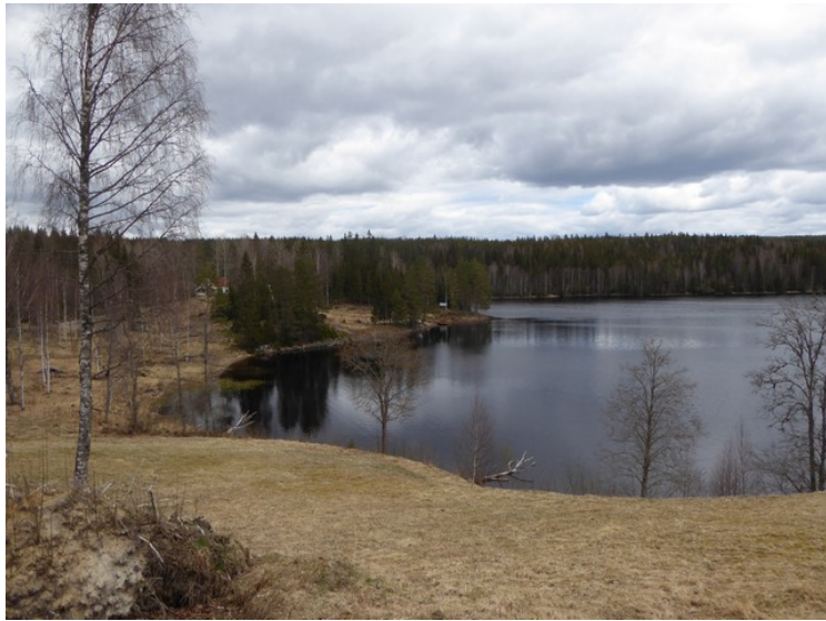
Tilbake mot bilen.