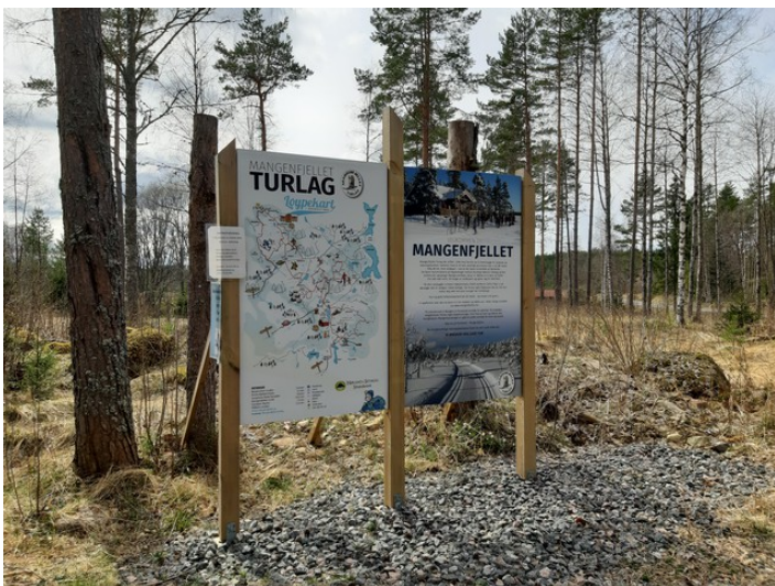
Vi gjorde også en stopp ved Store Garsjøen . Her er opplysnings-plakater for Mangenfjellet turlag .

Nordre Mangen og Søndre Mangen ligger ved innsjøen Mangen . Mangenvassdraget går forbi Arvika og Säffle og videre til Väneren i Sverige.