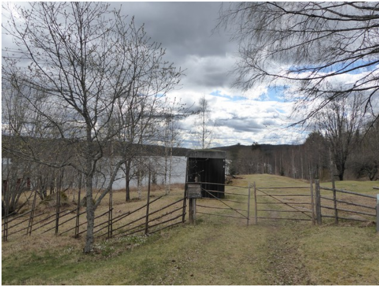
Her ser vi heggen og grinda.

Dette skiltet står ved siden av grinda. Heggen er en gave fra Kulturdepartementet og den er plantet av kulturminister Ellen Horn den 3. juni 2001.