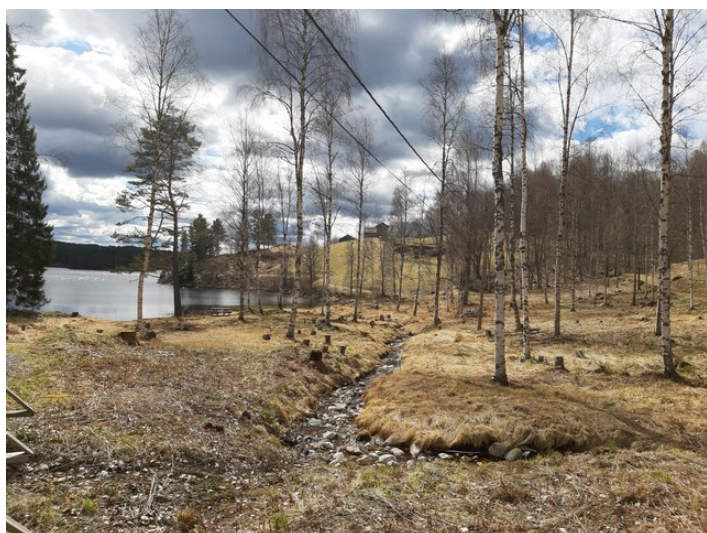
Utsikt fra parkeringsplassen mot Børli.