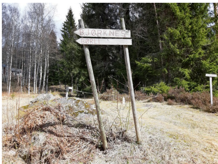
Skilt et stykke inn i skogen.

På veien bortover tok vi fra Matrand og den korteste veien mot Børli. Fra Tobøl var det mye løs grus på veien, så på tilbakeveien kjørte vi via Vestmarka og Skotterud.