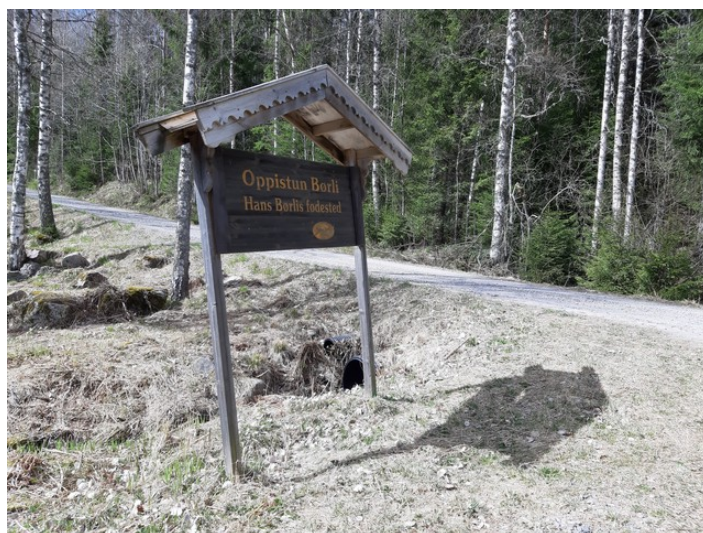
Ved parkeringsplassen nedenfor Børli.