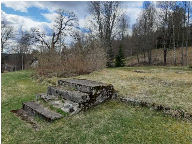
Våningshuset brant i 1969. Det er bare kjøkkentrappa som står igjen.