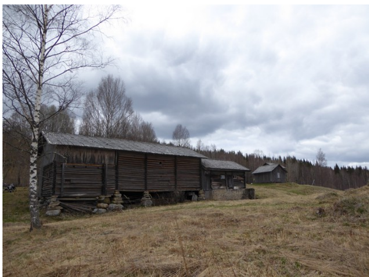
Husene sett nedenfra.