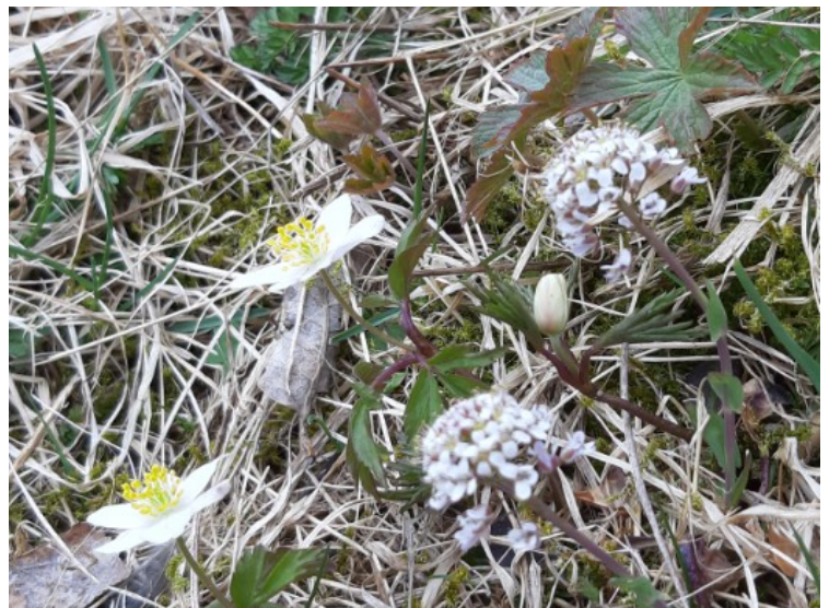
I området var det mye hvitveis og vårpengeurt .