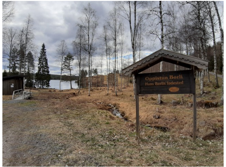
Her er vi ved parkeringsplassen.