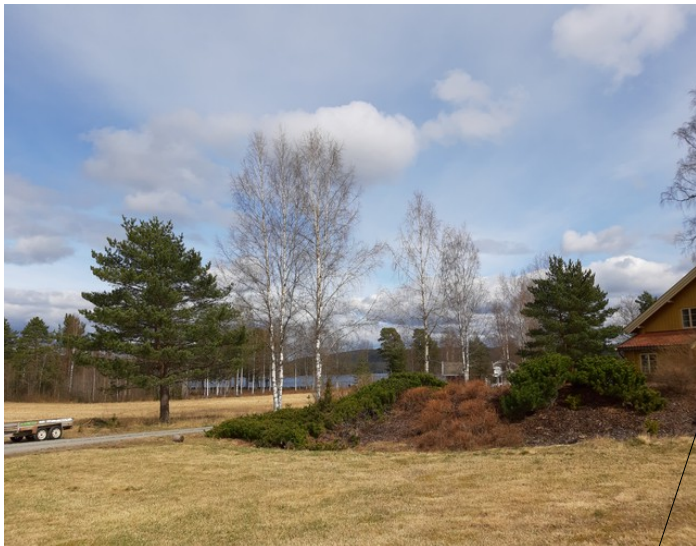
Vi stoppet og tok et bilde ved Søndre Mangen.