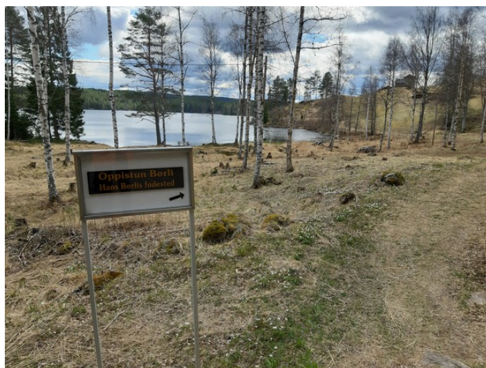
På vei bortover.