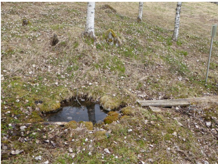
Nede i lia fant vi denne ila.

Langs alle stiene i området står det mange plakater med dikt av Hans Børli.