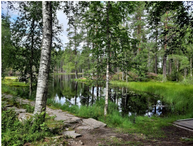
Her ser vi demningen og sjøen innenfor.