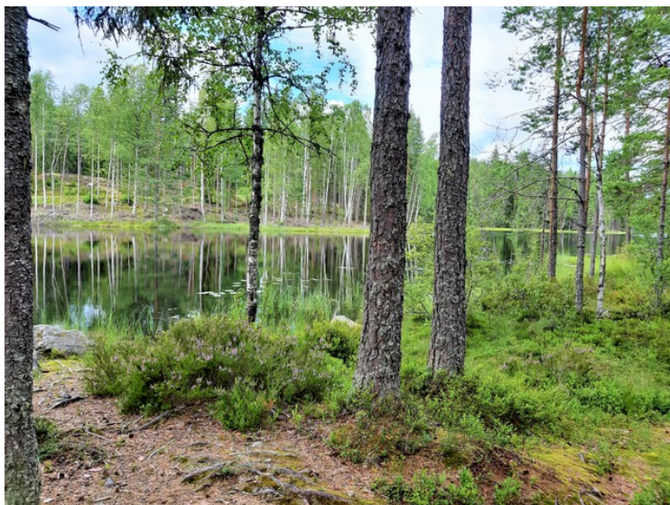
Nedenfor følger diverse bilder fra området rundt sjøen.