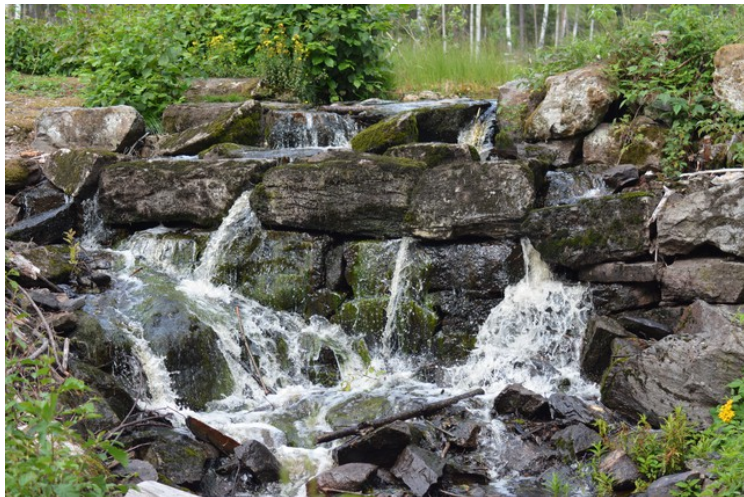
Overløp i demningen.