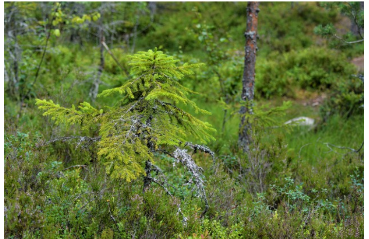
Gran med kvistlav .