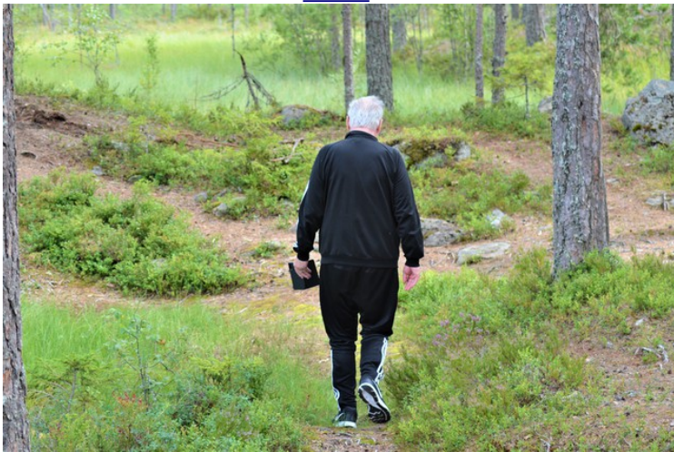
Jeg skal ta flere bilder.