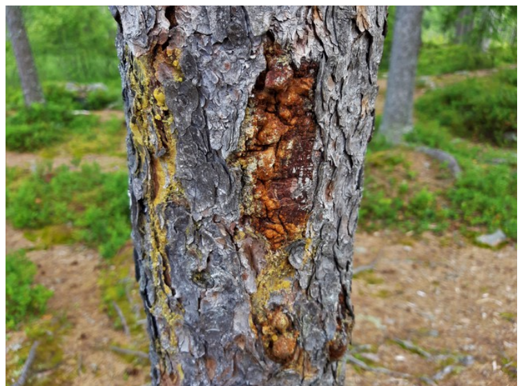
Hakkespetten har vært her i dette mørkne treet.