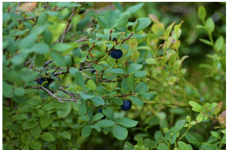
Blokkebær også kalt Mikkelsbær og Skinstryte.