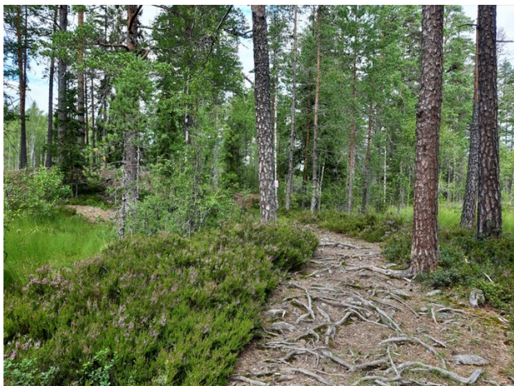
Det lages stier når folk ferdes i området.