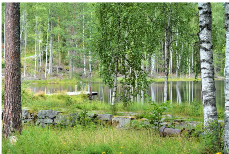
Dette er badebrygga.