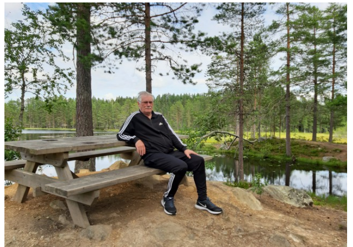
Vi sitter og ser på utsikten før vi kjører hjem igjen.