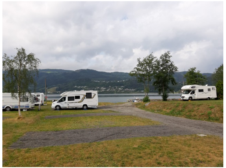
Snart på plass.