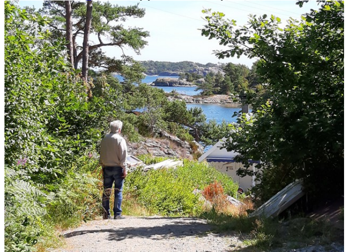
Her kommer vi til hytta.