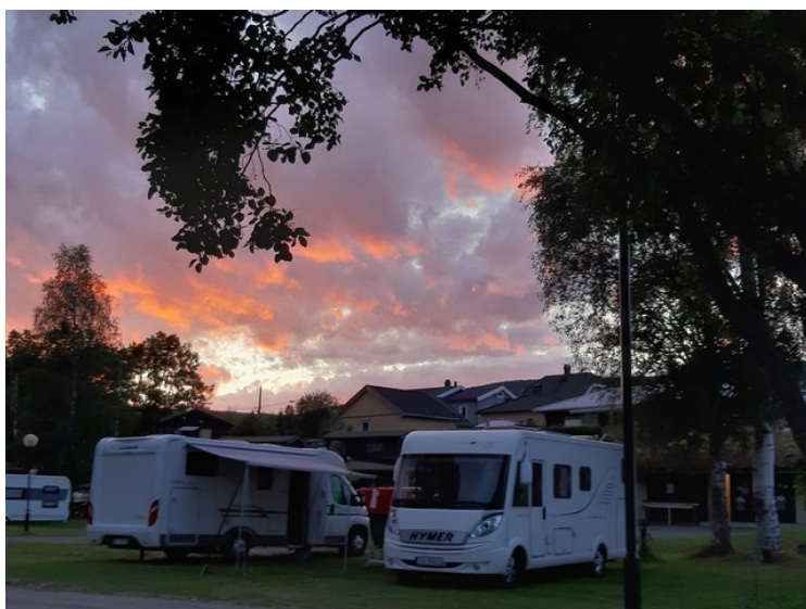
Her er vi på plassen.