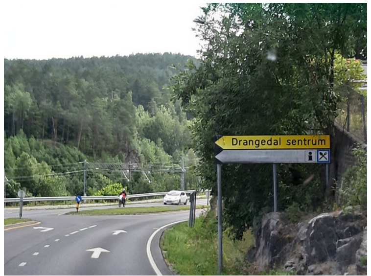
Her kommer vi til Drangedal .