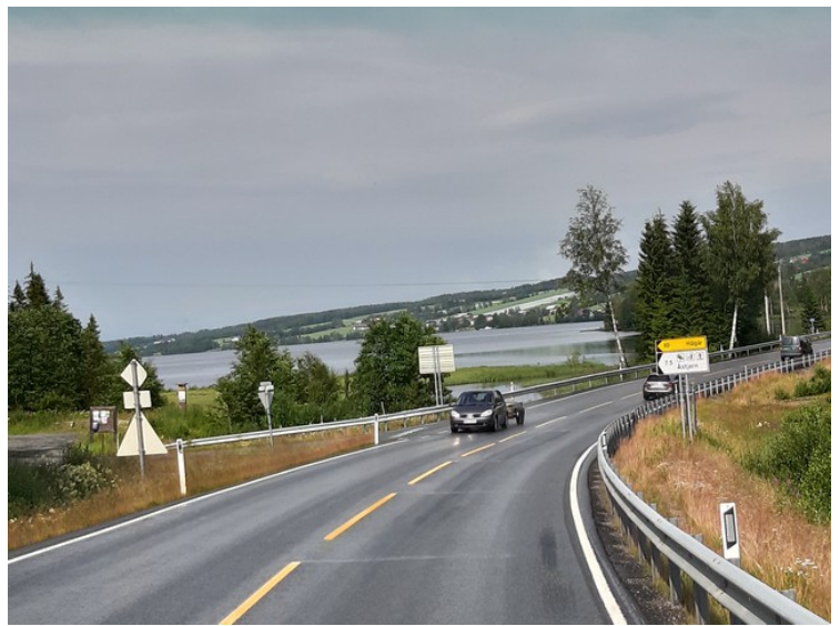
Nord for Lygna kommer vi til Einavatnet .