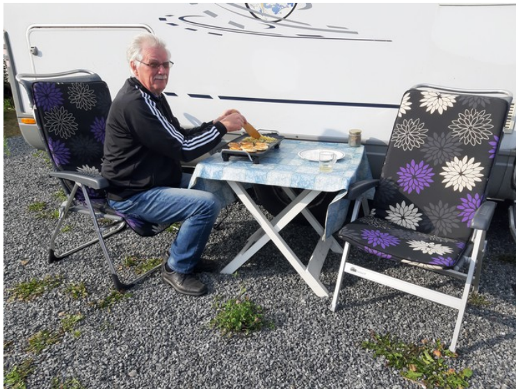
Jeg er i gang med løksteking.