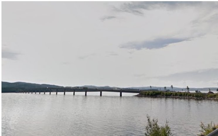
På veien hjem kjørte vi over Mjøsbrua .