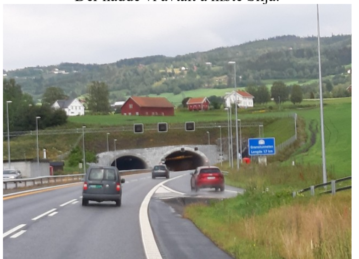
Dette er tunnelen på den nye hovedveien som går utenom Gran .