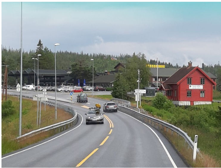
Dette er Lygna som ligger på det høyeste partiet på veien som går mellom Hadeland og Toten .