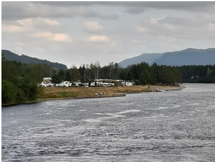
Hokksund Camping ligger rett ved elva.