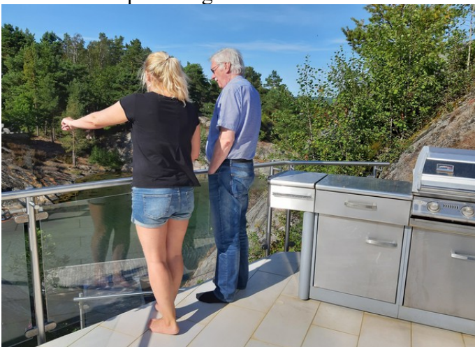
Her ser vi på utsikten.