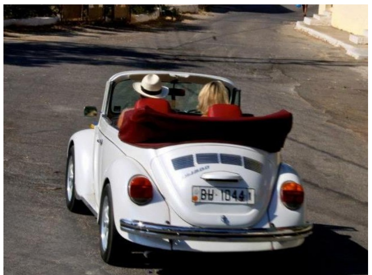
Men først besøkte vi Asbjørn og Rigmor Mythen. Jeg har stjålet bildet fra Facebook-siden deres.