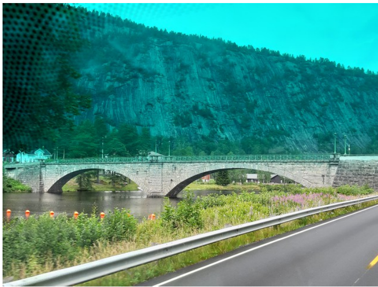
Her kjører vi forbi Åmfoss bru i Åmli . Det er en av nord Europas lengste steinbruer. Den går over Nidelva som munner ut ved Arendal .