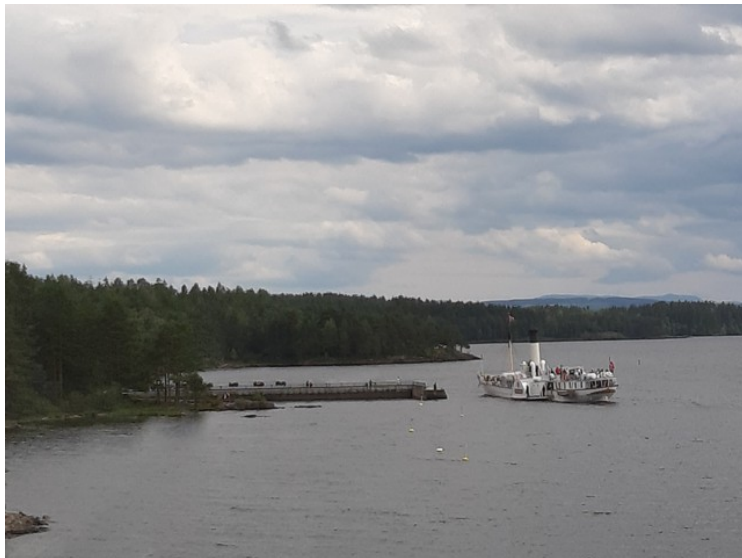
Da vi var oppe på brua så vi Skibladner som la til kai ved Moelv brygge.