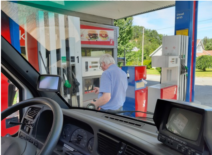
Dagen etterpå skulle vi besøke datteren min som har kjøpt hytte i Søgne . Her fyller jeg diesel på underveis.