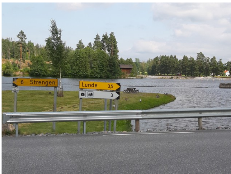
Så kommer vi til Straumen som er en elv i Skiensvassdraget som munner ut ved Skien. Det går båter her hver dag.