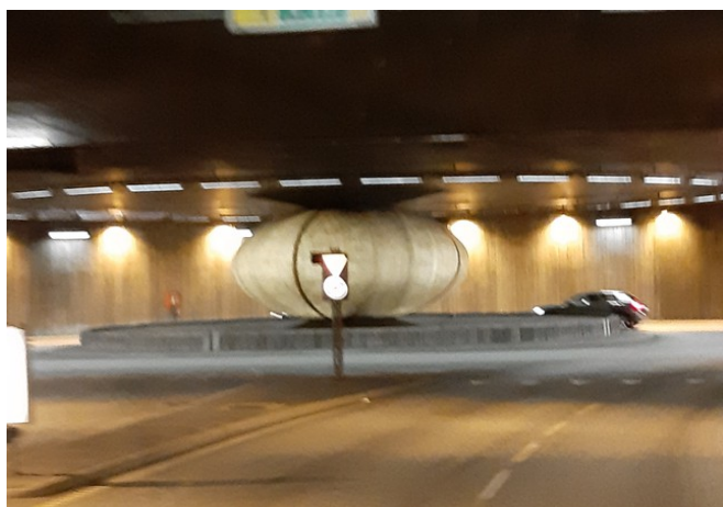
Dagen etterpå kjørte vi videre gjennom en rundkjøring i tunnelene gjennom Drammen.