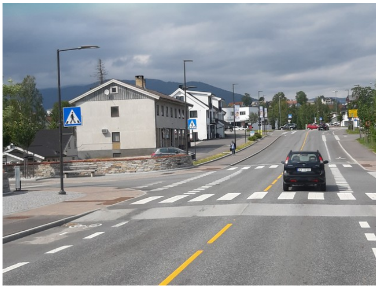
Dette er i utkanten av Notodden .