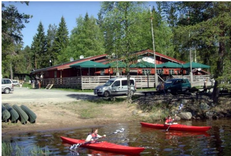
Vi fikk plass rett bak hovedbygningene til venstre i bildet.