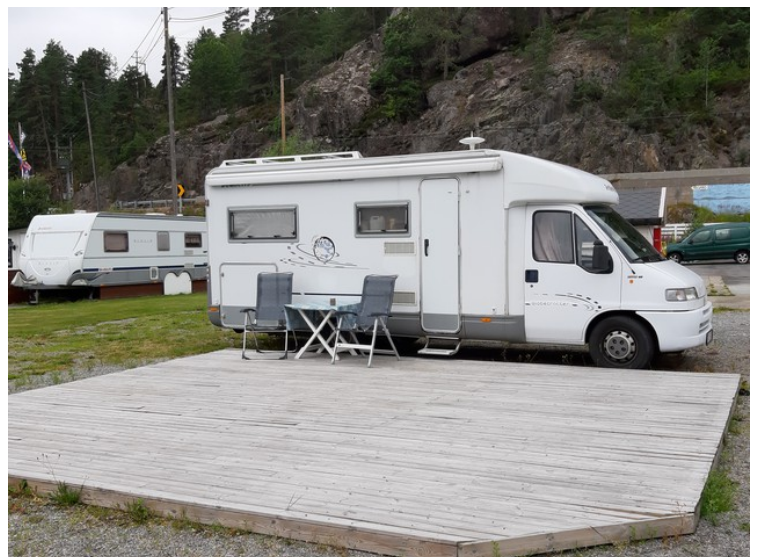
Vi fikk en veldig stor terrasse.