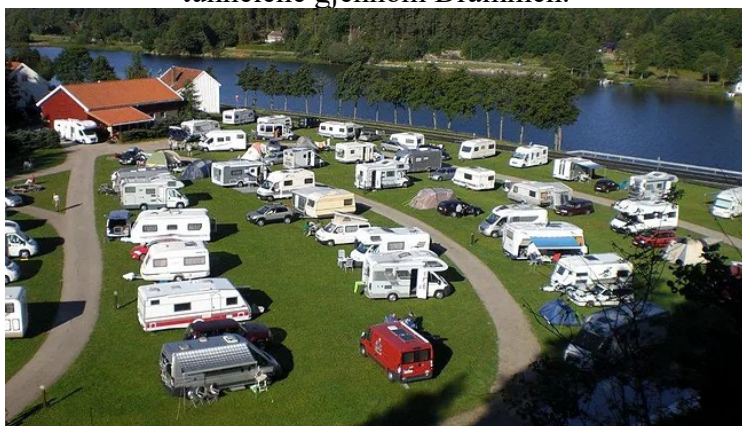
Vi kjørte til Sandnes Camping utenfor Mandal .