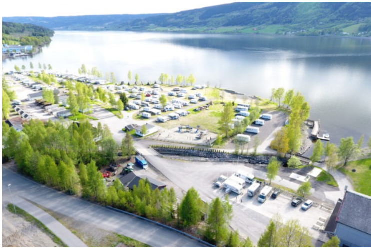
Så ble det stopp på Lillehammer Camping .