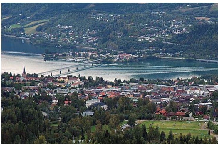
Siste stopp denne dagen er i Lillehammer . Vi har tenkt oss til Lillehammer Camping.