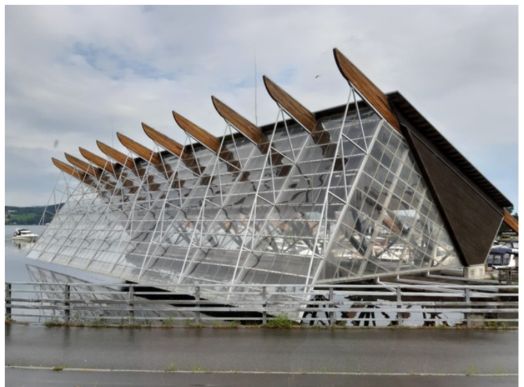
I Gjøvik ligger dette huset hvor DS Skibladner ligger i vinteropplag.