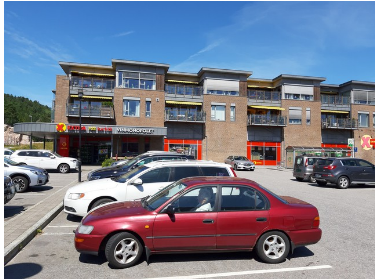
I Tangvall stoppet vi for å proviantere.