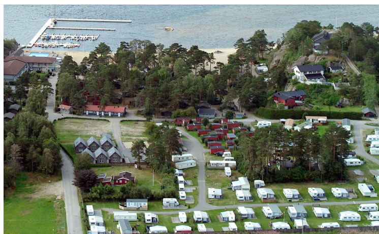
Vi kjørte til Åros Camping . Der var det nesten fullt og de plassene de kunne tilby var så dårlige at vi kjørte videre.