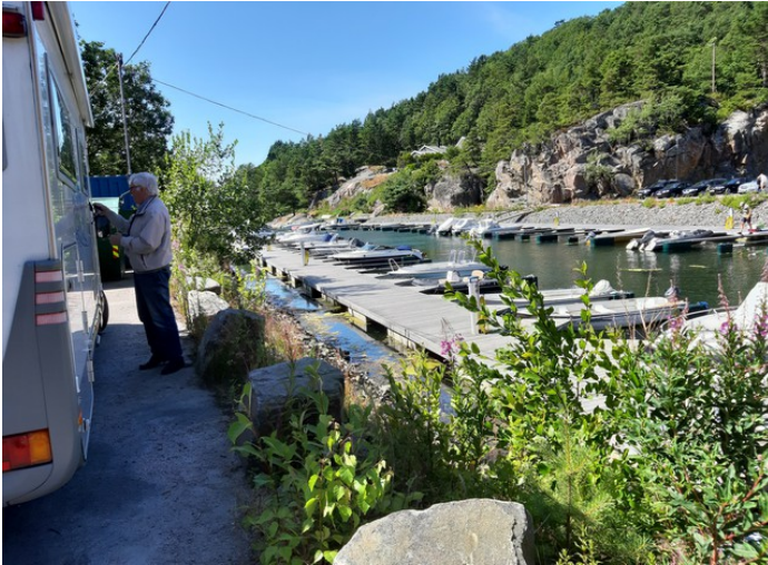
Vi fant parkering i Prestebukta Båthavn.