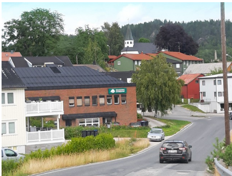
Litt av sentrum i Drangedal.