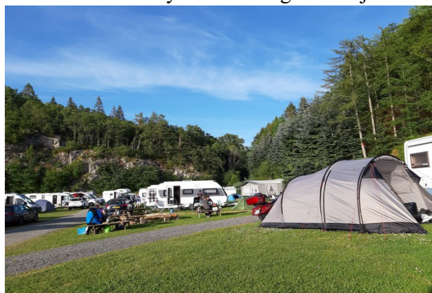
Noen bilder fra plassen.