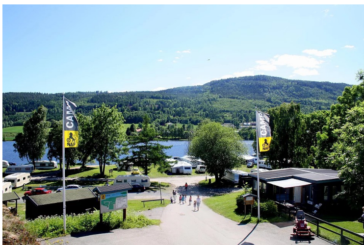
Etter to overnattinger ved Skasen , kjørte vi videre til Drammen hvor vi tok inn på Drammen Camping .