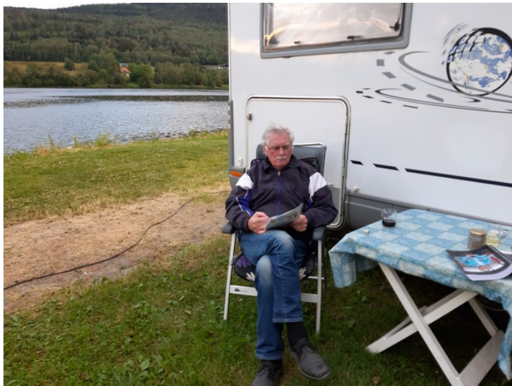
Litt kryssordløsning om kvelden.