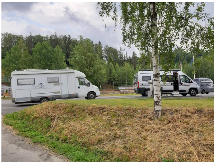
Neste dag drar vi videre.