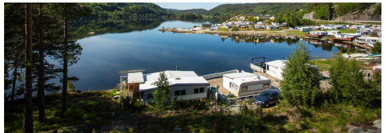
Neste stopp var på Bornes Camping rett syd for Evje .