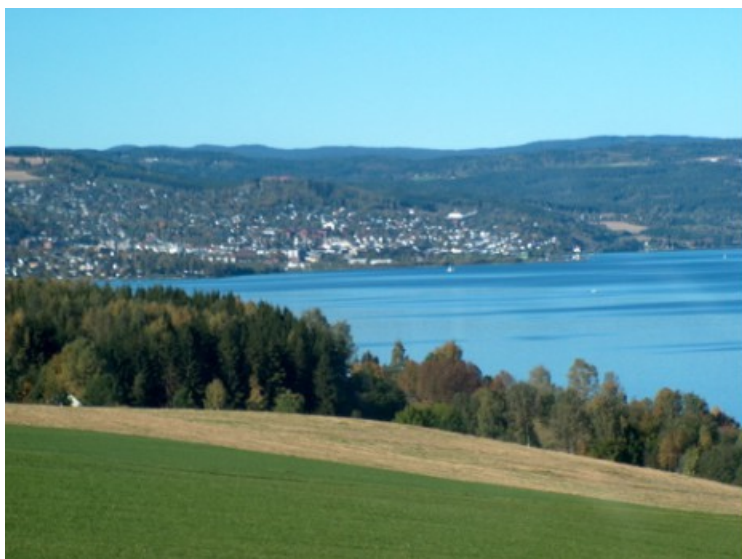
Vi kjørte gjennom Gjøvik .