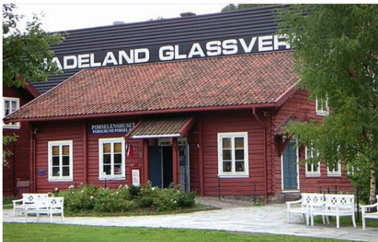
Neste stopp var på Hadeland Glassverk . Dette er en av de mange bygningene på verket.