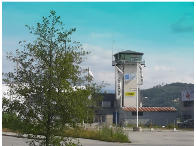
Vi kjørte tvers over landingsbanen på flyplassen .