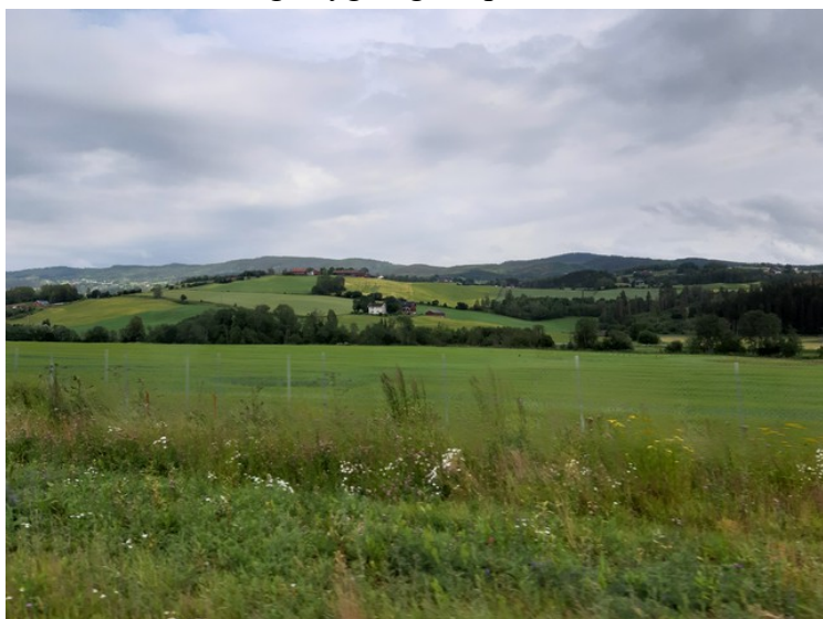
Vi kjørte gjennom Hadeland .