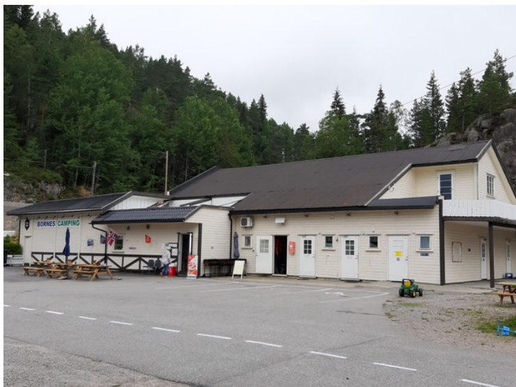
Resepsjon og service-bygning.