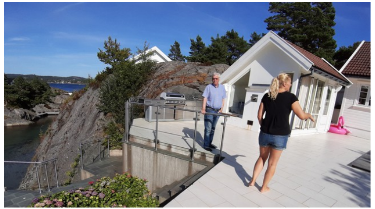
Hytta med anneks og basseng.