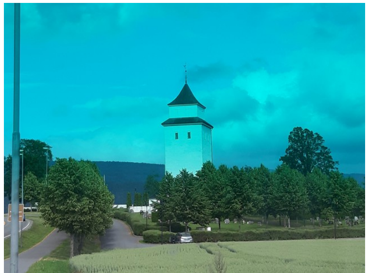
Målet vårt denne dagen var Hokksund . Dette er Haug kirke i Hokksund.