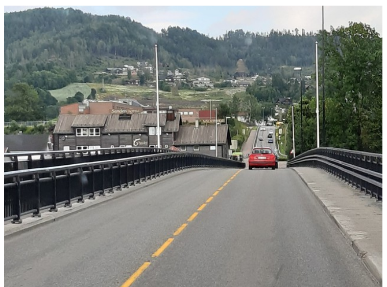
Brua som går over Drammenselva .