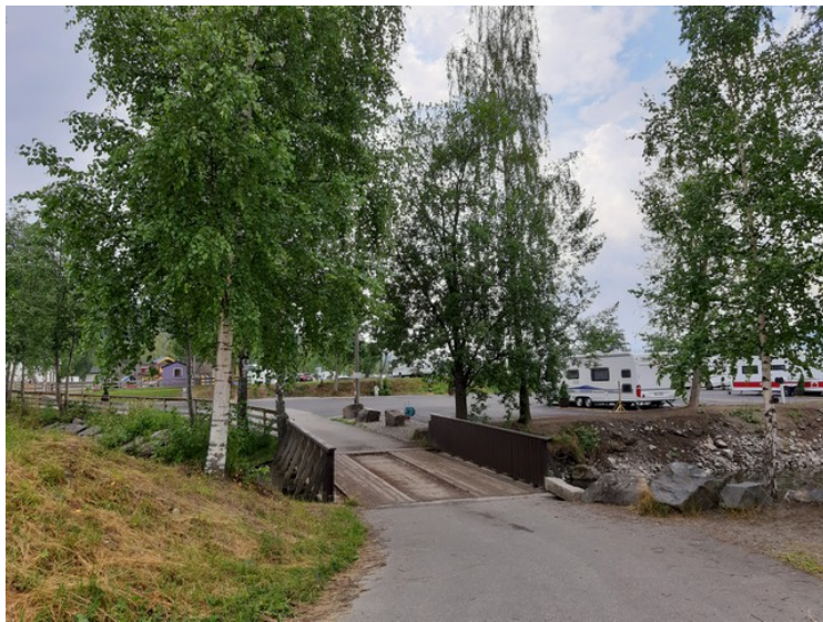
Bilder fra plassen.