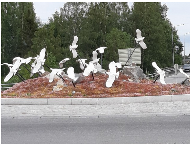
Nesten hjemme. Fjellryper i rundkjøringen i Skarnes .