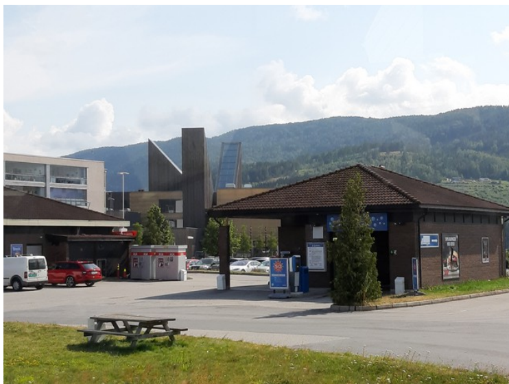
Dette er litt av Hydroparken i Notodden. Bakerst ser vi Notodden Kino.