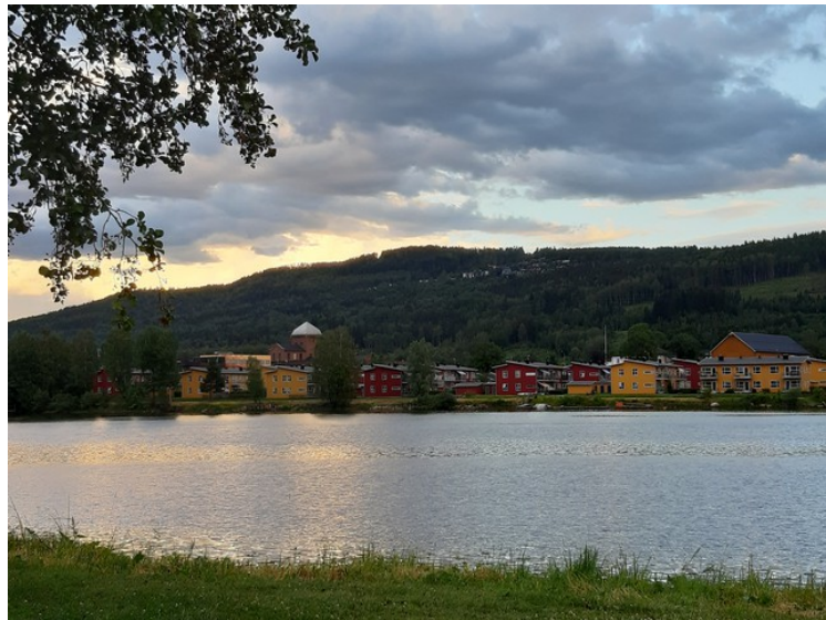
Noen utsiktspbilder fra plassen om kvelden.