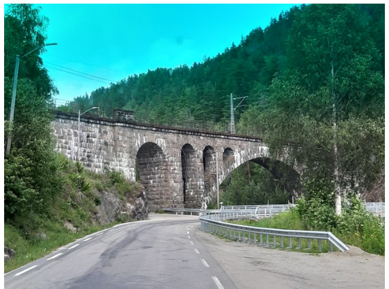
På nordsiden av Drangedal kjører vi over innsjøen Toke . Den hadde forbindelse med havet rett etter istiden, og det er fremdeles 10-12 meter med saltvann i bunnen. Her går også Sørlandsbanen .