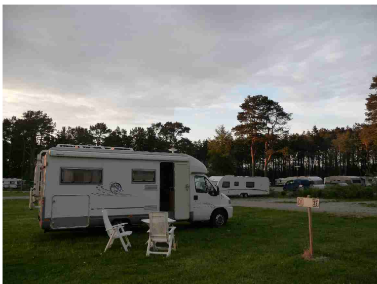
Dette er på Vølstadskogen Camping i Sandnes.