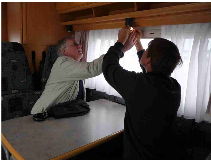
Her var en lyspære gått.