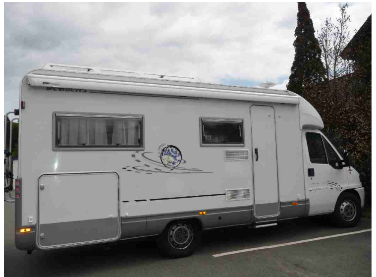
Utenfor Grimstad Vertshus.