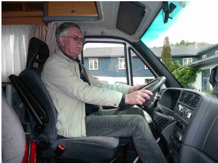
Endelig klar til å kjøre.