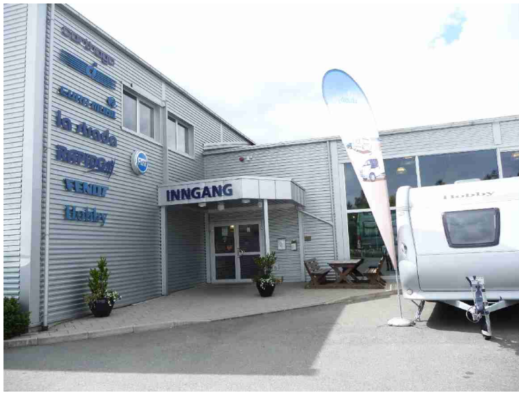
Inngangen til kontorene.