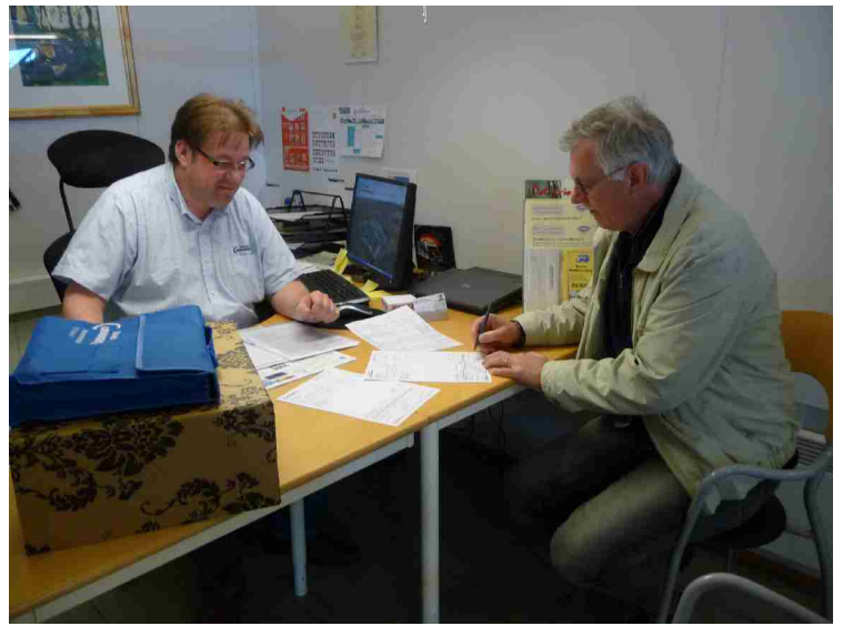
Skriving av kjøpekontrakt.