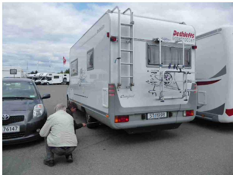
Tømming av gråvannstank