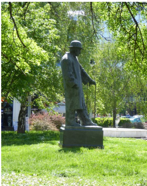
Statue av Branislav Nušić (ekte navn Alkibijad Nuša) (1864 - 1938), serbisk forfatter, journalist og diplomat. Den står tvers overfor Republikkplassen.