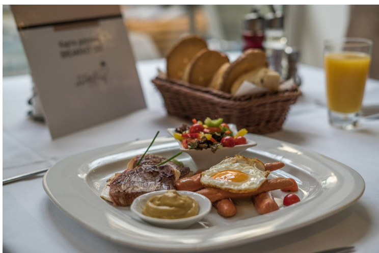
Det var god frokost og god kaffe. Frokosten kunne bestilles fra meny og når maten var klar ble den servert av betjeningen.