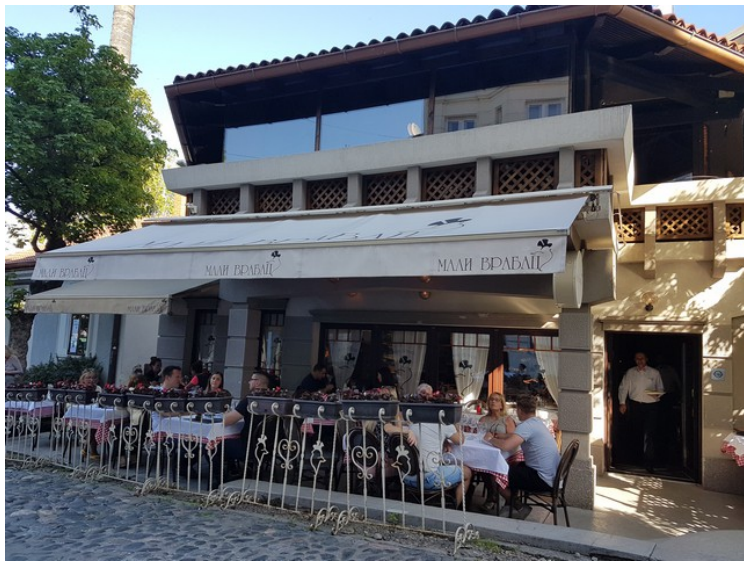
Om kvelden spiste vi på restauranten «vår»