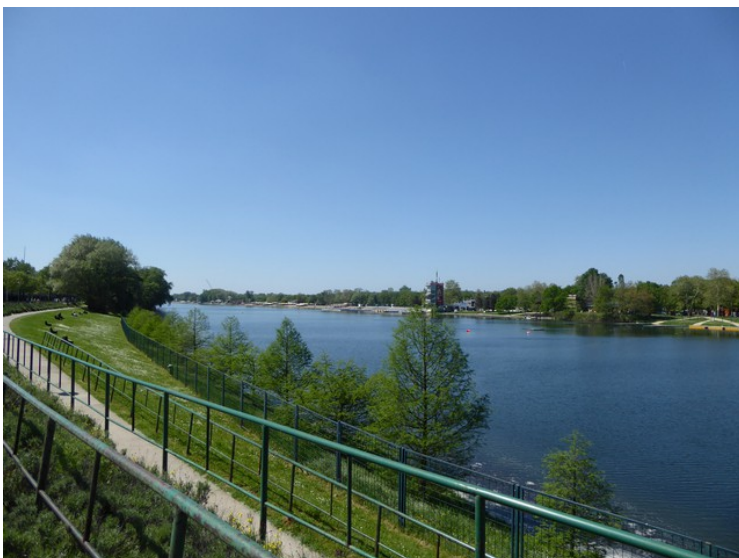
Utsikt mot den søndre enden av Savasjøen. Til høyre ser vi øya og til venstre fastlandet. Sjøen er 4km lang.