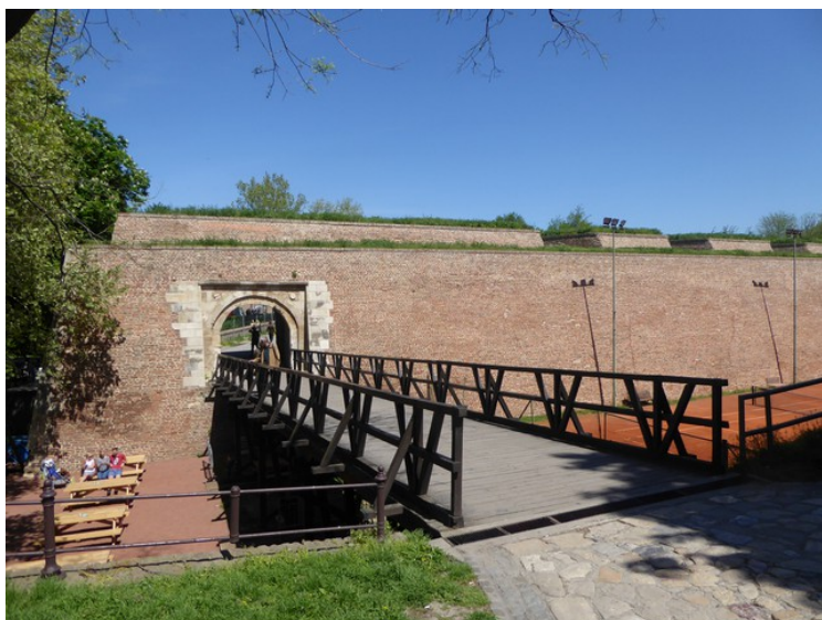
Dette er Karadjordje-porten som er oppkalt etter Karadorđe ( Đorđe Petrović ). Han var en serbisk motstandsleder som kjempet for løsrivelse av Serbia fra det osmanske herredømmet