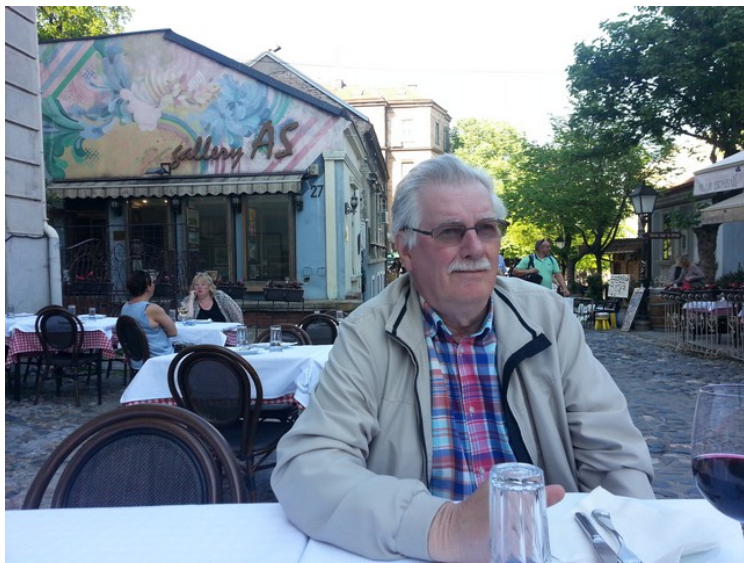
Her sitter jeg og venter på servering.