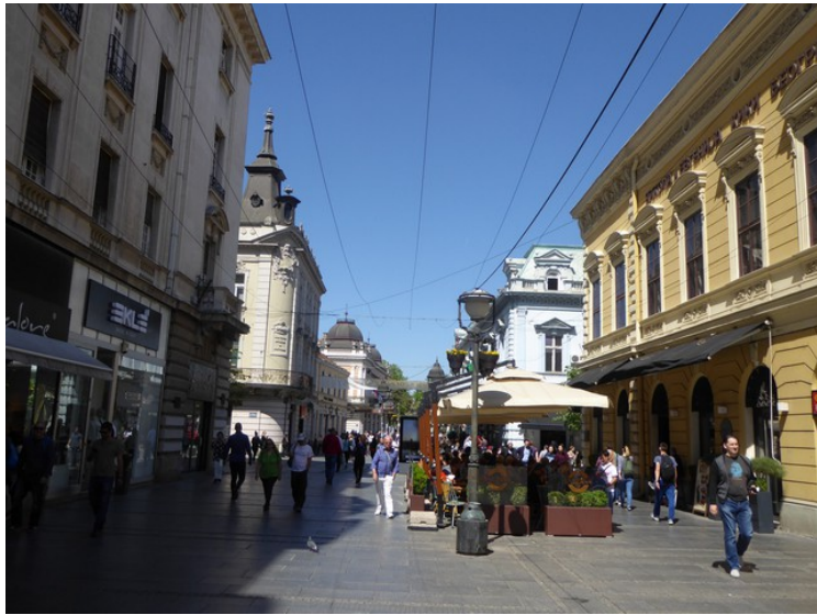
Dette er nesten i enden av gata. Vi ser trærne i Kalemegdan-parken bakerst.