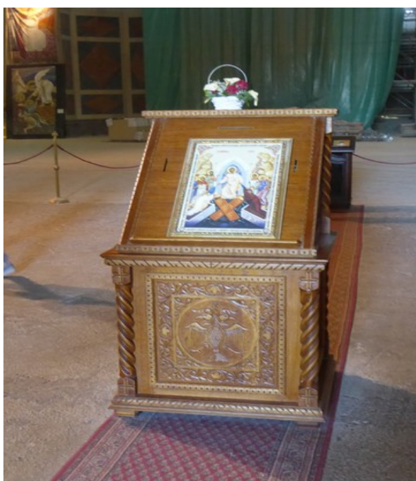
Foran denne blir det gjort korsets tegn.