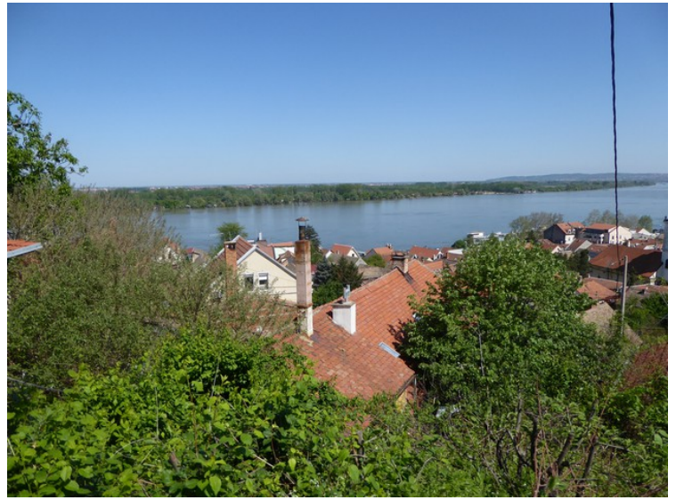
Dette er utsikten fra tårnet ut over Donau.