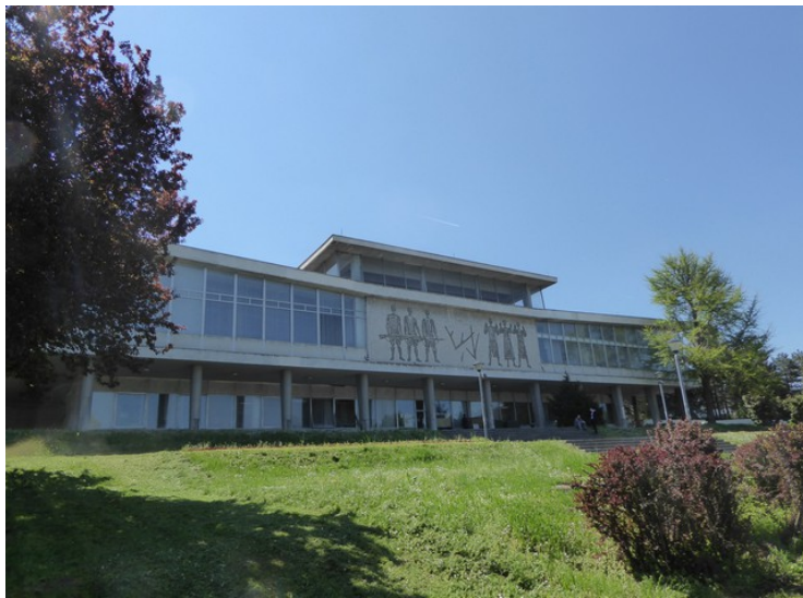
Josip Broz Tito Mausoleum (Blomstenes hus) sett fra veien. Det ble bygget i 1975 som en vinterhage for Tito. Han ble gravlagt her 1980.