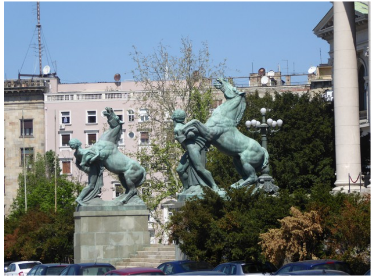
Ved hovedinngangen står disse statuene.