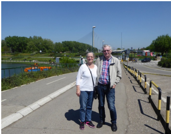
Her er vi ved Ada Ciganlija (Savasjøen).