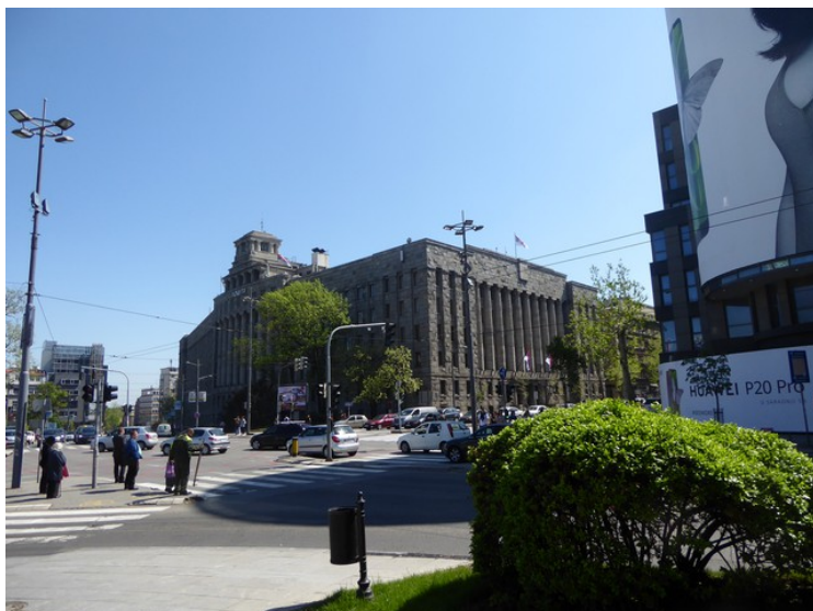
I samme området ligger hovedpostkontoret i Beograd.