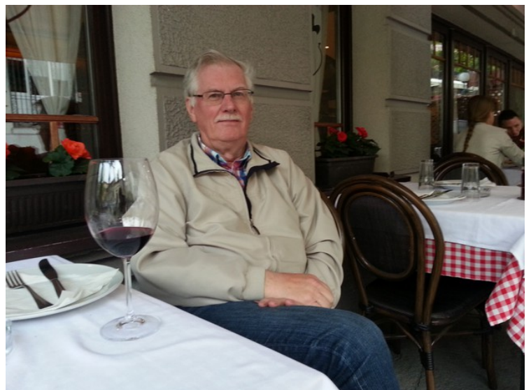
Da vi kom tilbake til hotellet, hadde vi en sein lunch. Vi hadde en «appetizer» (forrett) for 2 personer. Det var så stor porsjøn at vi ikke orket mer mat den dagen.