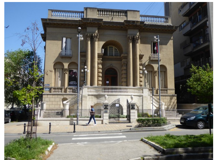
Så har vi kjørt videre til museet som er tilegnet Nikola Tesla . Tesla var en pioner i arbeidet innenfor moderne elektroteknikk. Han ble født i dette huset, og det ble åpnet som museum i 2006.