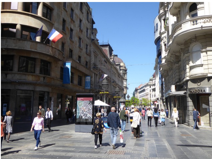
Det er en stor gate og mye folk selv om det er tidlig på dagen.