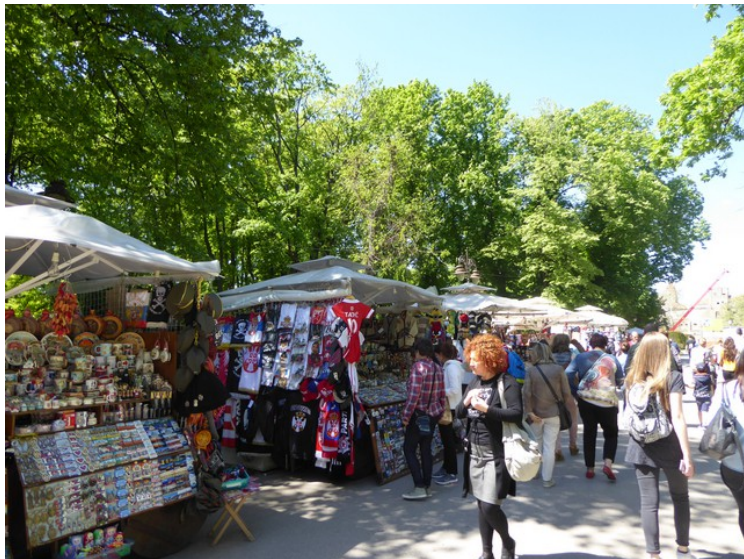
I enden av Kneza Mihailova kommer vi direkte over i Kalemegdan -parken. I starten er det en mengde salgsboder.