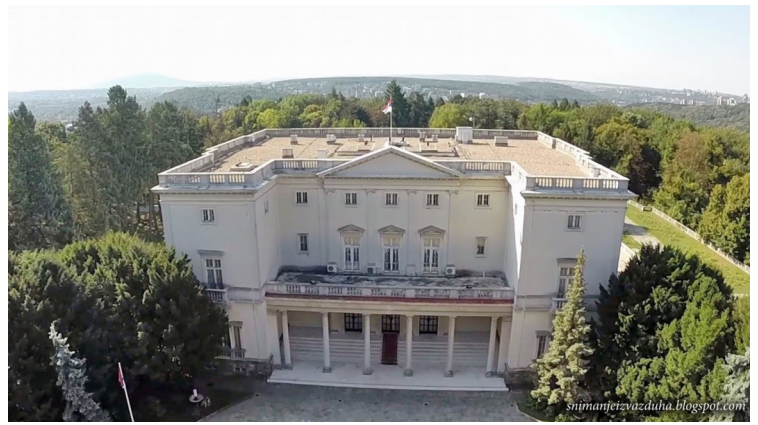
Vi hadde tenkt å få se The White Palace /Beli Dvor (Det hvite slottet), men vi fikk ikke komme innenfor porten. Det er bare åpent i weekendene. Rundt huset er det en kjempestor park. Det var opprinnelig en kongelig bolig for Karadorđević dynastiet.