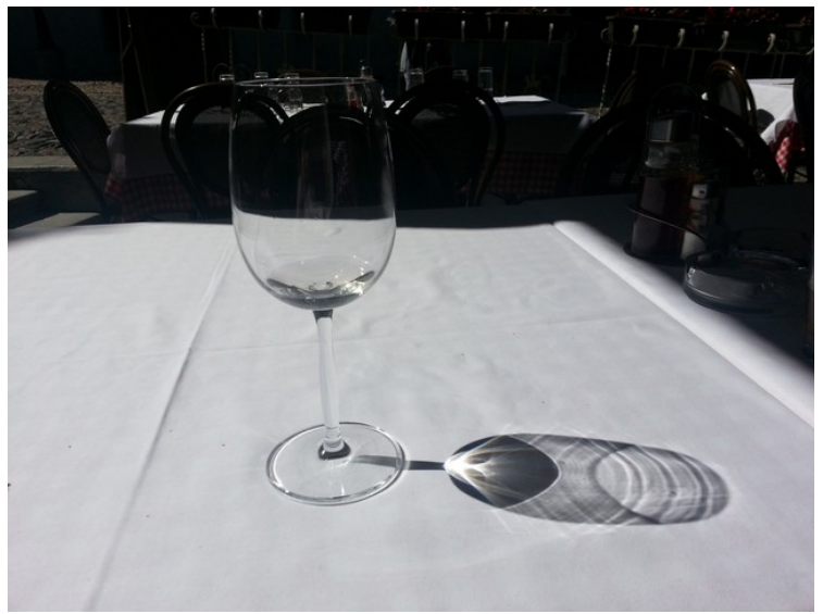
På vei tilbake til hotellet ble vi slitne og vi fikk en taxi til å kjøre oss det siste stykket. Da vi kom dit syntes vi at vi hadde fortjent en øl og et glass vin.