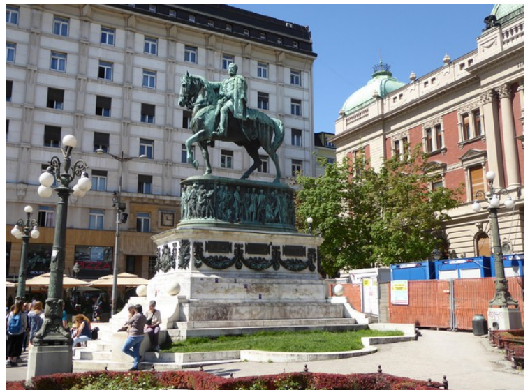
På Republikkplassen står en statue av Mihajlo Obrenović (1823 - 1868) som var fyrste av Serbia to ganger. Først fra 1839 til 1842, da han ble avsatt, så fra 1860 til 1868, da han ble drept.