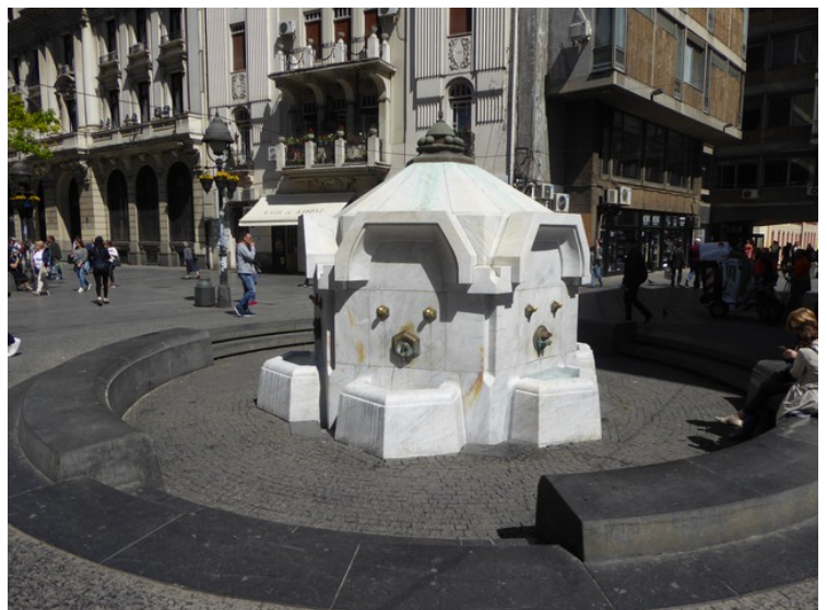
Her er det en fontene.