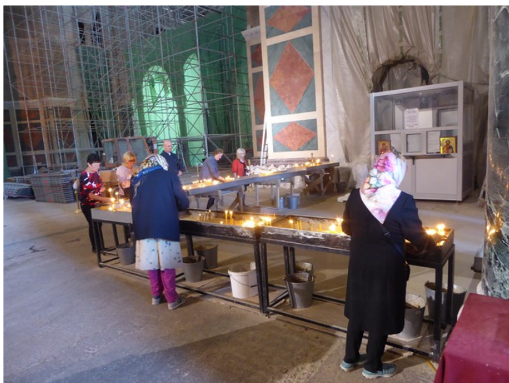
Tenning av lys.