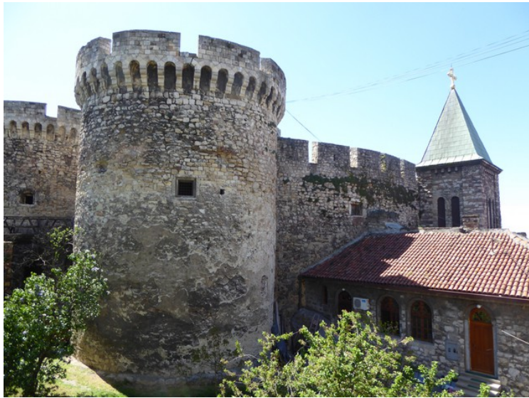
Ett av tårnene på Zindan-porten og tårnet på Ruzica-kirken .