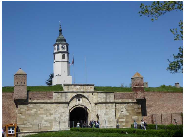
Den neste porten vi gikk gjennom heter Stambol-porten. Porten er oppkalt etter Istanbul.