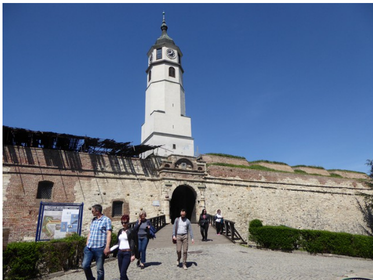
Her er Klokke-porten som er den innerste porten her. Den har fått navnet sitt fordi den er plassert rett under klokketårnet.