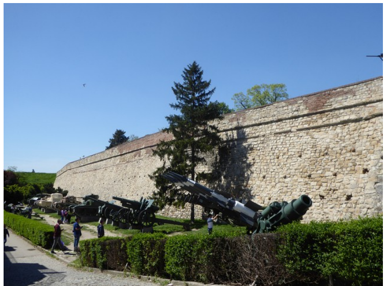
Her er det en utstilling av gamle kanoner.