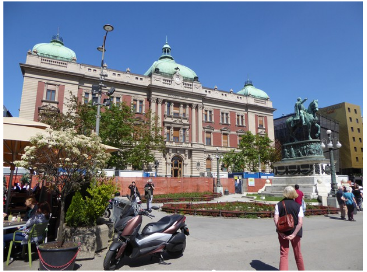
Nasjonalmuseet og statuen av Mihajlo.