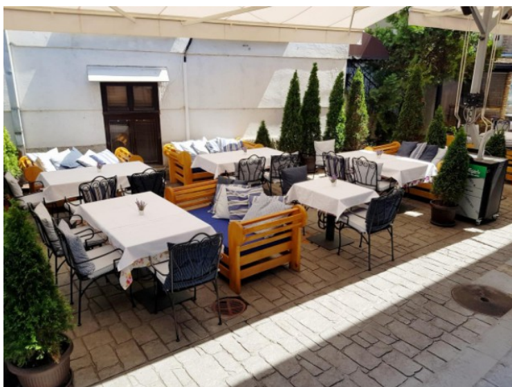
Det var også mulig å sitte ute og spise frokosten, men vi syntes det var litt for kaldt om morgenen enda. Det er sikkert fint om sommeren.