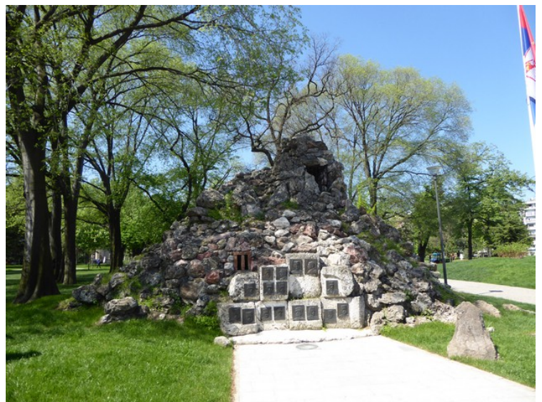
Dette er et minnesmerke fra første verdenskrig. Det skal forestille observasjonsposten til overkommandoen i den Serbiske hær. Den lå da på toppen av fjellet Kajmakčalan . Minnesmerket er satt opp i Pionerparken , hvor både Det Nye og Det Gamle Slottet ligger.