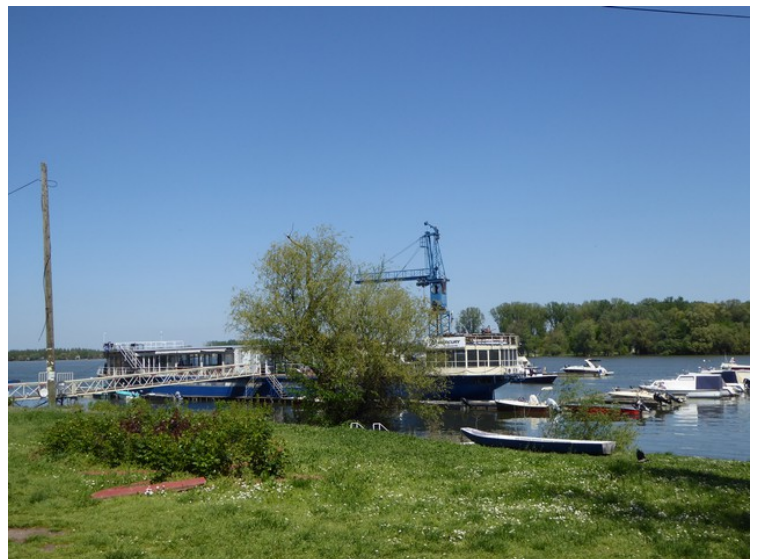
Det er et populært område. Her er en restaurantbåt.