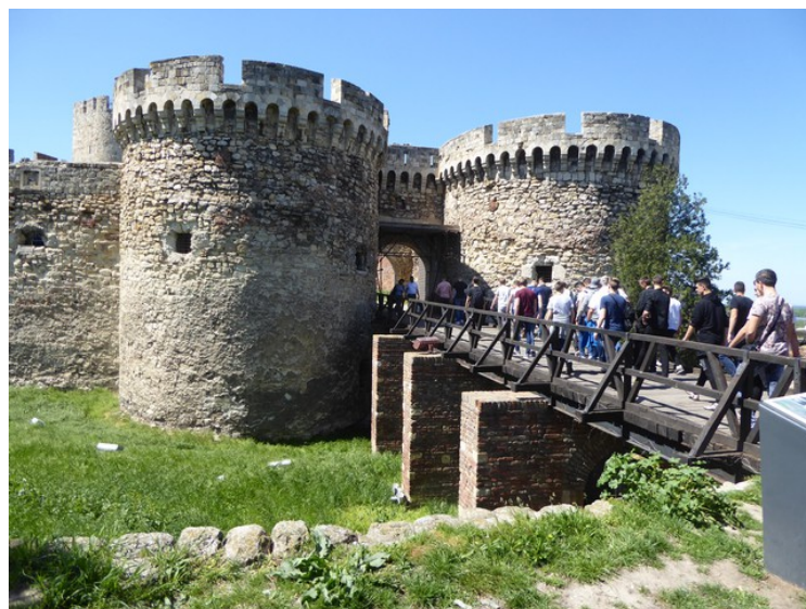
Zindan-porten . Det er rom inne i tårnene, og kjellerrommene brukte tyrkerne som fengsel. Zindan betyr fengsel på tyrkisk.