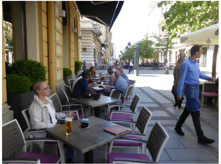
Vi har dårlige rygger, så da vi hadde kommet så langt, så syntes vi at vi hadde fortjent et glass vin og en øl. Det er restauranter i de fleste sidegatene til gågata.