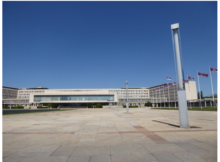
Det ble ikke plass til hele bygget på ett bilde.