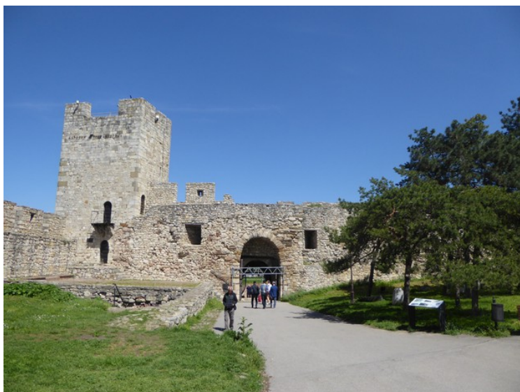
Så er vi på vei ut av festningen. Dette er despotens port og det castellanske tårn . Dette var hovedinngangen i middelalderen sammen med Zindan-porten.