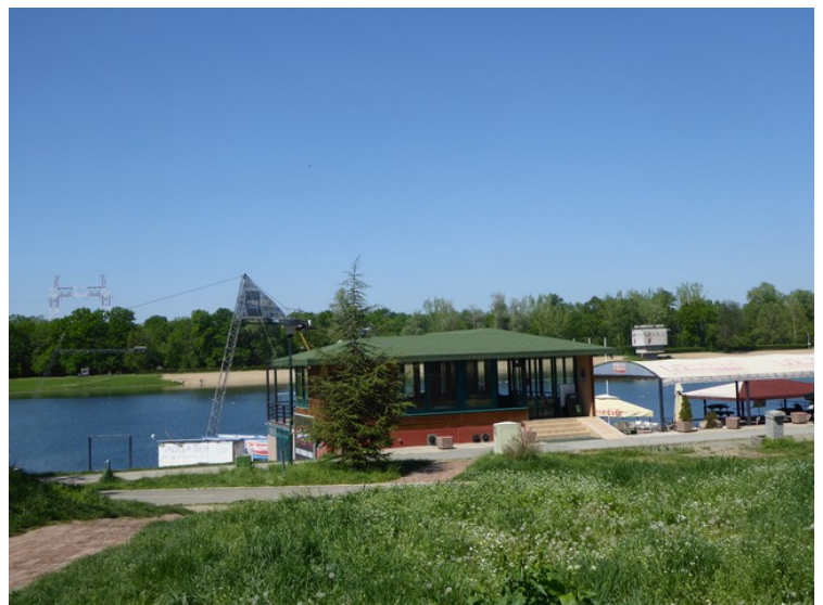
En av restaurantene ved sjøen. Det er laget kunstige strender og området er veldig populært med 100 000 besøkende hver dag om sommeren.