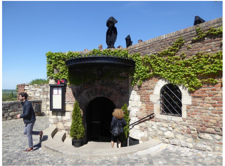
På veien ut gikk vi forbi Kalemegdanska Terasa , en restaurant med god utsikt over nedre delene av festningen og over Donau.