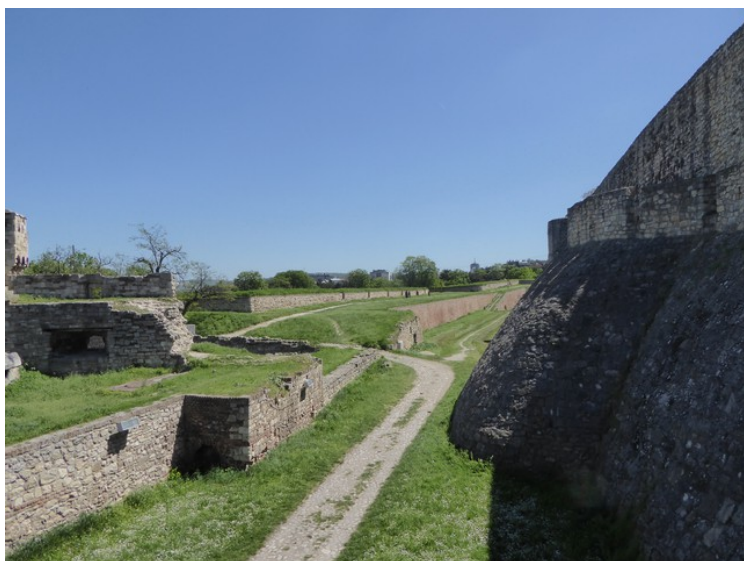
Område mellom murene.