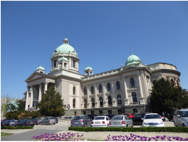
Tvers overfor Det Gamle og Det Nye Slottet holder Serbias Nasjonalforsamling til. Bygningen var ferdig i 1936.