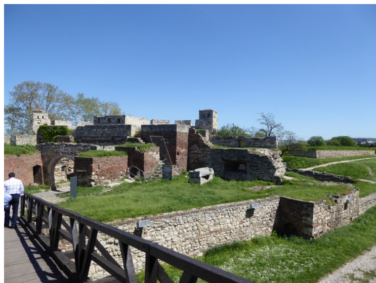
Ruiner mellom murene.