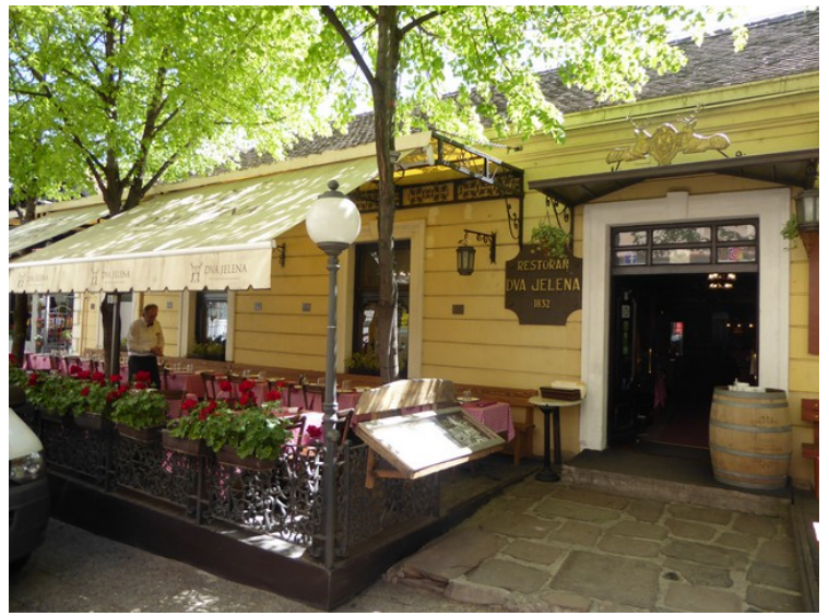
Neste dag gikk vi gjennom byen. Det var mange restauranter i gata hvor vi bodde. Dette er Dva Jelena . Det er en av de eldste i byen og har vært besøkt av mange kjente personer.