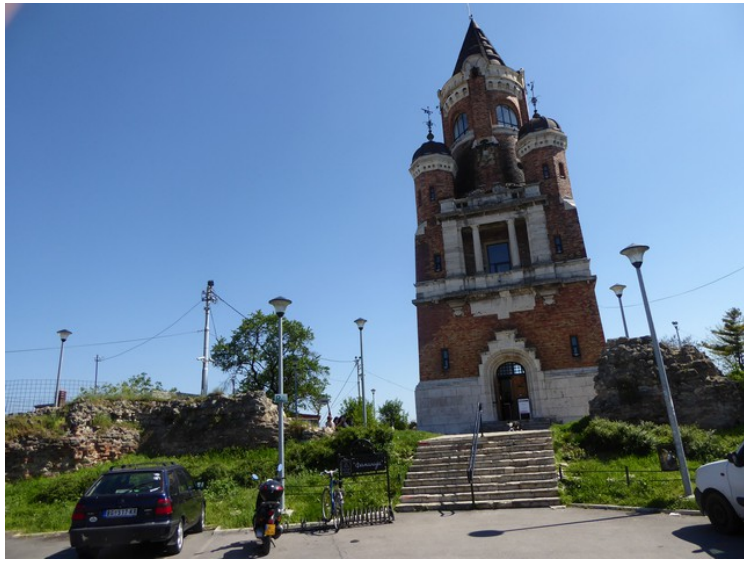
På en høyde i bydelen ligger tusenårstårnet, Millennium Tower eller Gardoš Tower . Det ble bygget i 1896 for å minnes 1000 år med ungarsk bosetting på den pannoniske slette .