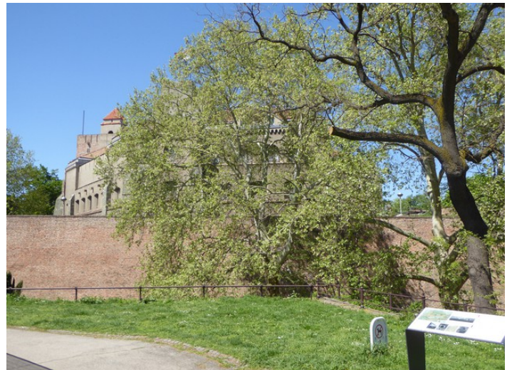
Så kommer vi til festningen. Den har hatt stor strategisk betydning i mer enn 2000 år, der den ligger på neset hvor elvene Sava og Donau møtes.