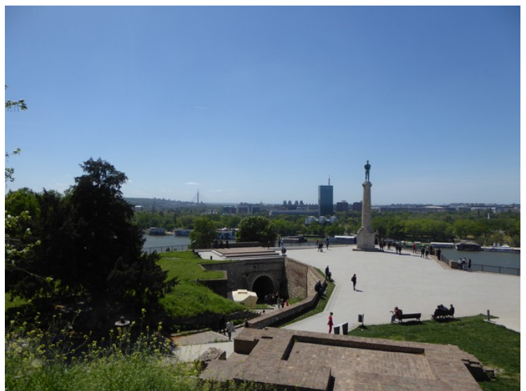
Helt i vest på festningsområdet ser vi på litt avstand den 14m høye statuen Pobednik (Seierherren). Den skulle ha vært oppført i 1912 som symbol på frigjøringen av Serbia og Kosovo fra tyrkerne, men den ble ikke reist før i 1928.