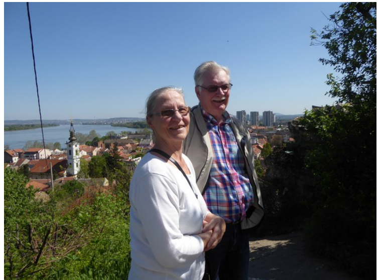
Et bilde av oss.