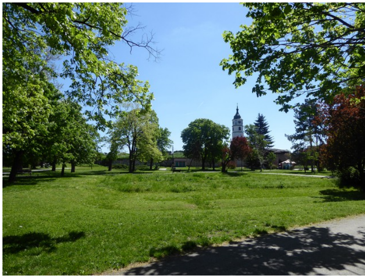
Klokketårnet sett på avstand.

Dette er en statue for å minnes despoten Stefan Lazarević