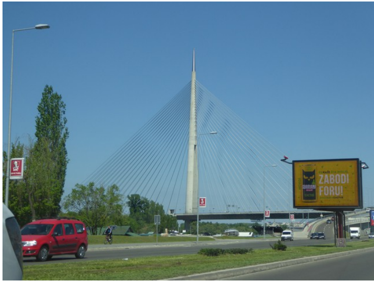
Dette er bærekonstruksjonen til den nyeste brua over Sava, Ada Bridge . Høyden er 200m.