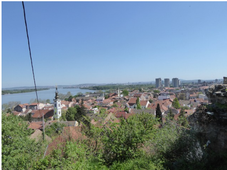
Utsikt videre nedover Donau.