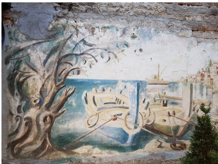
Etter at vi hadde spist frokost den siste dagen, så gikk vi en liten tur nedover gata vi bodde i, men først tok jeg et bilde av et veggmaleri ute på hotellet.