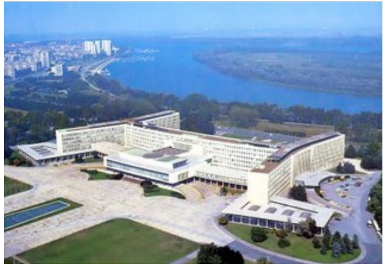
Vi kjørte forbi denne svære bygningen. Det var regjeringsbygningen i forhenværende Jugoslavia. Nå brukes den av regjeringen i Serbia og kalles Palace of Serbia .