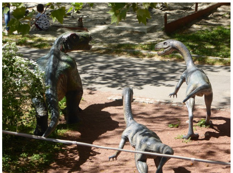
Innenfor porten er det laget en dinosaurpark med mange forskjellige dinosaur-arter. I parken var det også lyder som skulle tilsvare lyder fra dinosaurerne.