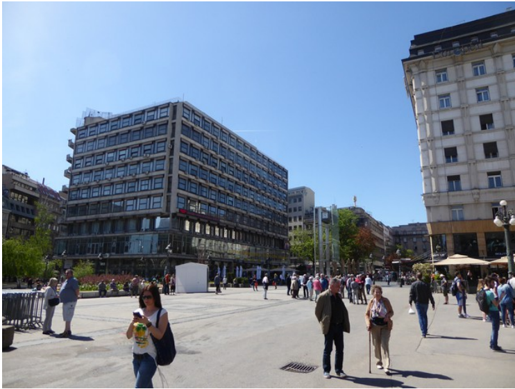
Republikkplassen _ Trg republike