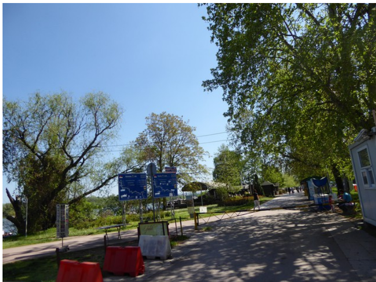
Her er vi ved bredden av Donau i bydelen som heter Zemun .