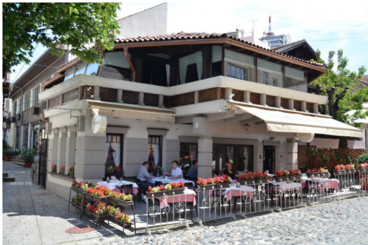
Hotellet sett utenfra. Inngangen er bak til venstre. Ut mot gata ligger restauranten som heter Mali Vrabac . Vi spiste middag her hver dag.