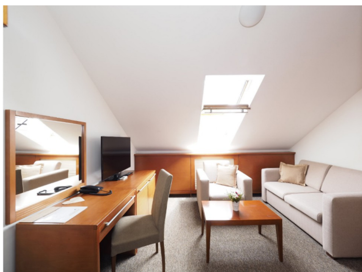
Rommet vårt så slik ut. Vi hadde bestilt en Junior Suite. Den var ganske stor med soverom en etasje opp.