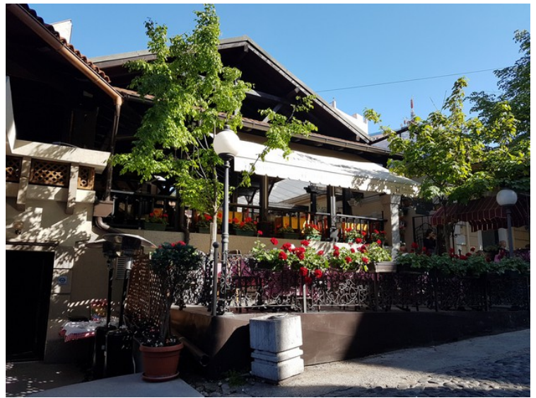
Dette er naborestauranten Dva Jelena.