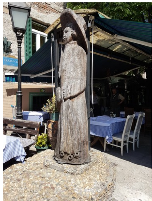
Retten nede i gata står denne statuen.