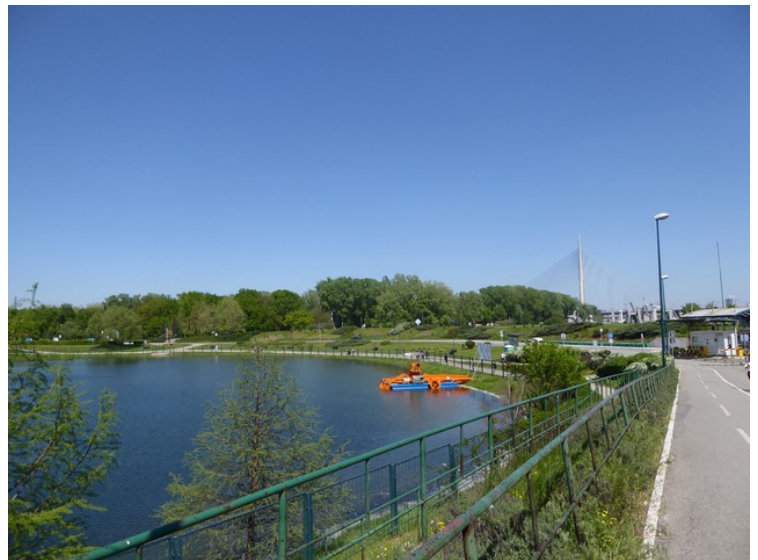
Dette er nordre enden av Savasjøen. Sjøen ble laget ved å lage tre veifyllinger mellom øya som lå midt i elven Sava og fastlandet.