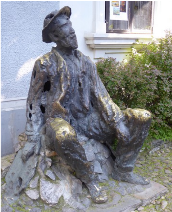
En statue rett utenfor hotellet vårt av Djura Jakšić (1832-1878), en serbisk kunstner og forfatter.