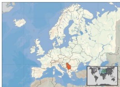
Serbias plassering i Europa