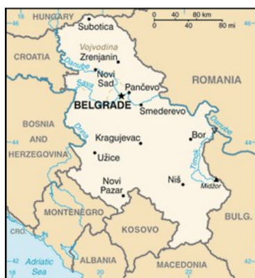
Beograds plassering i Serbia