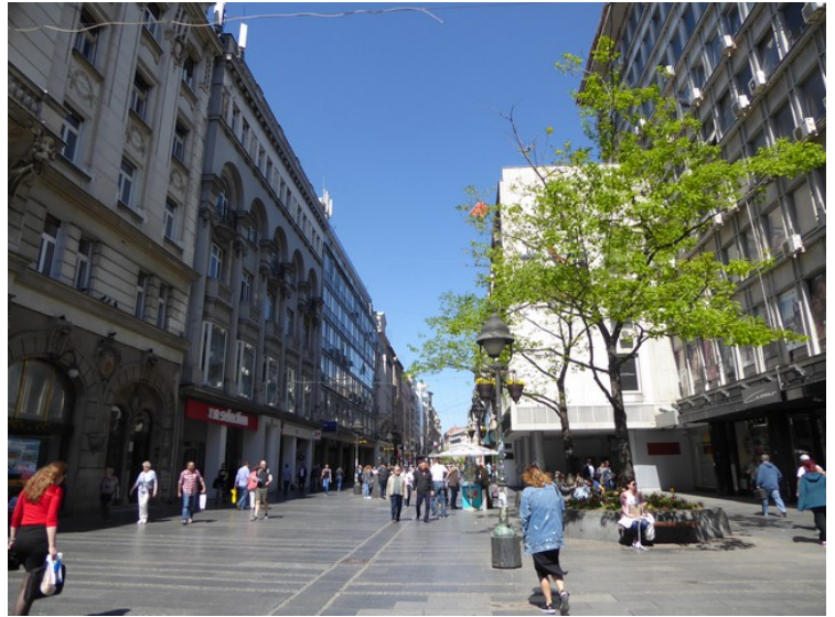
Trg republike ligger i tilknytning til den en kilometer lange gågata som heter Kneza Mihailova .