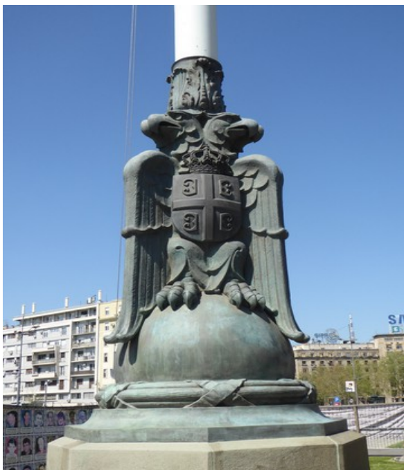
Foten på flaggstengene utenfor Nasjonalforsamlingen har deler av Serbias riksvåpen.