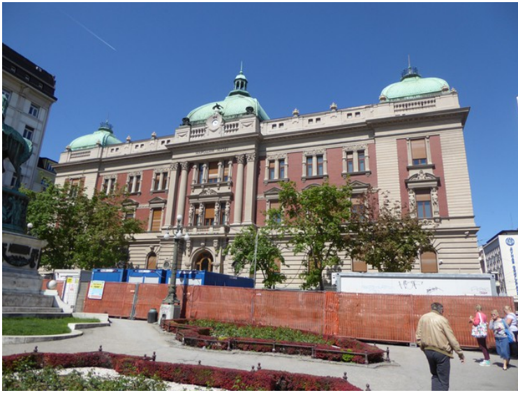
Ved Republikklassen står Nasjonalmuseet for Serbia . Det er det eldste og største museet i forhenværende Jugoslavia.