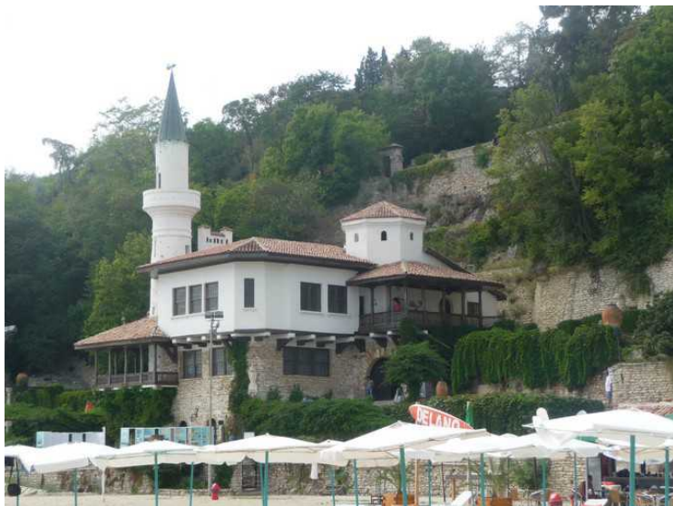
Dette er dronning Maria av Romania sitt sommerhus. Det ble bygget i tidsrommet 1926-37.