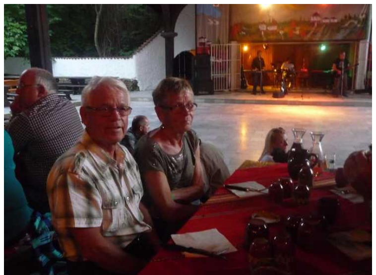
Her har vi funnet et bord. Det var to par som allerede hadde satt seg ved bordet.