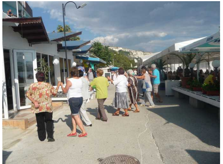
Full fest med musikk og dans.