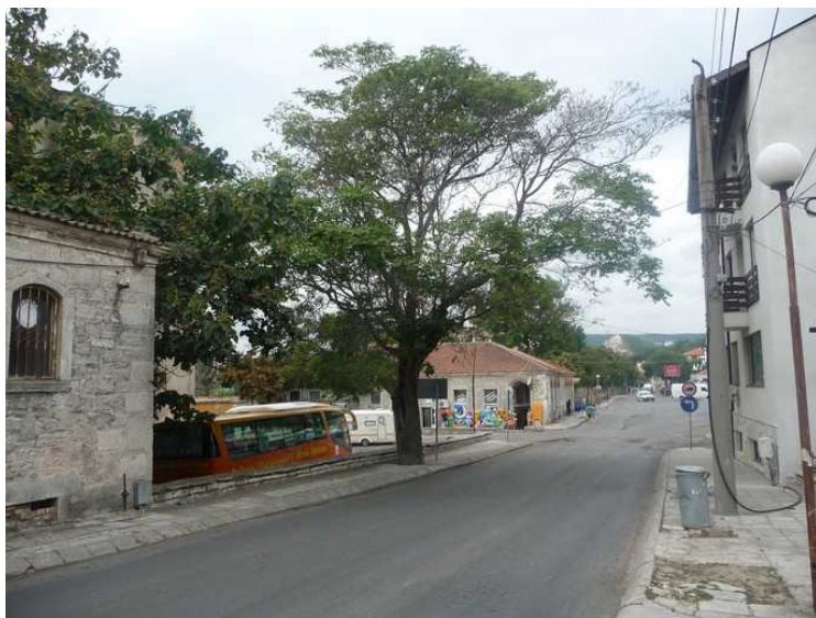
Vi er på vei mot et av de andre hotellene som Ving bruker i Balchik. Her ser vi tilbake i retning mot sentrum.