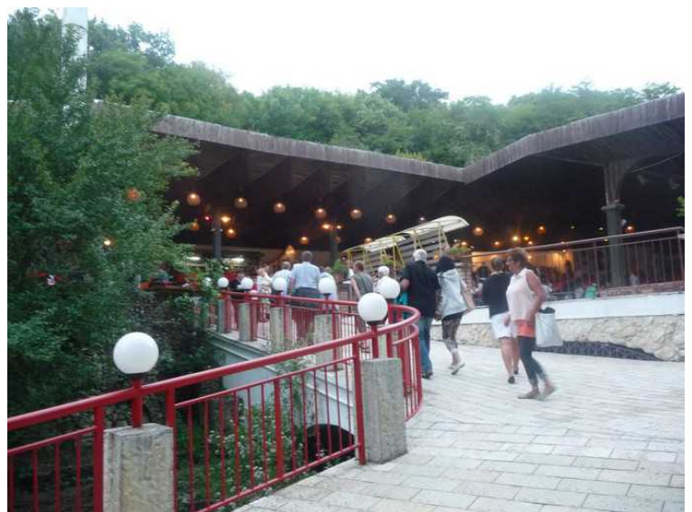
Her er en stor sal som er åpen ut til ene siden.