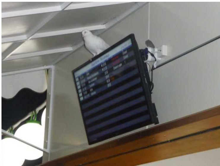
En due som sitter på skjermen i kafeen på flyplassen.