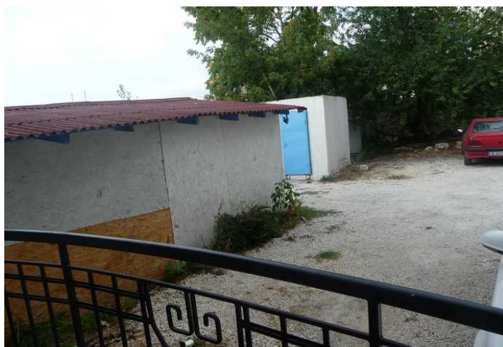
Utenfor rommet på hotellet så det slik ut.