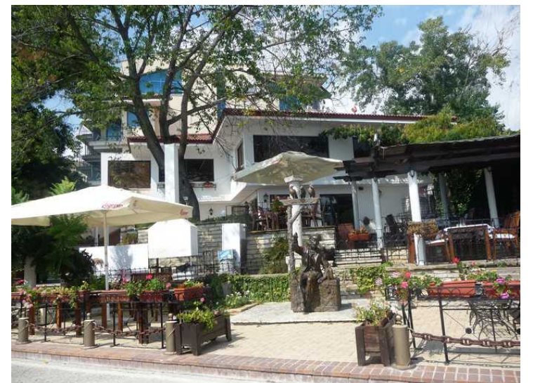
En annen dag gikk vi bortover langs strandpromenaden og videre langs stranden. Det er noen fine hus bortover her.