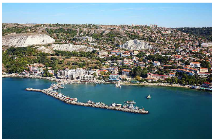
Luftfoto fra Balchik.