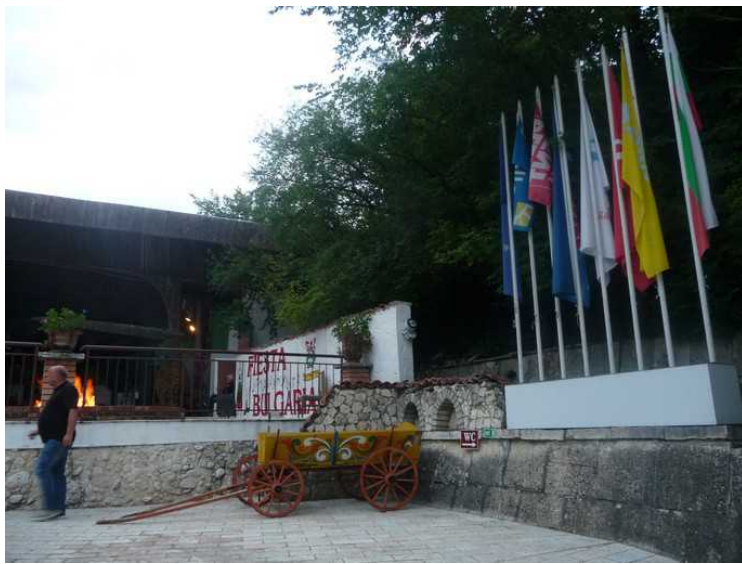
Flagg fra mange nasjonaliteter.