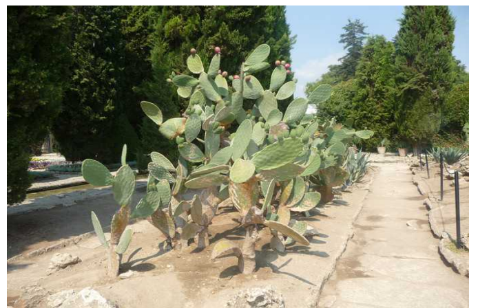
Her finnes den nest største kaktus-samling i Europa. Bare samlingen i Monaco er større.