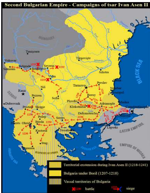
Bulgaria under dets største utstrekning.