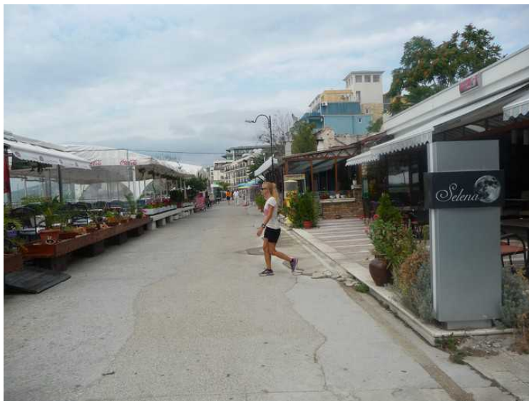
Slik ser det ut på strandpromenaden. Hotellet vårt til høyre.