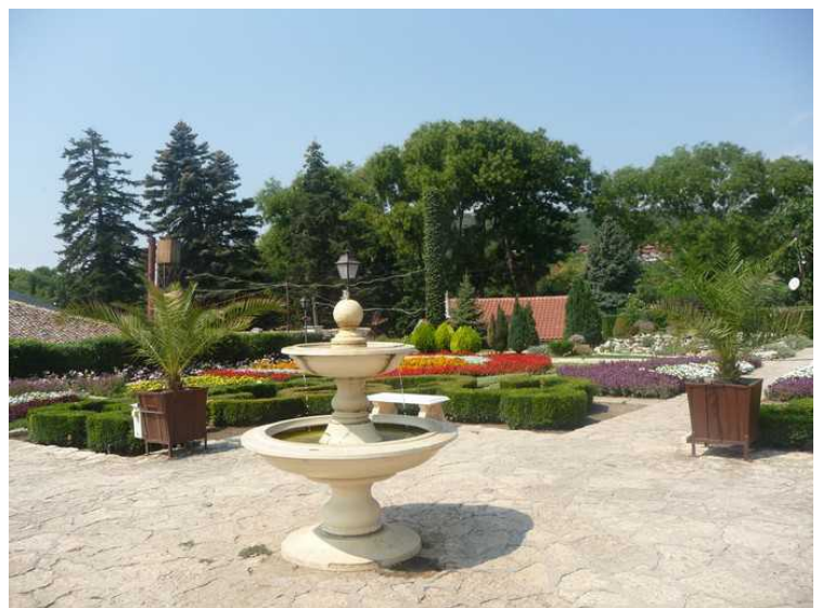
En dag tok vi taxi opp til den botaniske hagen. Den var fint anlagt med masse forskjellige planter. Nedenfor følger noen bilder derfra.