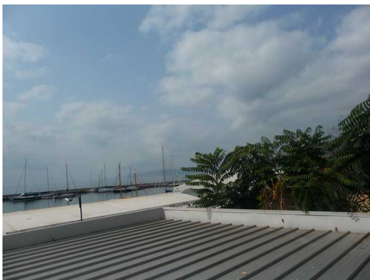
Vi syntes dette var så stusselig at vi klaget både til hotellet og Ving. Det resulterte i at vi fikk flytte til et annet rom der vi fikk utsikt mot havet. Både hotellverten og Ving var veldig hyggelige og fikk ordnet det på en grei måte.