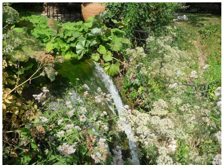
Den lille fossen som vi så nedenfra da vi kom.