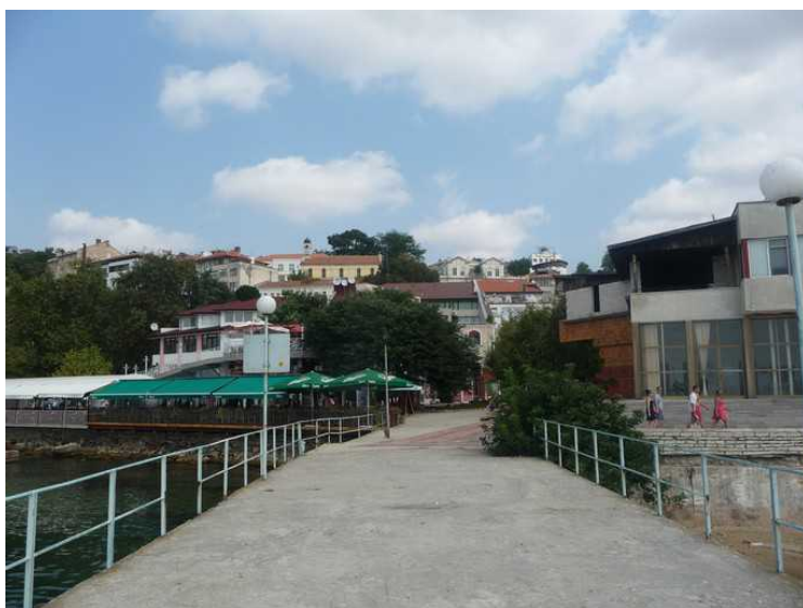
Her er vi ute på piren og ser innover.