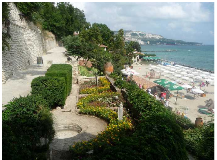
Det er fint beplantet her også. Stranden nedenfor.