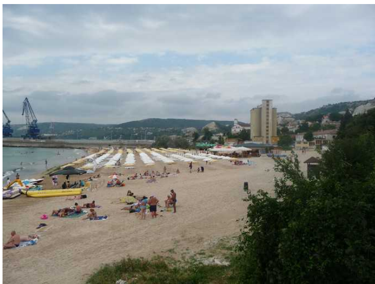
Stranden som ligger rett nedenfor hotellet.