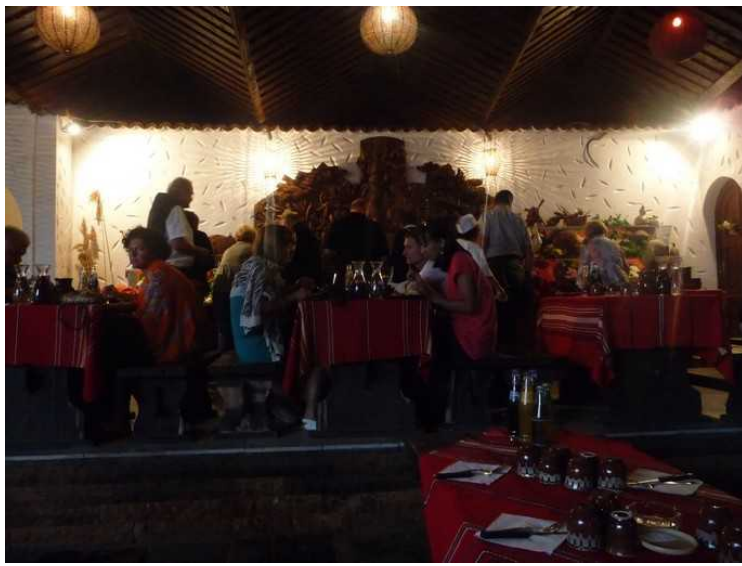
Det er selvbetjening av forretter og vin.