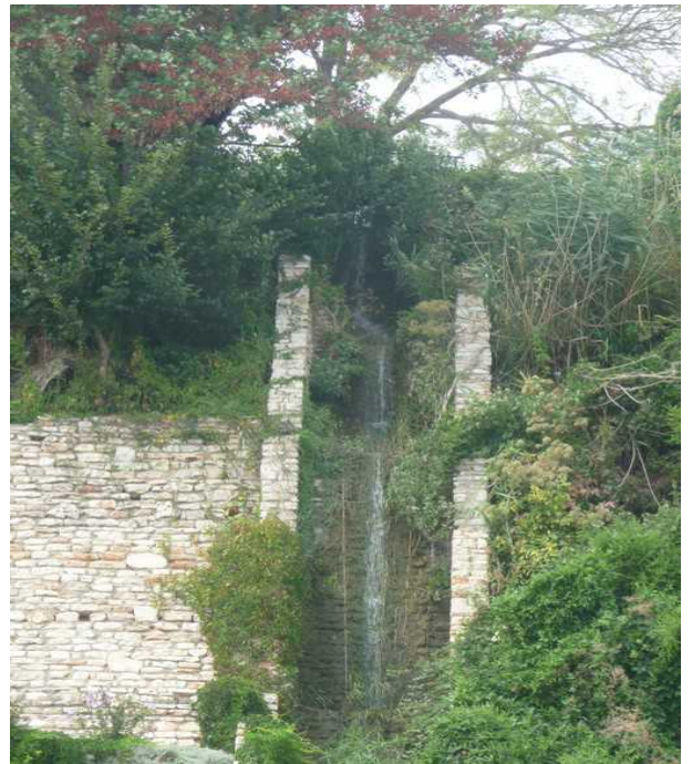
Dette er en liten foss som kommer fra bekken som renner gjennom den botaniske hagen.