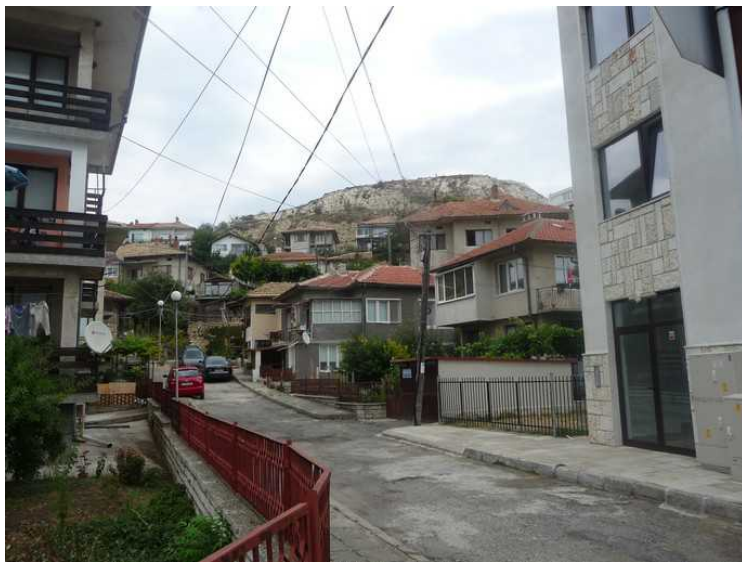
En av sidegatene borte i byen. Kalksteins-klipper i bakgrunnen.