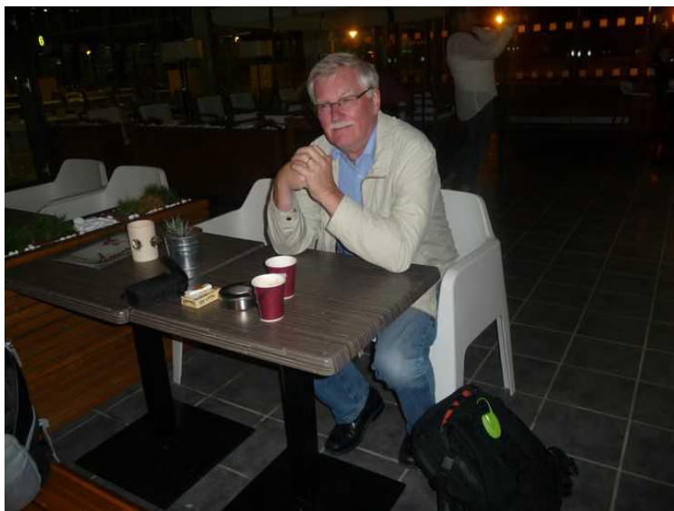
Vi hadde litt kaffe mens vi ventet. Flyplassen hadde åpnet ny avgangs-terminal noen dager før. Den var ganske bra med god plass.