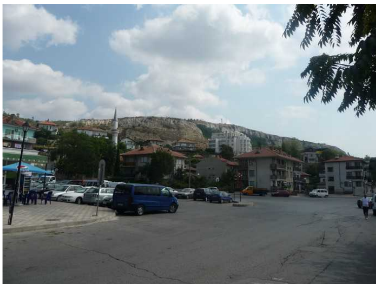
Dette er i sentrum av Balchik.