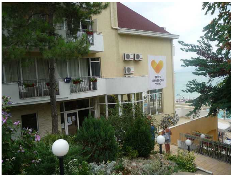
Hotellet heter Helios, og ligger rett ovenfor stranden. Vi likte hotellet vårt bedre.