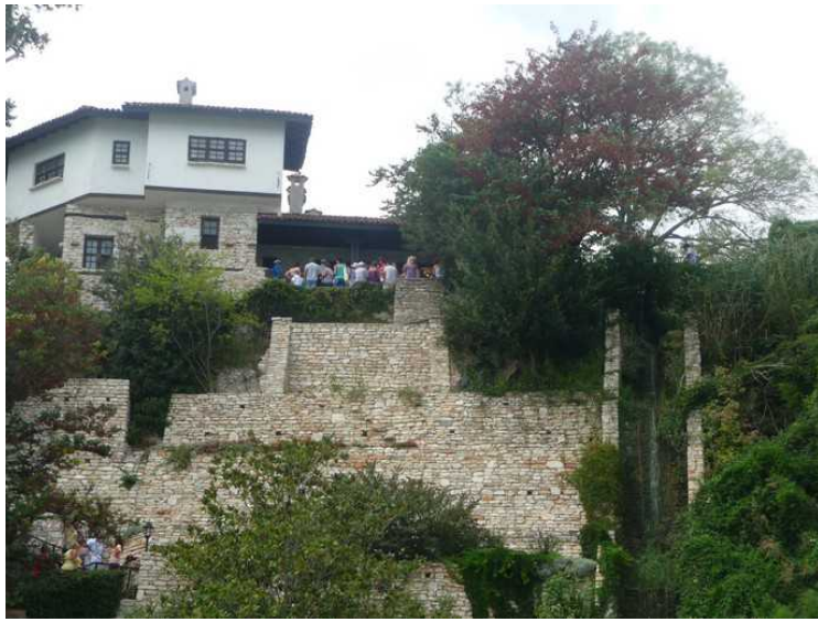
Enda et fint hus.