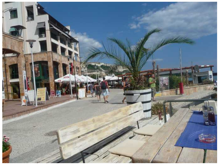
Utsikt bortover strandpromenaden.