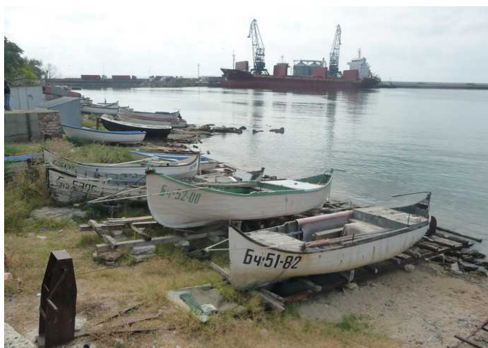
Det er mye fisk her, og disse båtene var i bruk hver dag. I bakgrunnen ser vi havnekranene som var i arbeid mesteparten av dagene med å losse og laste båter.