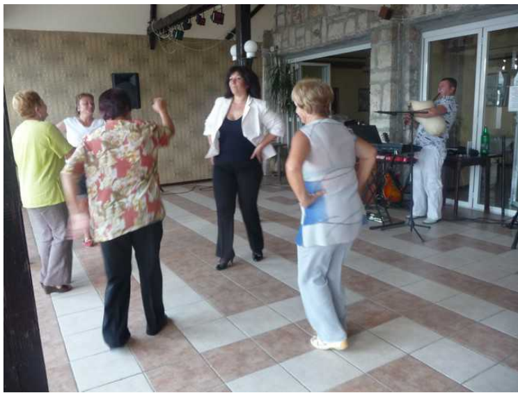
De var veldig ivrige.