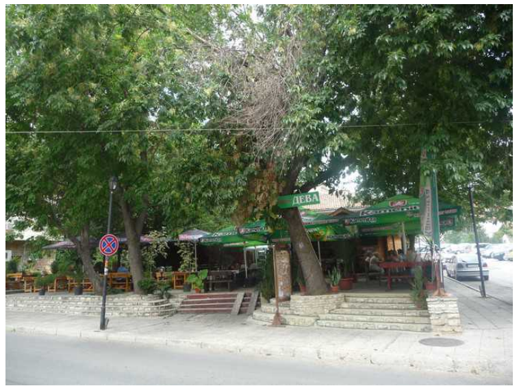
Her kom vi til den lokale restauranten.