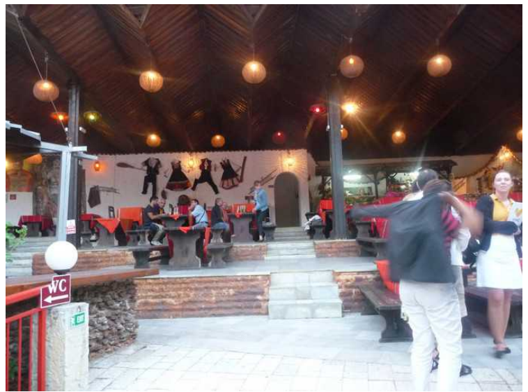
Det er bord og benker langs den ene veggen.