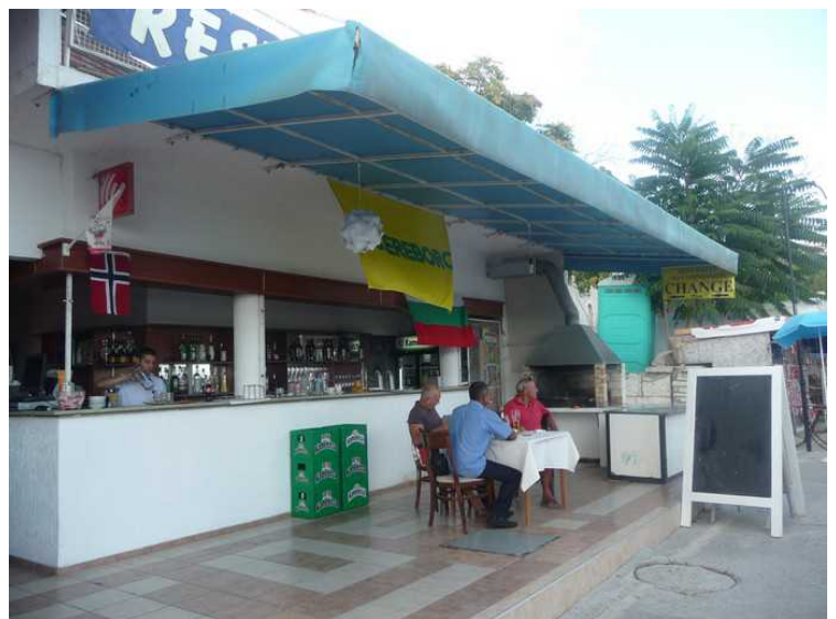
En restaurant med norsk flagg. Vi måtte ha et bilde av det.