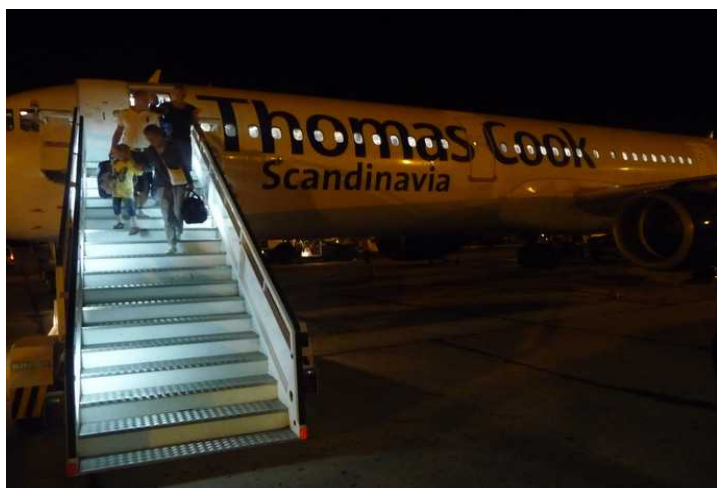
Her har vi gått ut av flyet.