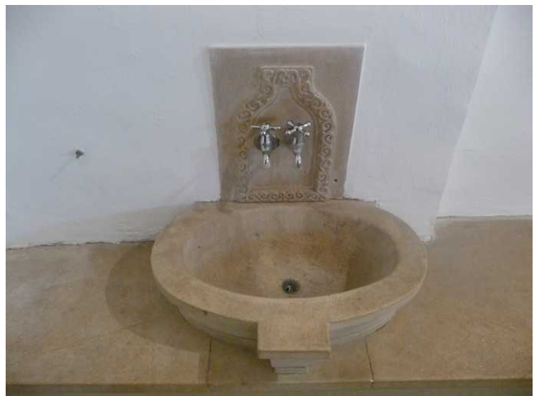
Dette er inne i sommerhuset, inne i badeværelset.