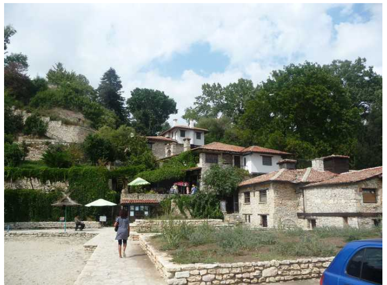
Inngangen til sommerhuset, og det er også en liten restaurant her.