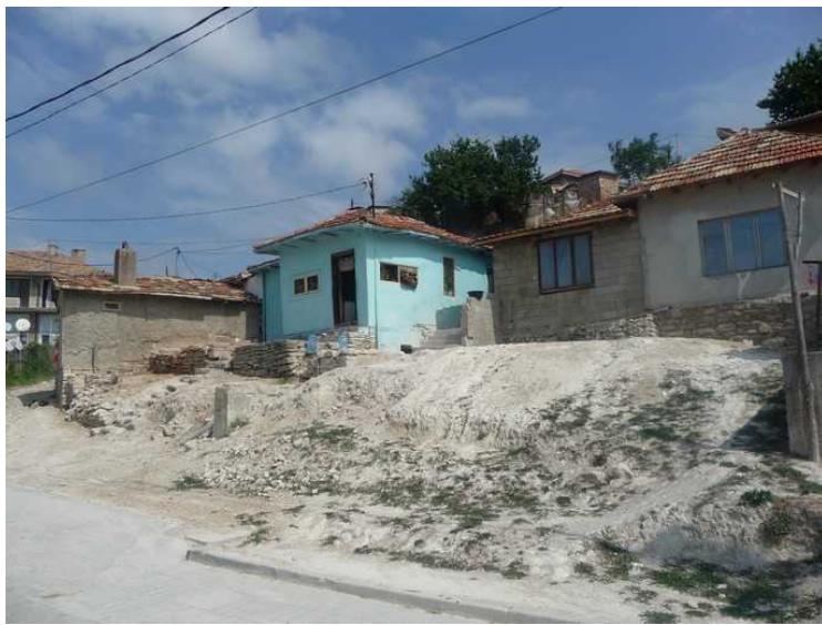
Dette er nesten tilbake til sentrum.