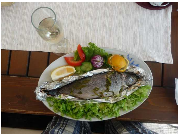
Jeg prøvde også fisken, og den var faktisk ganske god.