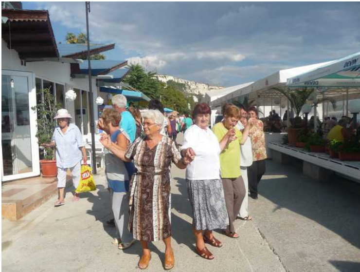
Denne dagen var det et par turistbusser på besøk her.