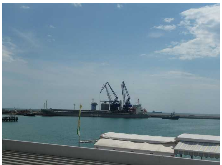
Tilbake på hotellet, så kan vi konstatere at havnekranene fremdeles holder på å losse båen som ligger til kai.