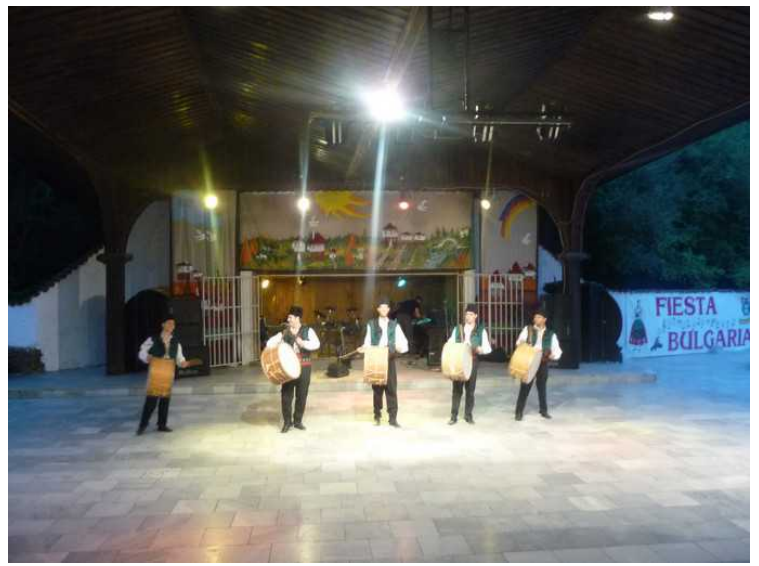
Forestillingen har startet.