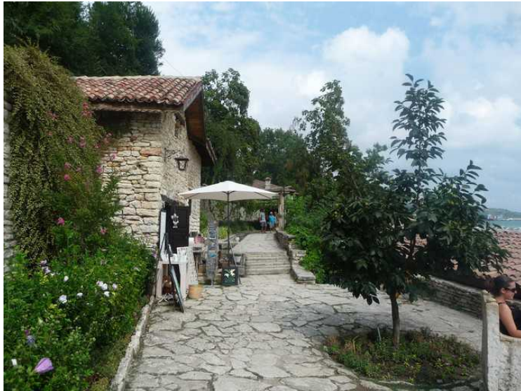
Det er murt og anlagt steinsatte veier oppover skråningen.