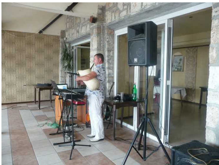
Her er sekkepipa kommet frem.