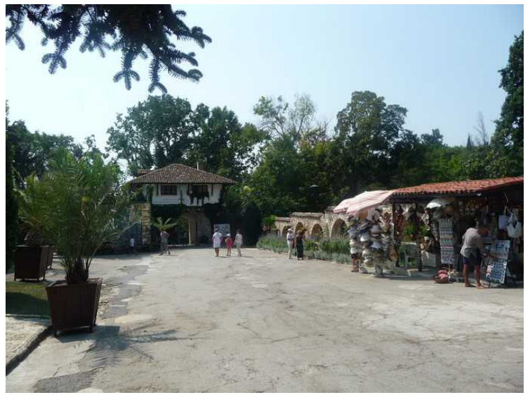
Ved den øvre inngangen til hagen er et en lang shopping-gate.