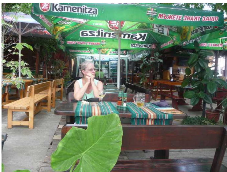
Vi var varme og svette etter å ha gått i bakkene, så det gjorde godt med noe kaldt å drikke under trærne på restauranten.