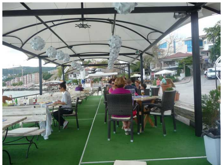
Videre innover restaurantpaviljongen.