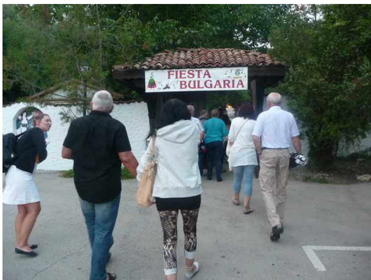
En kveld ble vi med på bulgarsk aften. Her er vi på vei inn porten.