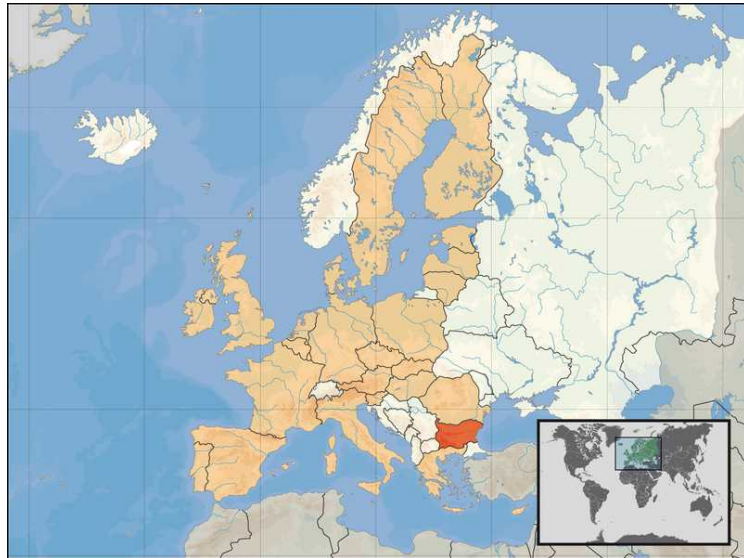
Kart som viser hvor Bulgaria ligger.