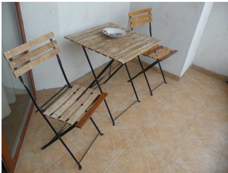
Terrasse-møblementet var heller ikke noe å skryte av.