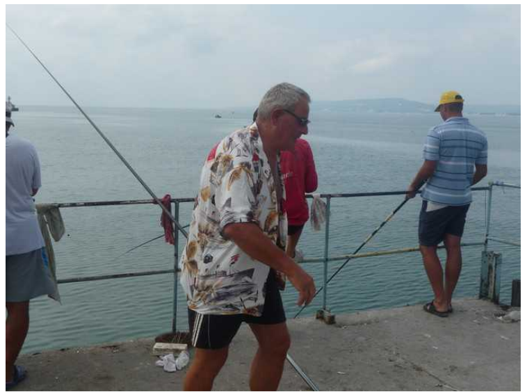
Ytterst på piren står det en hel gjeng og fisker. De står her hver dag, og de får også en god del fisk.