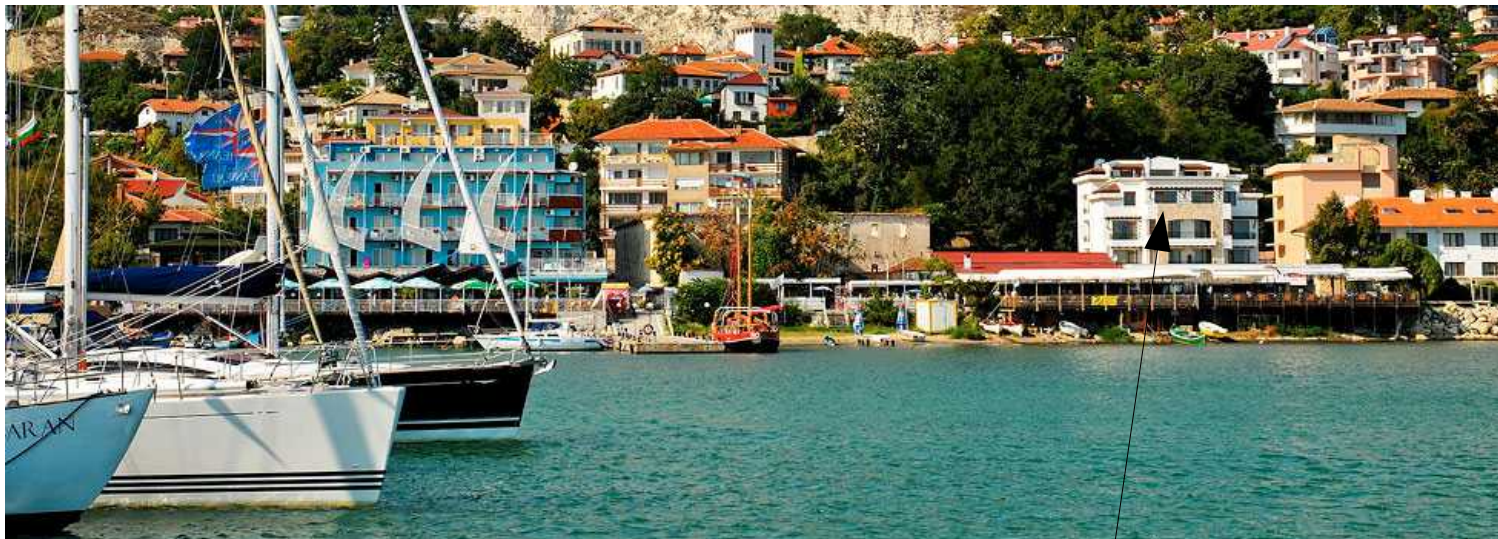
Bilde fra strandpromenaden. Hotel Selena ligger her.

Byen var hovedstad en kort periode i det 14. århundre.