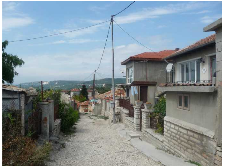
Her har vi kommet ganske høyt opp.