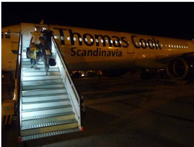
Så kunne vi gå ombord i flyet.