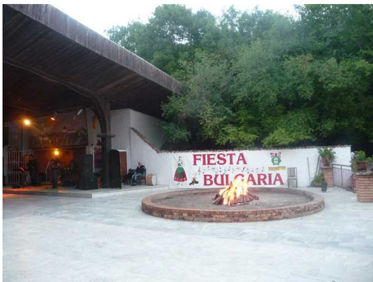
Ved siden av scenen er det tent en ild.