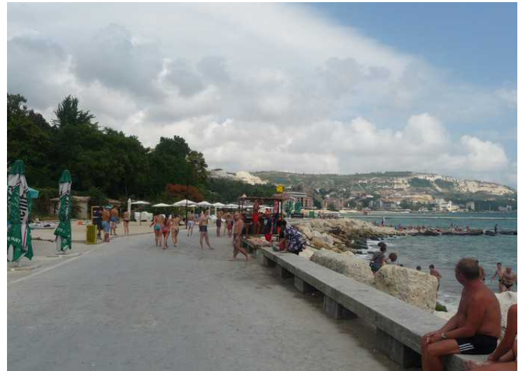
Det var mye folk på den lille stranden.