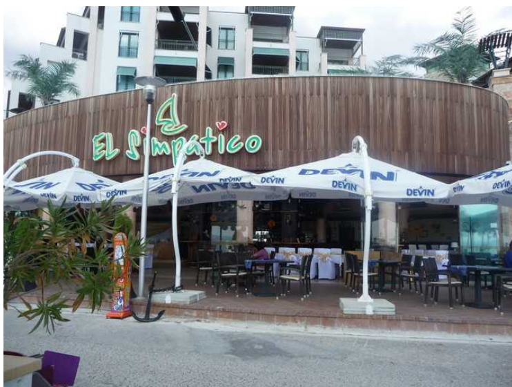
Vi måtte prøve maten på andre restauranter også. Her er vi på El Simpatico, lenger borte på strandpromenaden.