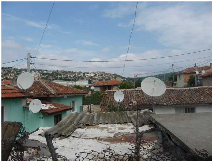
Boforholdene her opp var ganske enkle, men det manglet ikke på parabolantenner.