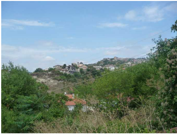
En annen dag gikk vi oppover i høyden overfor byen. Det var ganske mye bebyggelse oppover.