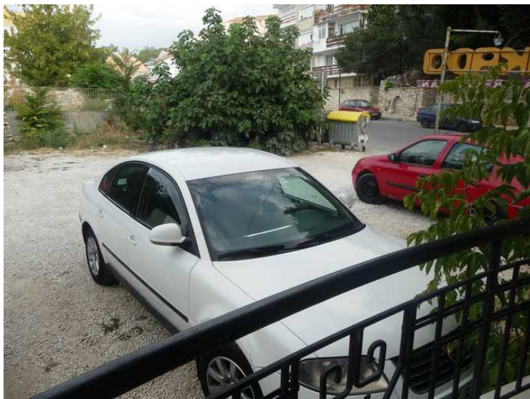
Det er parkeringsplass med hovedgate utenfor.