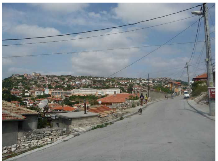
På vei nedover igjen.