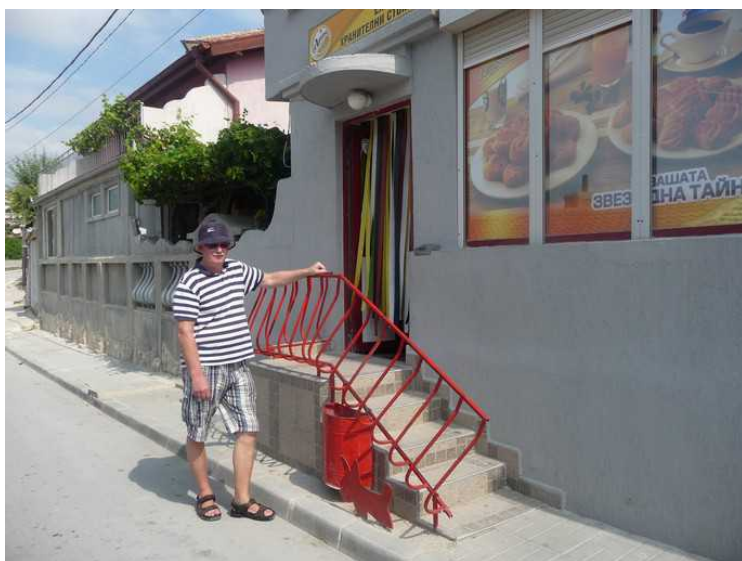
Her er vi kommet til det lokale brød- og kakeutsalget.