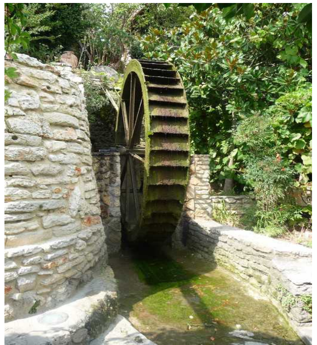
Et vasshjul etter kverna som en gang sto her før sommerhuset ble bygget.