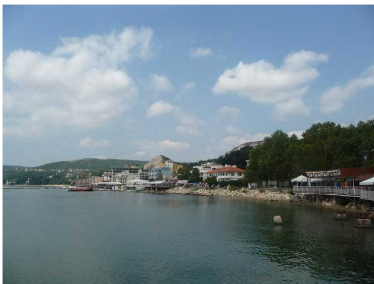
Her har vi gått bortover mot sentrum og ser tilbake mot hotellet der vi bor.