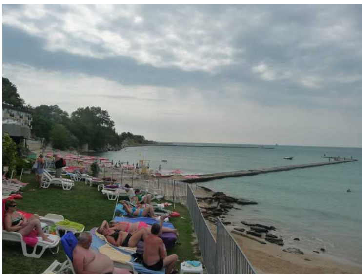
Ser vi andre veien, så ser det slik ut.