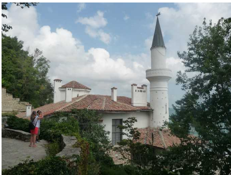
Sommerhuset sett fra baksiden.