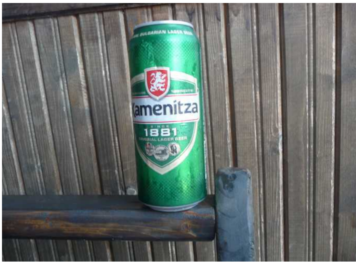
Det ble varmt å gå i sola, så da vi avsluttet, og gikk ut igjen samme veien som vi kom inn, måtte jeg ha en kald pils. Den lokale ølsorten heter Kamenitza. Etterpå tok vi en taxi tilbake til byen.