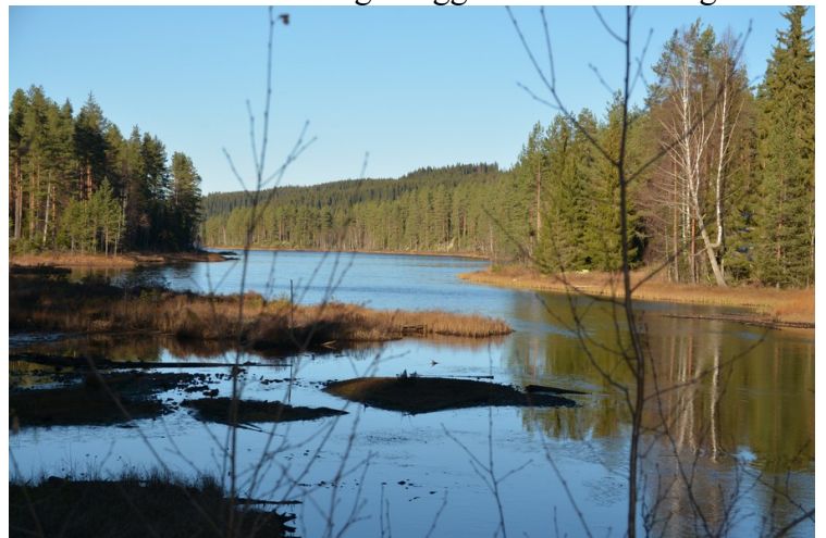
Denne sjøen heter Helgen.