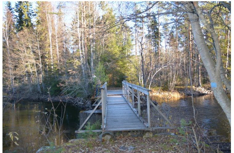
I søndre ende av Helgen ligger denne demningen.