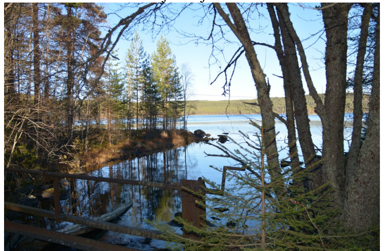
Demning i Kjerkesjøen.