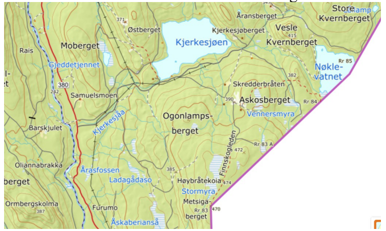
Plasseringen av Askosberget.