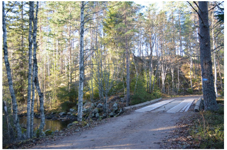
Fv380 krysser Rotna syd for Svullrya.