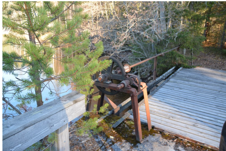
Regulering av damslusen.