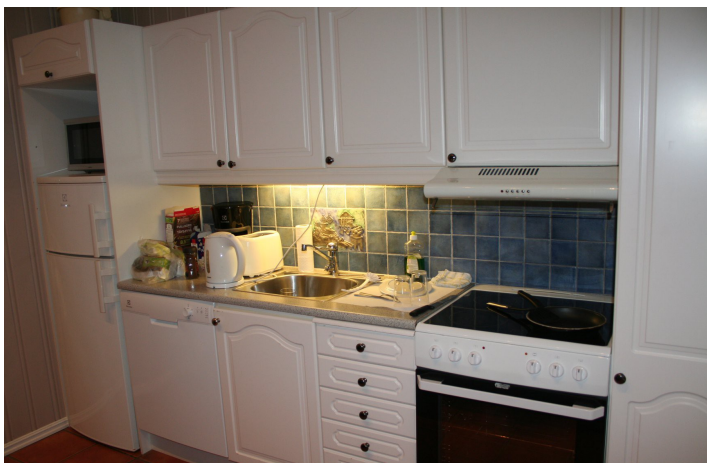
Kjøkkenet i hytta.