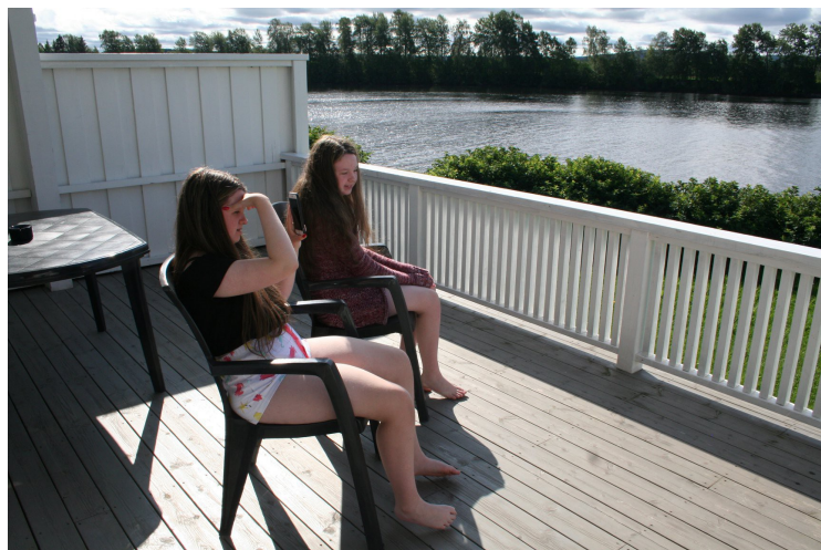
På terrassen. Utsikt over Glomma.