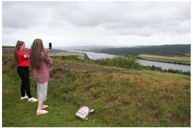
På festningen i Kongsvinger.