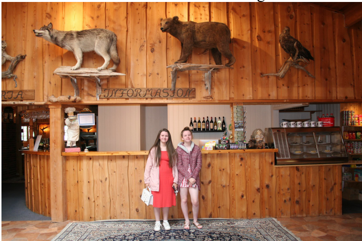
På Villmarksenteret i Skasenden.