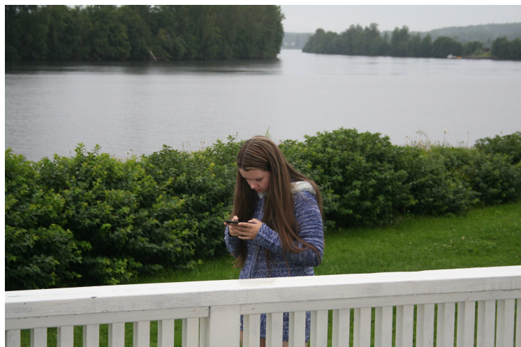
Utenfor terrassen på hytta.