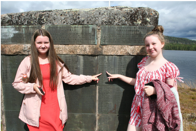
Denne steinen står rett innenfor grensen.