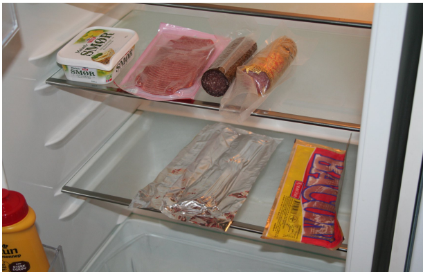
De kom så seint til hytta at vi hadde gjort klart litt nødproviant.