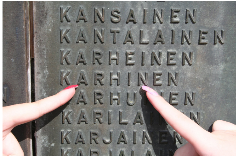
Avstamning fra Karhinen i Finland.