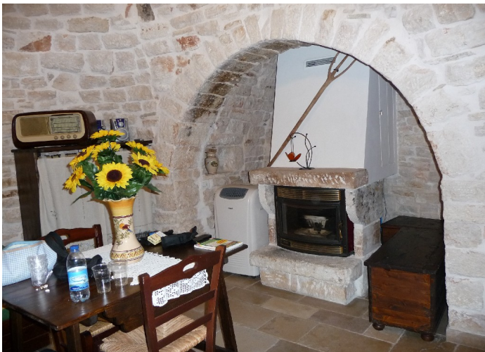
Her er stuedelen