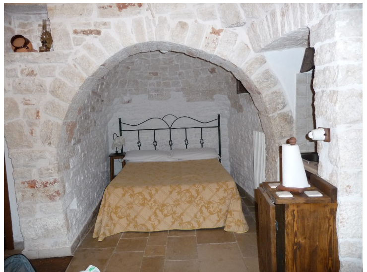
Det huset vi hadde fått var veldig fint inni med alle bekvemmeligheter. Her er soverommet.