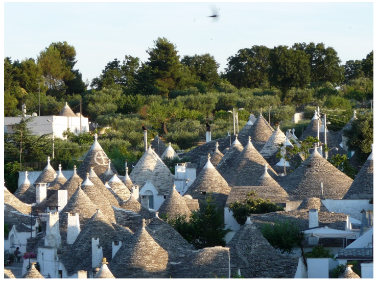
Her ser vi bortover mot takene av mange trullihus