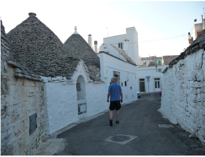
Her er vi på tur bortover i gata for å se oss litt rundt