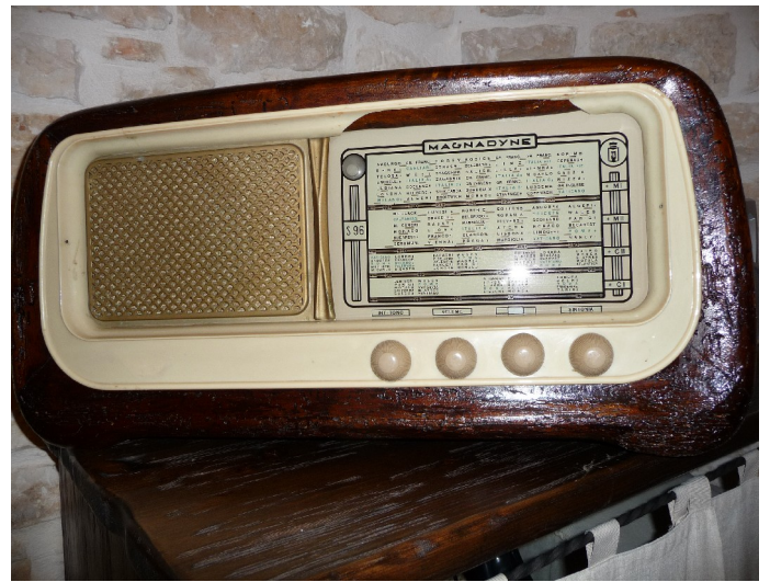
Det var også en «antikk» radio der. Det fantes også et moderne musikkapparat der. Det brukte vi, og vi hadde vår egen private danseften etter at vi hadde vært ute og spist om kvelden.