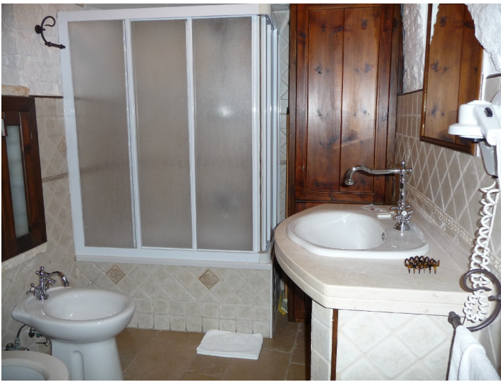
Det var bare badet som var adskilt i et eget rom