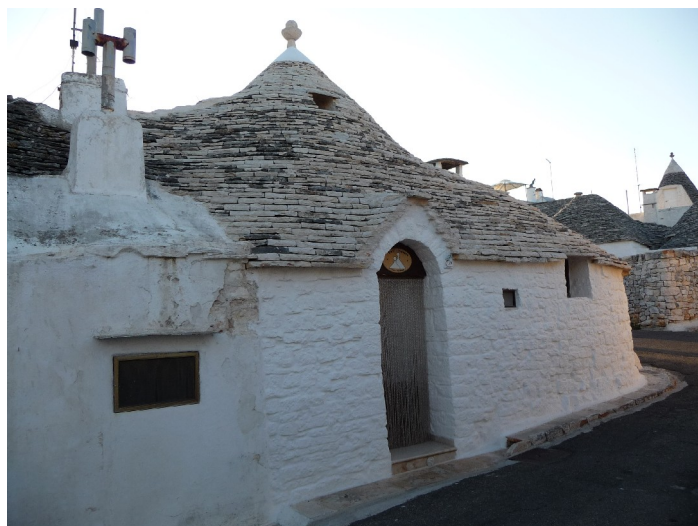
Dette er den trullien vi bodde i