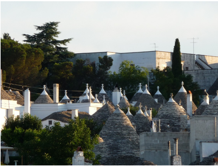
Her er det flere hus