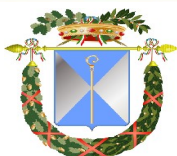
Våpenet til Bari

Trulli har vegger som er vertikale nederst, med en øvre del og tak som er kjegleformet. Veggene er tykke, halvannen til nesten to meter, noe som bidrar til å holde varmen ute om sommeren og inne om vinteren. Trulli har som regel ett rom.