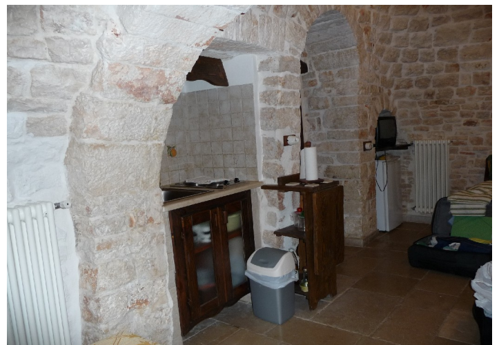
Her er kjøkkenet. Alt var i samme rommet