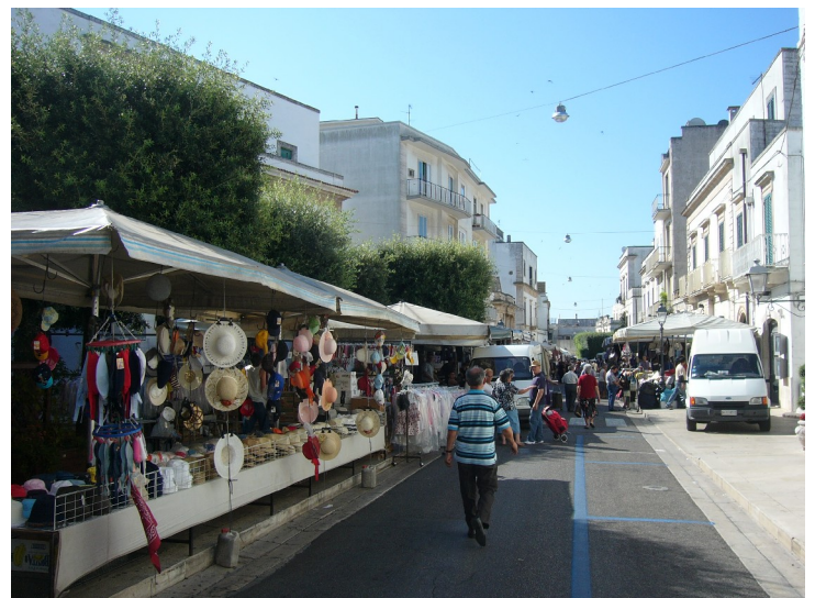
Her kan vi sitte og se nedover gata hvor det var marked denne dagen.