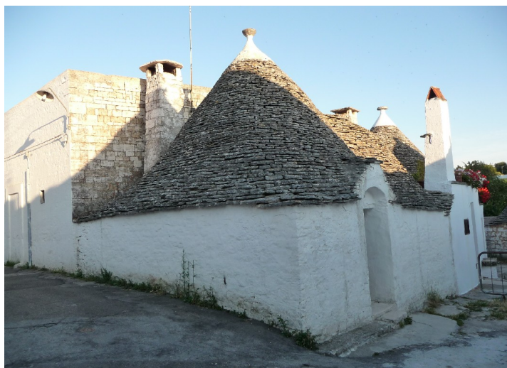
Dette er trullien ved siden av