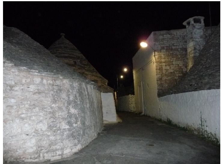
Her er et kveldsbilde fra gata rett utenfor huset «vårt»